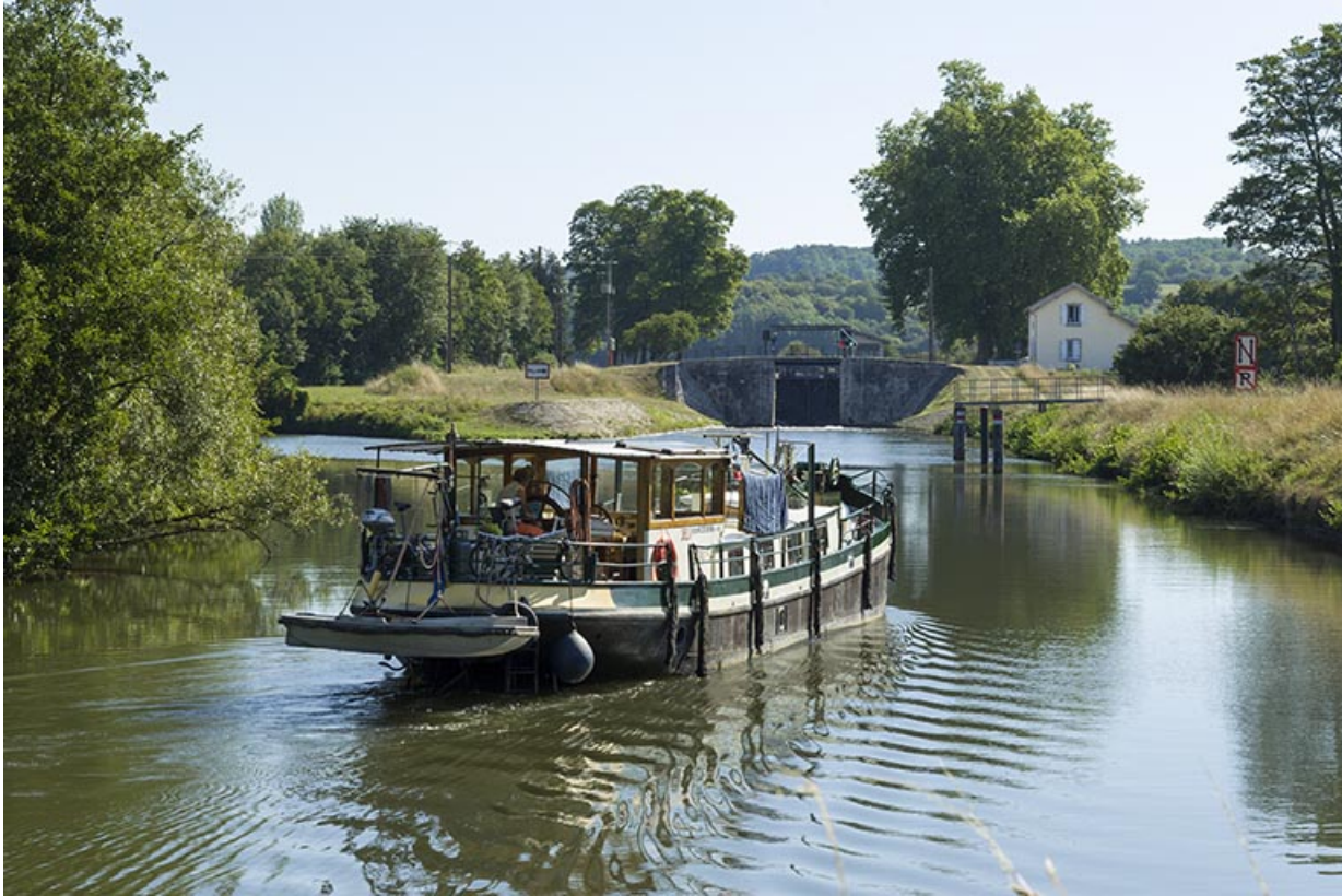
Bâteau en aval du bief.