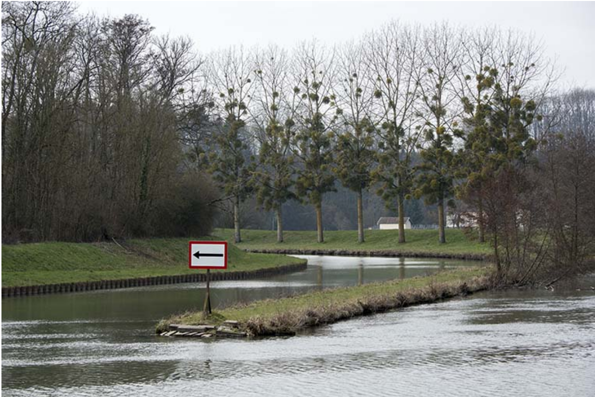
Entrée du canal de navigation d'Ormoy.