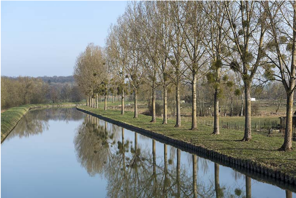
Le canal, vue vers l'amont.