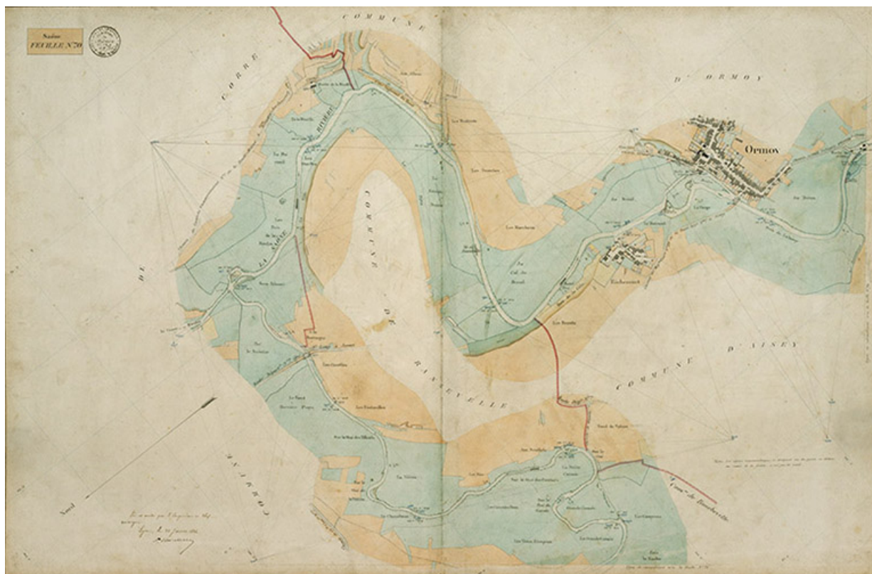
Saône - feuille n°70.