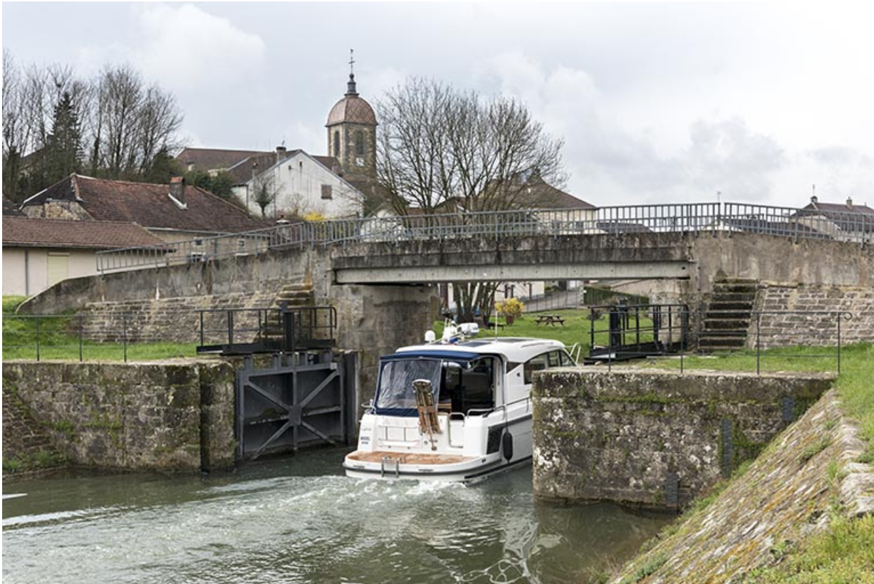
La porte de garde et le village en arrière plan. 70, Ormoy