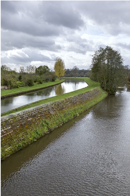
La dérivation construite latéralement à la rivière.