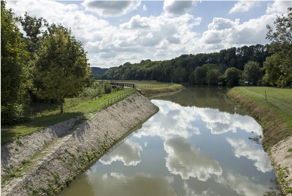
Vue aval depuis l'écluse n°46 du canal des Vosges et la Saône en arrière-plan. 70, Ormoy