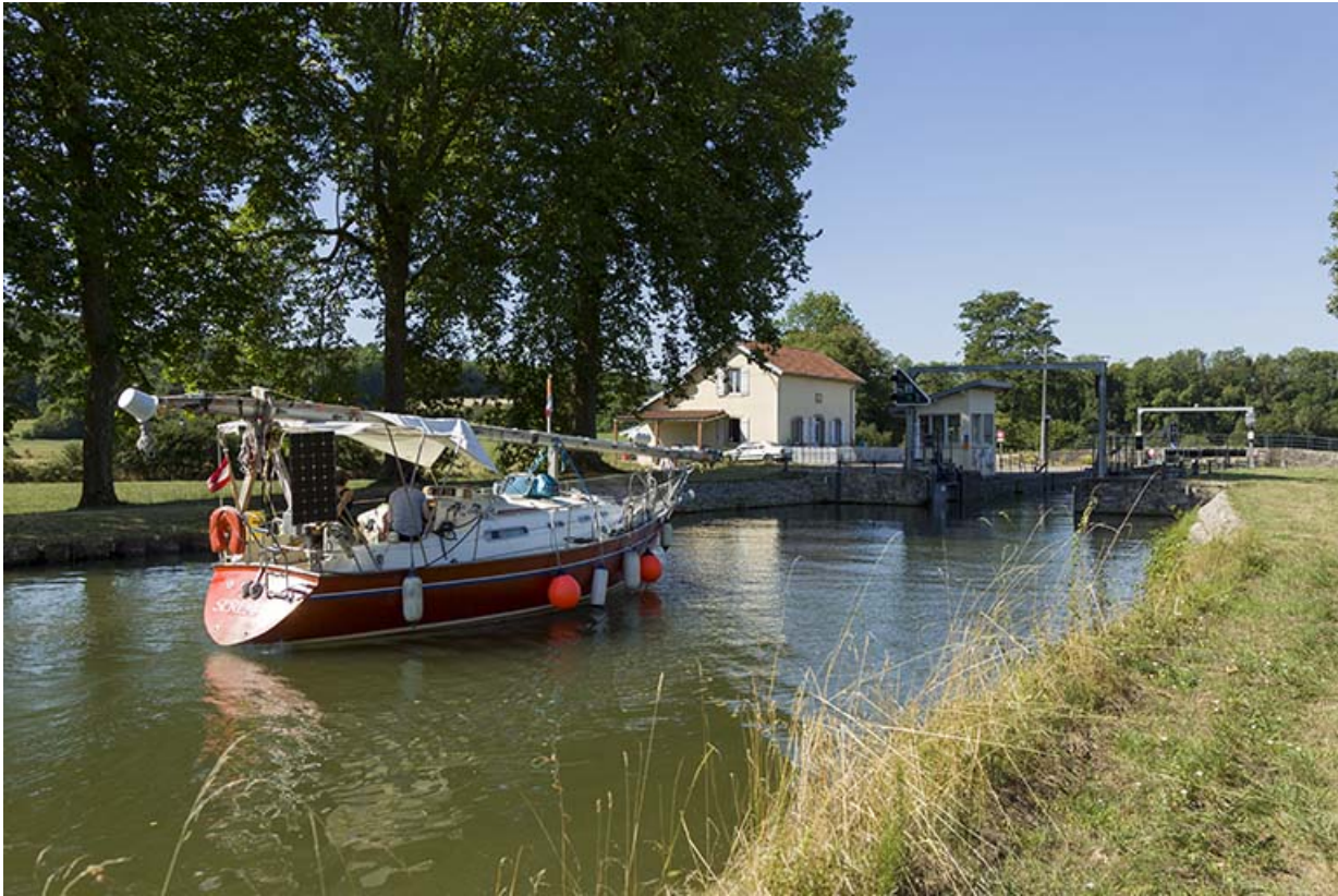
Le site d'écluse à la fin de la dérivation.