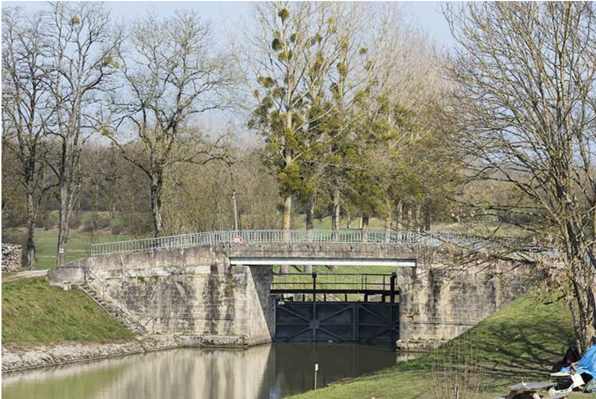
La porte de garde.