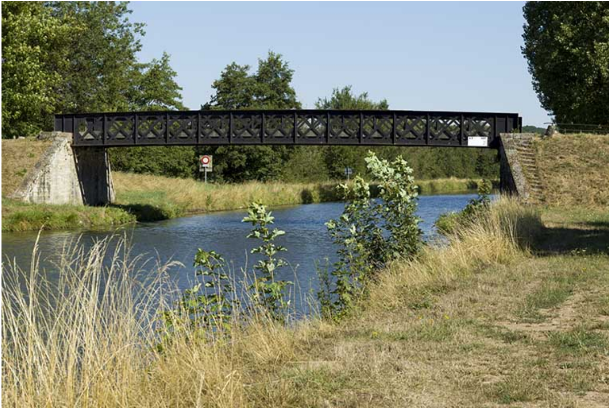
Le pont depuis l'aval.