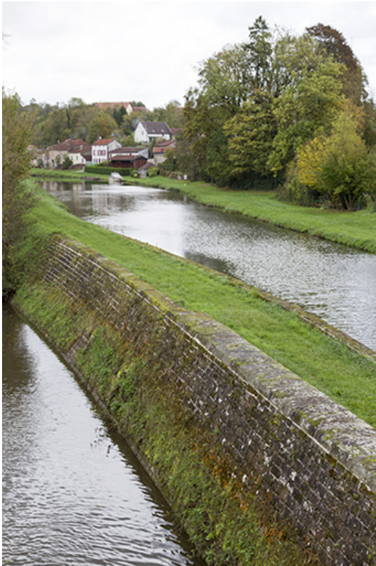
La sône et le canal longé par les chemins de halage. 70, Ormoy