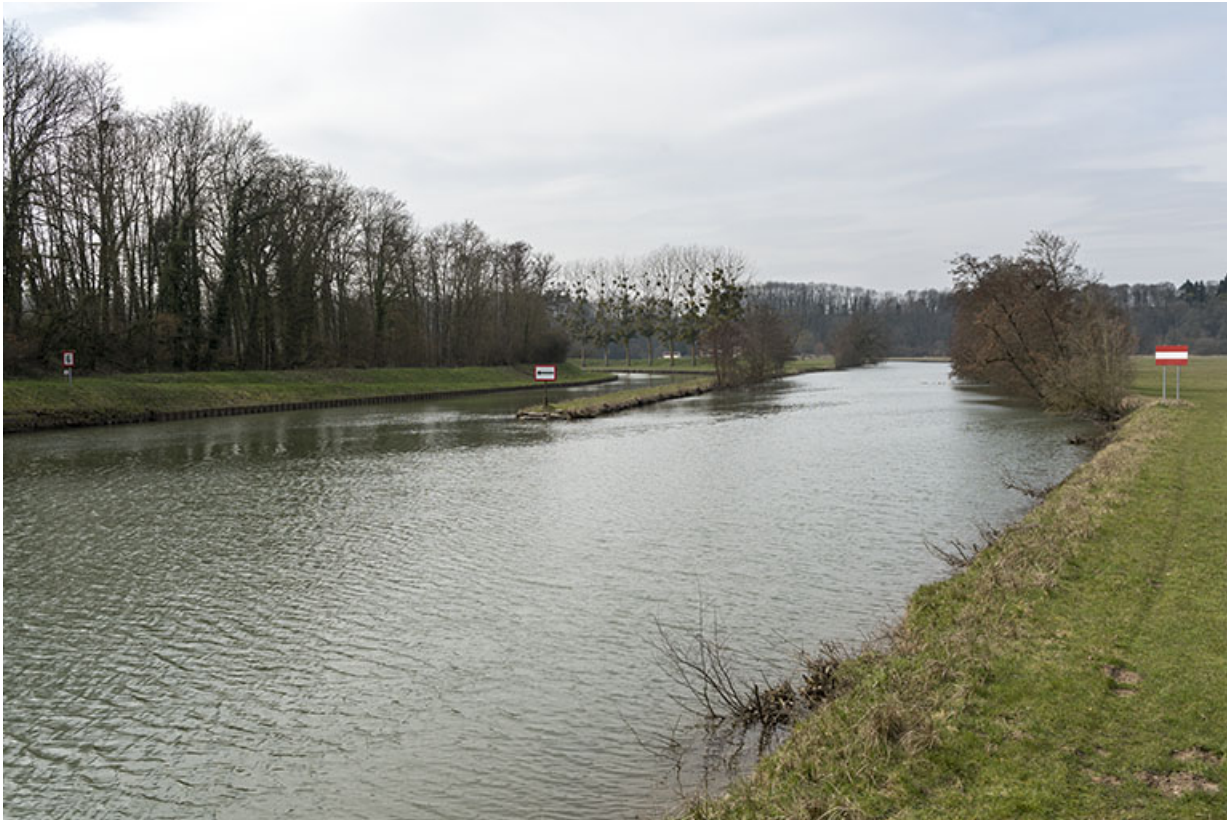
La sône et l'entrée de la dérivation.