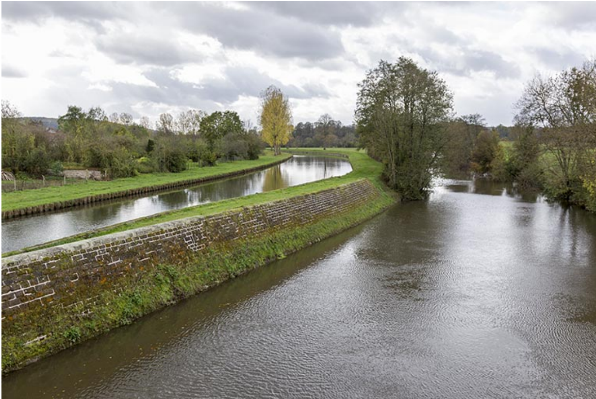
La sône et le canal de navigation.