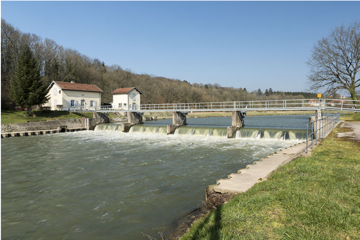
Le site du barrage mobile, vue d'ensemble. 70, Ormoy