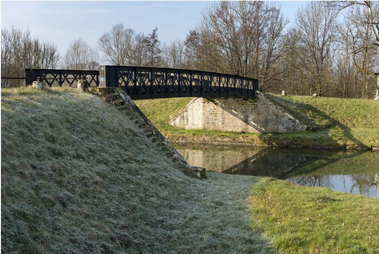
Pont du Devez.