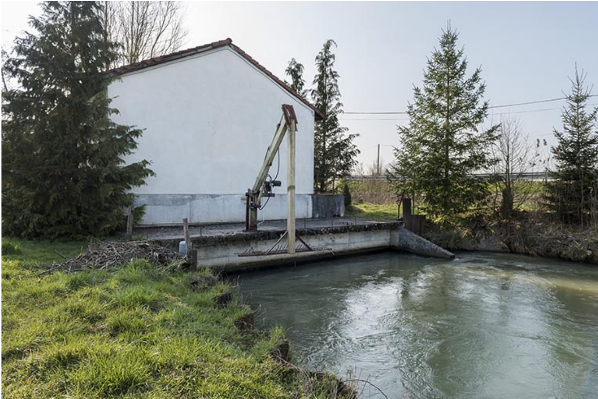
Appareil lié à l'entretien du bief.