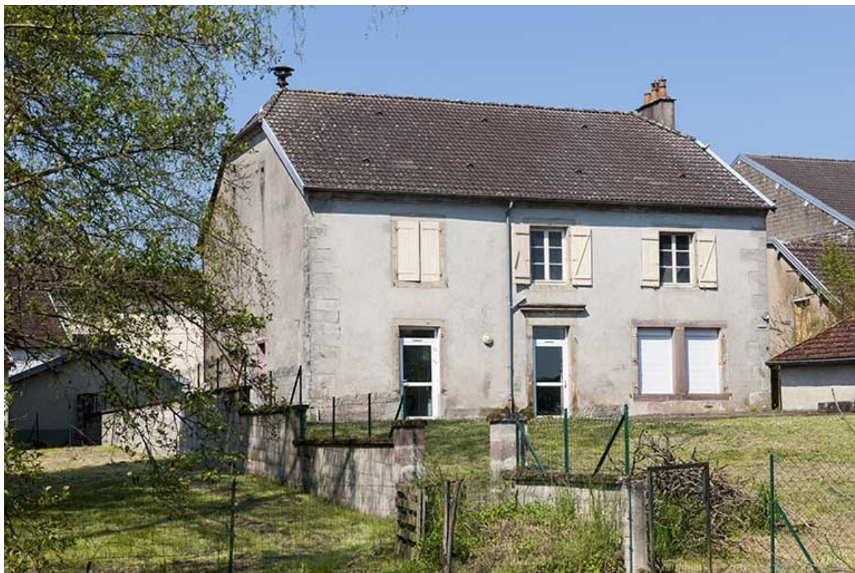
La façade postérieure.