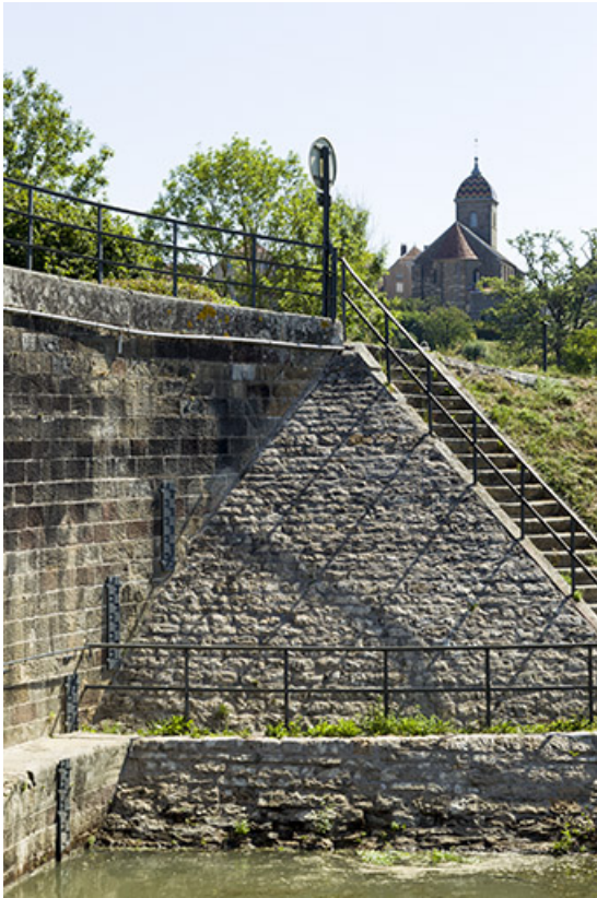
Détail de l'accès au pont par un escalier indépendant.