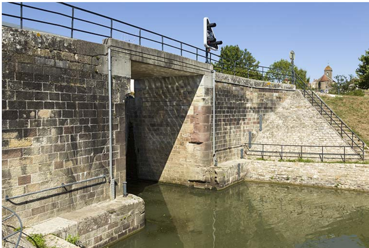
Détail des maçonneries de l'écluse (aval) et vue sur l'église.