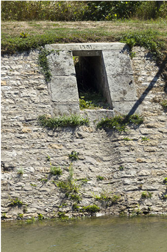
Détail de maçonnerie avec date portée 1881 sur la rive gauche en aval de l'écluse. 70, Cendrecourt, lieudit : le Closey