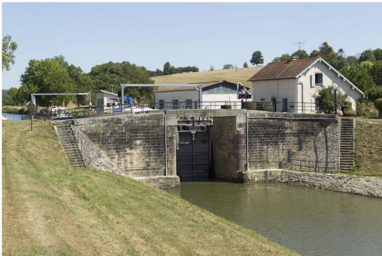
Depuis la rive droite en aval, vue sur l'écluse et le site.