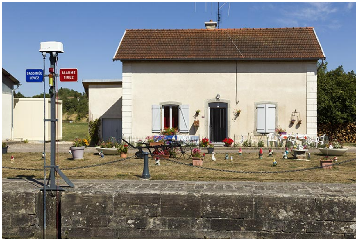
Vue depuis la rive droite de la façade antérieure de la maison d'éclusier et de son jardin d'agrément. 70, Cendrecourt, lieudit : le Closey