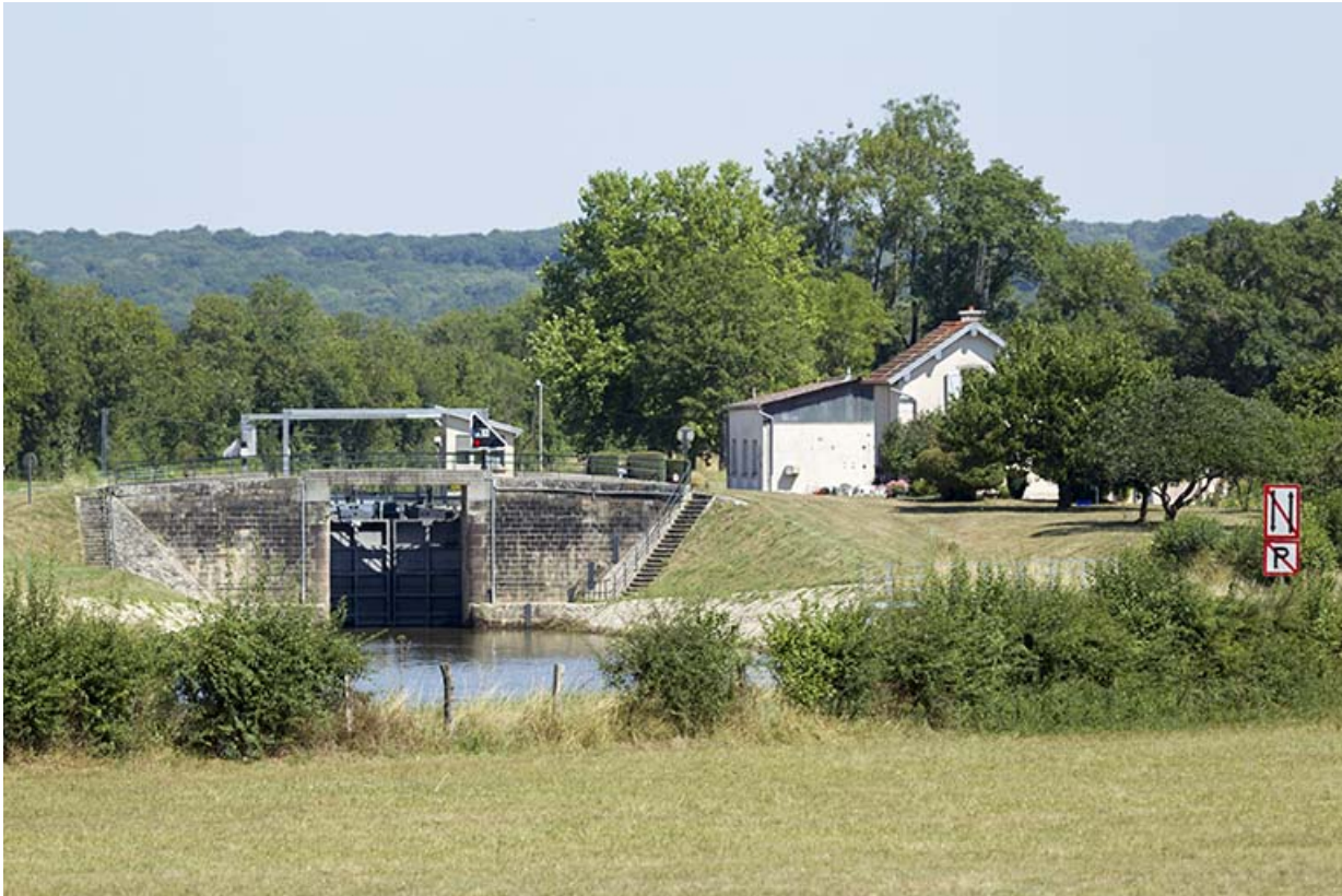
Vue d'ensemble du site depuis la rive droite en aval.