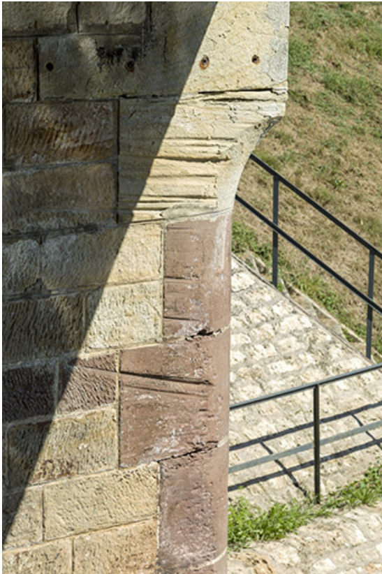
Traces d'usure dans les maçonneries de l'écluse (aval).