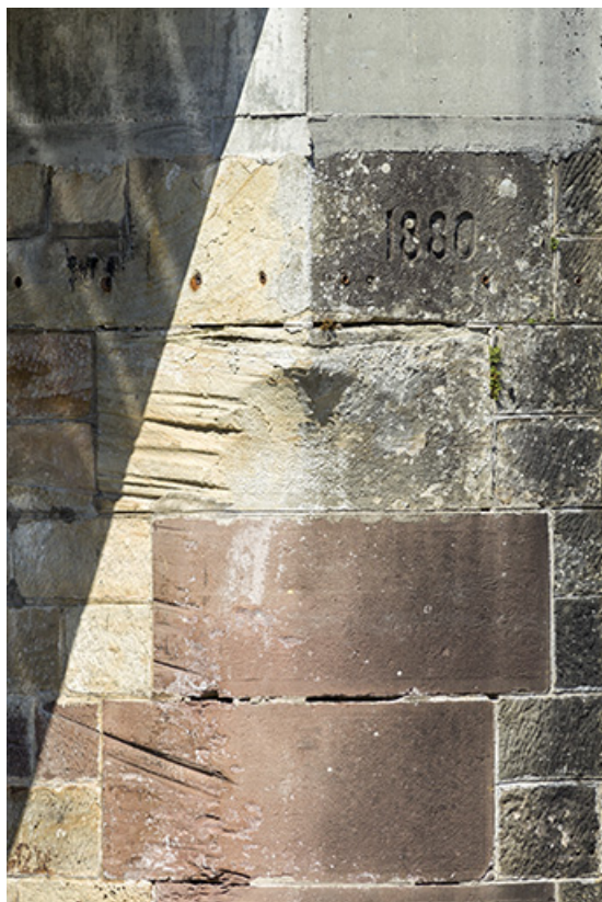
Détail des traces d'usure dans les maçonneries de l'écluse (aval) et date portée 1880. 70, Cendrecourt, lieudit : le Closey