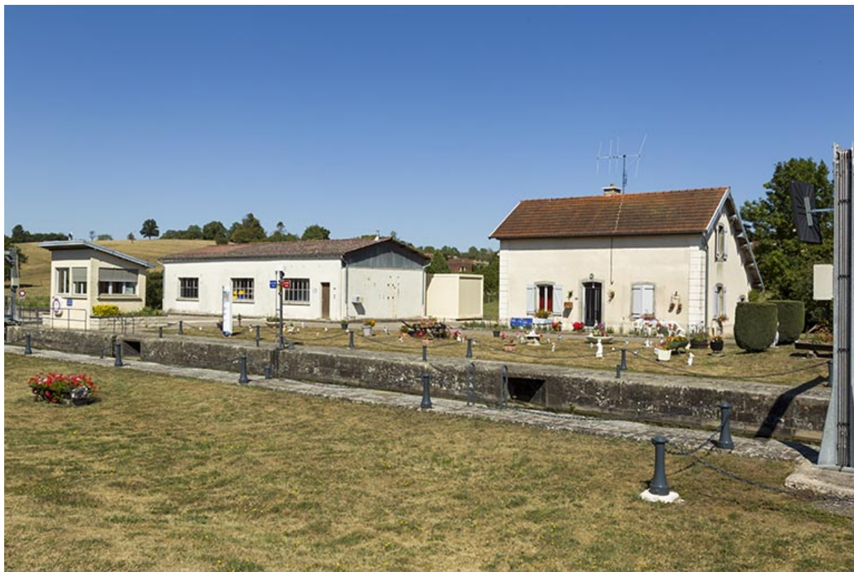
Depuis la rive droite, vue sur la maison d'éclusier et le hangar de Voies navigables de France (centre d'exploitation). 70, Cendrecourt, lieudit : le Closey