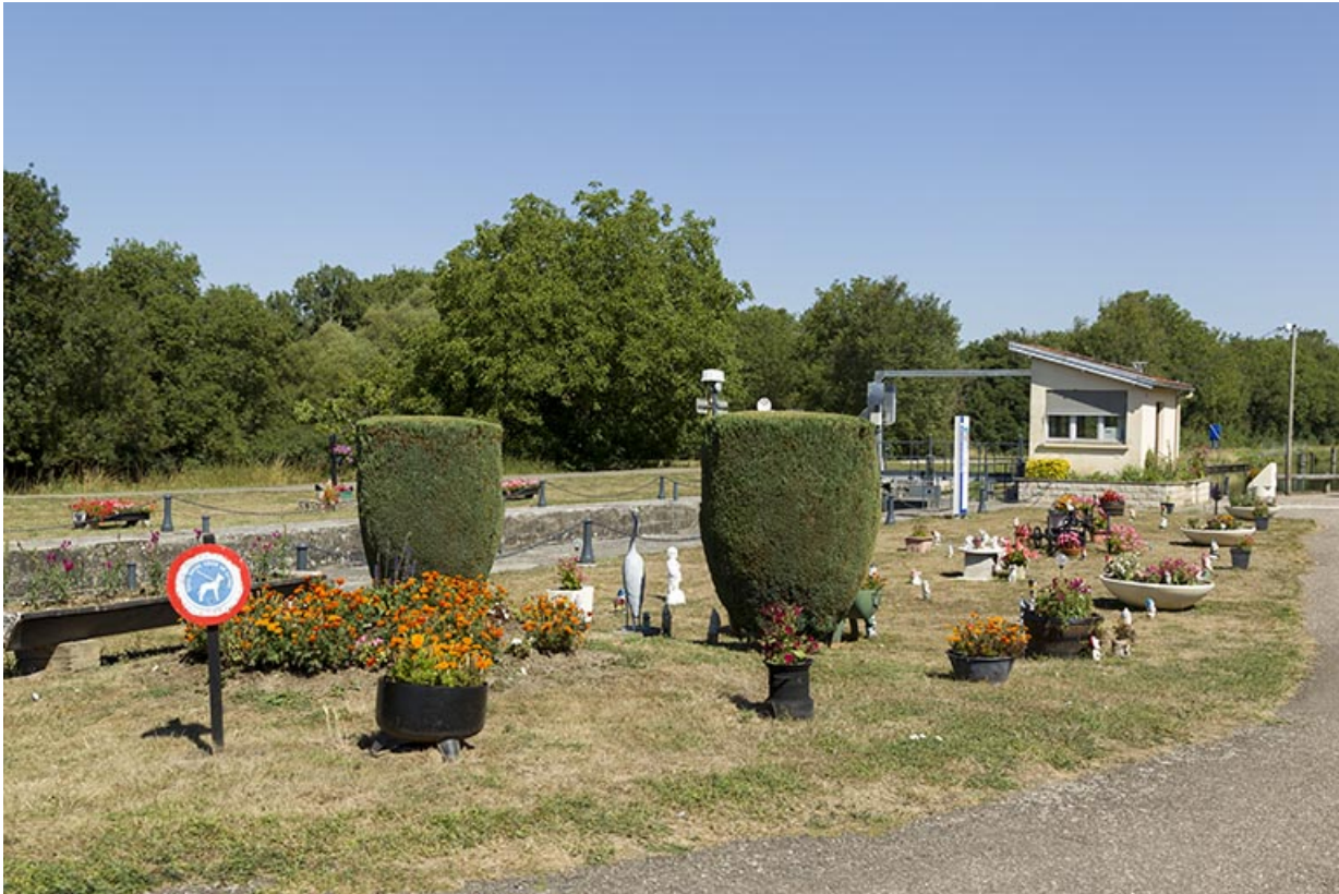
Vue d'ensemble de la composition florale décorative et du poste de commande, depuis le sud-est. 70, Cendrecourt, lieudit : le Closey