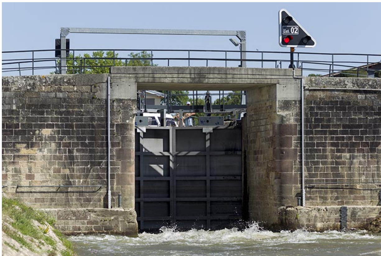
Vue de détail de l'écluse en cours de manoeuvre. (au sud)