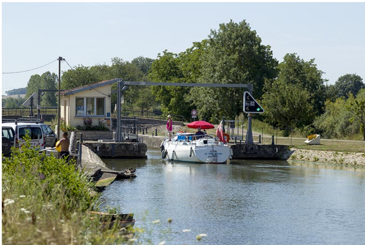
Vue de l'écluse et d'un bateau s'engageant depuis l'amont (nord), rive gauche. 70, Cendrecourt, lieudit : le Closey