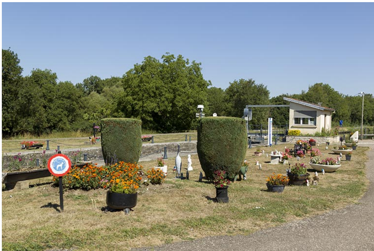
Vue d'ensemble de la composition florale décorative et du poste de commande, depuis le sud-est. 70, Cendrecourt, lieudit : le Closey