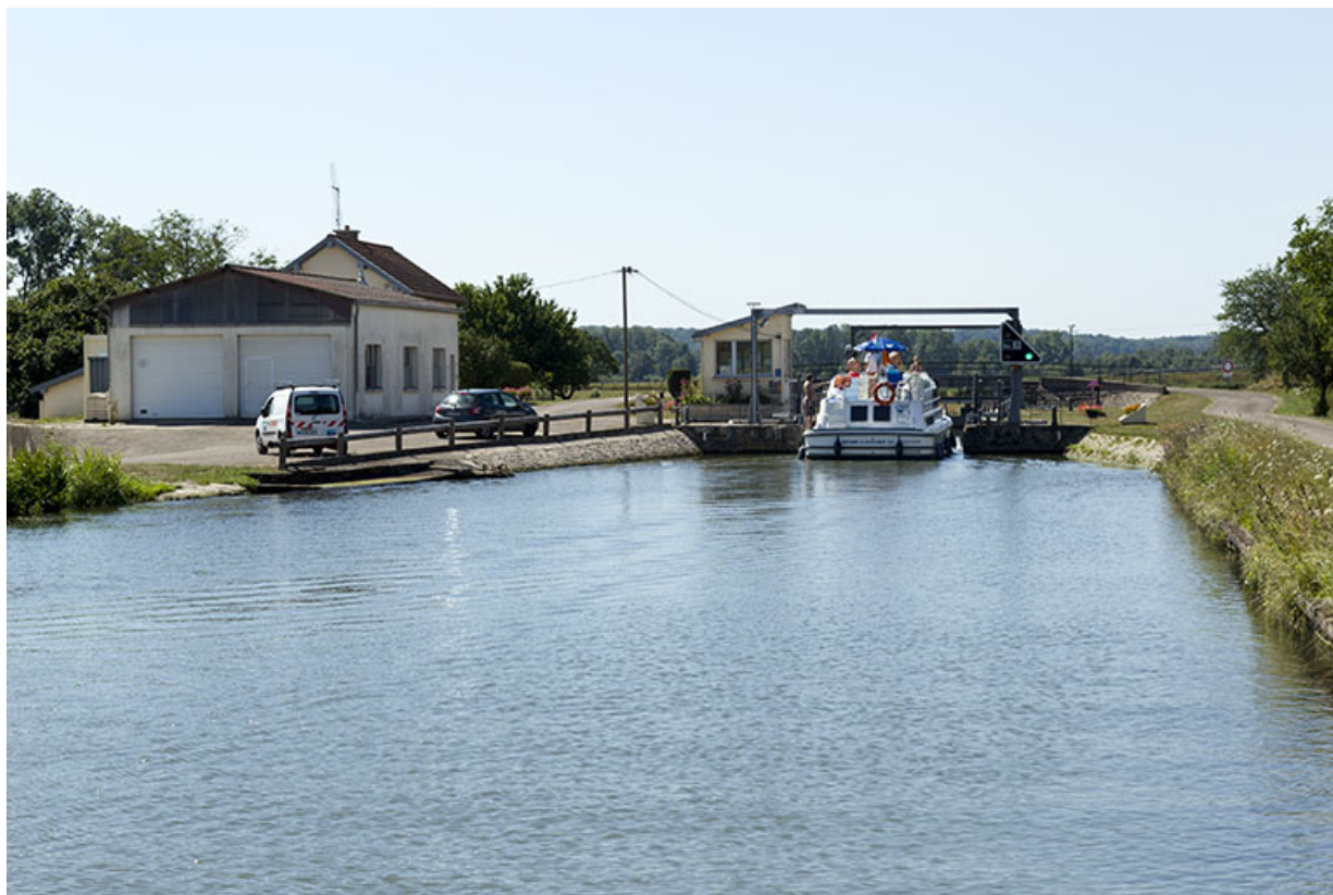
Depuis l'amont (nord), vue du site d'écluse.