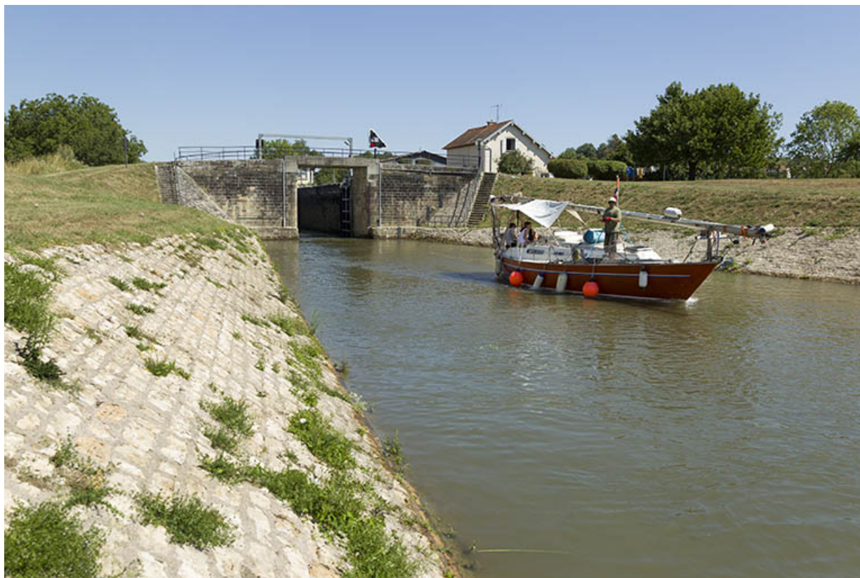
Vue de l'écluse et d'un bateau avalant, depuis l'aval.