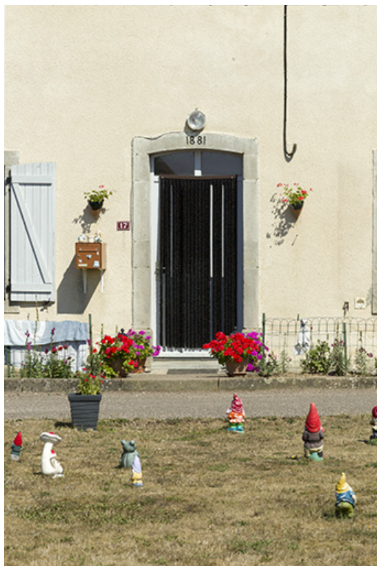
Vue rapprochée de la porte de la maison d'éclusier avec sa date portée.