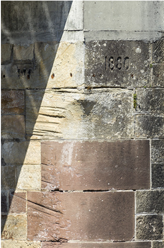
Détail des traces d'usure dans les maçonneries de l'écluse (aval) et date portée 1880. 70, Cendrecourt, lieudit : le Closey