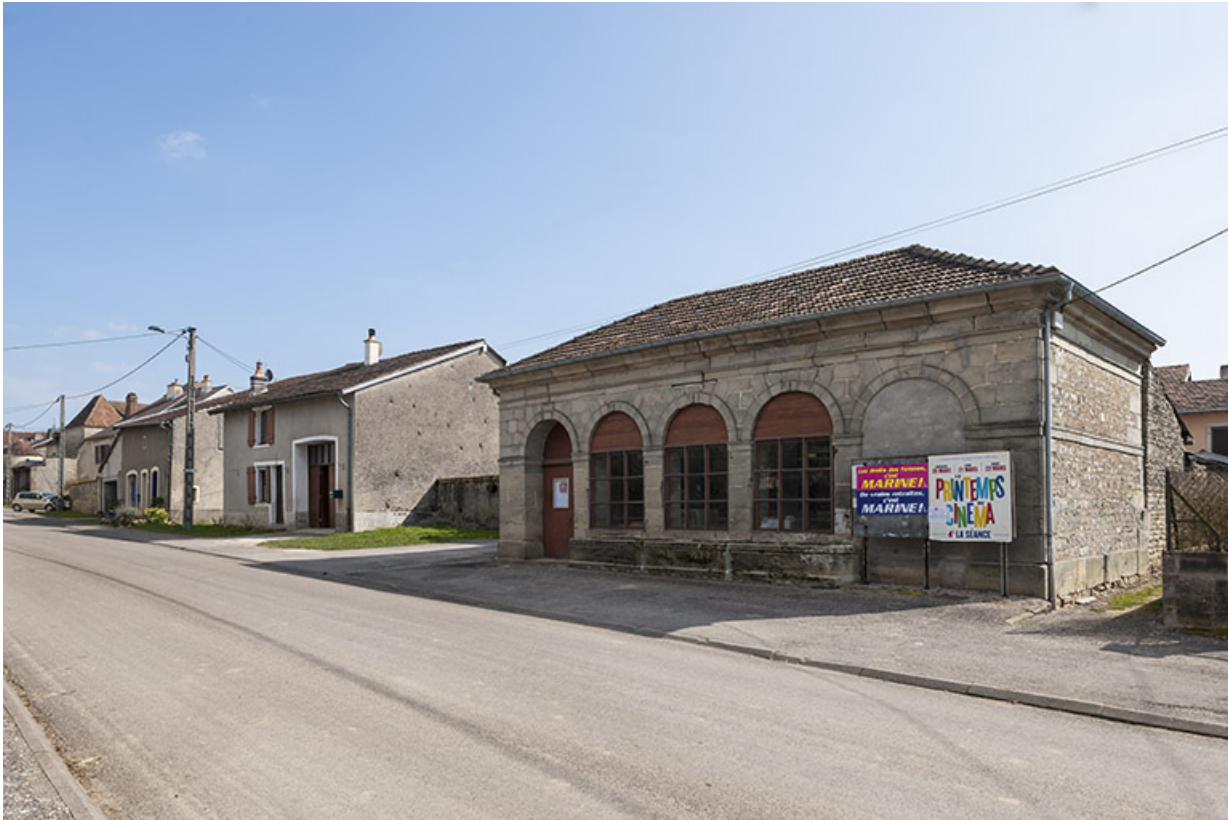
Ancien lavoir, rue Antoine Lumière. 70, Ormoy