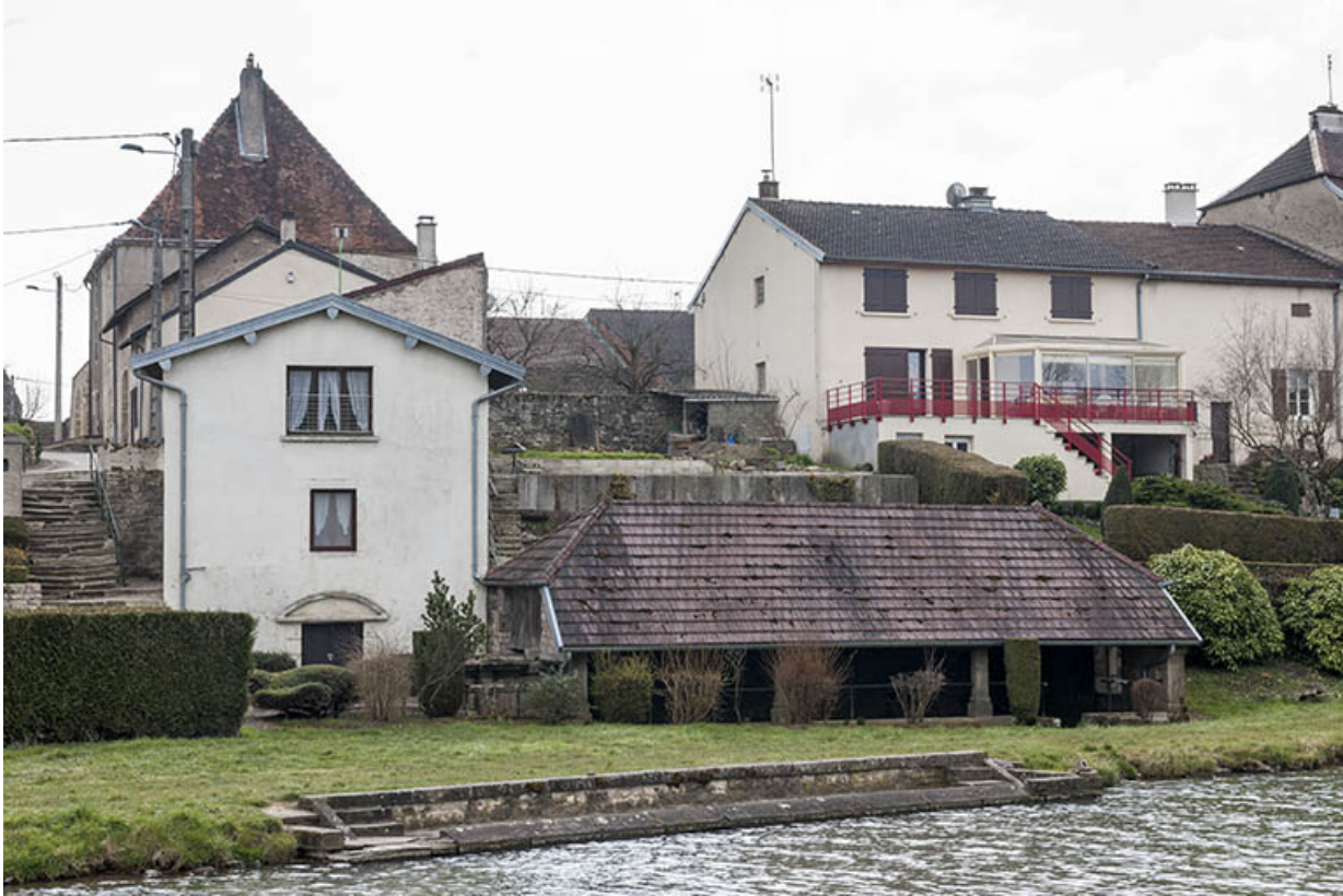
Le lavoir au bord du bief.