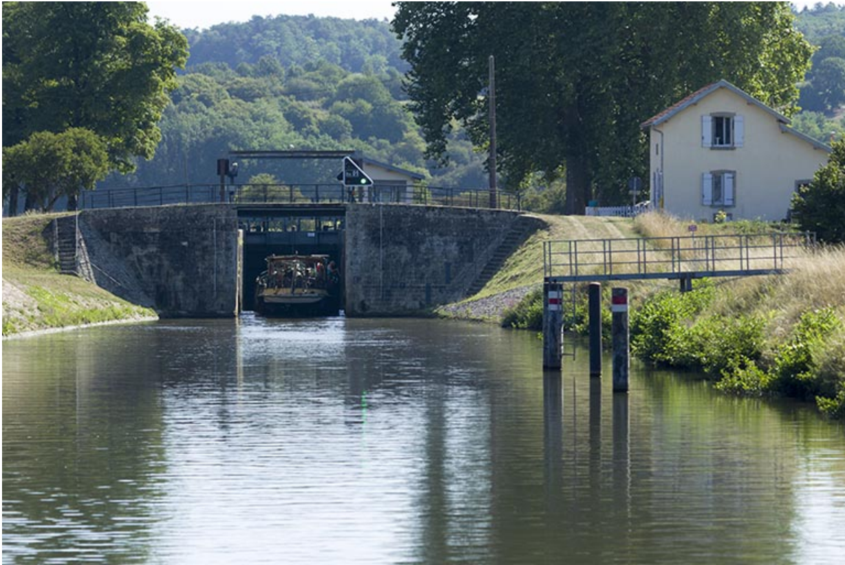
Site d'écluse, Ormoy.