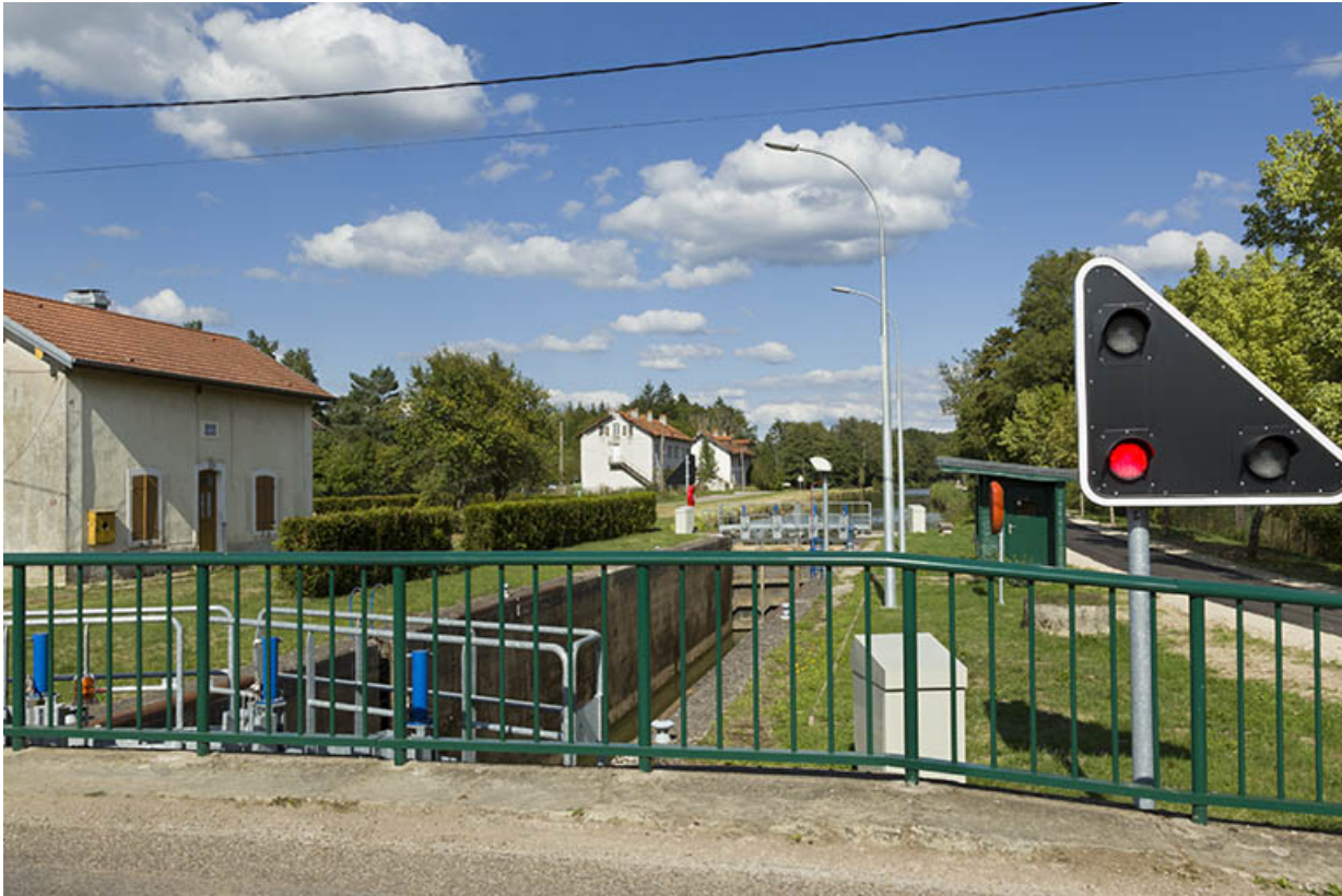
Vue de l'écluse vers l'amont depuis le pont. 70, Demangevelle