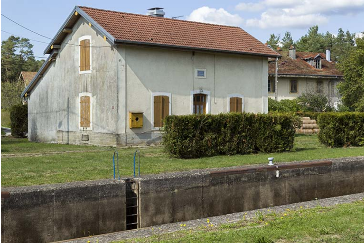
Vue de trois-quart sud-ouest de la maison d'éclusier. 70, Demangevelle