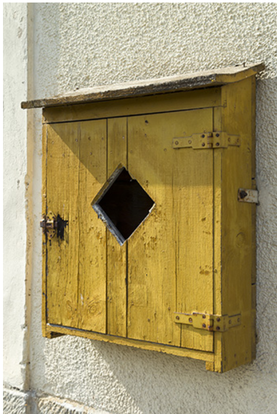
Détail d'une boîte à bouée sur la façade antérieure. 70, Demangevelle