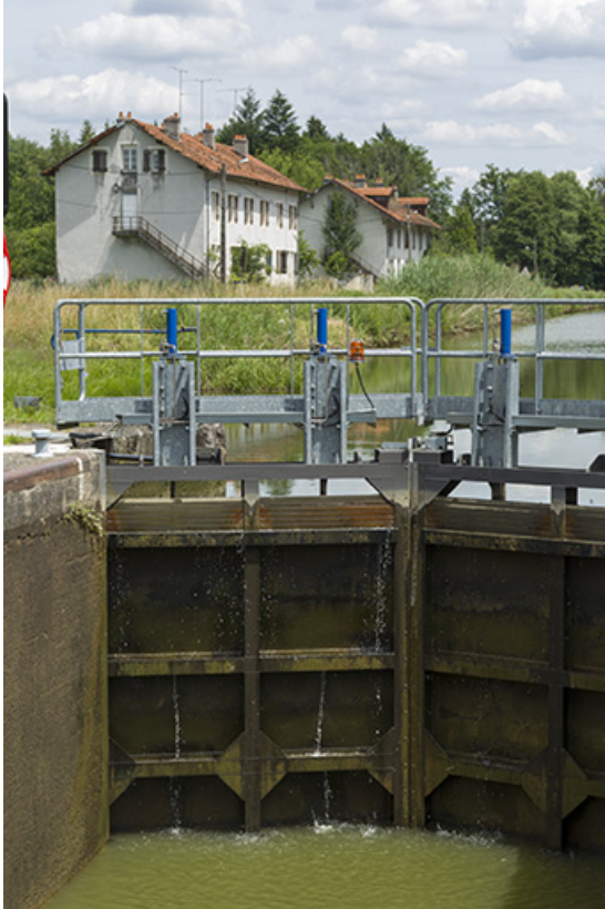
Ecluse n°44 : détail intérieur de la porte amont fermée et vue sur les cités, Demangevelle (70).