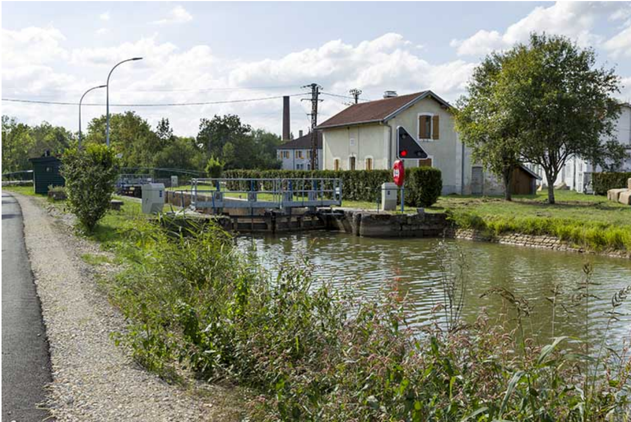
Vue d'ensemble du site d'écluse depuis la rive gauche en amont. 70, Demangevelle