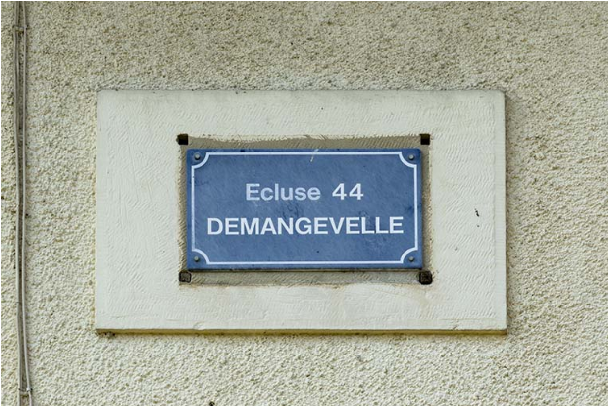
Détail de la plaque d'identification.