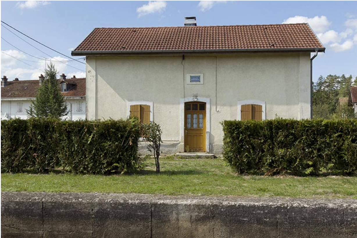
Vue de face de la maison d'éclusier.