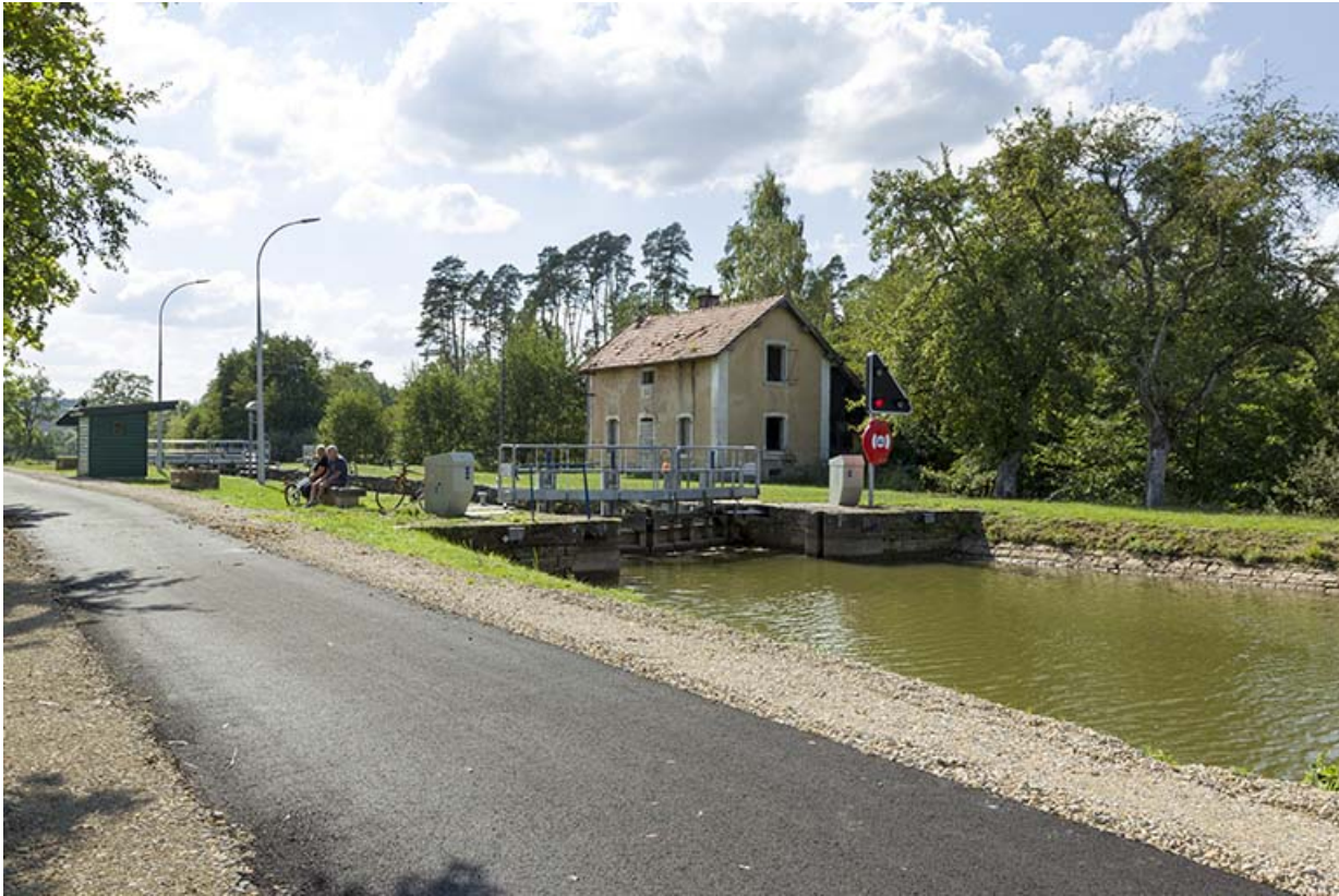
Vue du site d'écluse, du poste de commandement, de la maison d'éclusier depuis la rive gauche en amont. 70, Demangevelle