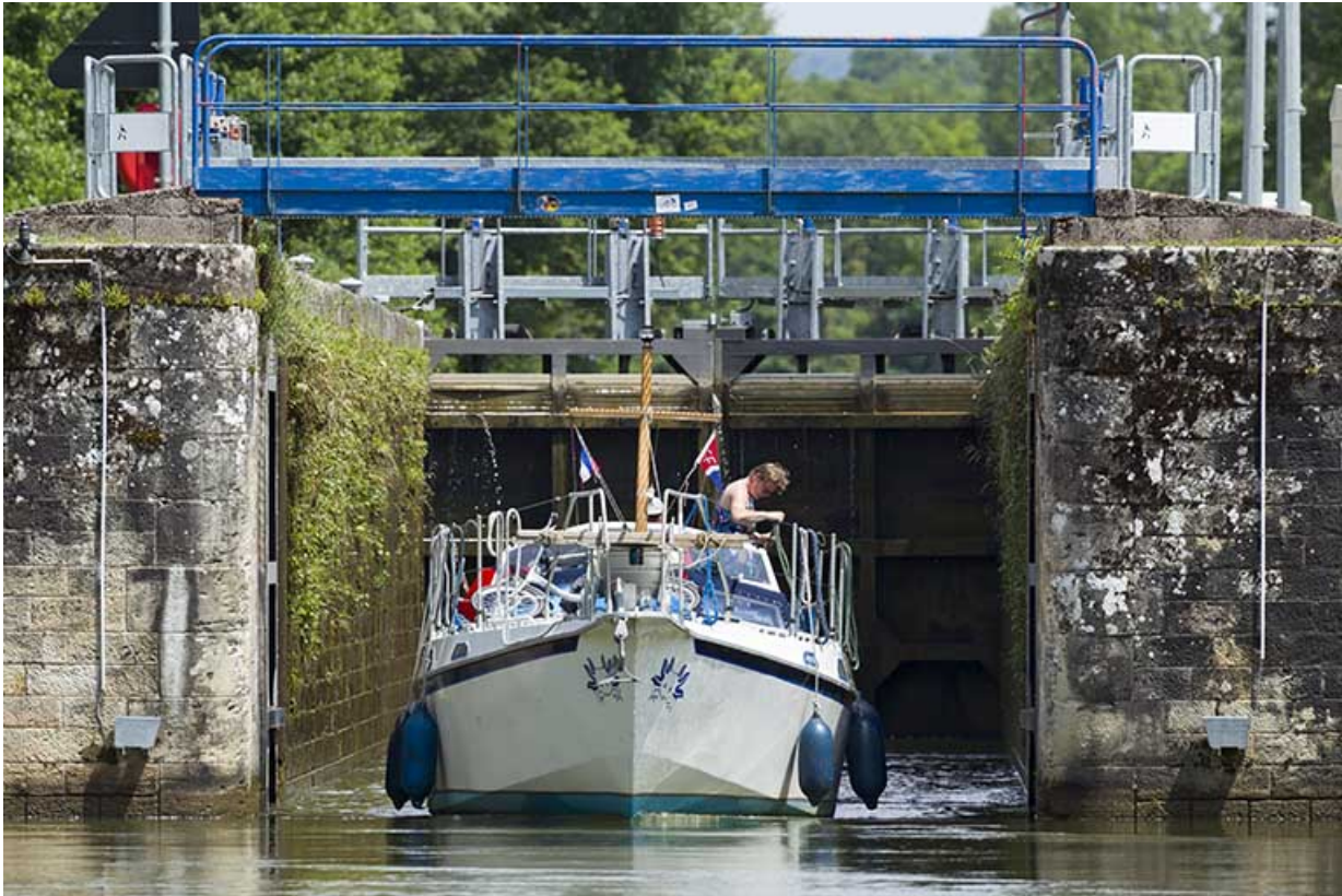
Ecluse n°43, Demangevelle (70).