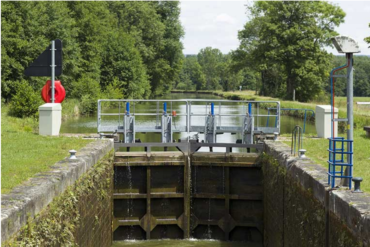
Portes amont fermées : le sas se vide.