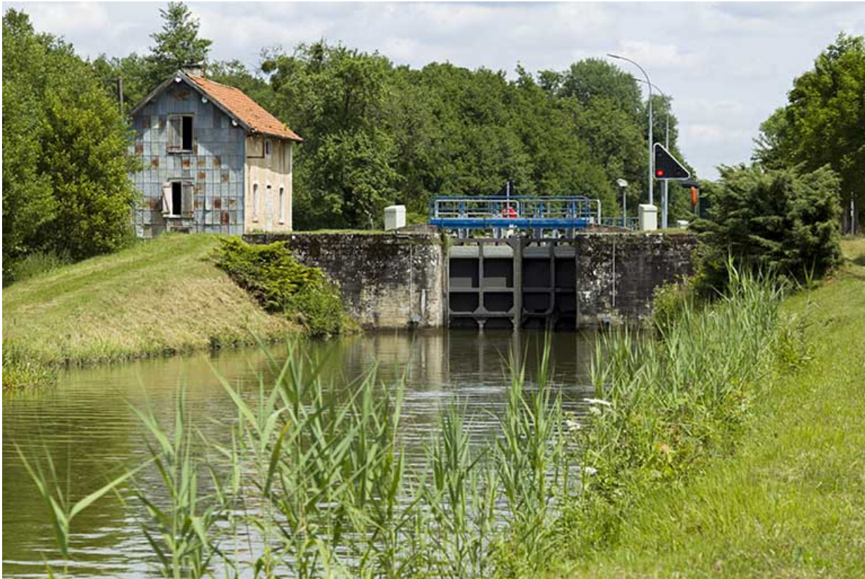
Vue de l'écluse et de sa maison depuis l'aval au sud-ouest.