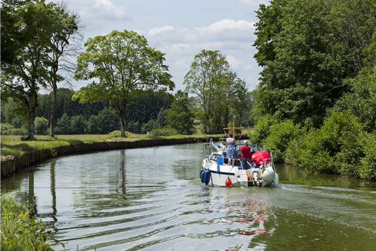
Bateau avalant dans le bief de Demangevelle.