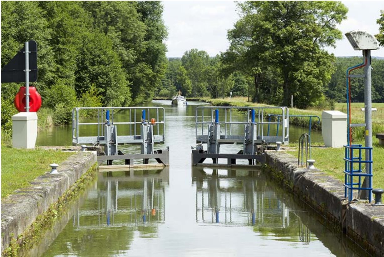
L'ouverture de portes vers l'amont à l'approche d'un bateau avalant. 70, Demangevelle