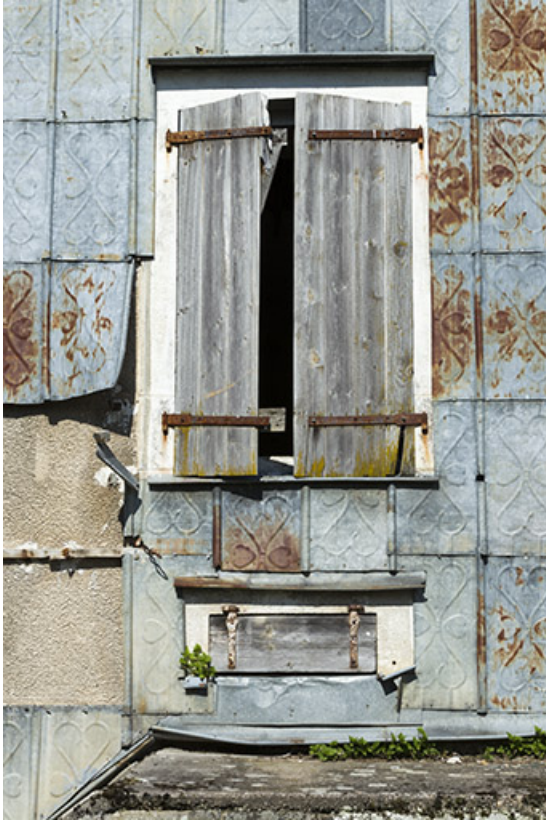
Détail de deux baies et de l'essentage de la façade sud-ouest. 70, Demangevelle