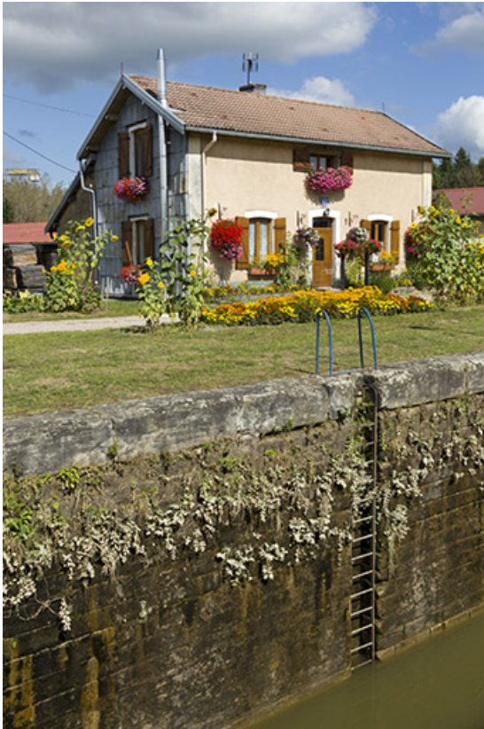
Vue de trois-quart sud-ouest de la maison éclusière depuis la rive gauche.