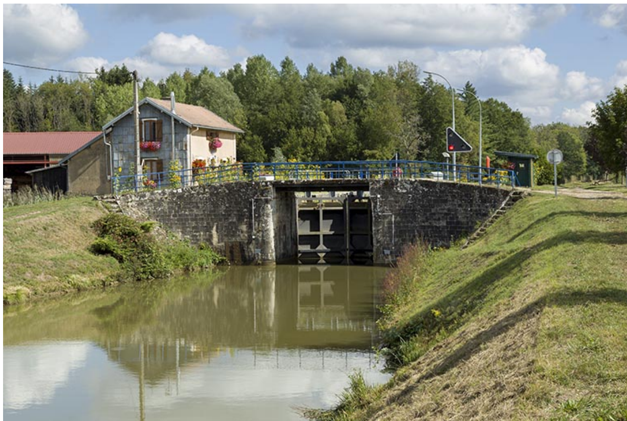
Vue d'ensemble du site d'écluse depuis la rive gauche en aval.