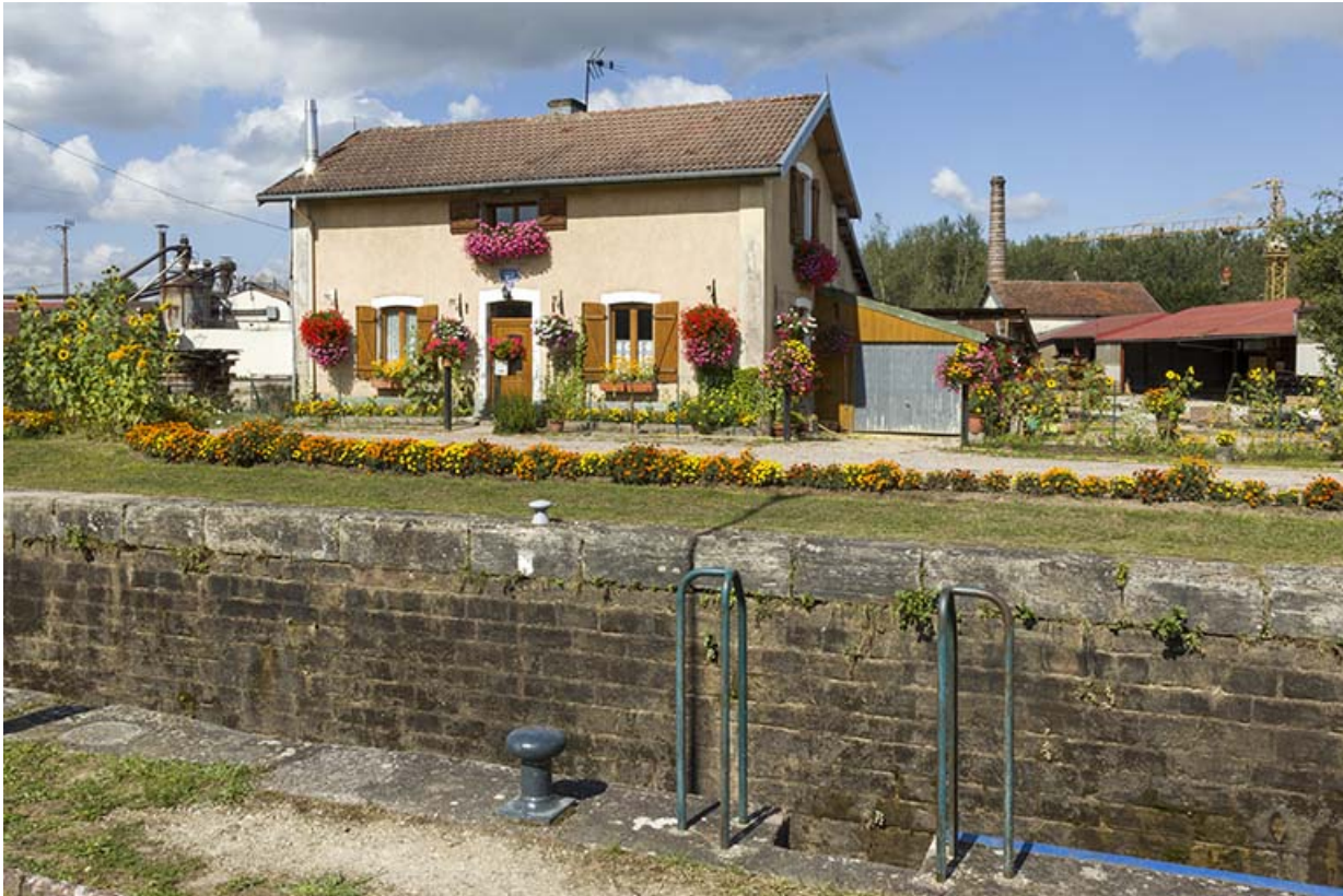
Façade antérieure de la maison d'éclusier depuis la rive gauche.