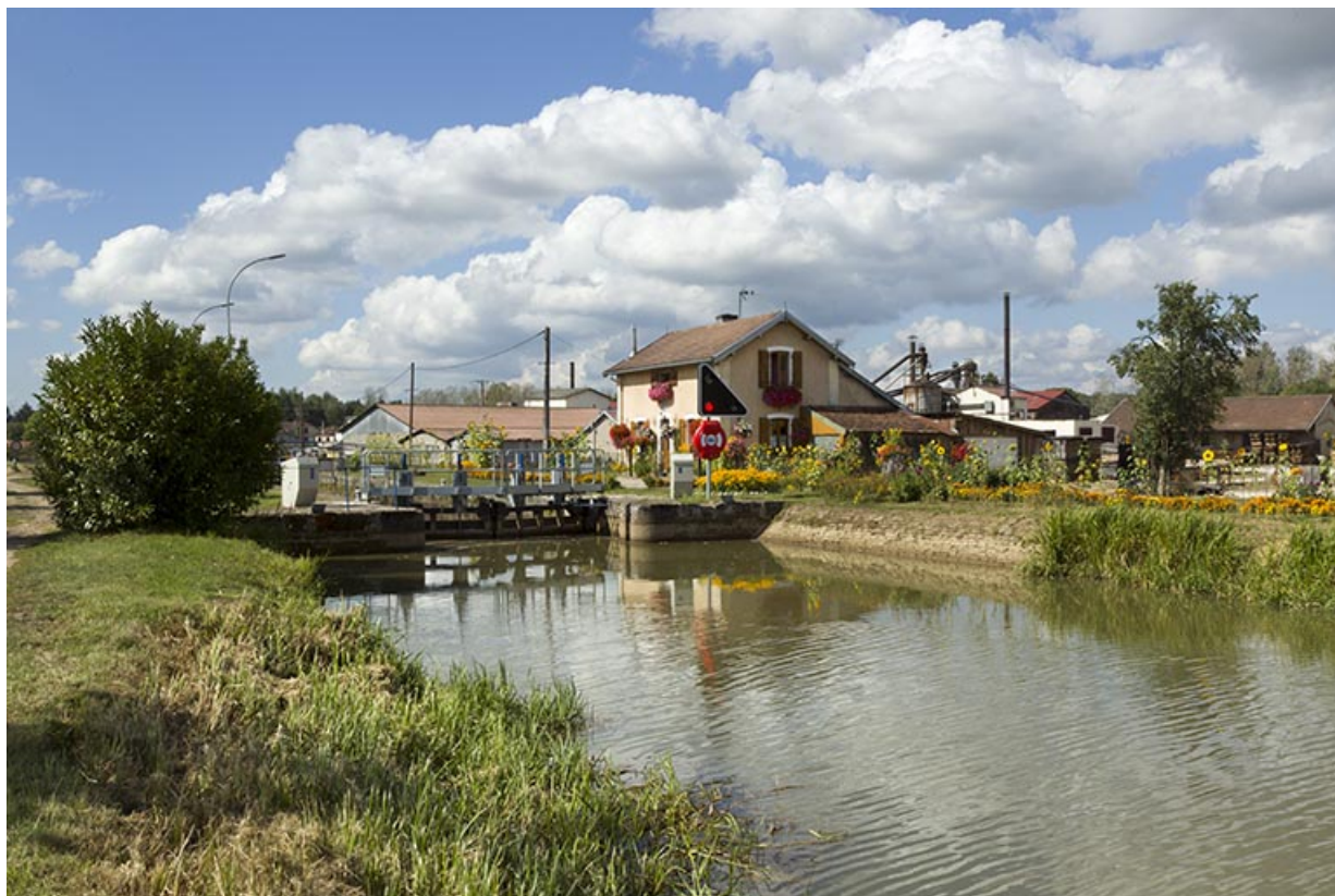
Vue d'ensemble du site d'écluse depuis la rive gauche en amont.