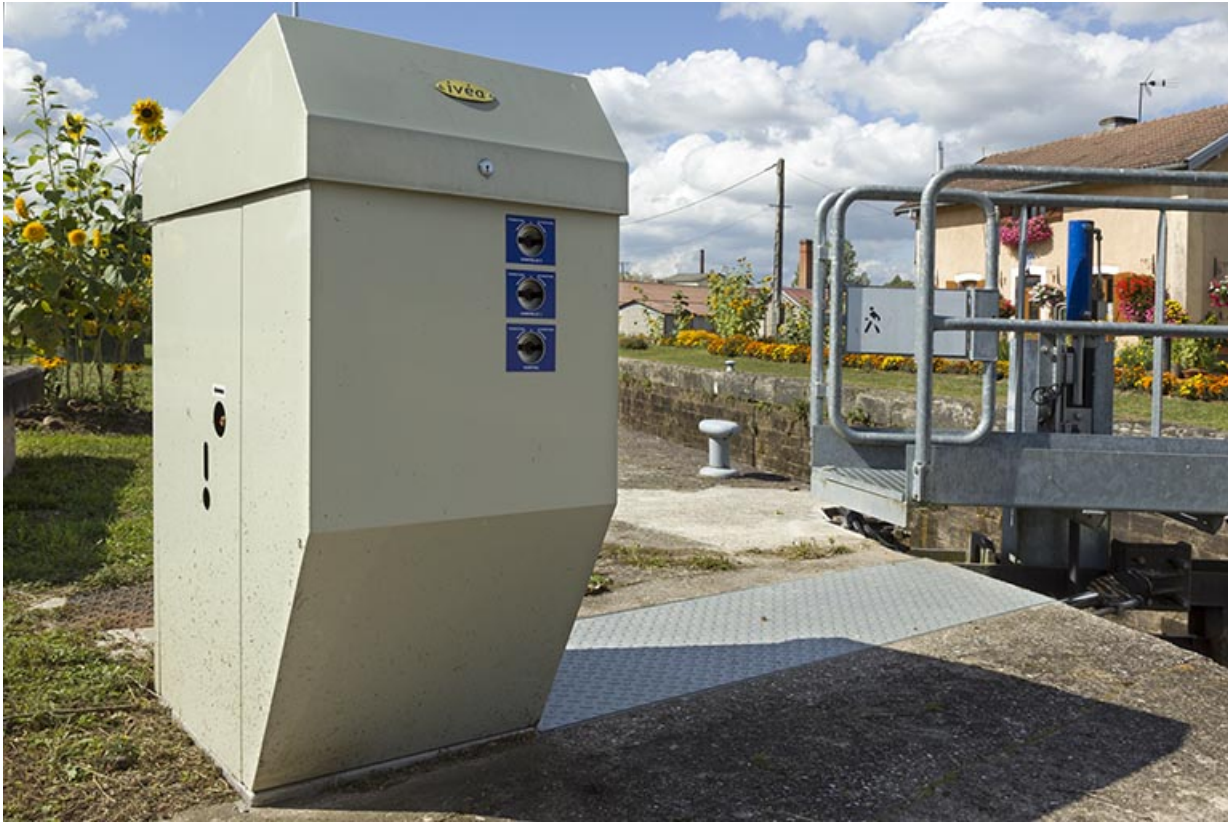
Boîtier de commande de l'écluse sur la rive gauche.