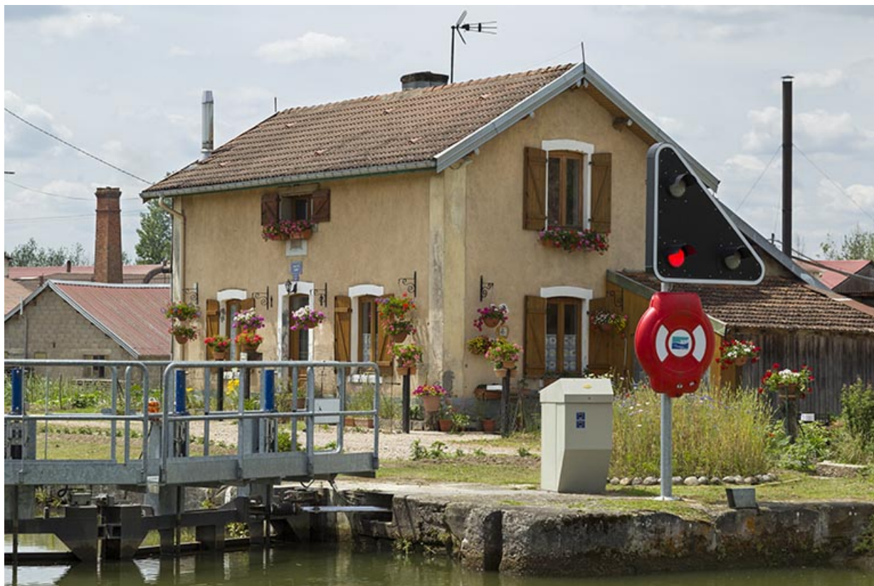
Vue de trois-quart sud-est de la maison d'éclusier depuis la rive gauche.