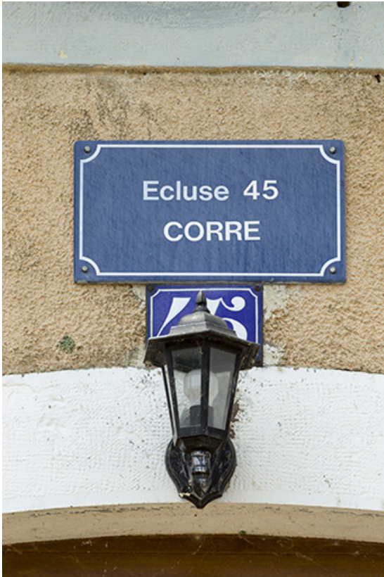
Détail de la plaque d'identification.