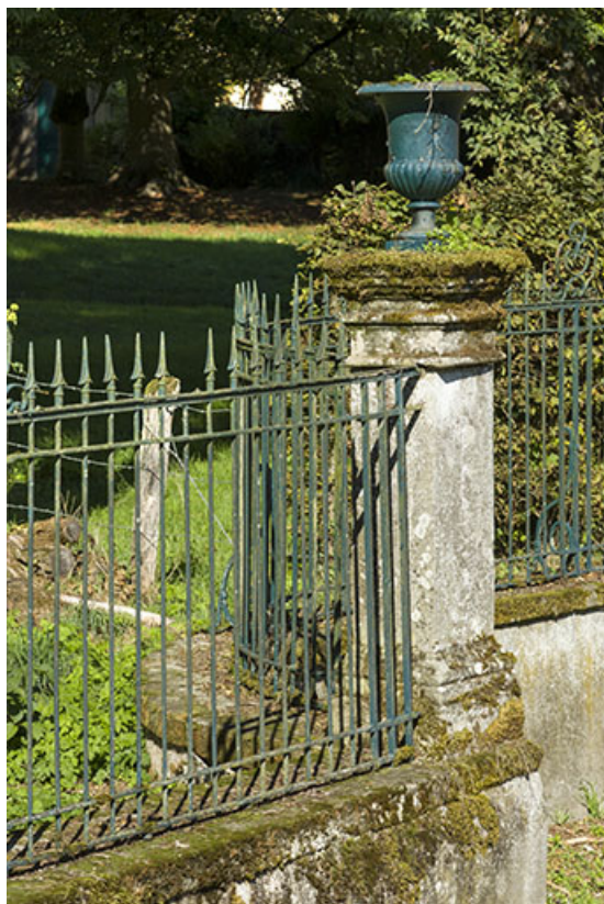
Détail de la cloture orientale.

70, Corre, 26, lieudit : 28 rue Billecard