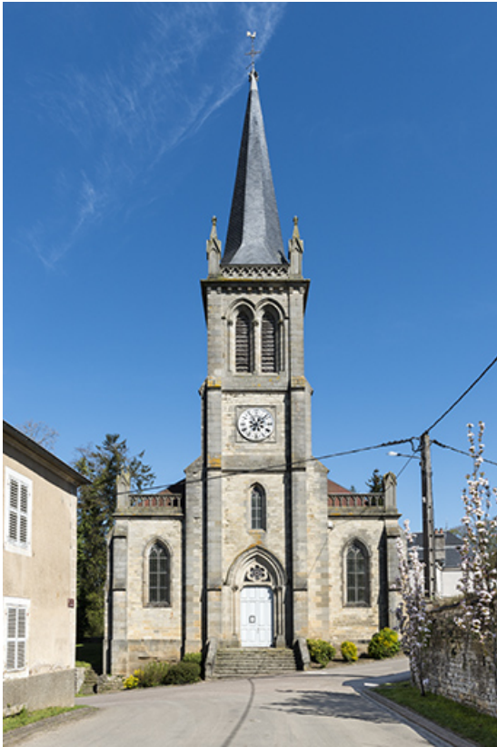
Rue de l'Eglise.