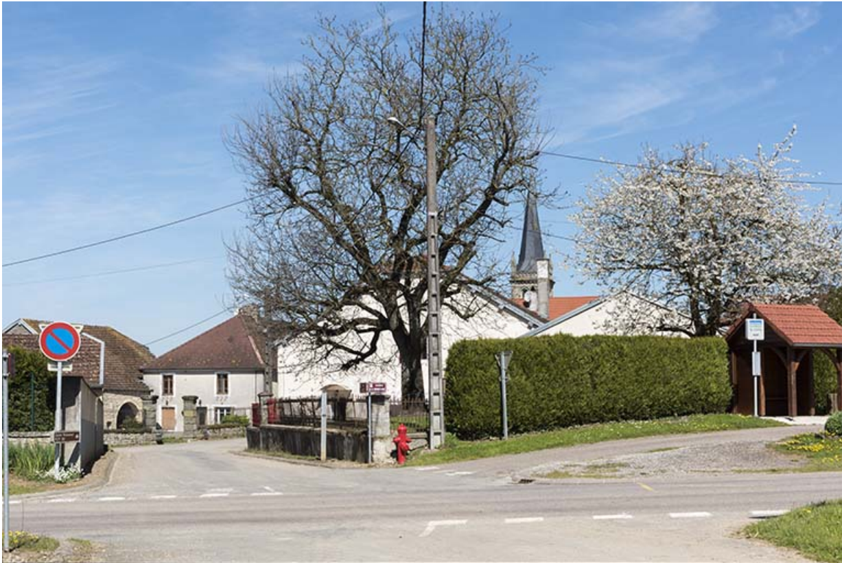
Intersection entre la départementale 44 et la rue de l'Eglise.