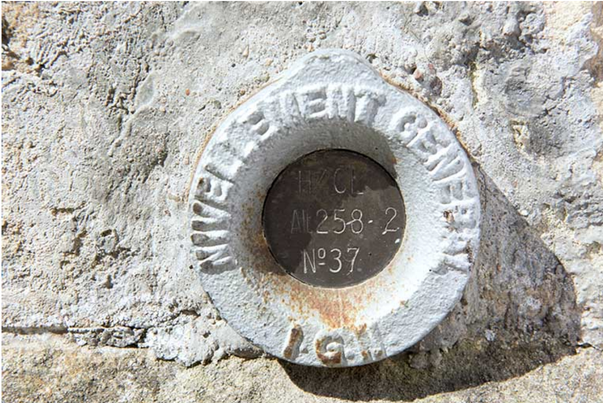
Répère de nivellement, église d'Aisey.