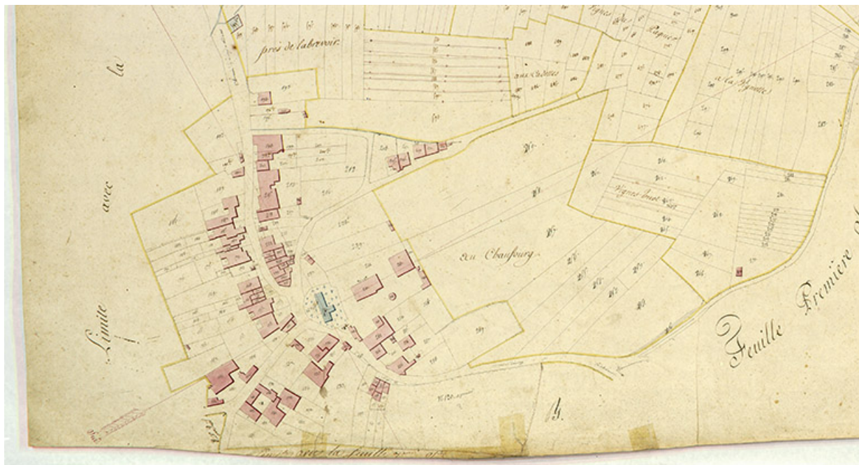
Plan du village extrait du plan cadastral ,1819.