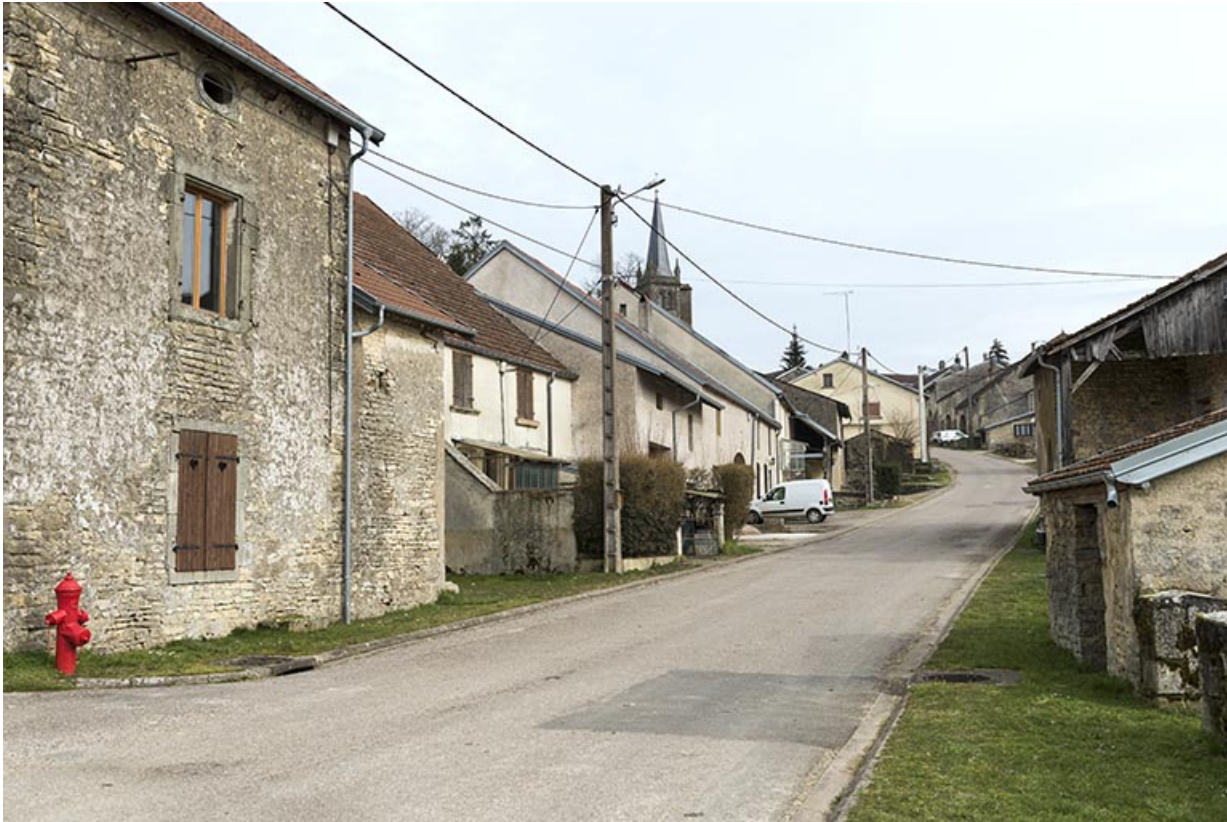
La Grande rue, Aisey.