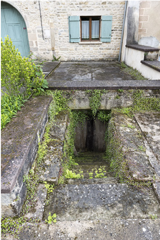
Entrée de cave.