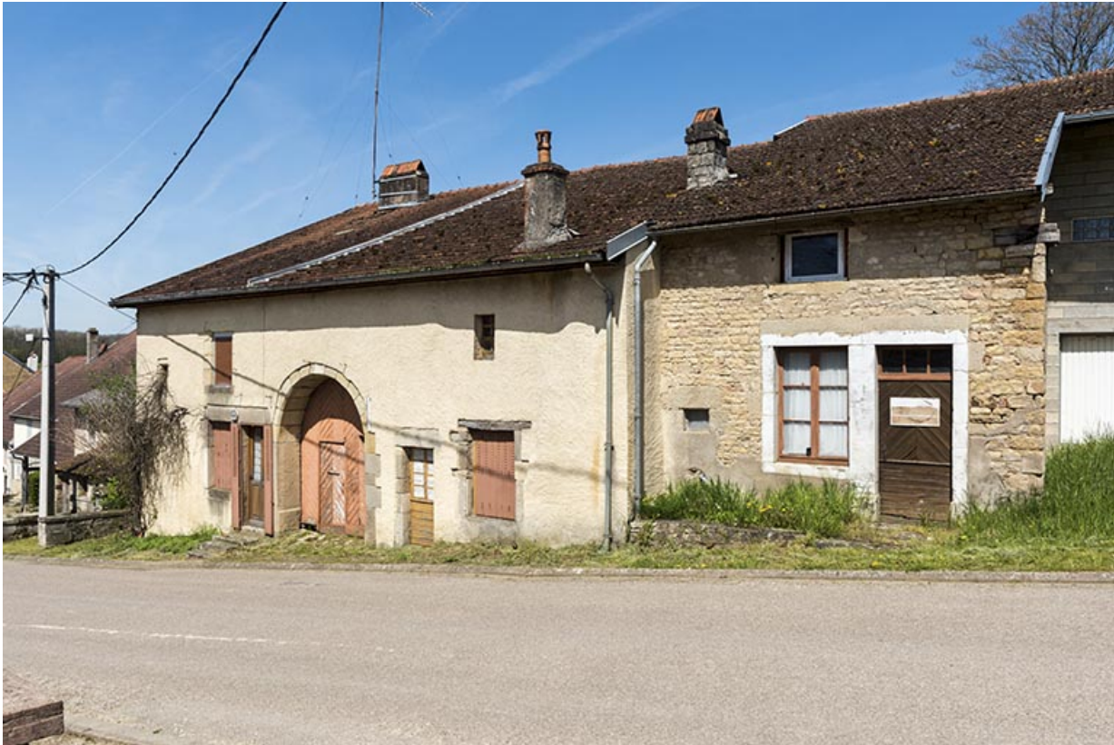
Fermes, Grande rue. 70, Aisey-et-Richecourt