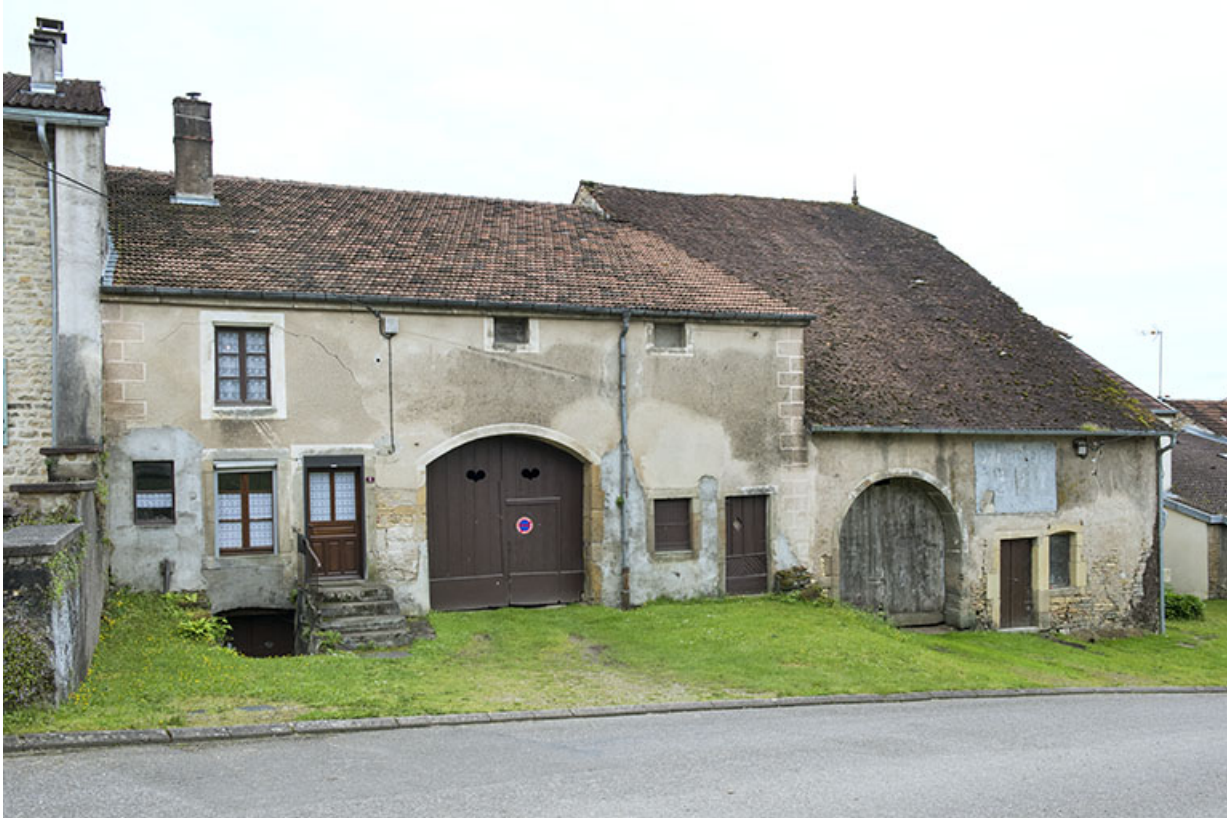
fermes , Grande rue. 70, Aisey-et-Richécourt