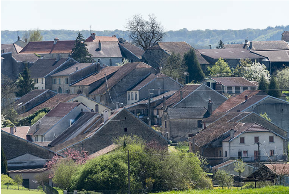
Vue sur le village.