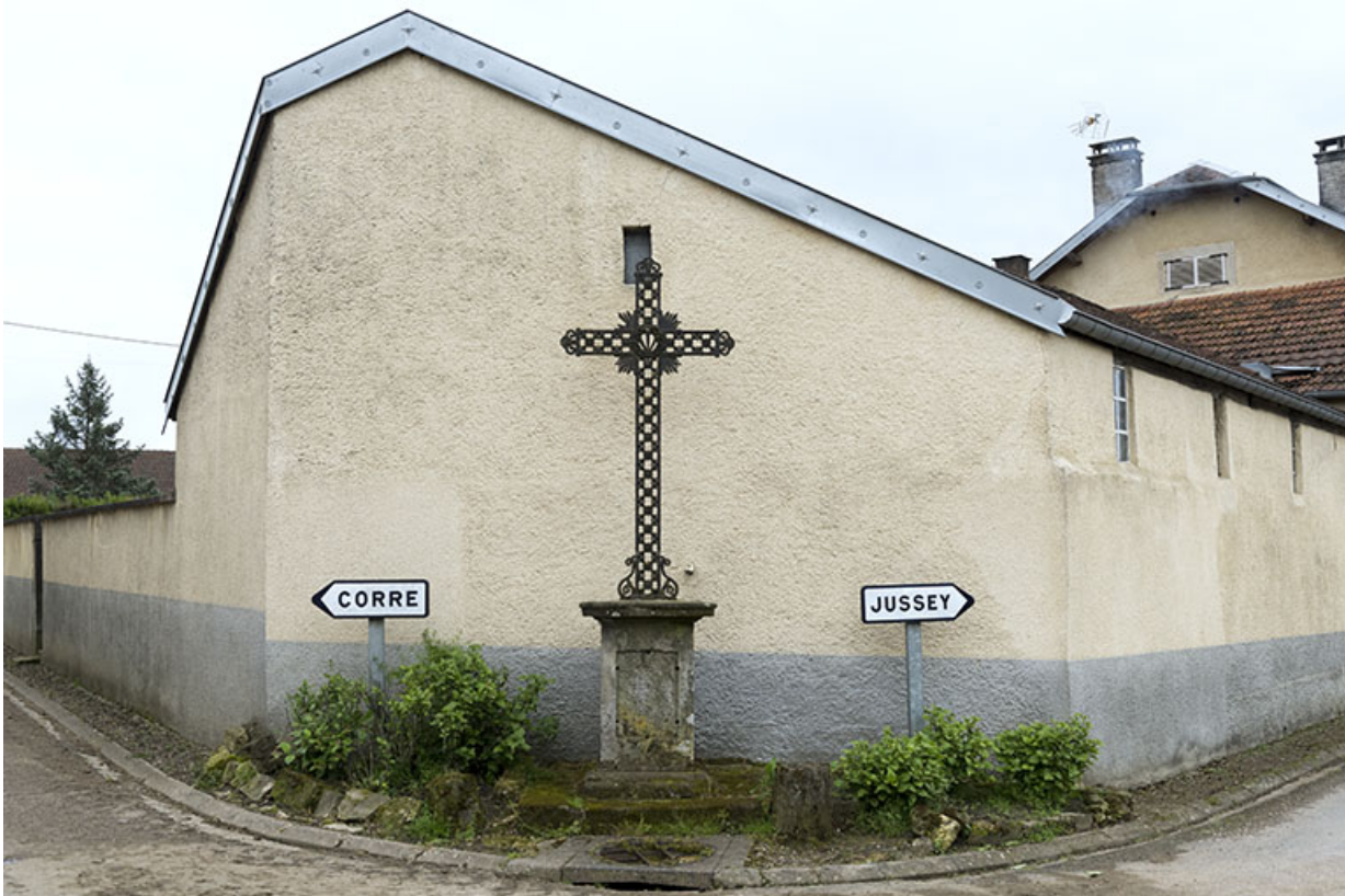
Croix de chemin.