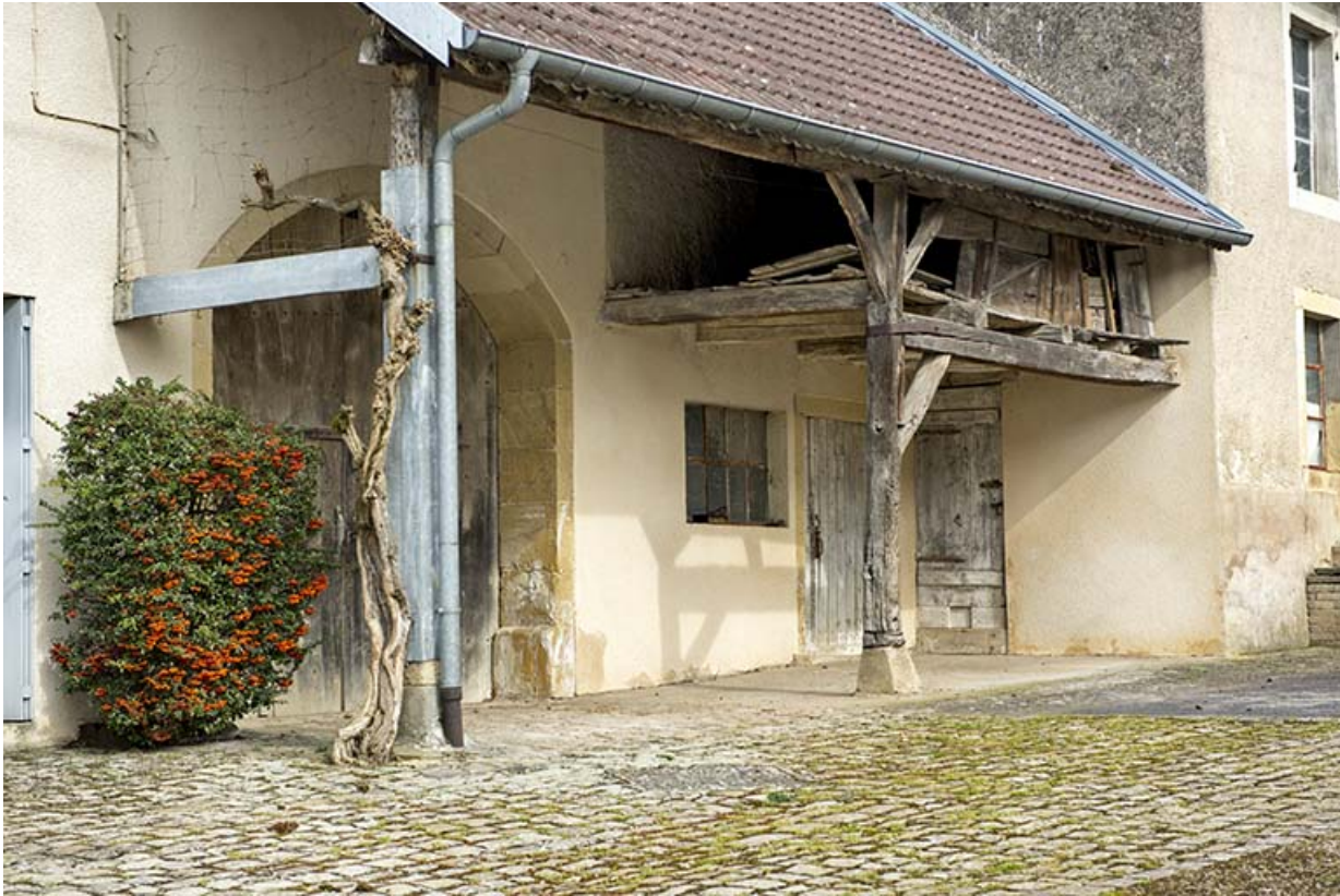
Auvent protégeant l'entrée de la grange.