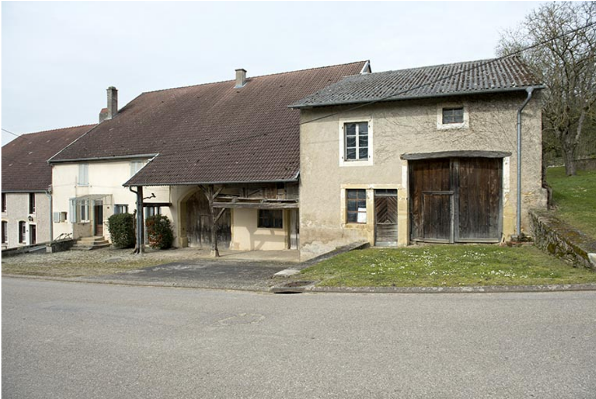
Fermes, Grande rue. 70, Aisey-et-Richecourt