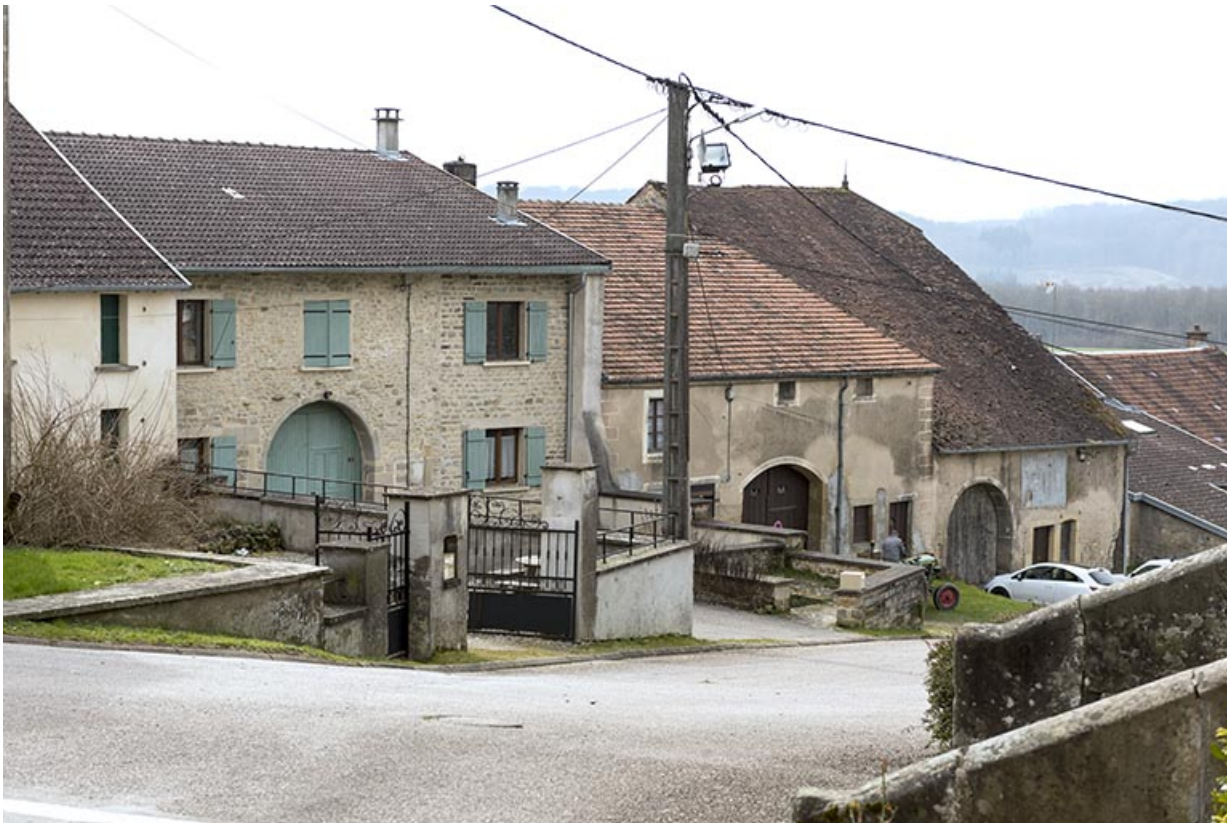
Alignement de fermes, haut de la Grande rue. 70, Aisey-et-Richécourt