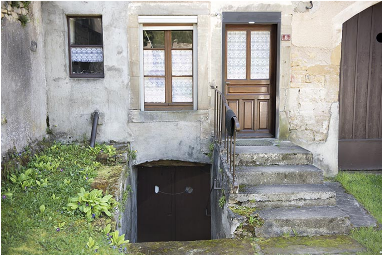
Entrée de cave.