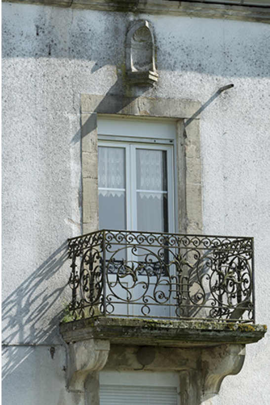
Détail d'une baie.