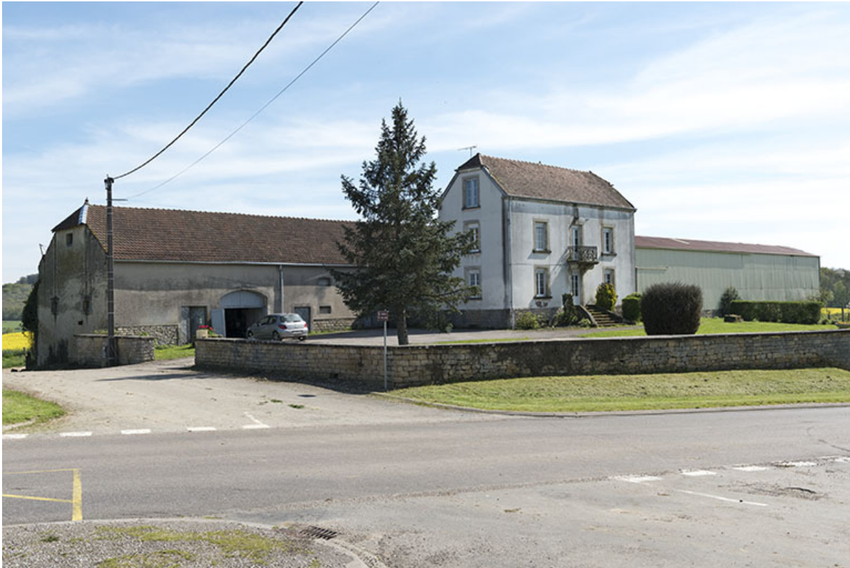
Ferme à l'entrée d'Aisey.