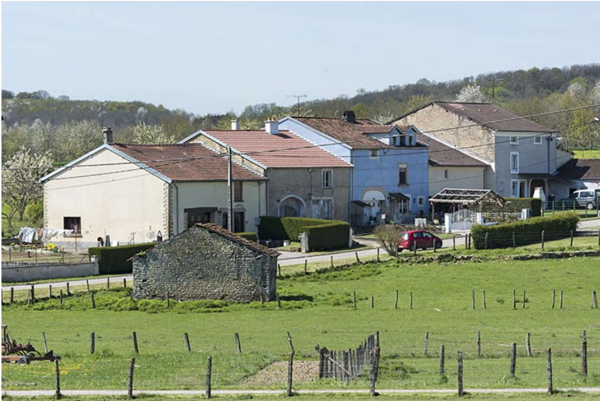
Alignement de fermes à Aisey.