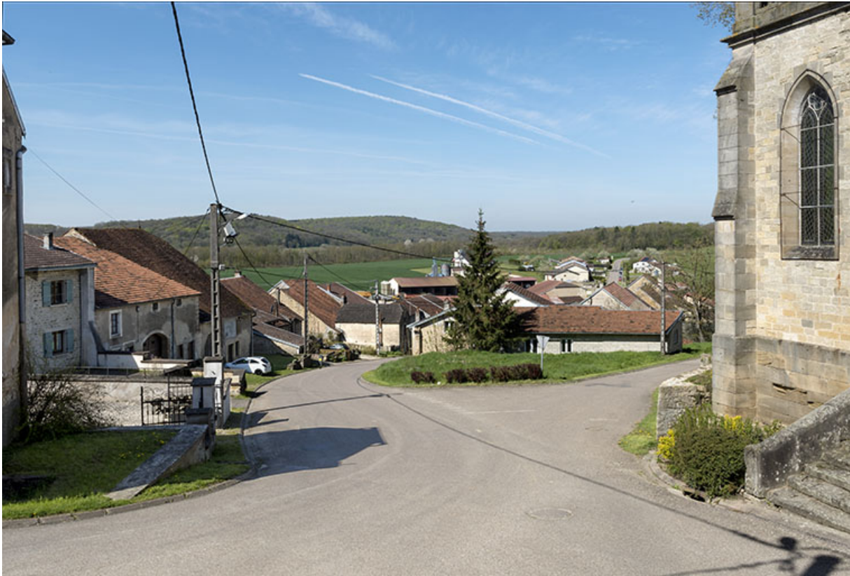
La Grande rue depuis l'église.