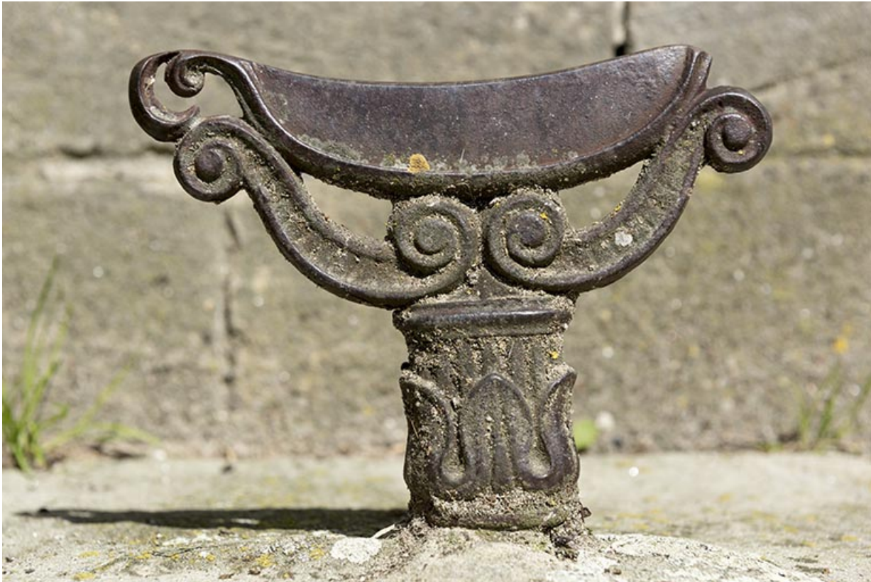
décrottoir à l'entrée de l'église.