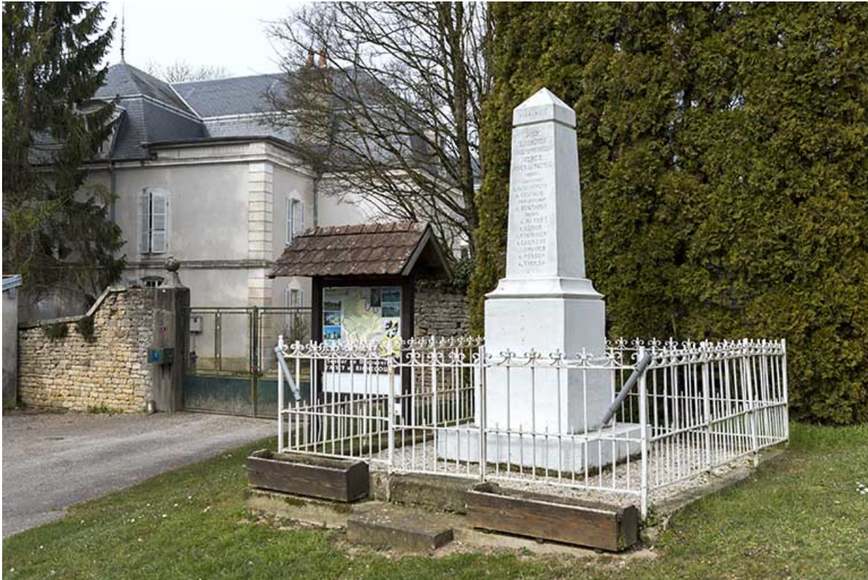
Le monument aux morts à proximité de l'église.