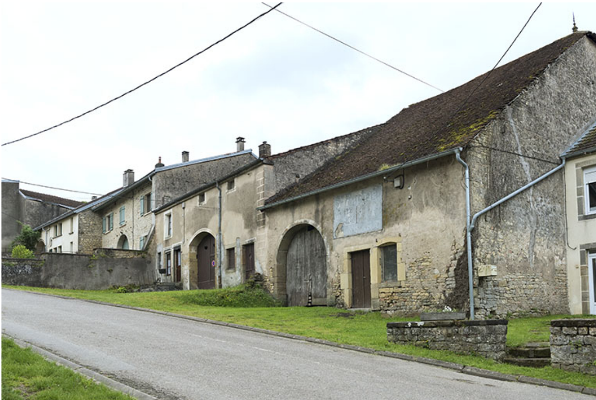
Alignement de fermes vigneronnes.