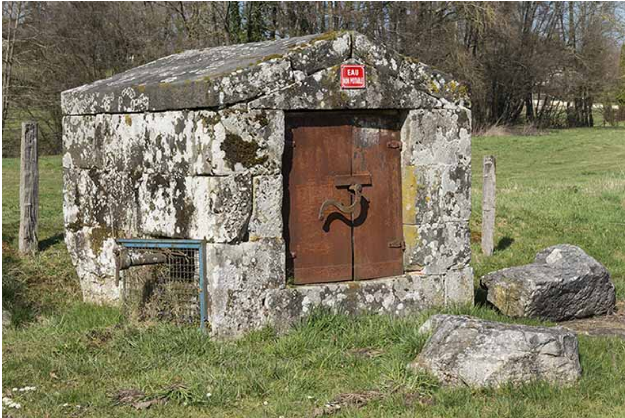
Ancien puits couvert.