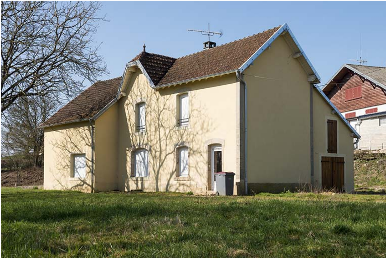
Ancienne halte ferroviaire.