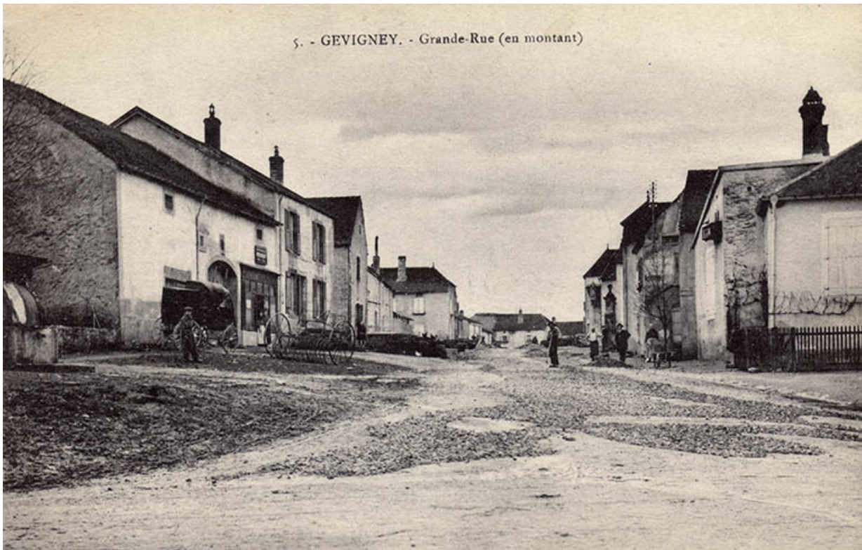
La Grande rue, carte postale (1909).