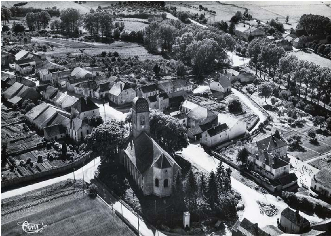
Vue aérienne de Gevigney, carte postale. 70, Gevigney-et-Mercey