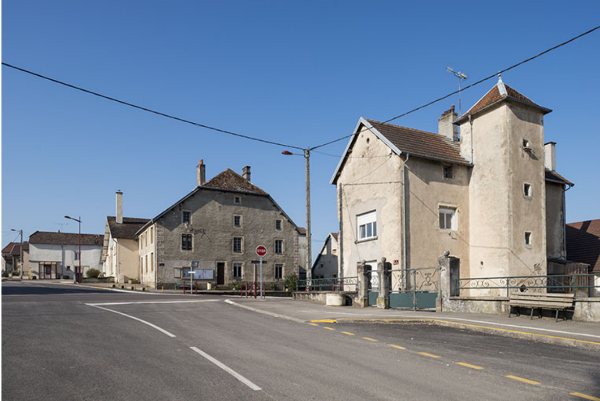
L'école et la mairie.