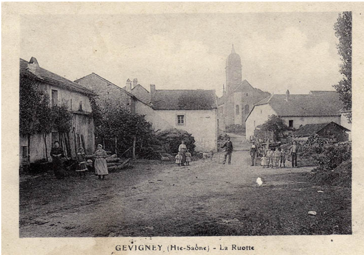
La Ruotte, carte postale.