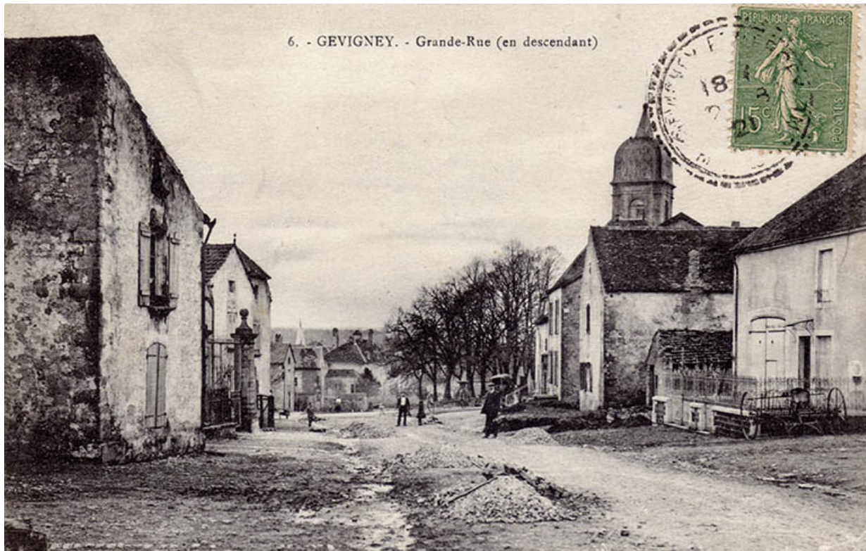
La Grande rue, en descendant, carte postale (1921). 70, Gevigney-et-Mercey