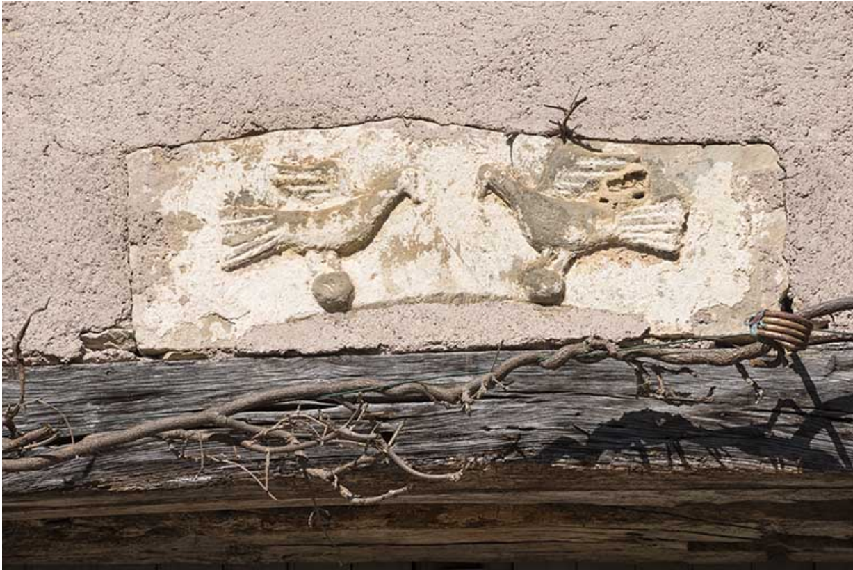
Détail d'un des linteaux.