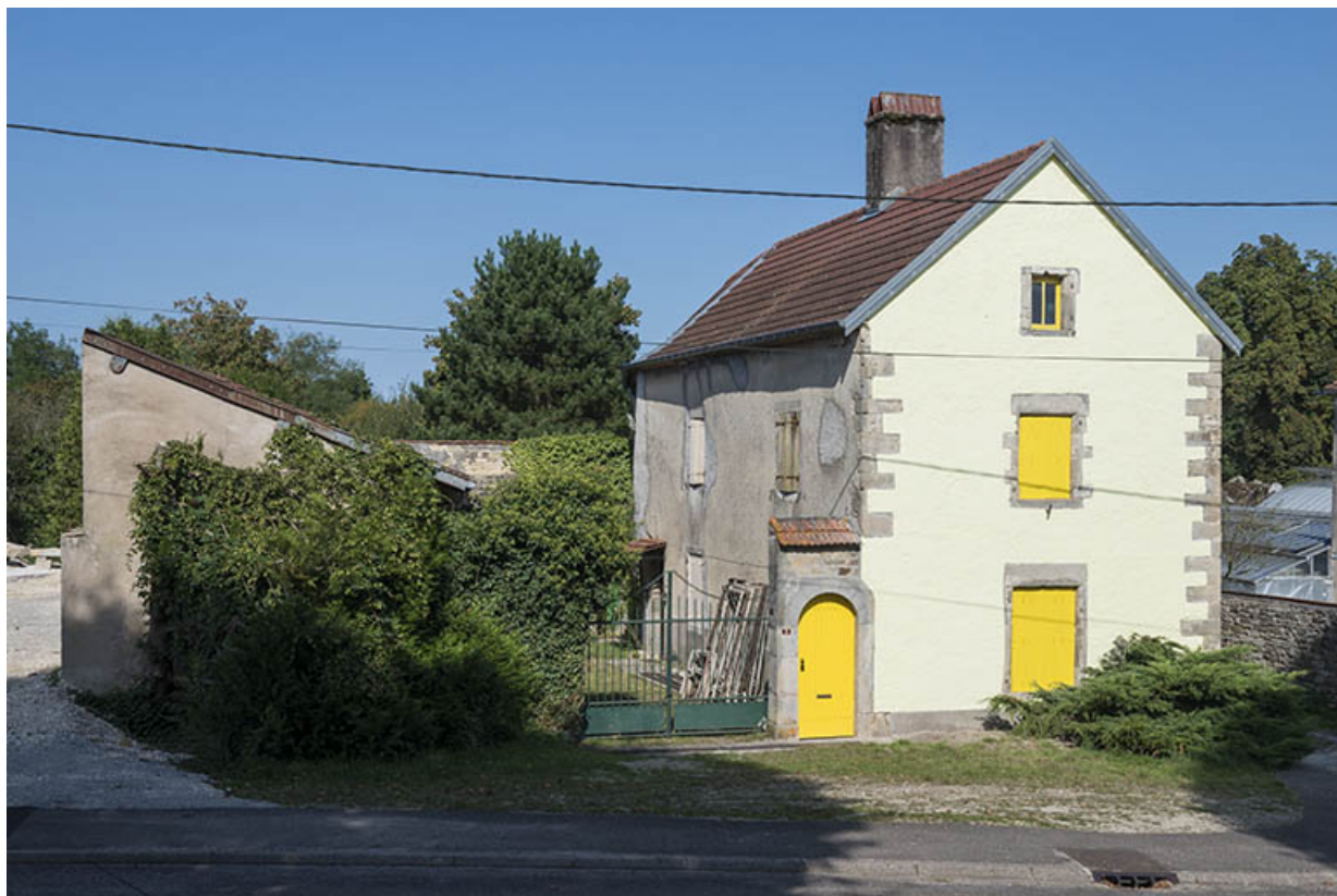
Ferme, rue Montgillard.