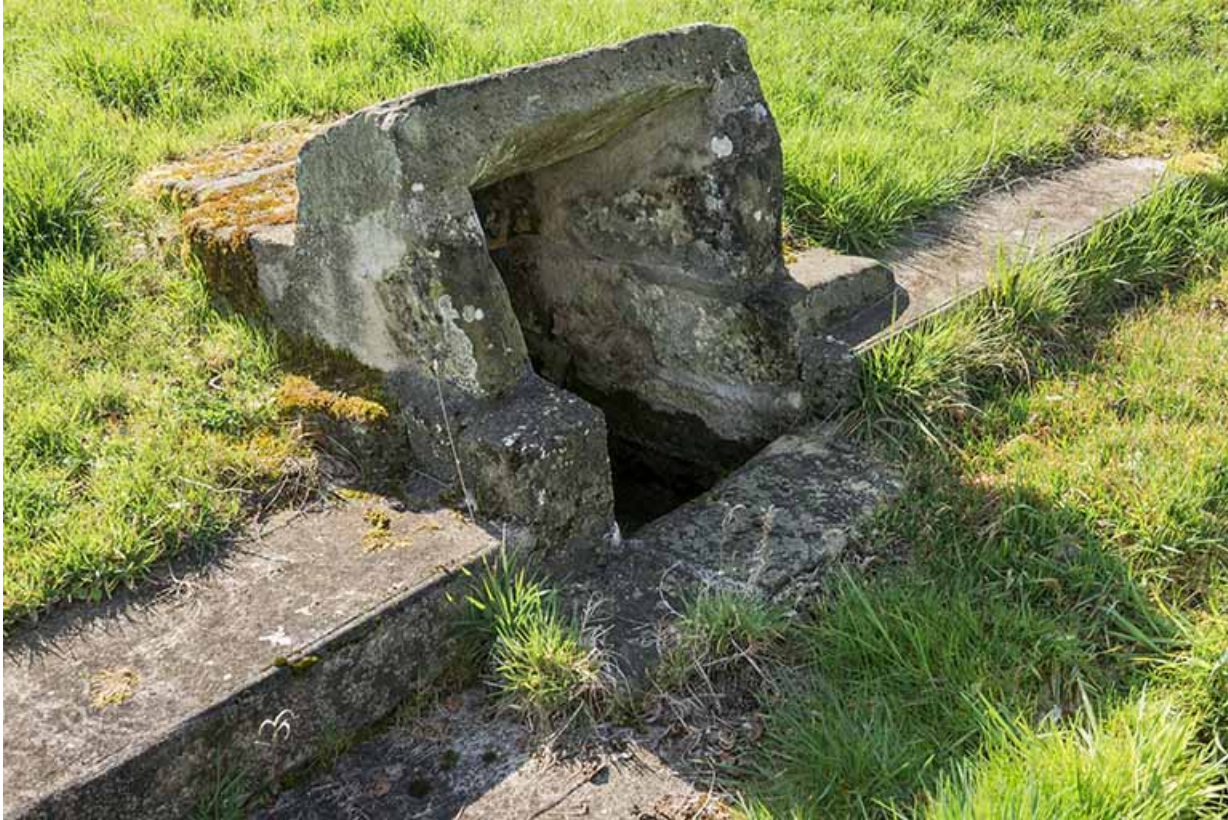
Fontaine d'alimentation du bassin.