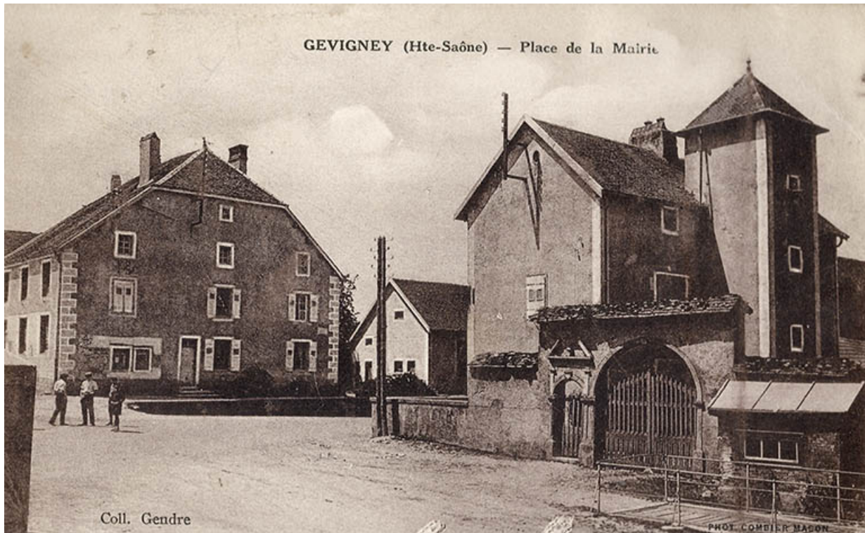
La place de la mairie, carte postale.