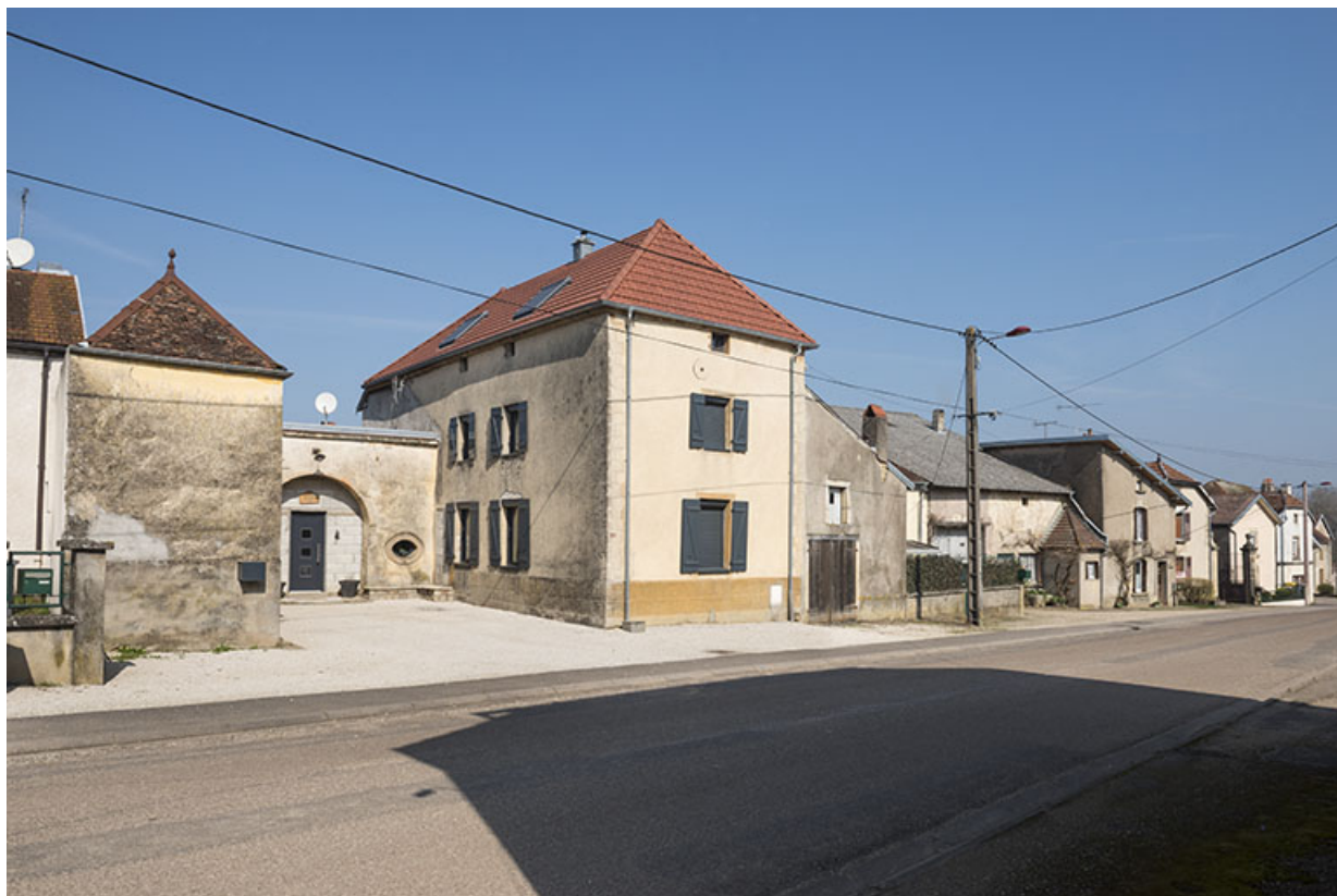
Vue générale, Grande rue.