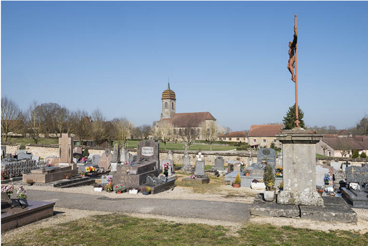
Le cimetière avec l'église en arrière plan.