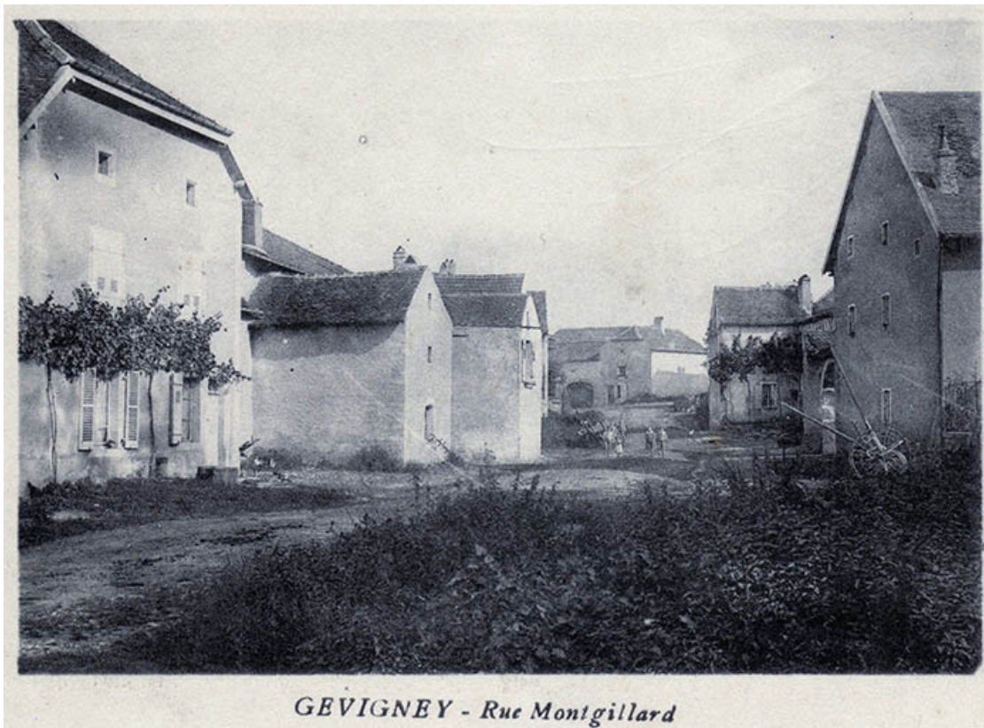
Alignement de fermes dans la rue Mongillard, carte postale (1891). 70, Gevigney-et-Mercey

Gevigney - Rue Mongillard, carte postale, 1891.