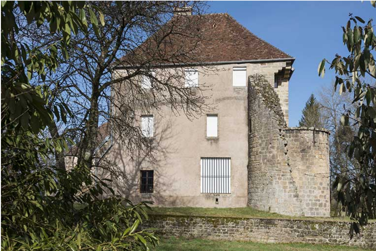
Le château de gevigney.