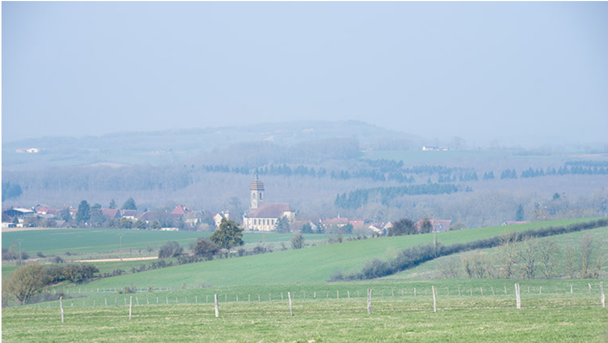
Le village de Gevigney, paysage.