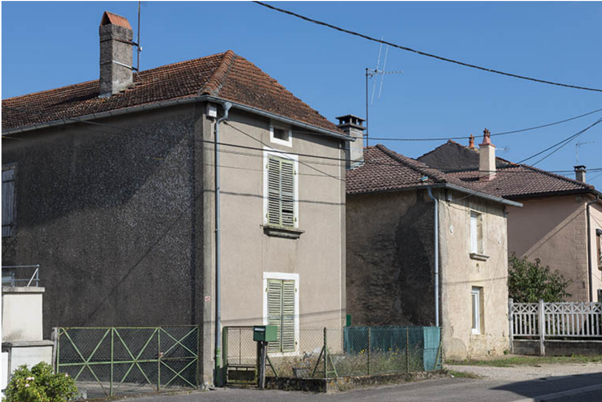
Alignement de fermes avec le logis en retour d'équerre.