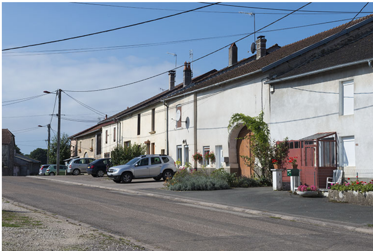
Vue générale, Grande rue.