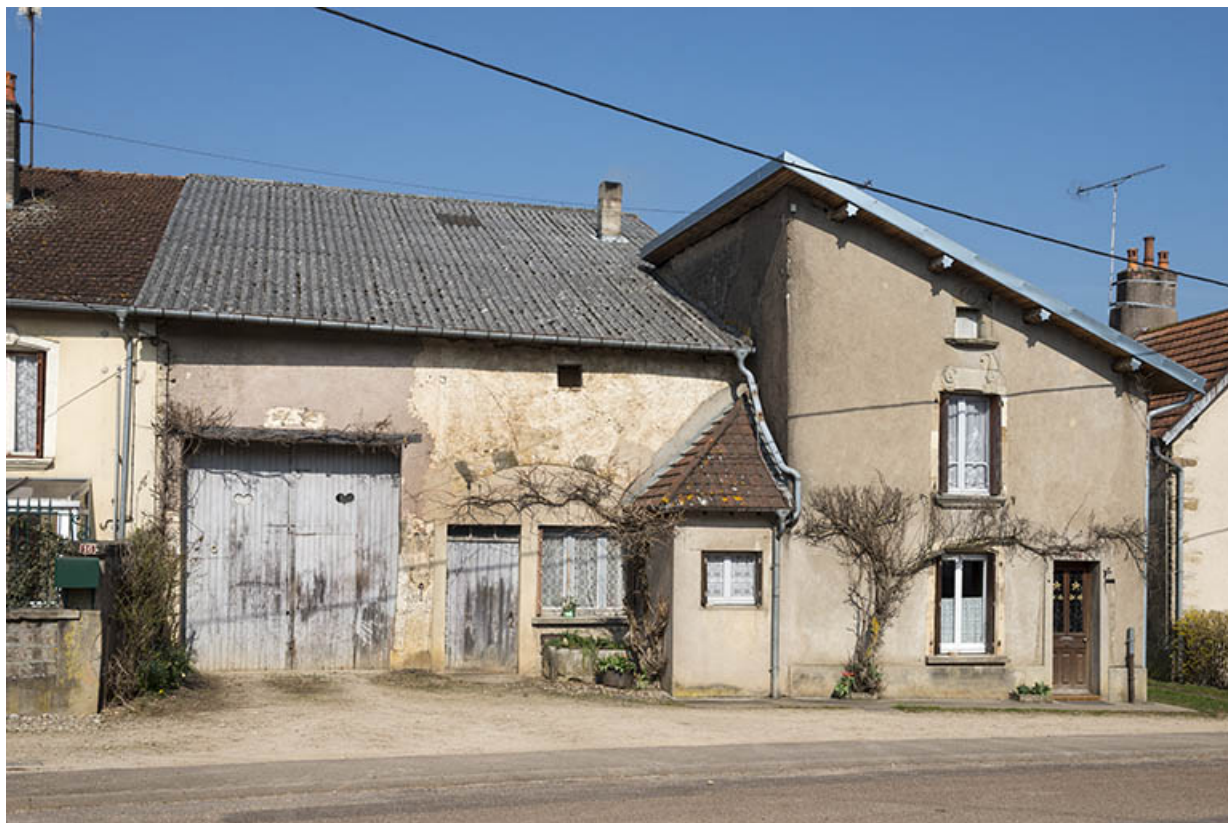
Vue générale de la maison.