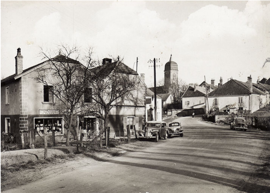
Epicérie-café Marsot, carte postale.