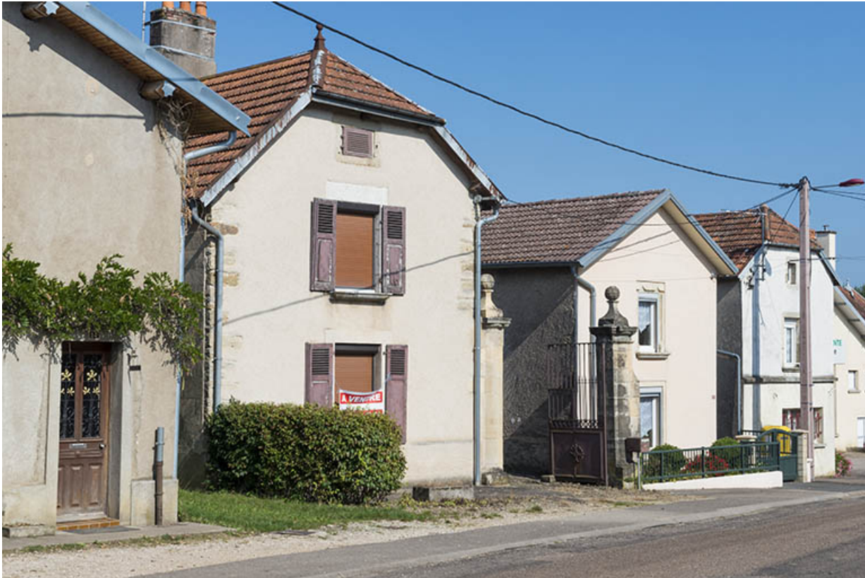
fermes avec "pignon sur rue".