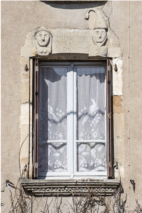
Fenêtre avec linteau décoré.