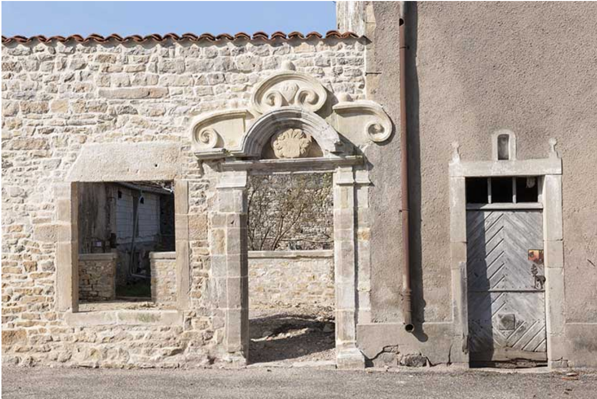
Porte reconstruite avec pierres de remploi. 70, Ormoy