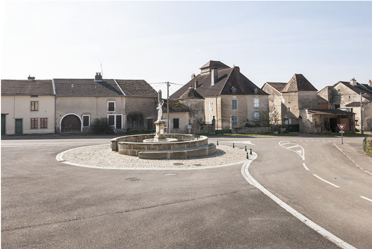
La fontaine du centre.