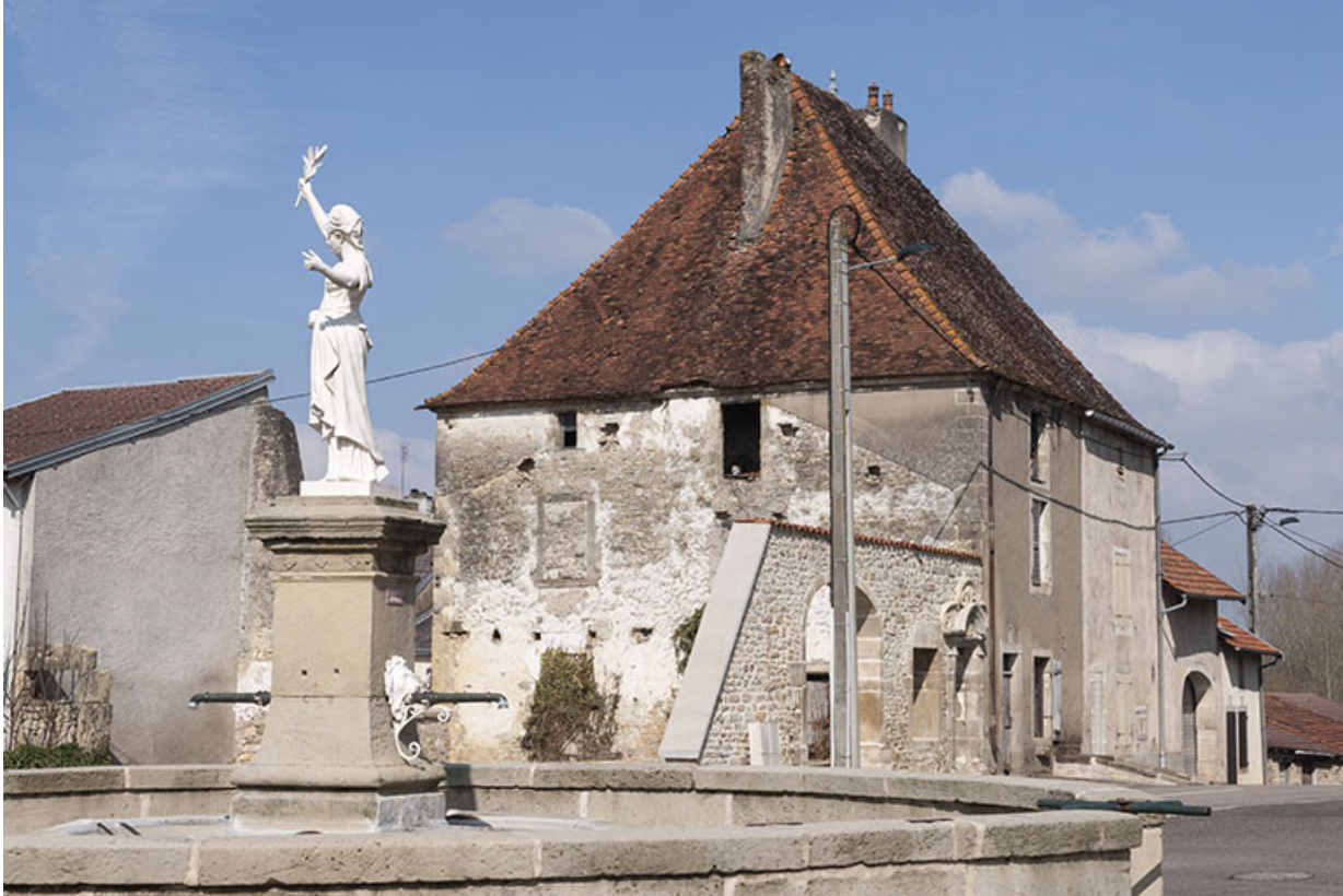
La fontaine et l'ancien presbytère.