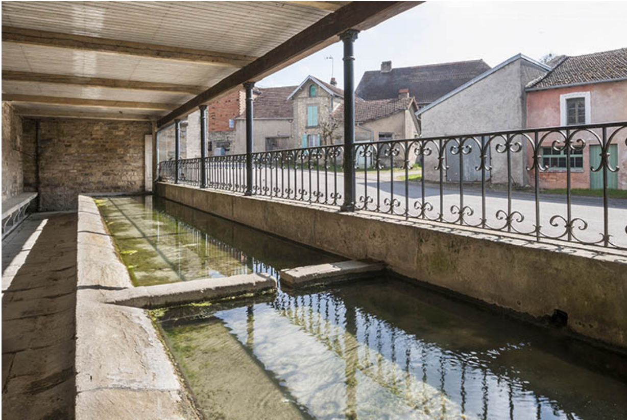
Lavoir, rue de la Vigne.