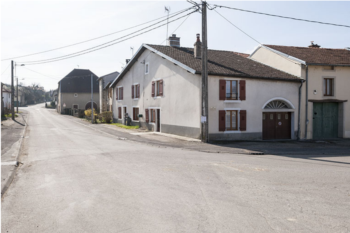
Maison, rue Antoine Lumière.