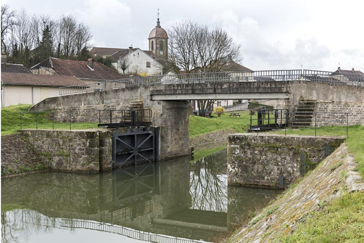
Porte de garde, Ormoy.