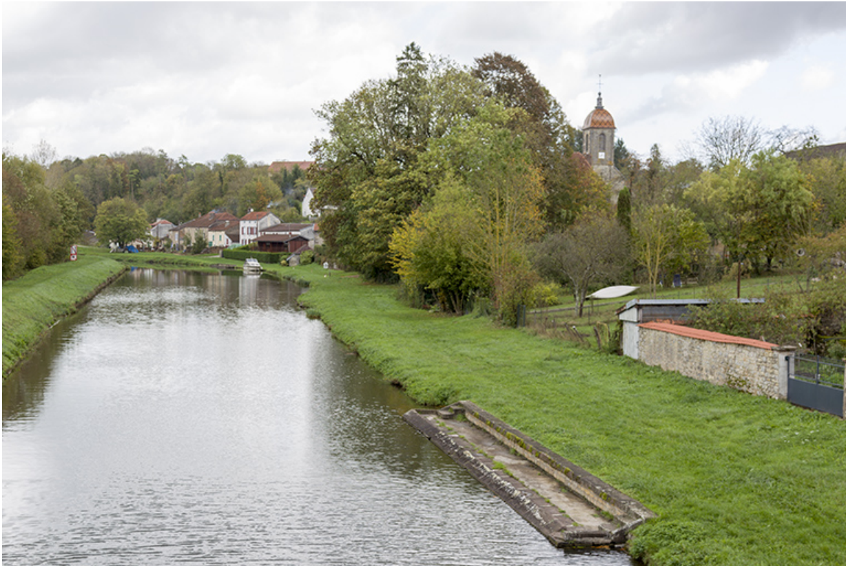
Le clocher de l'église depuis le pont.