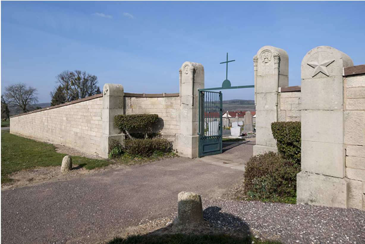
Portail d'entrée du cimetière.