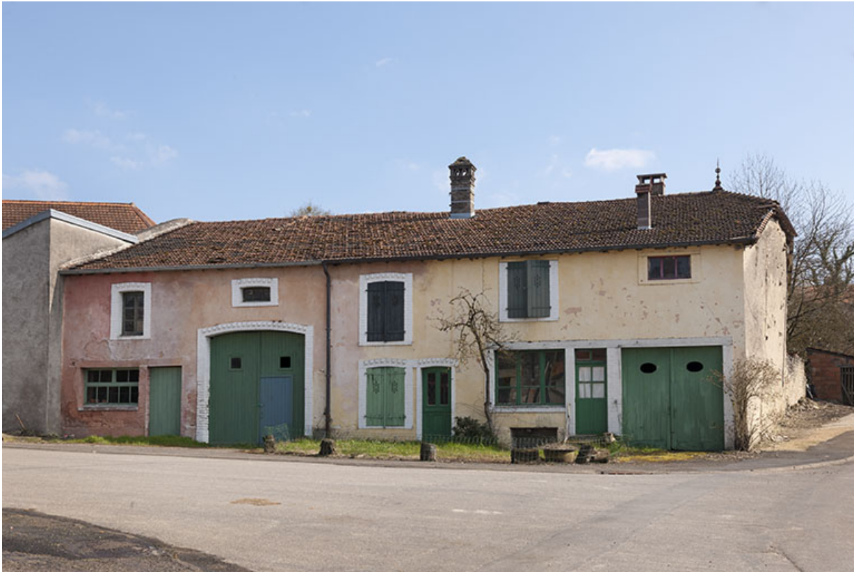
Maisons, rue de la Vigne.