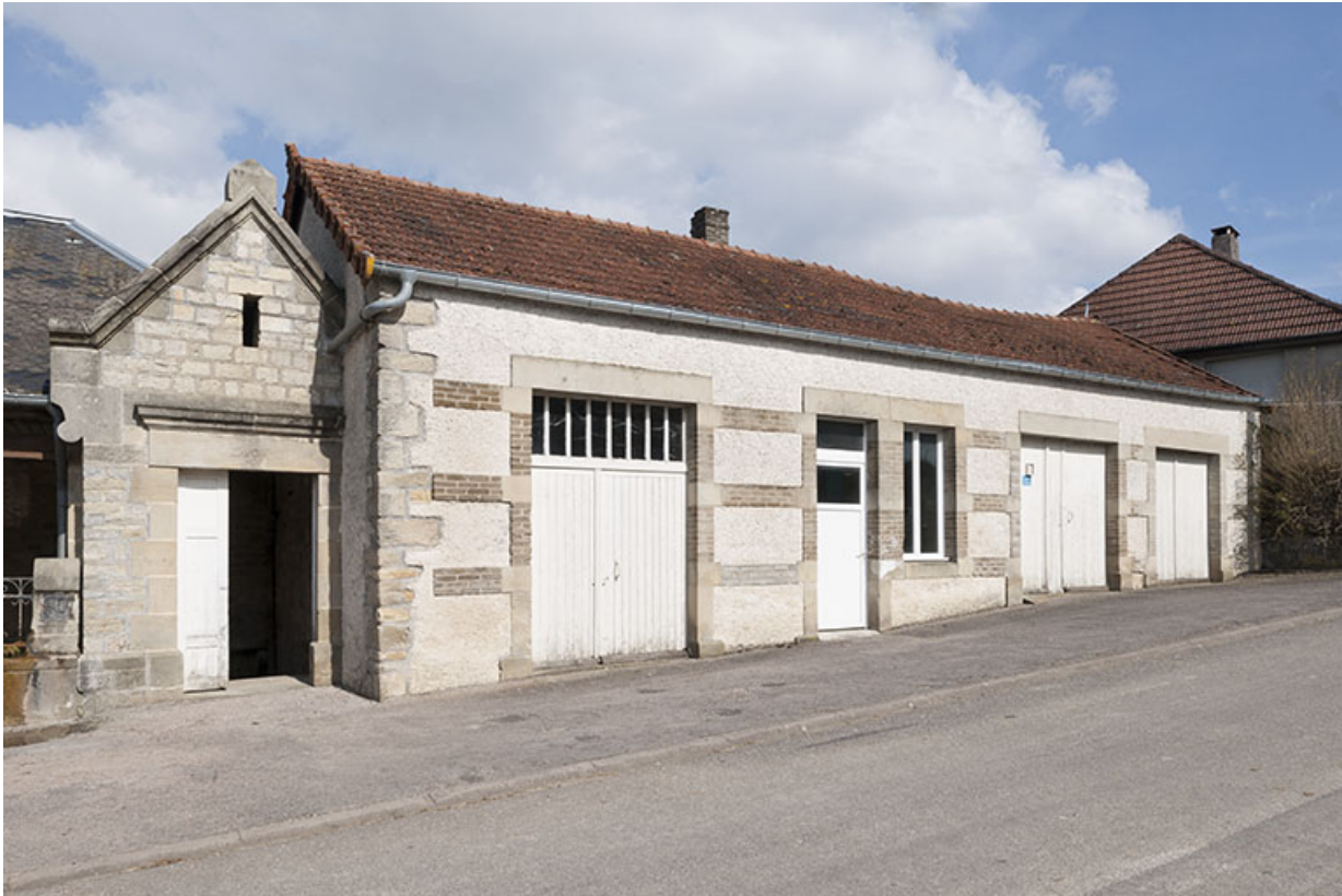
L'ancien four communal.