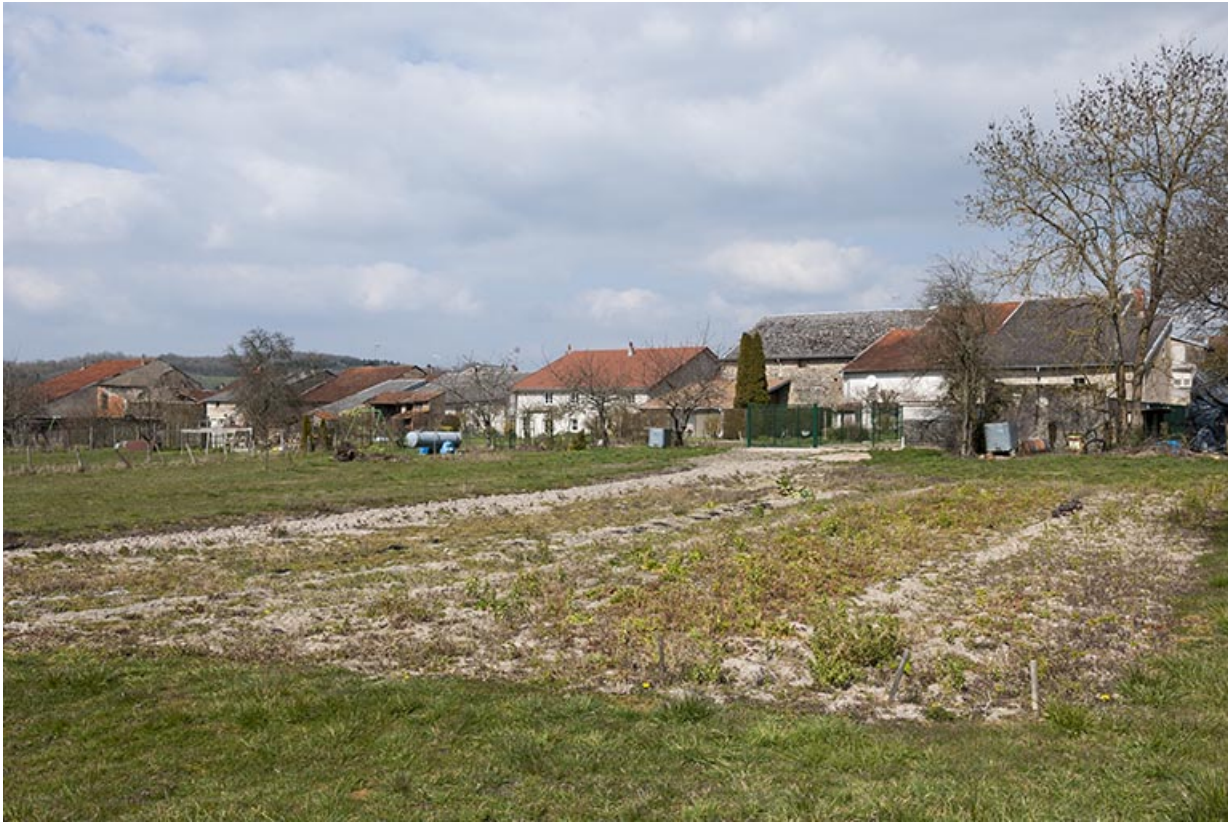
Prairies le long de la rue Aux Veaux.