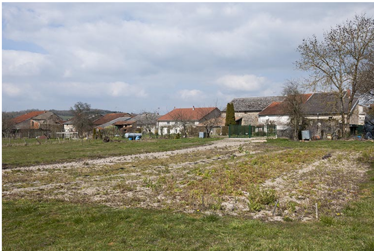
Prairies le long de la rue Aux Veaux.