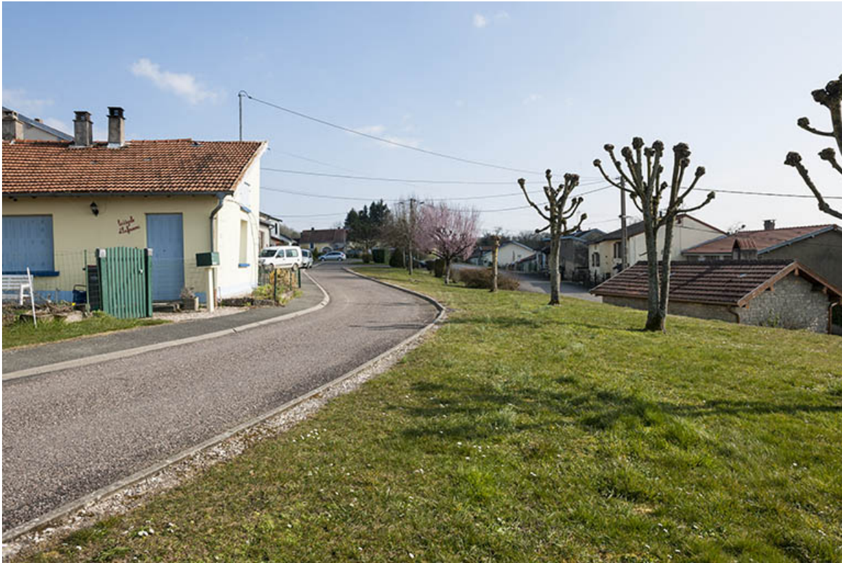
Vue sur le quartier du Crais Martinot. 70, Ormoy