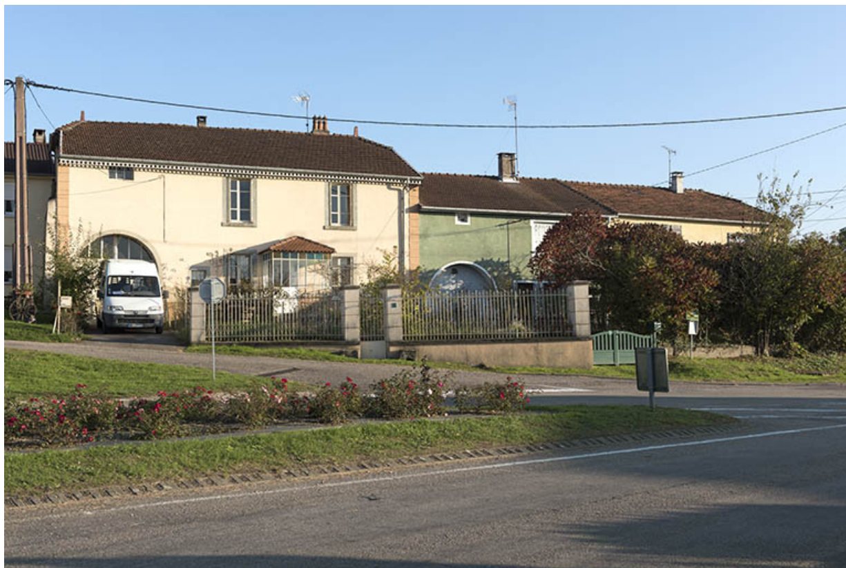
Vue sur un alignement de maisons du faubourg Louis Boulanger depuis la route au nord-ouest. 70, Corre