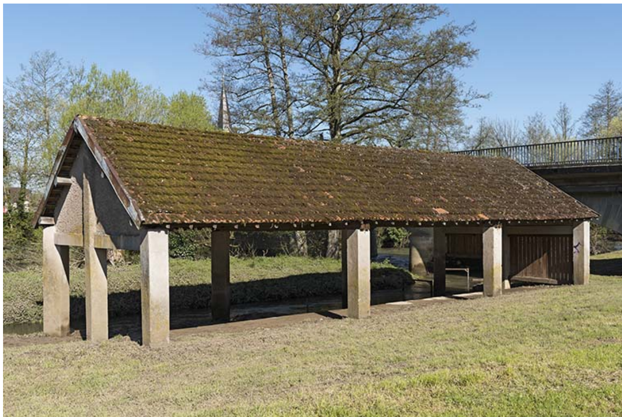
Ancien lavoir sur la rive gauche du Coney. 70, Corre