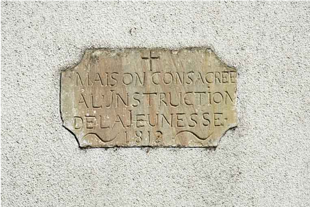
Détail : Maison 2 rue Jean Monnasson, à l'angle de la rue Emile Hauviller. 70, Corre