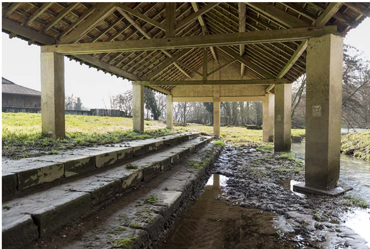
Sous l'ancien lavoir.