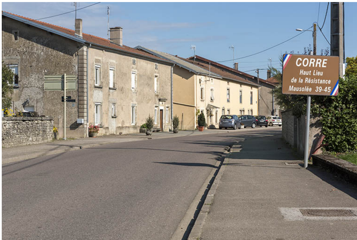
Entrée du village par la rue Maurice Boulanger. 70, Corre