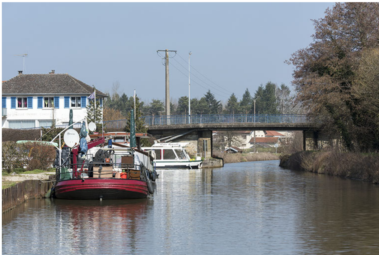
Pont sur le canal, vu de l'aval.