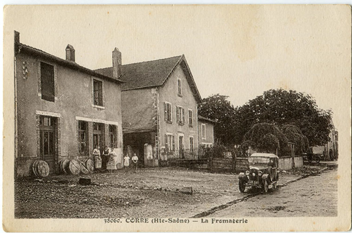
Ancienne fromagerie rue Billecard. Carte postale. 70, Corre