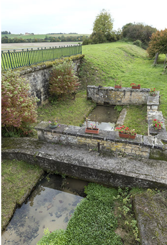
Ancien lavoir à l'ouest du village, rue Maurice Boulanger. 70, Corre