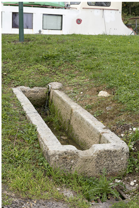
Partie d'un ancien lavoir, à l'emplacement d'un lavoir mentionné sur le cadastre non loin de la capitainerie. 70, Corre