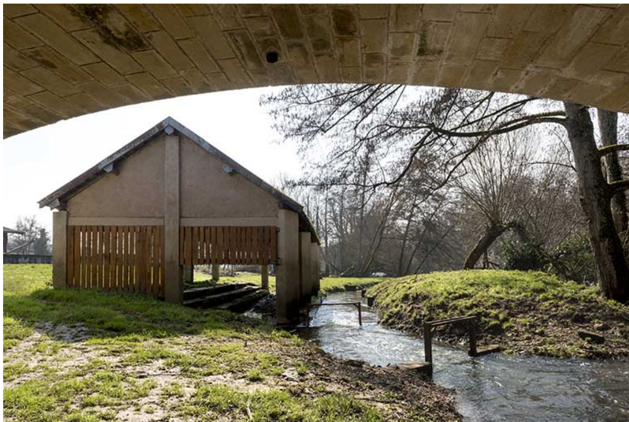
Vue du dessous du pont, le pignon nord de l'ancien lavoir. 70, Corre