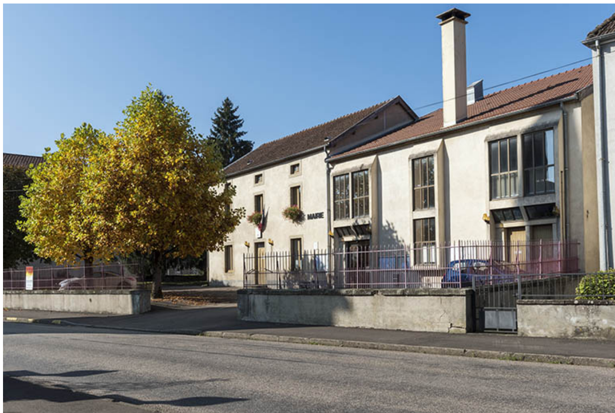
Vue sur la mairie depuis le nord-est.