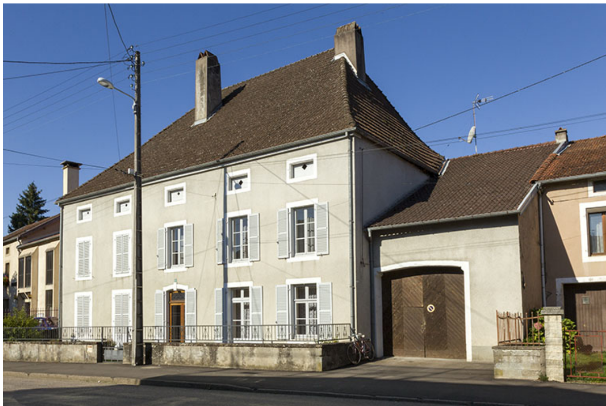
L'ancienne poste, 3 rue Emile Hauviller. 70, Corre