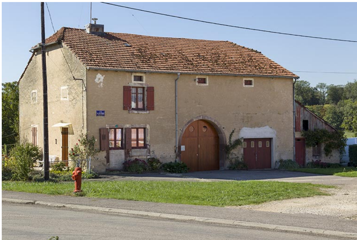
Vue de trois-quart de la façade antérieure nord-est de la ferme située 4 rue du faubourg Louis Boulanger. 70, Corre