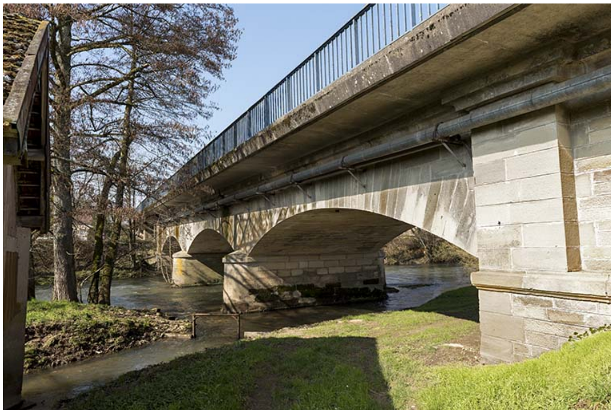
Le pont sur le Coney vu de la rive gauche en aval. 70, Corre