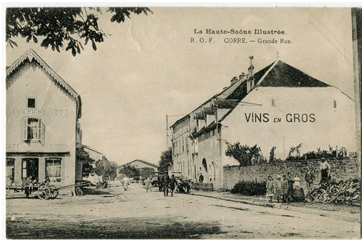
Grande rue et place dite aujourd'hui général de Gaulle. Carte postale. 70, Corre rue Jean Monasson