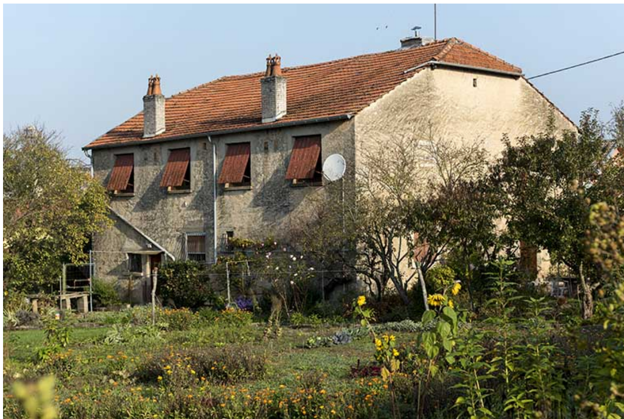
Vue de trois-quart sud-est de la ferme située 4 rue du faubourg Louis Boulanger. 70, Corre