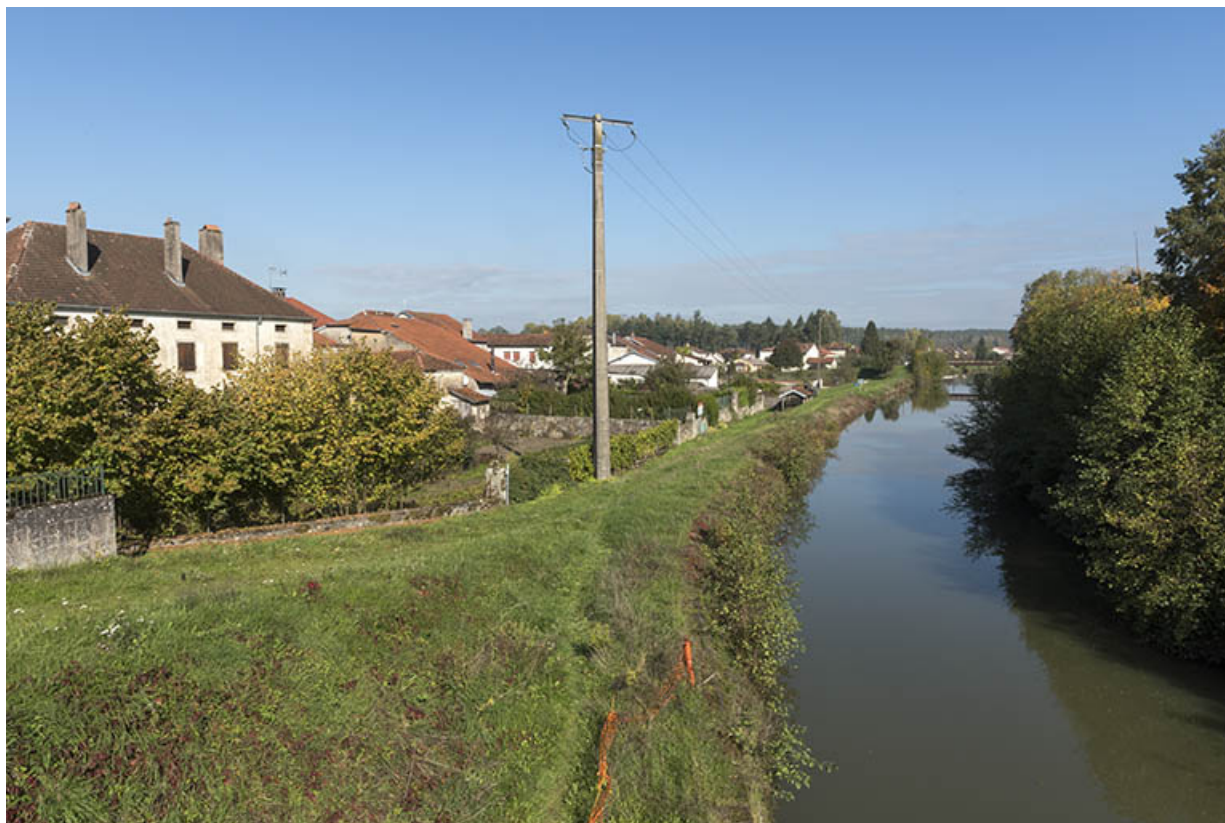
Depuis le pont sur le canal et le Coney, vue sur l'amont et la façade postérieure du presbytère. 70, Corre