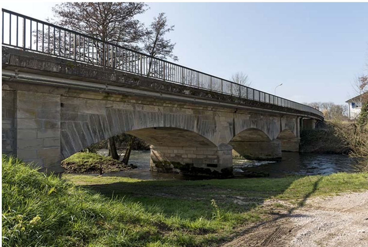
Le pont sur le Coney vu de la rive gauche en amont. 70, Corre