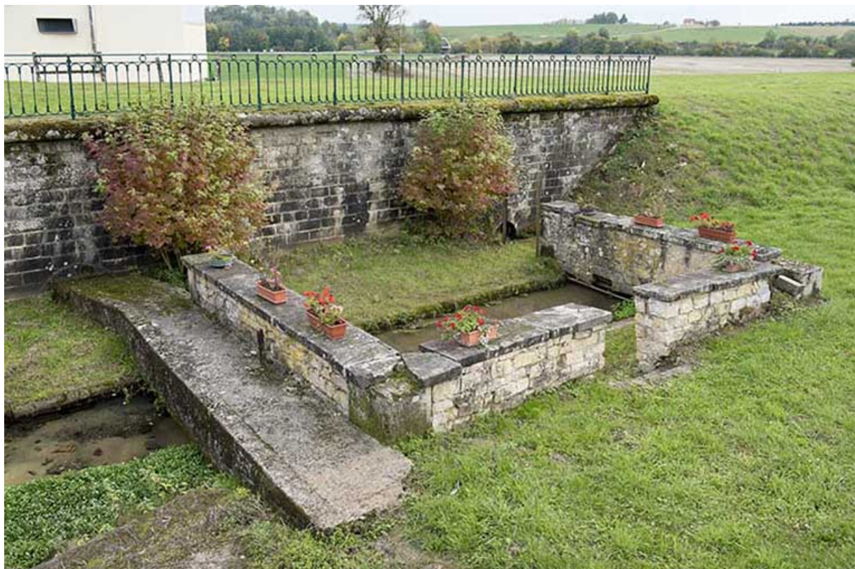
Vue rapprochée de l'ancien lavoir à l'ouest du village, rue Maurice Boulanger. 70, Corre