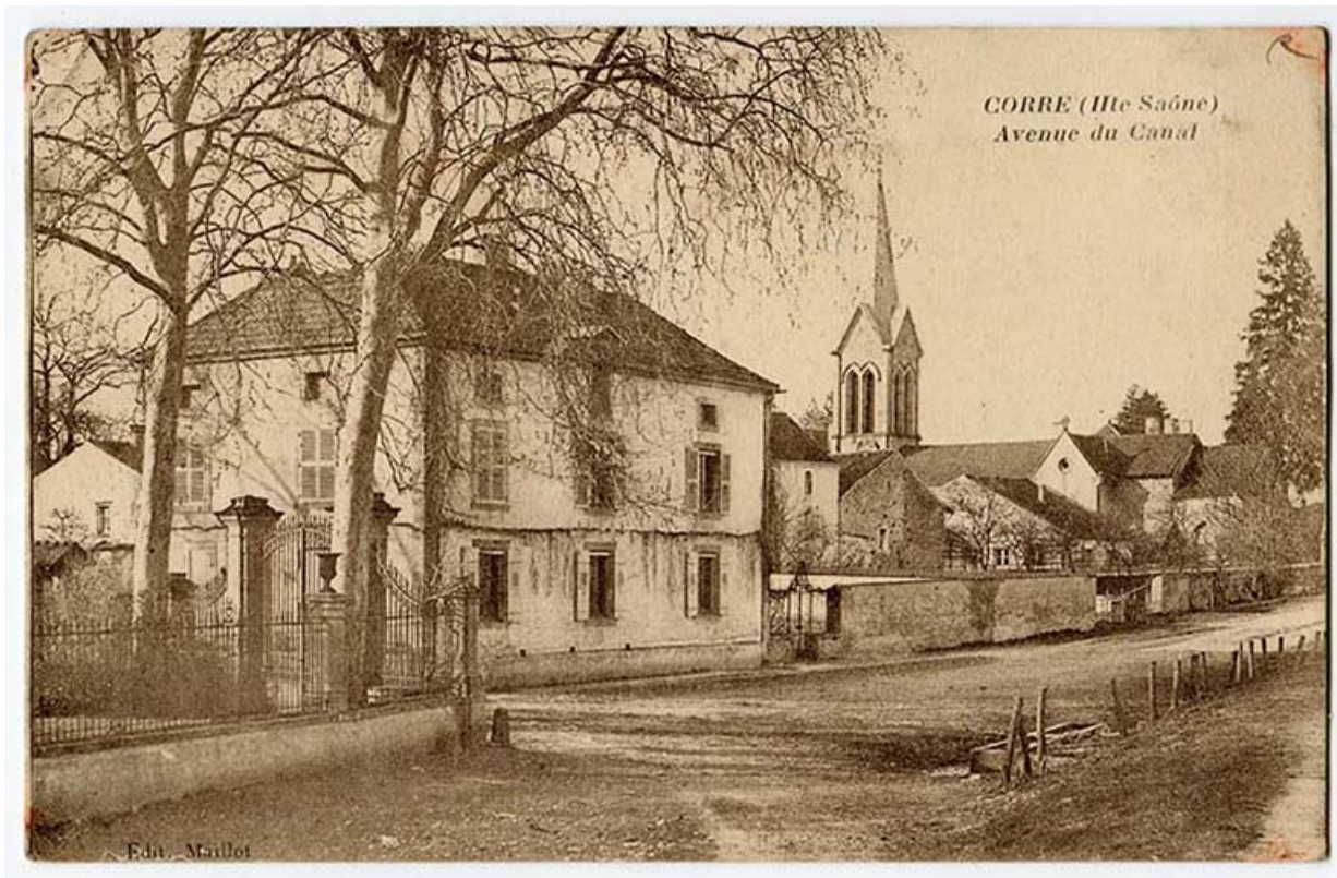
Avenue du canal et vue sur l'église rénovée. Carte postale.