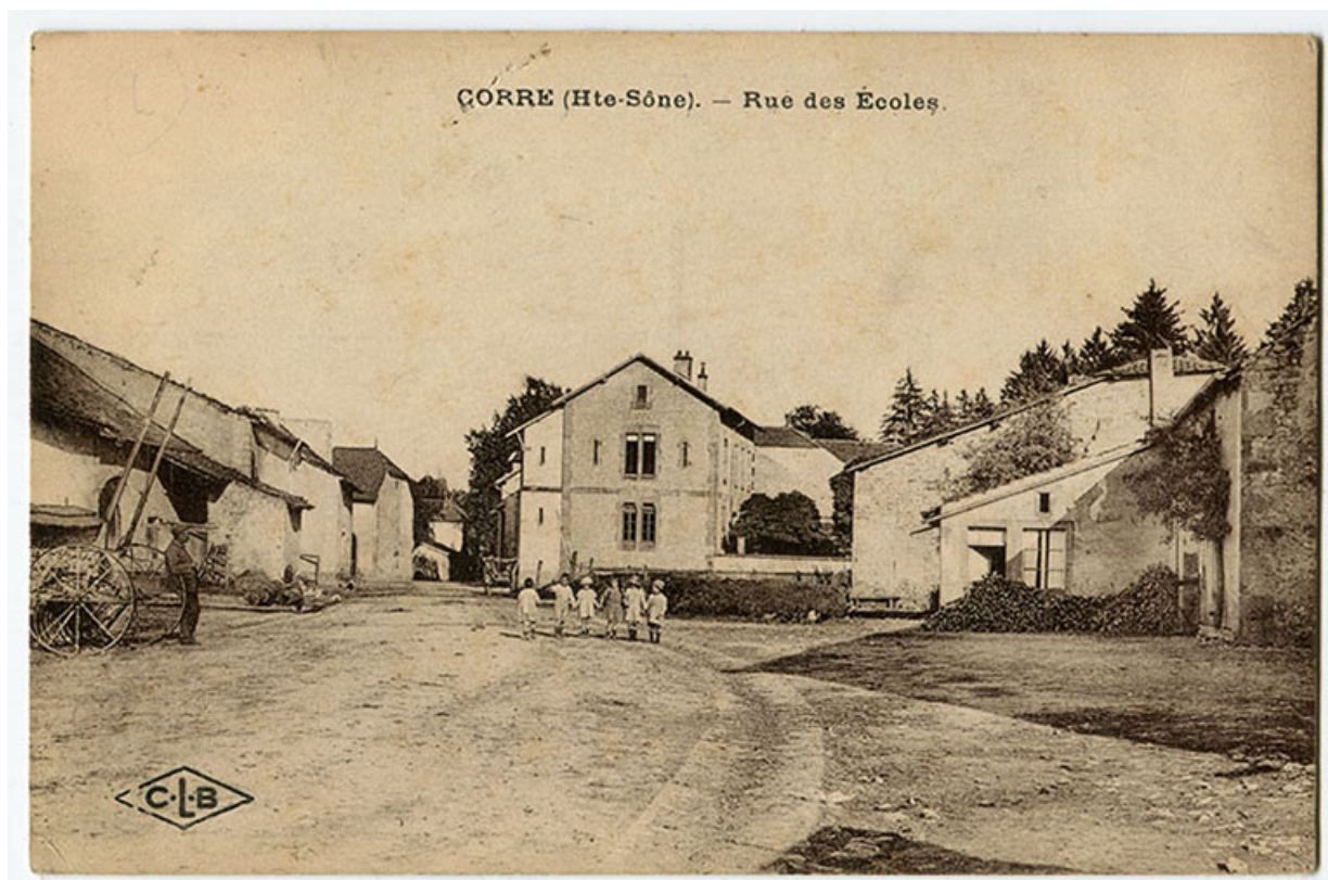
Rue des écoles, actuellement rue Billecard. Carte postale.