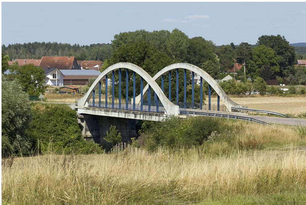
Le pont sur la Saône au sud-ouest du village. 70, Corre