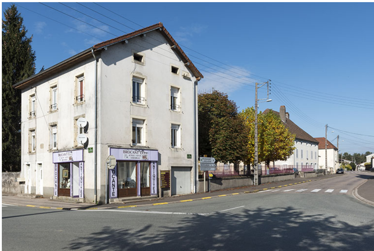
Maison 2 rue Jean Monnasson, ancienne maison commune, qui porte la date 1812, abrita la mairie et une salle de classe. 70, Corre