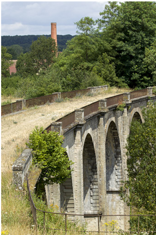
Le tablier du viaduc.