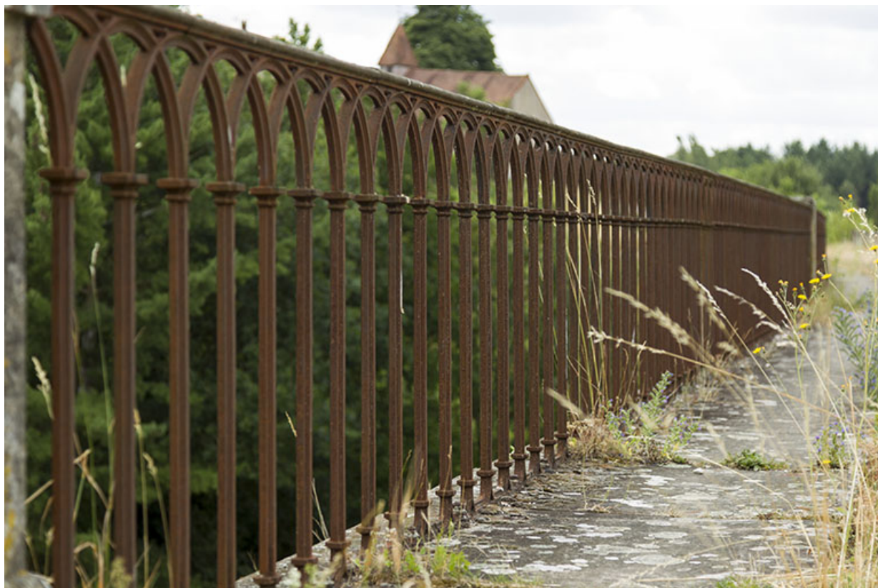
Détail du garde-corps.