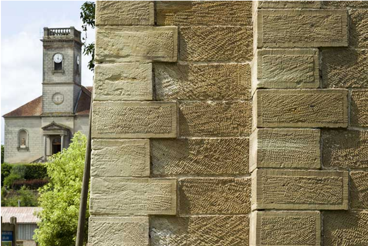
Détail de la maçonnerie des piles du viaduc.