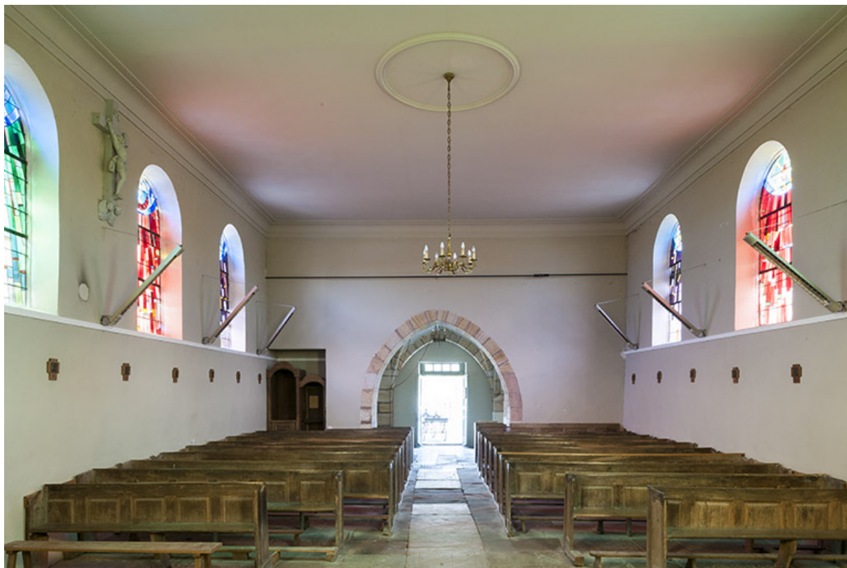
La nef depuis le chœur.

70, Montureux-lès-Baulay rue de l' Église