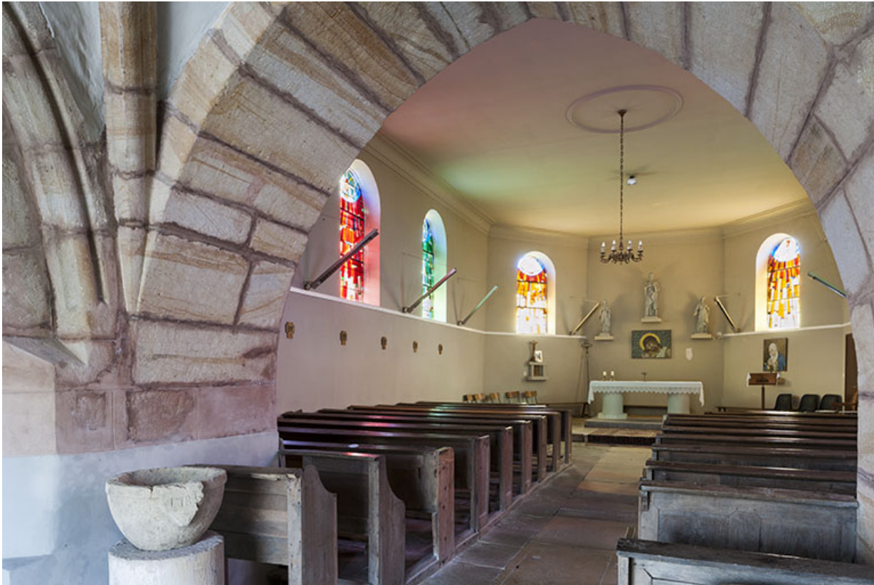
Détail du porche avec la nef en arrière plan.

70, Montureux-lès-Baulay rue de l' Église