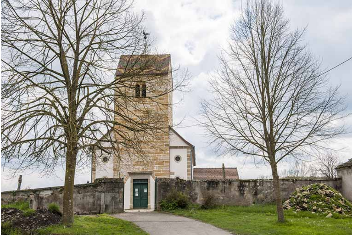
Vue depuis la route de l'Eglise.

70, Montureux-lès-Baulay rue de l' Église