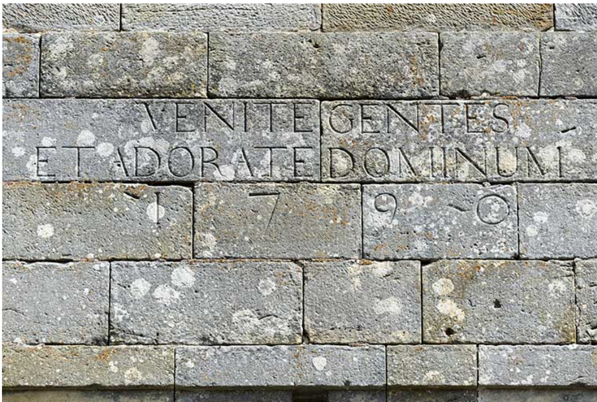
Inscription en latin figurant sur la façade antérieure de l'édifice.