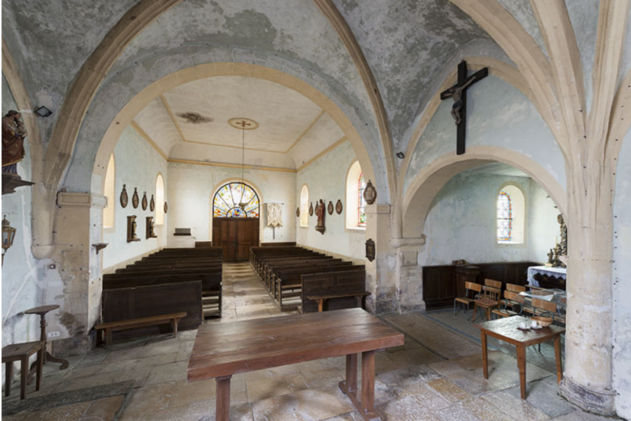
Le chœur et l'ancienne chapelle seigneuriale.