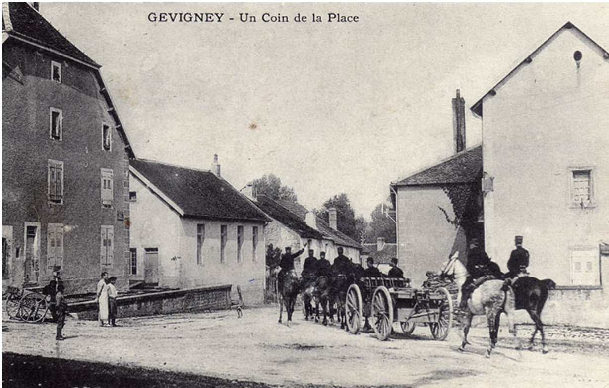
La place de Gevigney, carte postale (1917). 70, Gevigney-et-Mercey