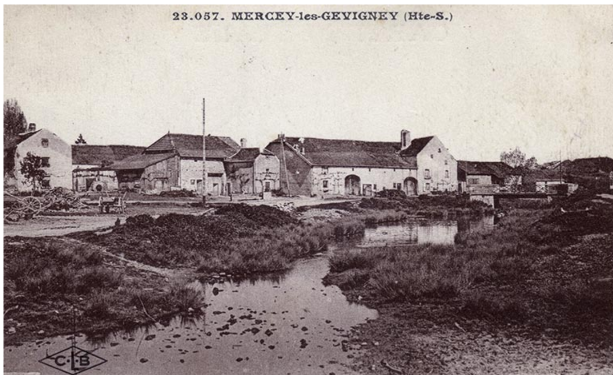
Mercey, carte postale.