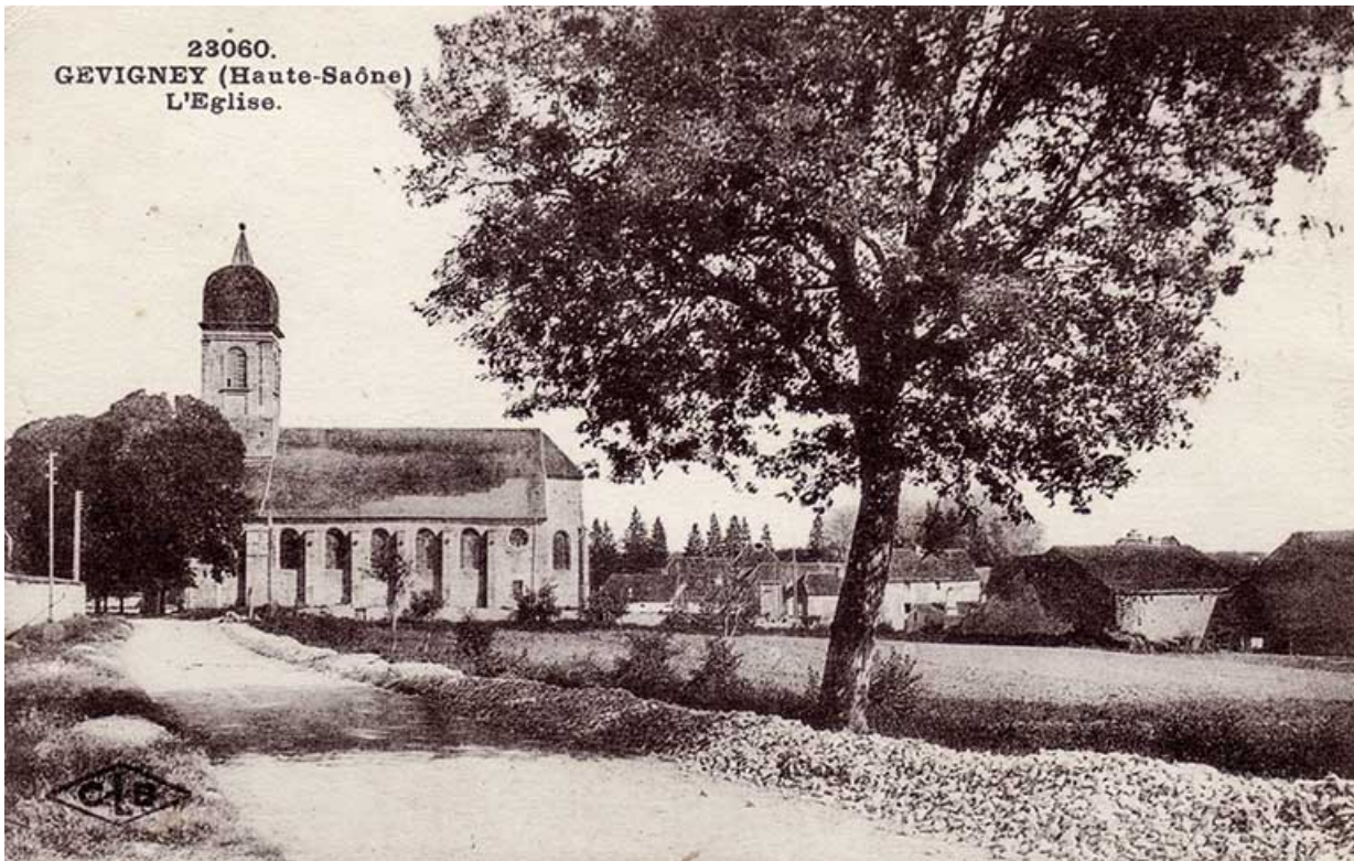
Vue sur l'église et le village de Gevigney depuis la route allant vers Mercey, carte postale. 70, Gevigney-et-Mercey

Gevigney (Haute-Saône) - l'église 23060, carte postale, 1930.