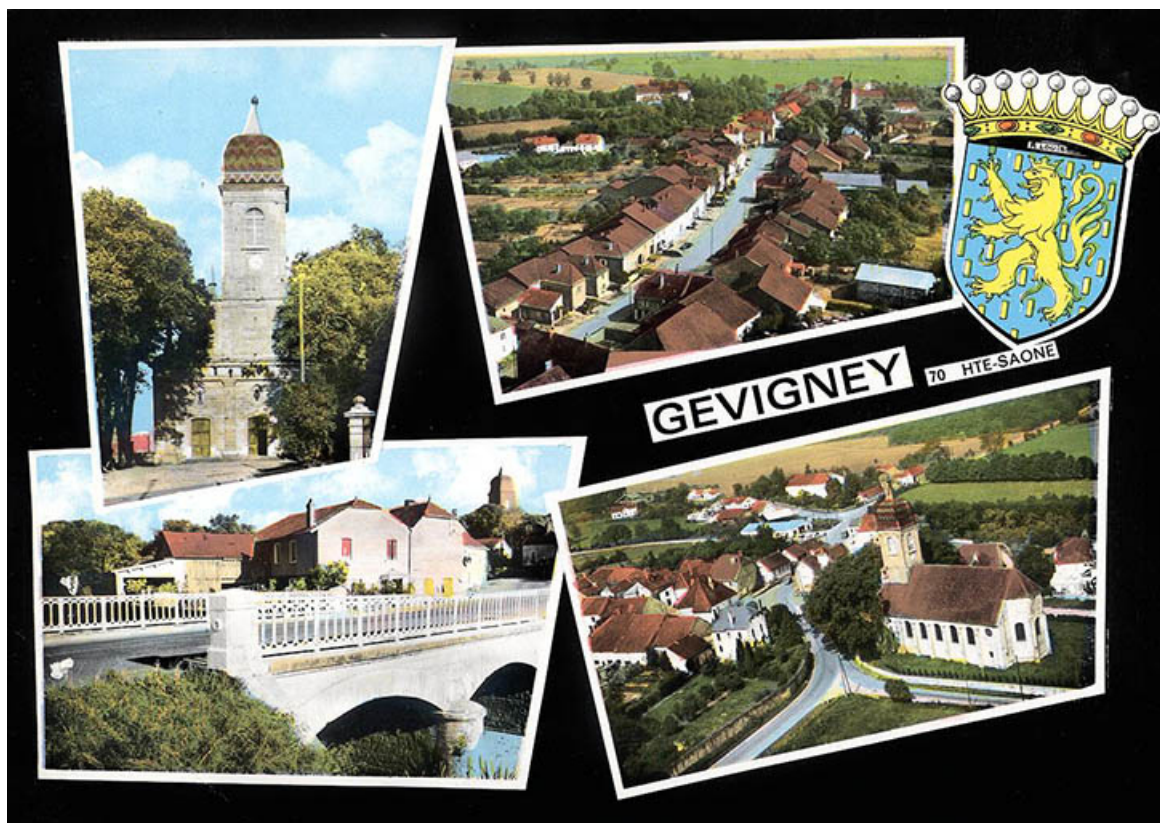
Souvenir de Gevigney-et-Mercey, carte postale. 70, Gevigney-et-Mercey