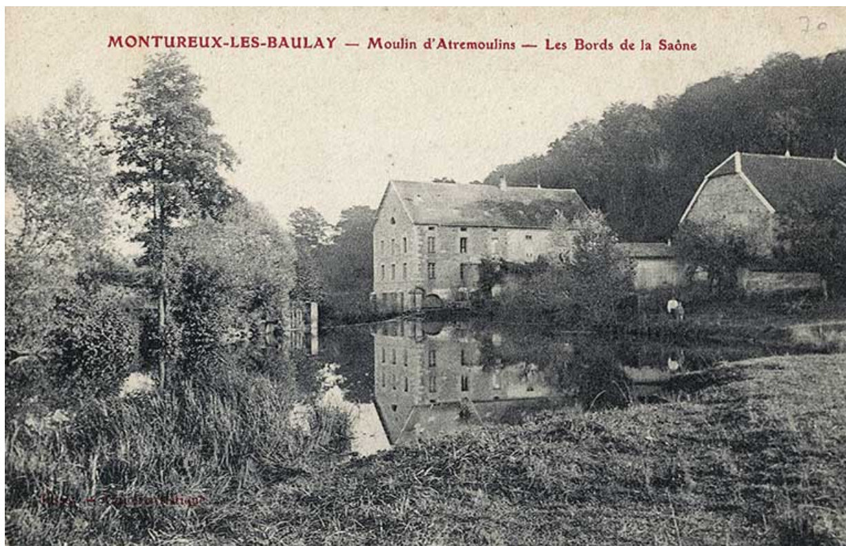
L'atre Moulin, carte postale.