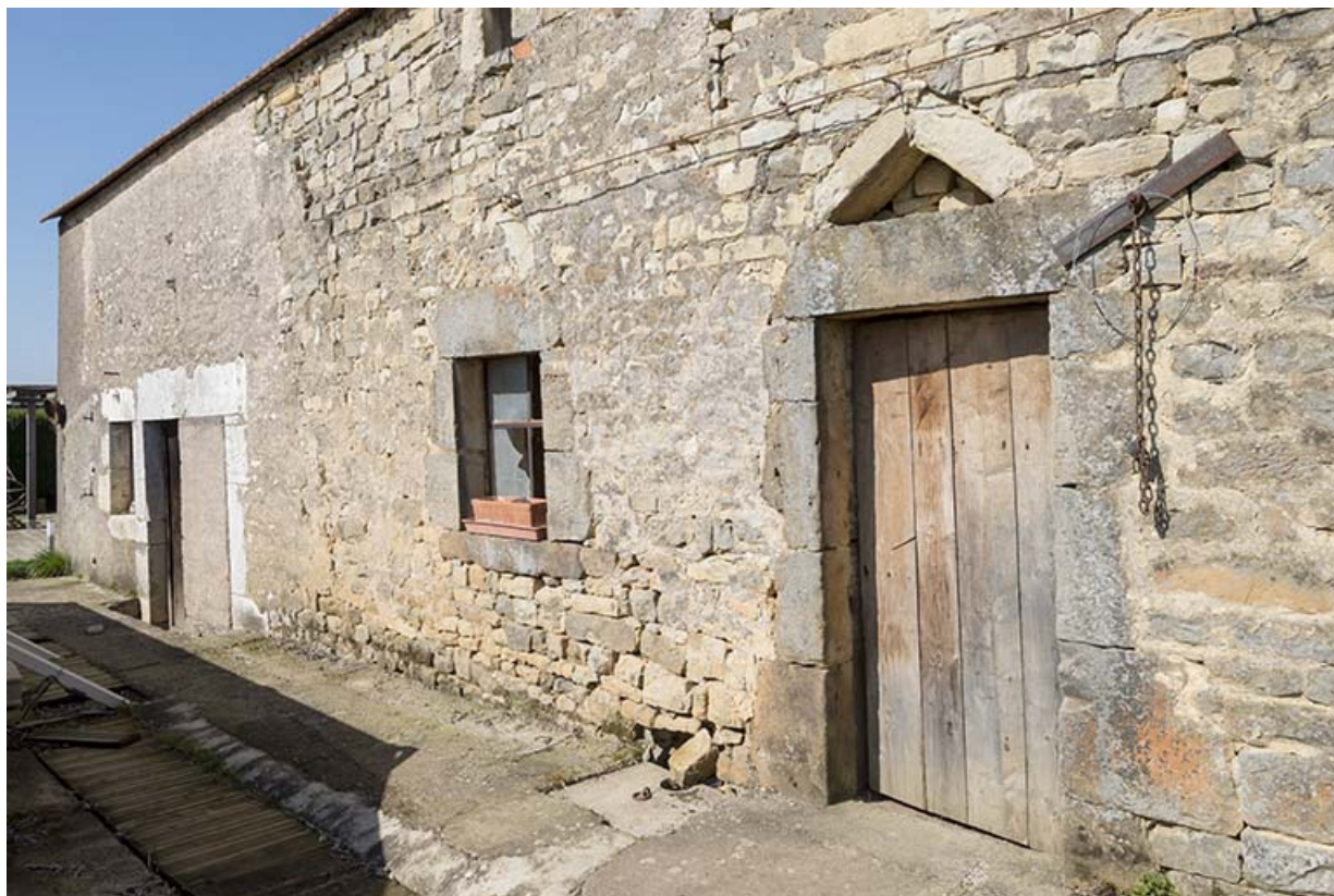
Façade postérieure de la maison.