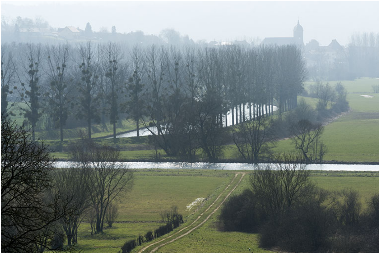
Le bief de navigation, la Saône et le village d'Ormoy en arrière plan.