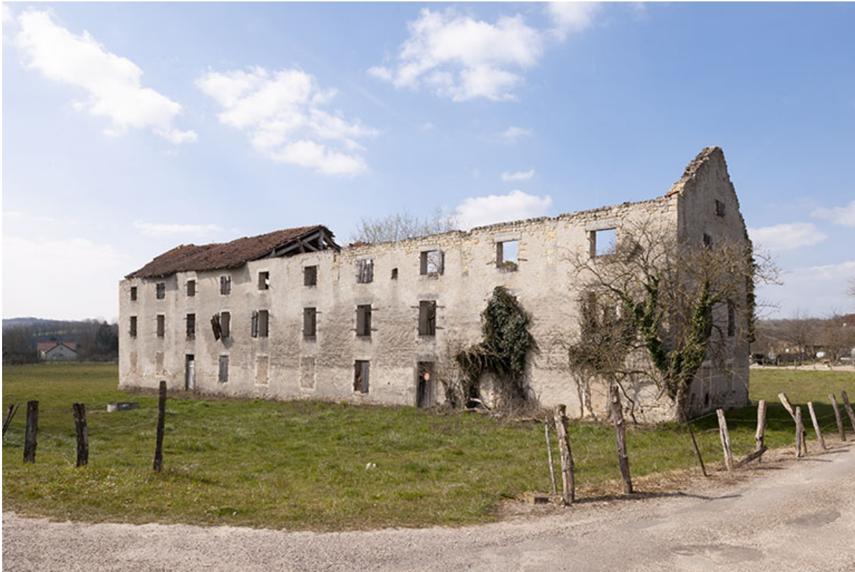
Ancienne manufacture de tabac.