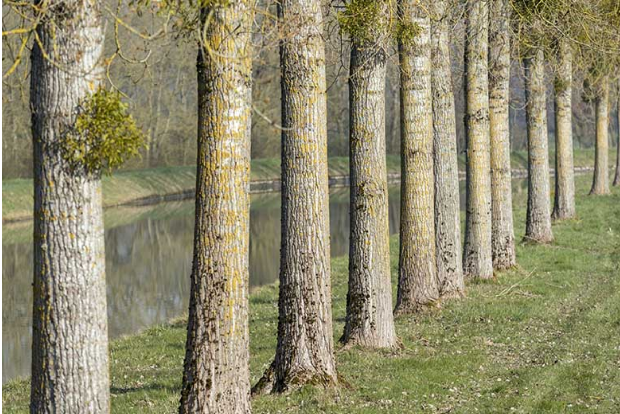
Alignement d'arbres le long du bief de dérivation.