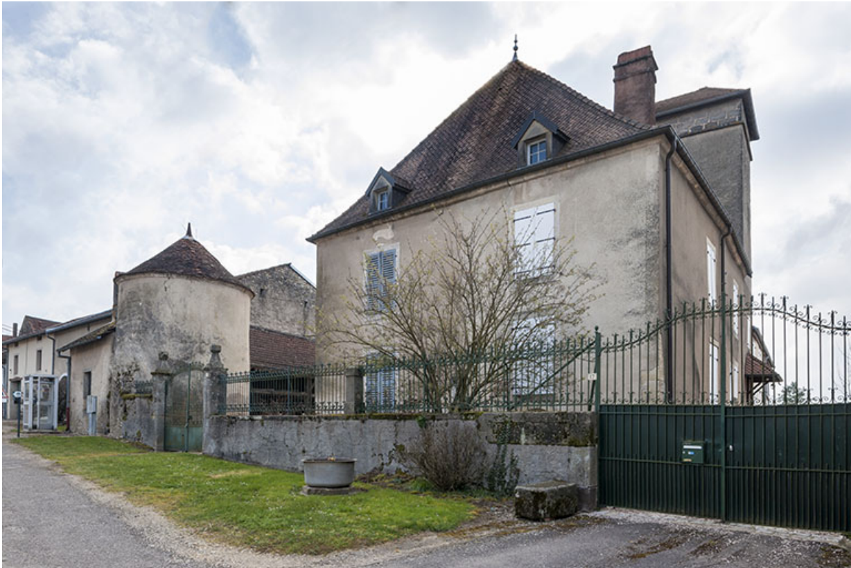
Demeure, rue Antoine Lumière. 70, Ormoy