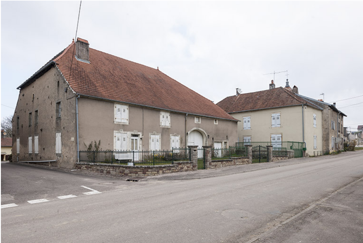
Ferme, rue Antoine Lumière.