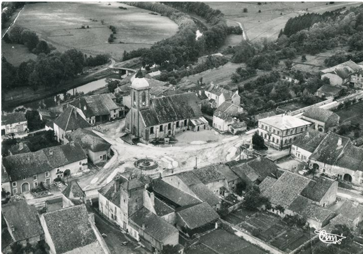
Vue aérienne du centre-bourg d'Ormoy.