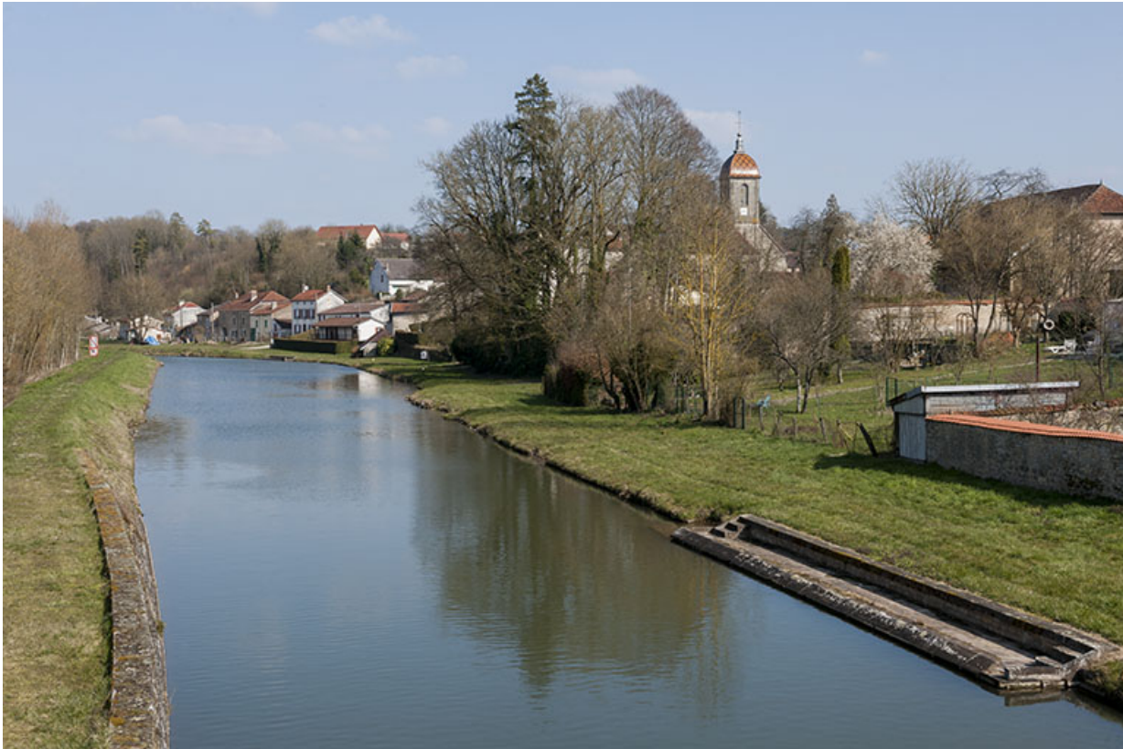
Le bief construit à Ormoy, afin de relier Corre à Port-sur-Saône.