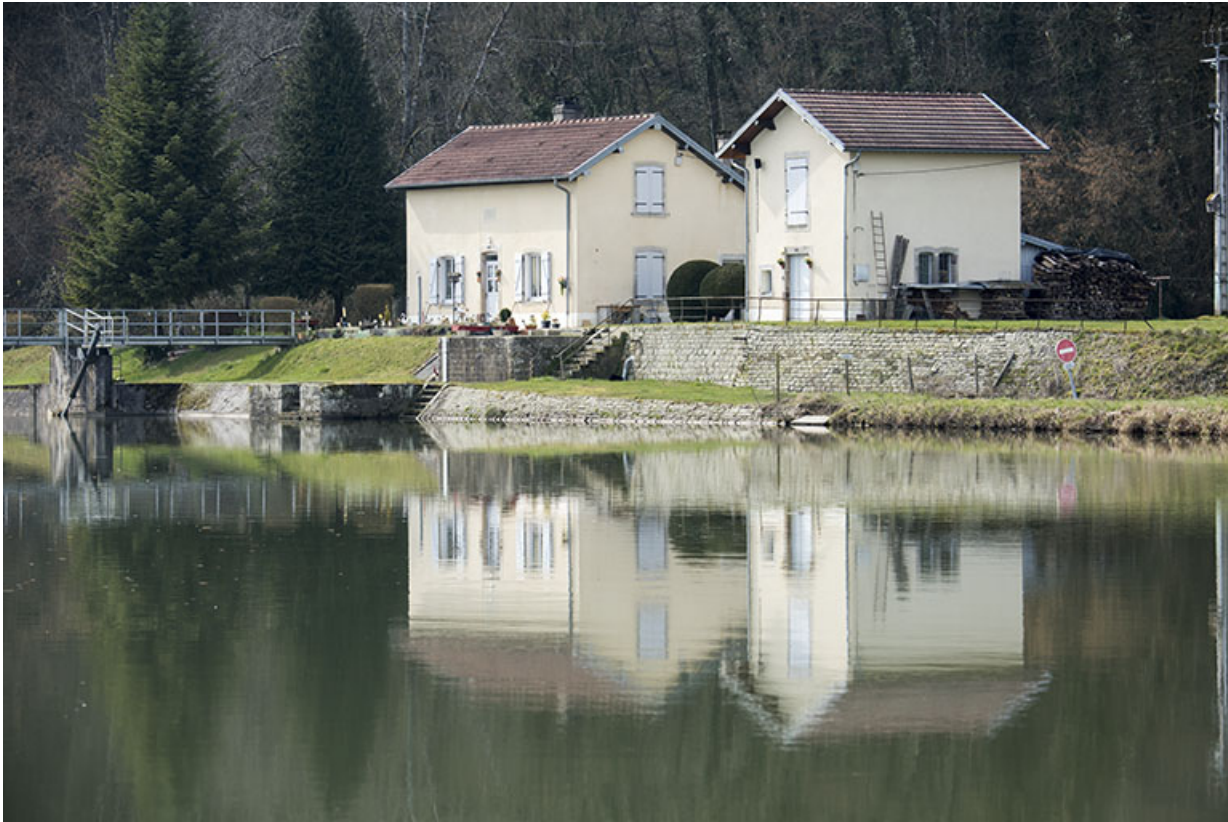
Site du barrage en amont du bief, commune de Ranzevelle. 70, Ormoy