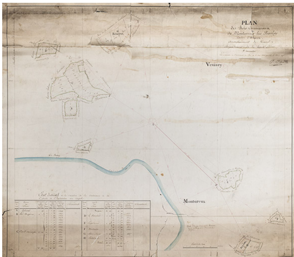
Plan des bois communaux (1822). 70, Montureux-lès-Baulay