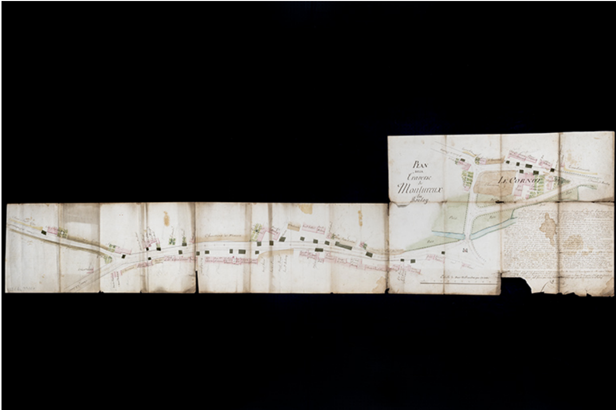
Plan général de la commune (1814).