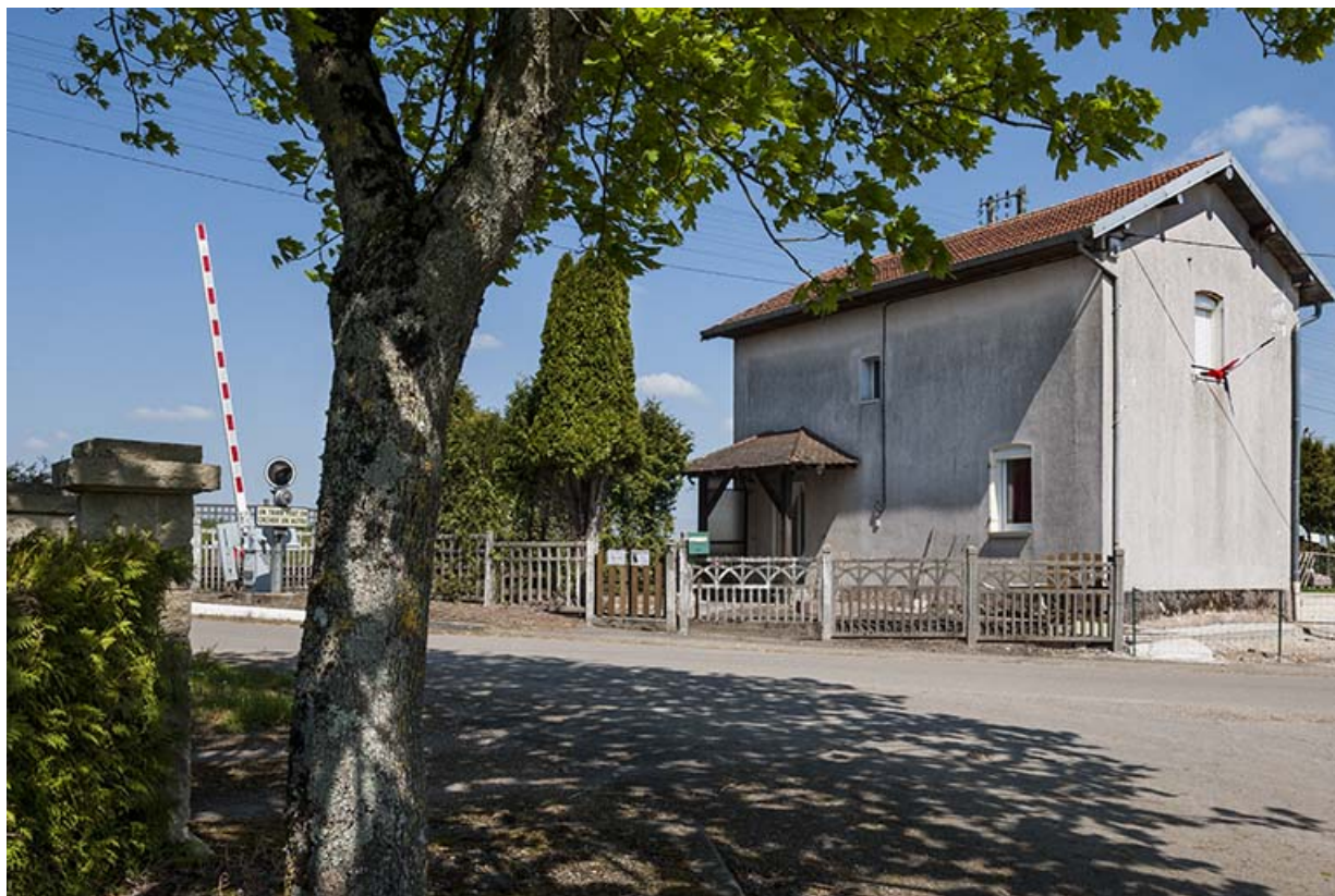
Maison garde-barrière, Grande rue. 70, Montureux-lès-Baulay