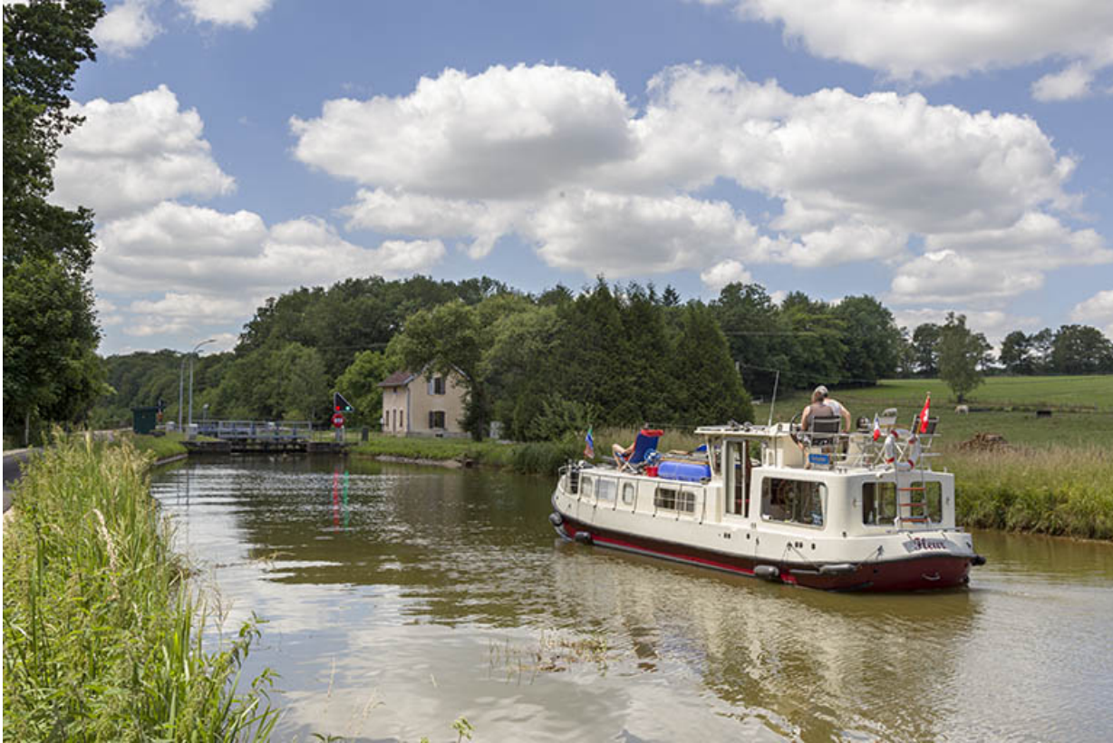
Vue d'ensemble depuis l'amont.