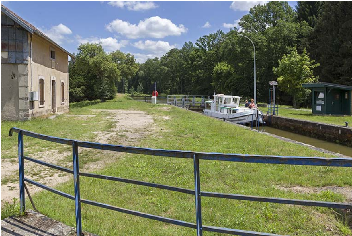
L'écluse depuis le pont.