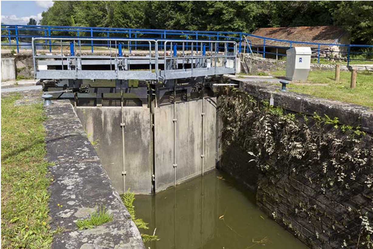
Les portes de l'écluse, busquées vers l'amont. 70, Selles