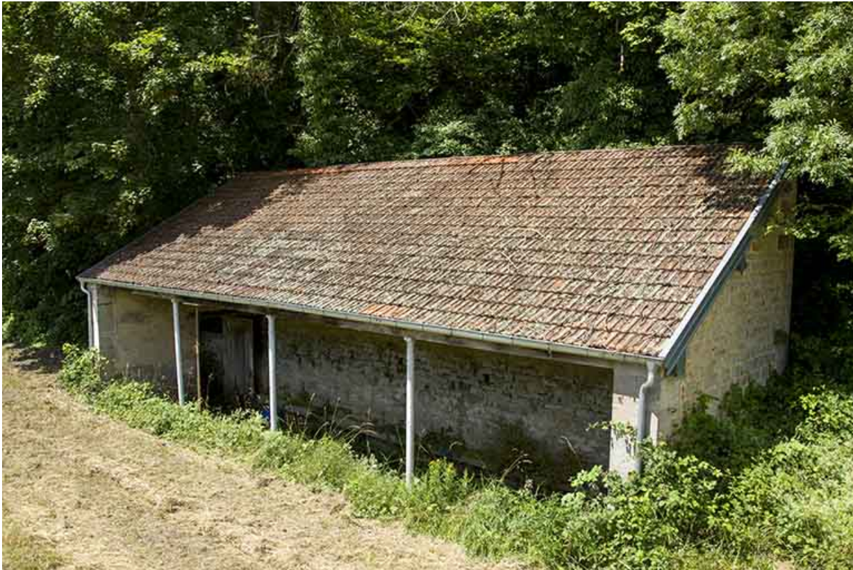
Lavoir proche du site d'écluse.