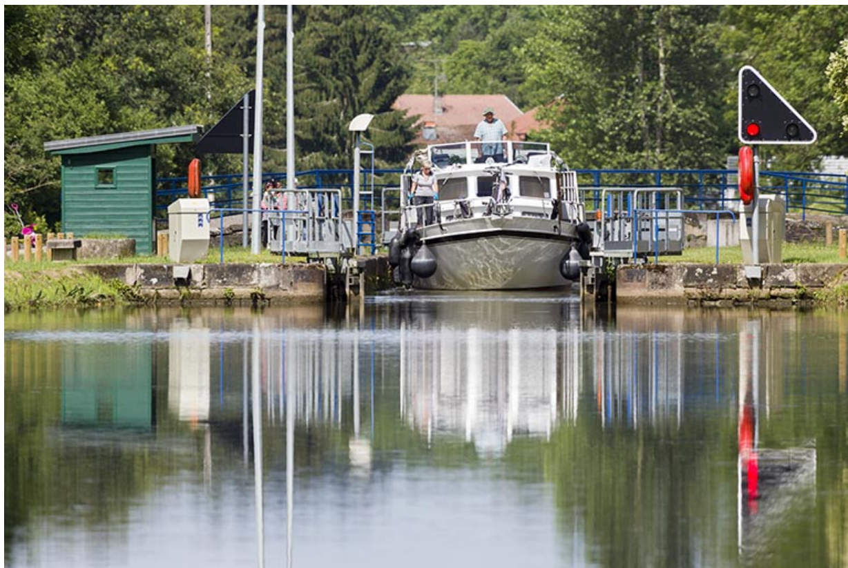
Passage de l'écluse par un bateau de plaisance.