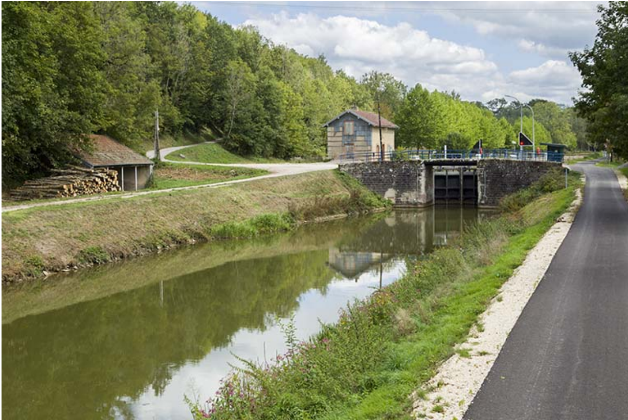
Vue d'ensemble depuis l'aval.