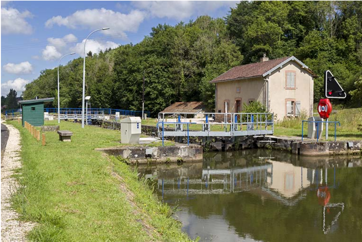
Le site d'écluse, depuis l'amont.