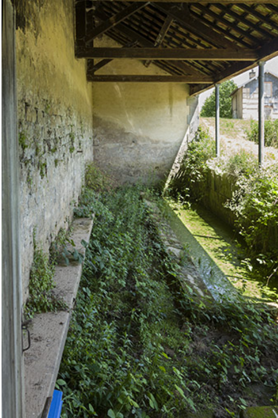
Intérieur du lavoir.