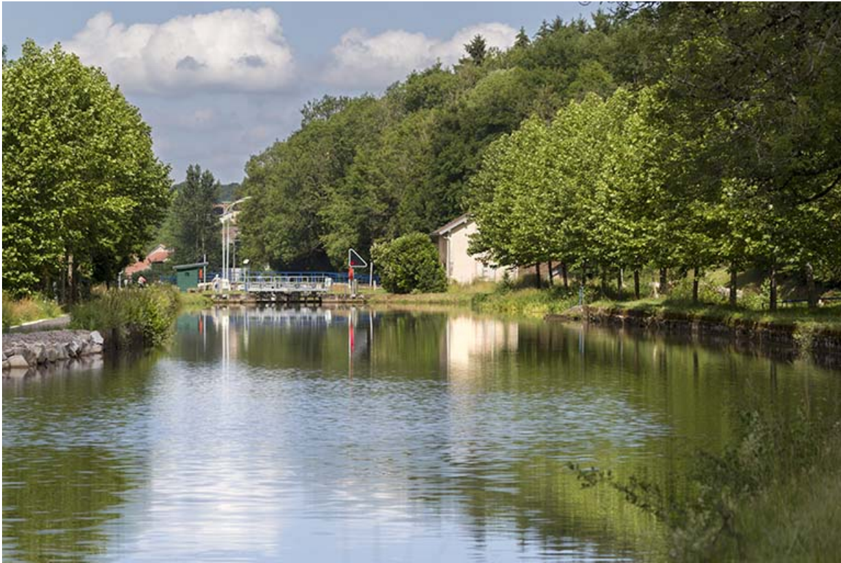
Vue d'ensemble depuis l'amont.