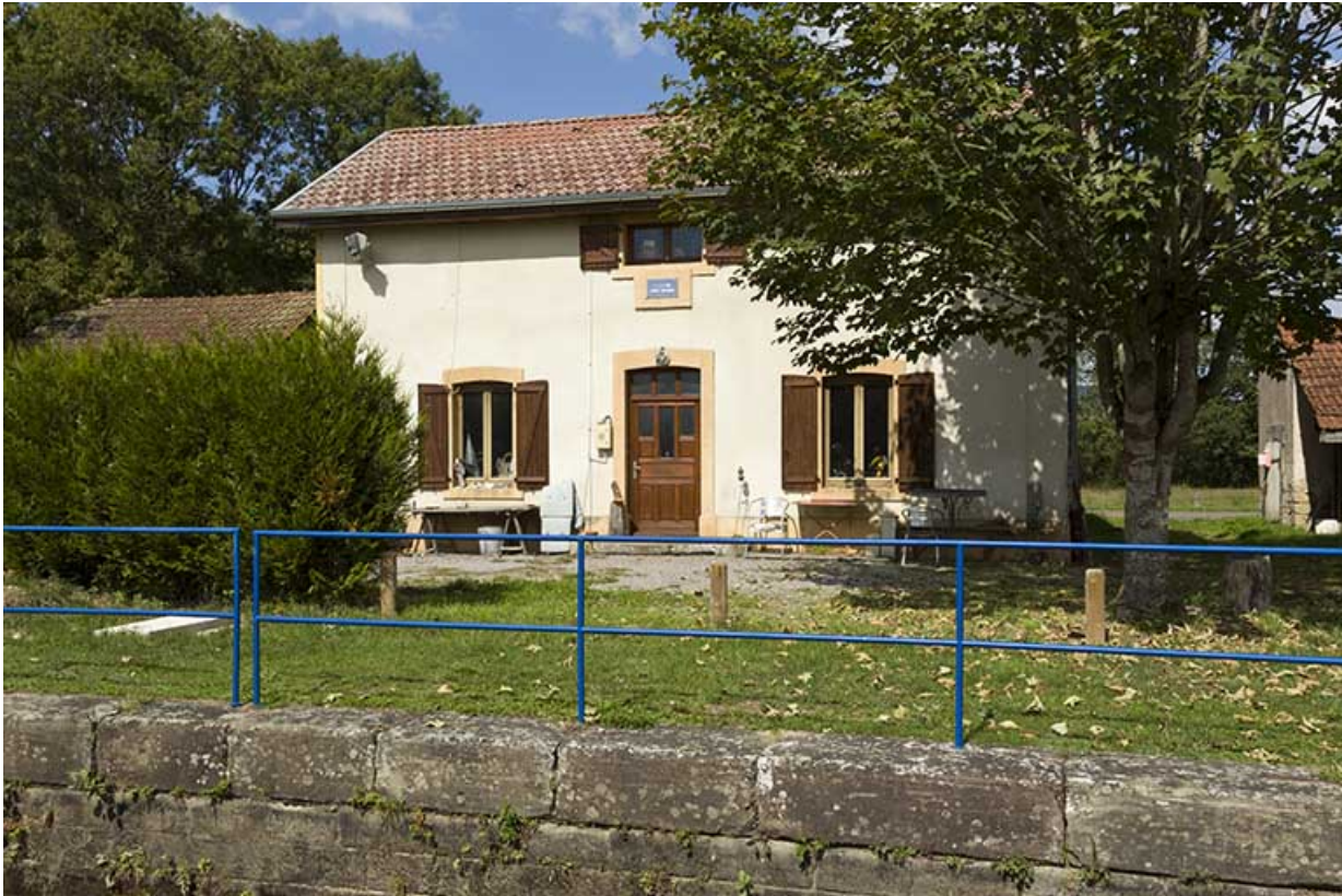
La maison d'éclusier, depuis l'écluse.

70, Pont-du-Bois route départementale 150