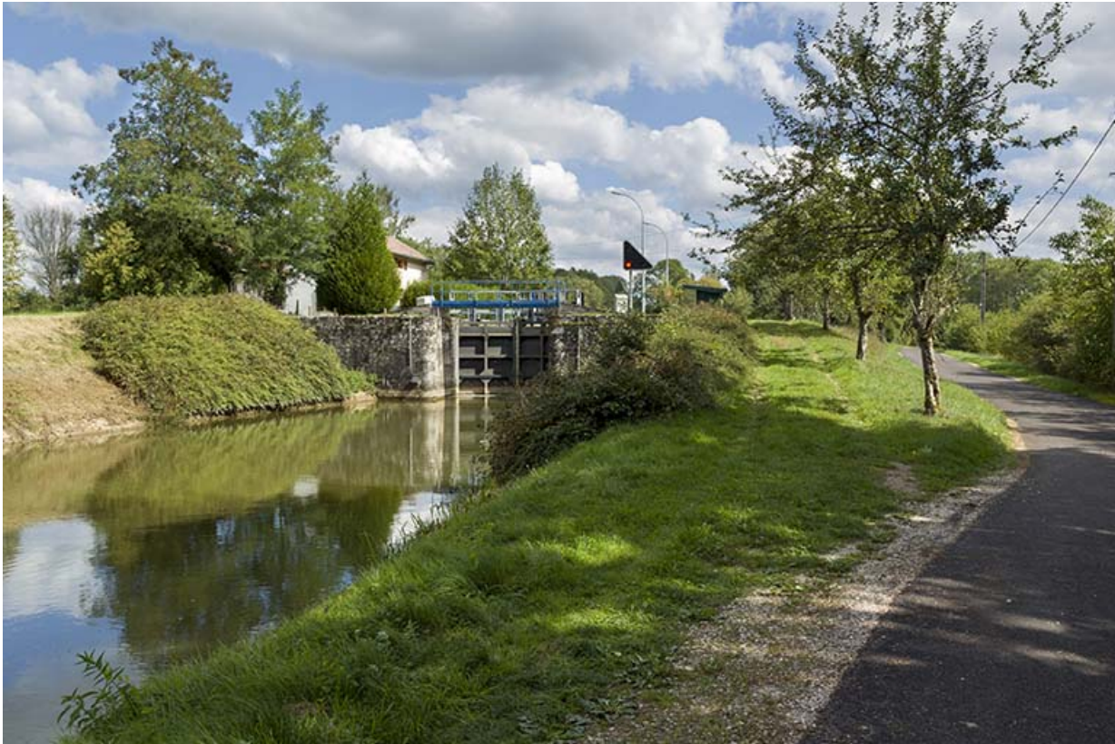
Vue d'ensemble depuis l'aval avec l'ancien chemin de halage transformé en voie cyclable. 70, Pont-du-Bois route départementale 150