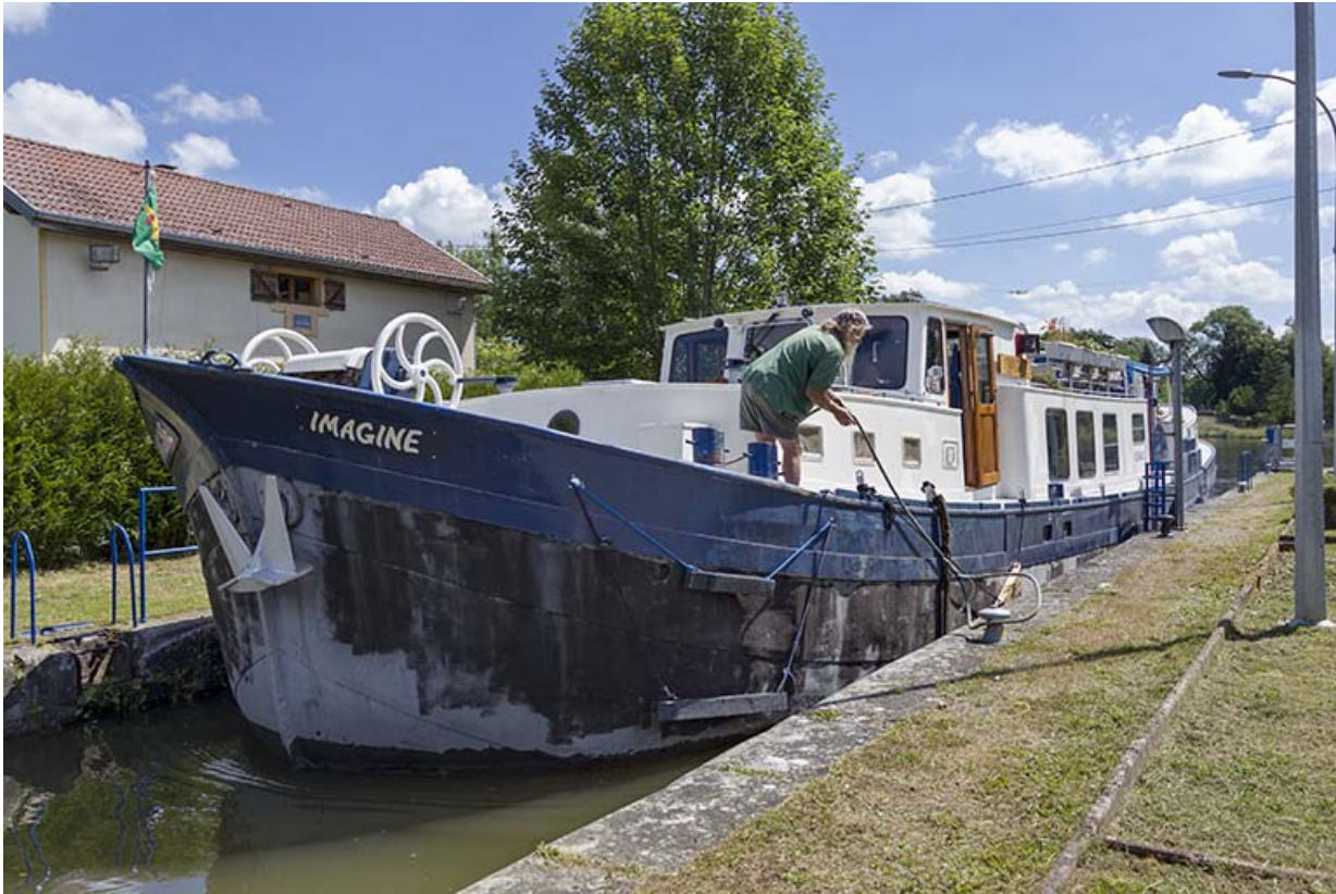
Bâteau en train de s'amarrer sur une bitte de l'écluse.

70, Pont-du-Bois route départementale 150