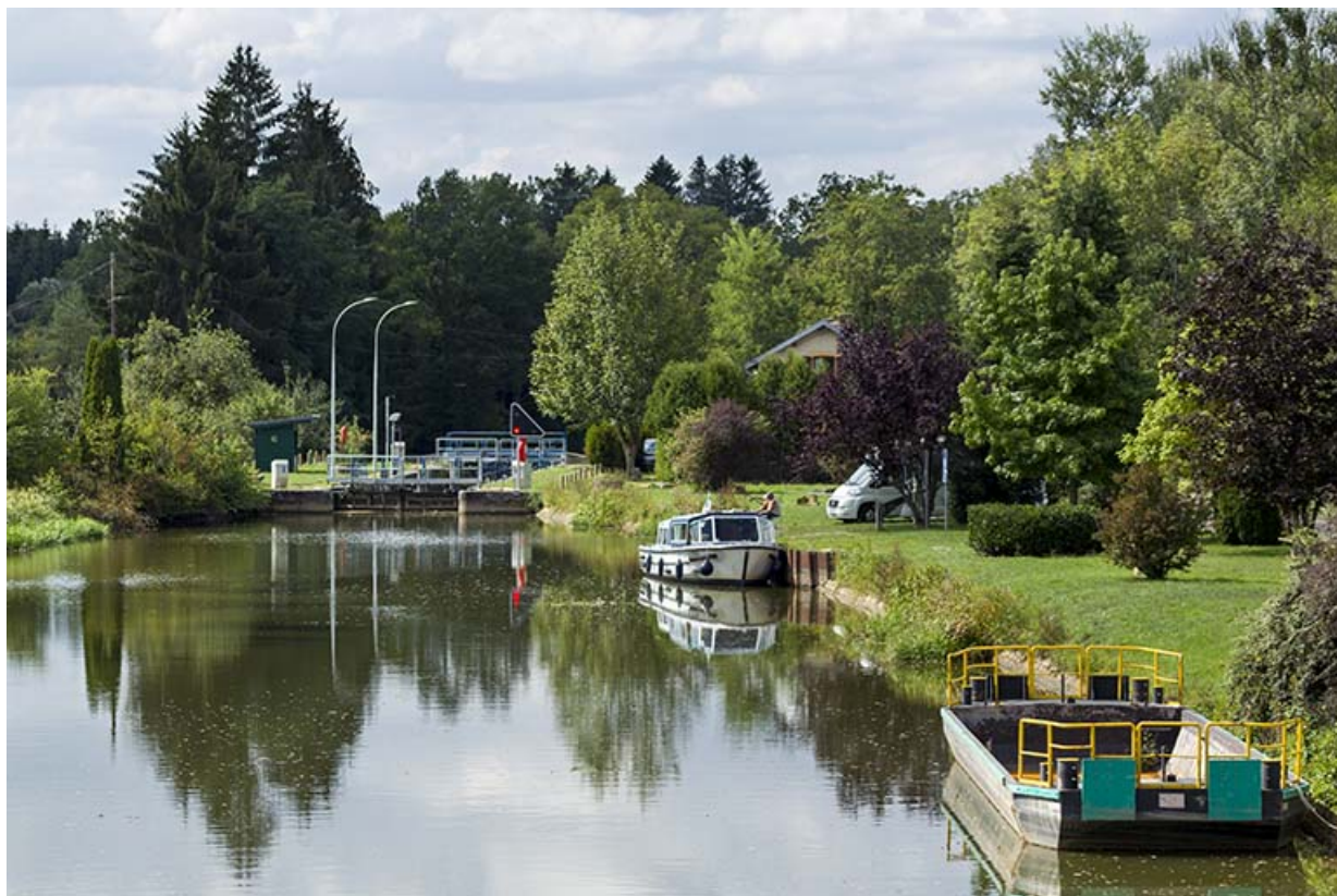
Vue d'ensemble depuis l'amont.

70, Pont-du-Bois route départementale 150