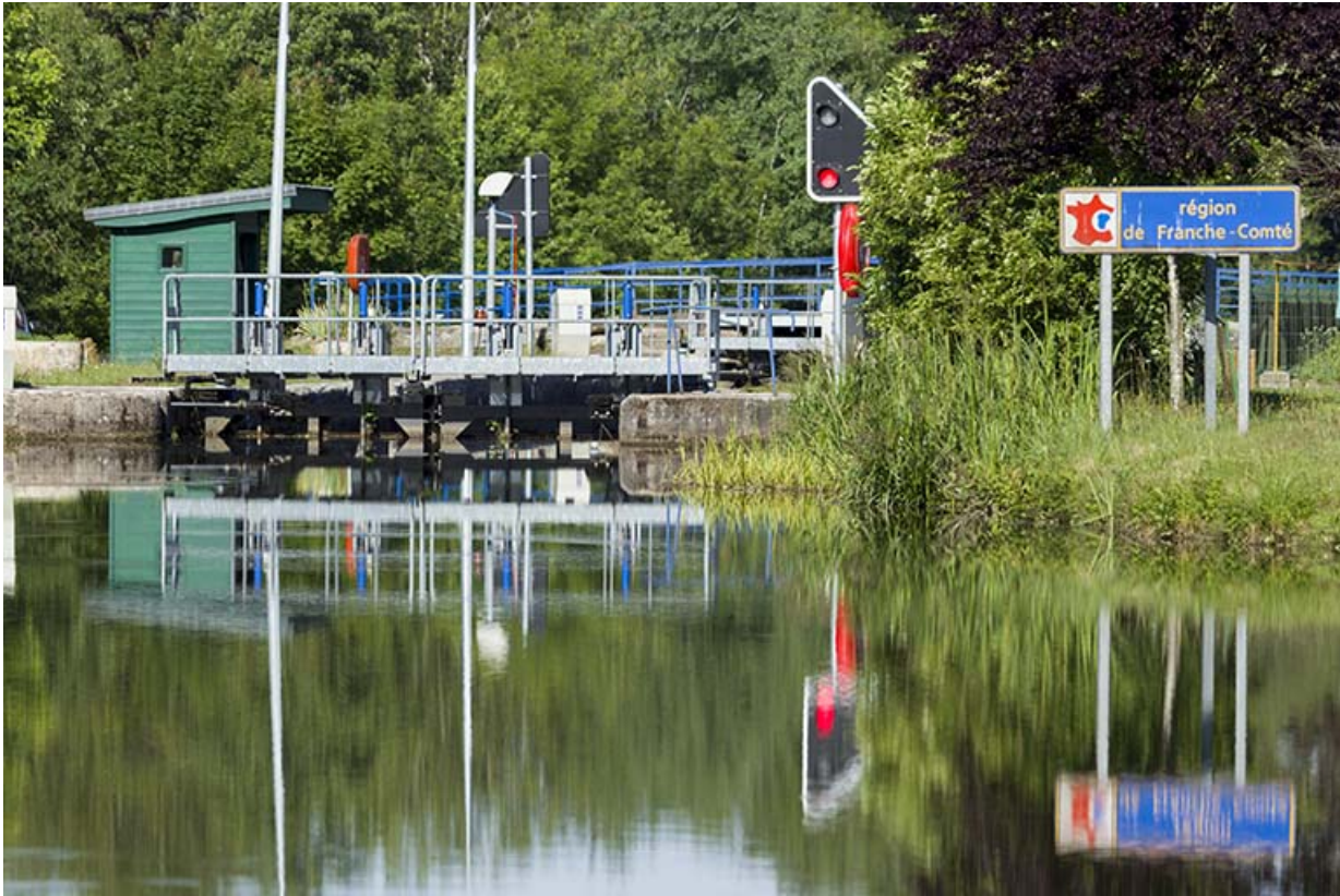
l'écluse et son poste de commande depuis l'amont. 70, Ambiéwillers