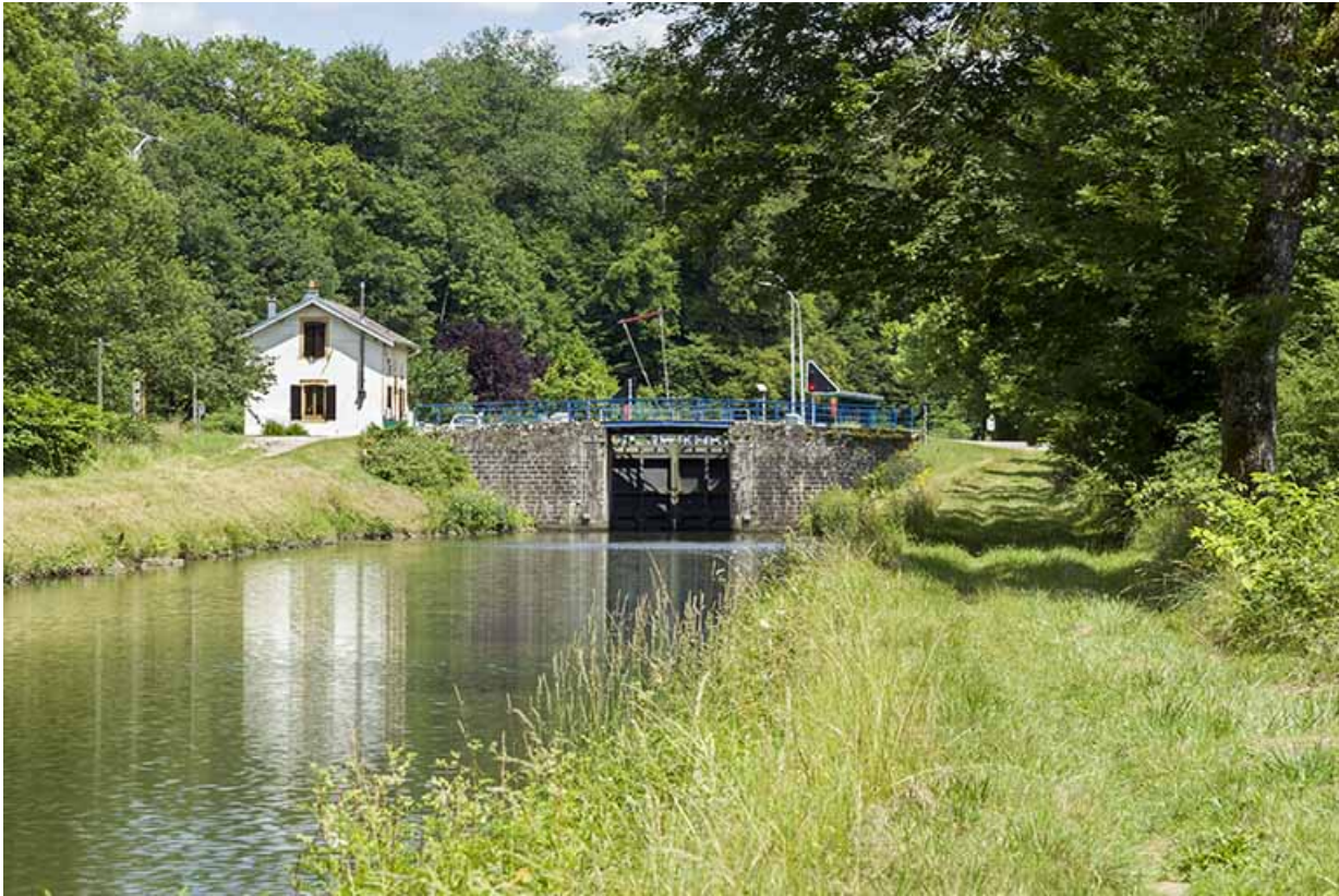
Vue d'ensemble depuis l'aval.