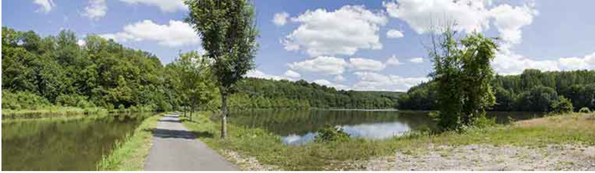
Vue en amont de l'écluse.