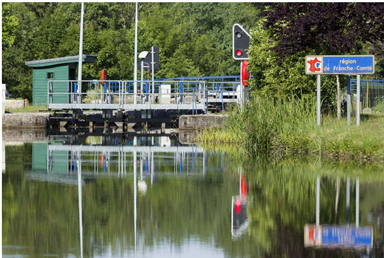
l'écluse et son poste de commande depuis l'amont. 70, Ambiévillers