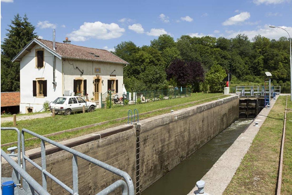
Le site d'écluse, depuis l'aval.