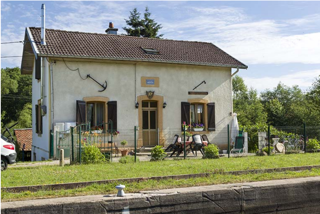
La maison d'éclusier, depuis l'écluse.