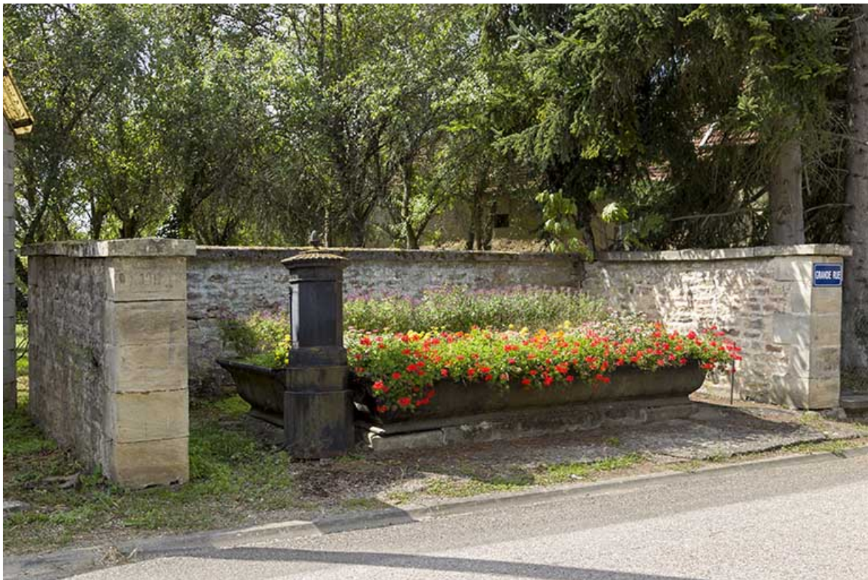
Fontaine-abreuvoir située à l'intersection de la Grande rue et rue du Chalet. 70, Pont-du-Bois