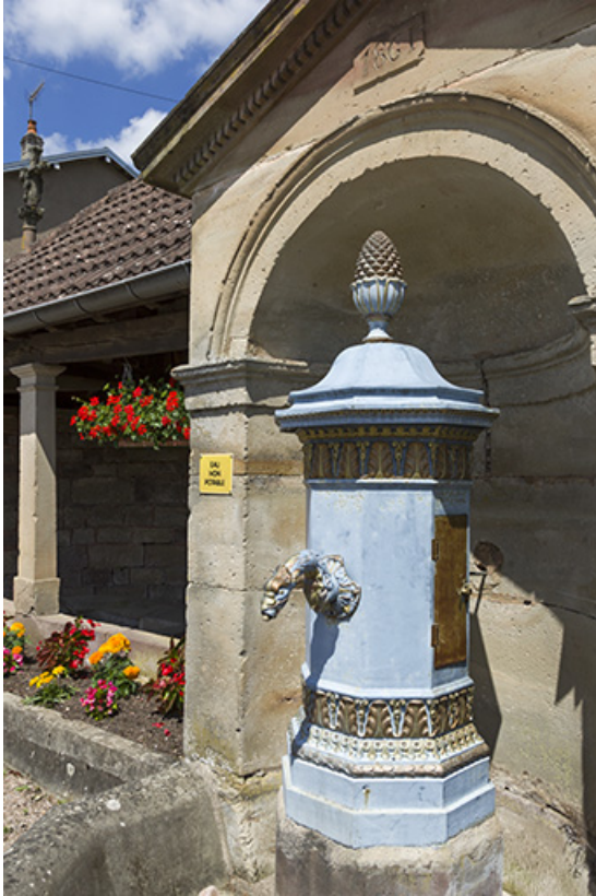
Vue de trois quart.