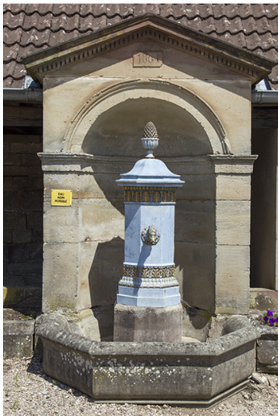
La borne fontaine.