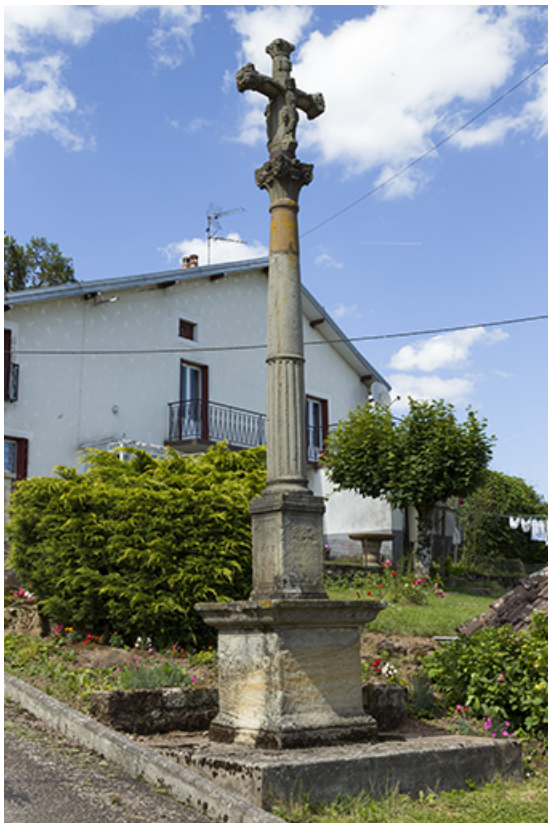
Vue générale sur la croix à proximité de la fontaine. 70, Ambiévillers rue Grande