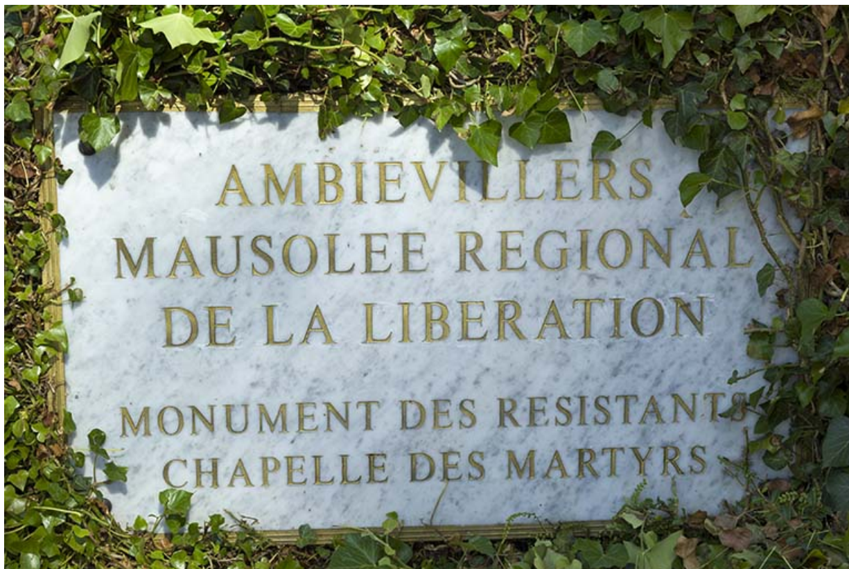
Détail de la plaque commémorative.

70, Ambiéwillers route départementale 434