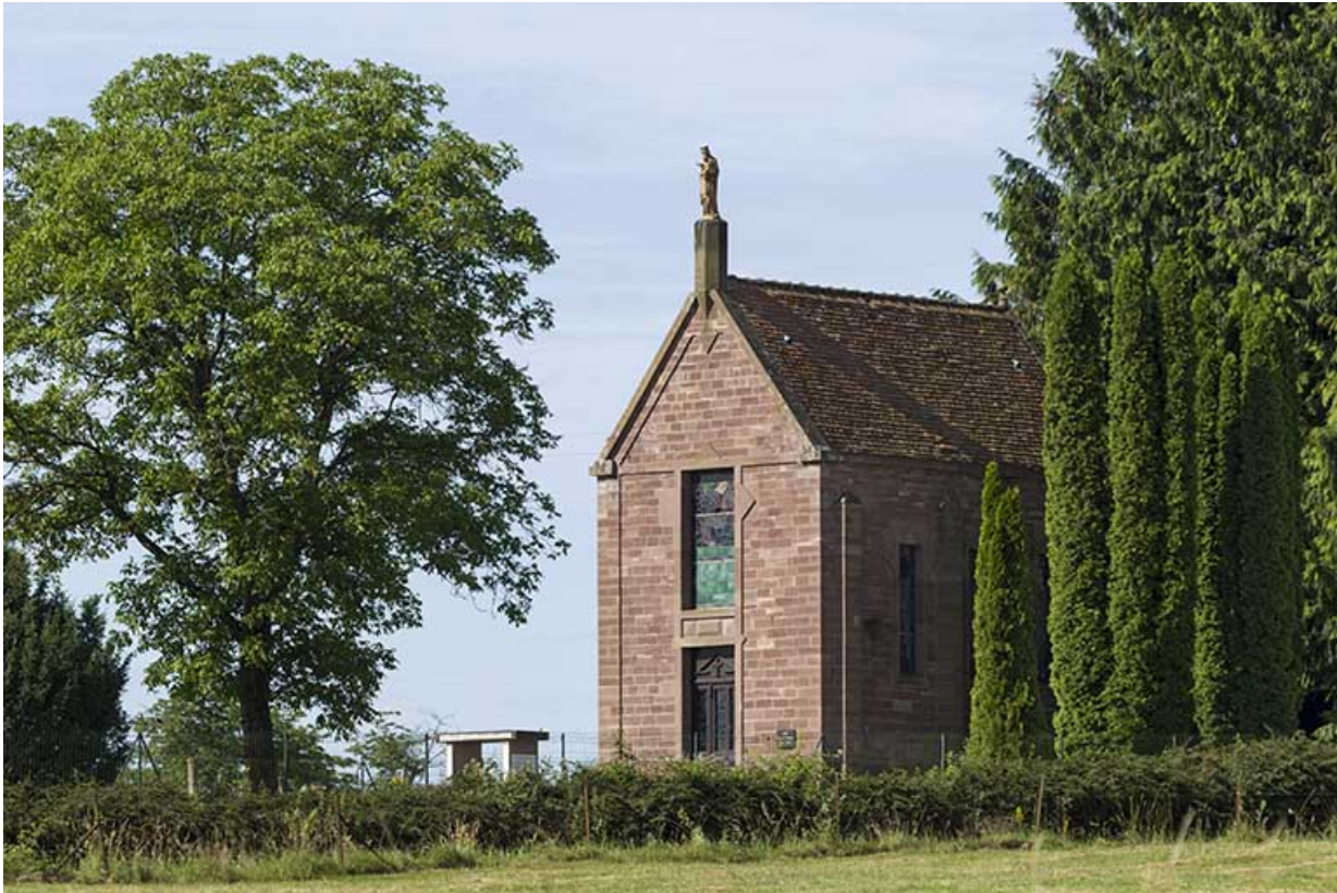
Façade principale de la chapelle.

70, Ambiéwillers route départementale 434