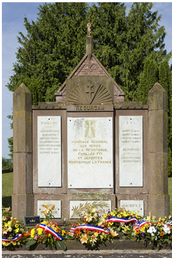
Le mausolée, vue d'ensemble.

70, Ambiéwillers route départementale 434