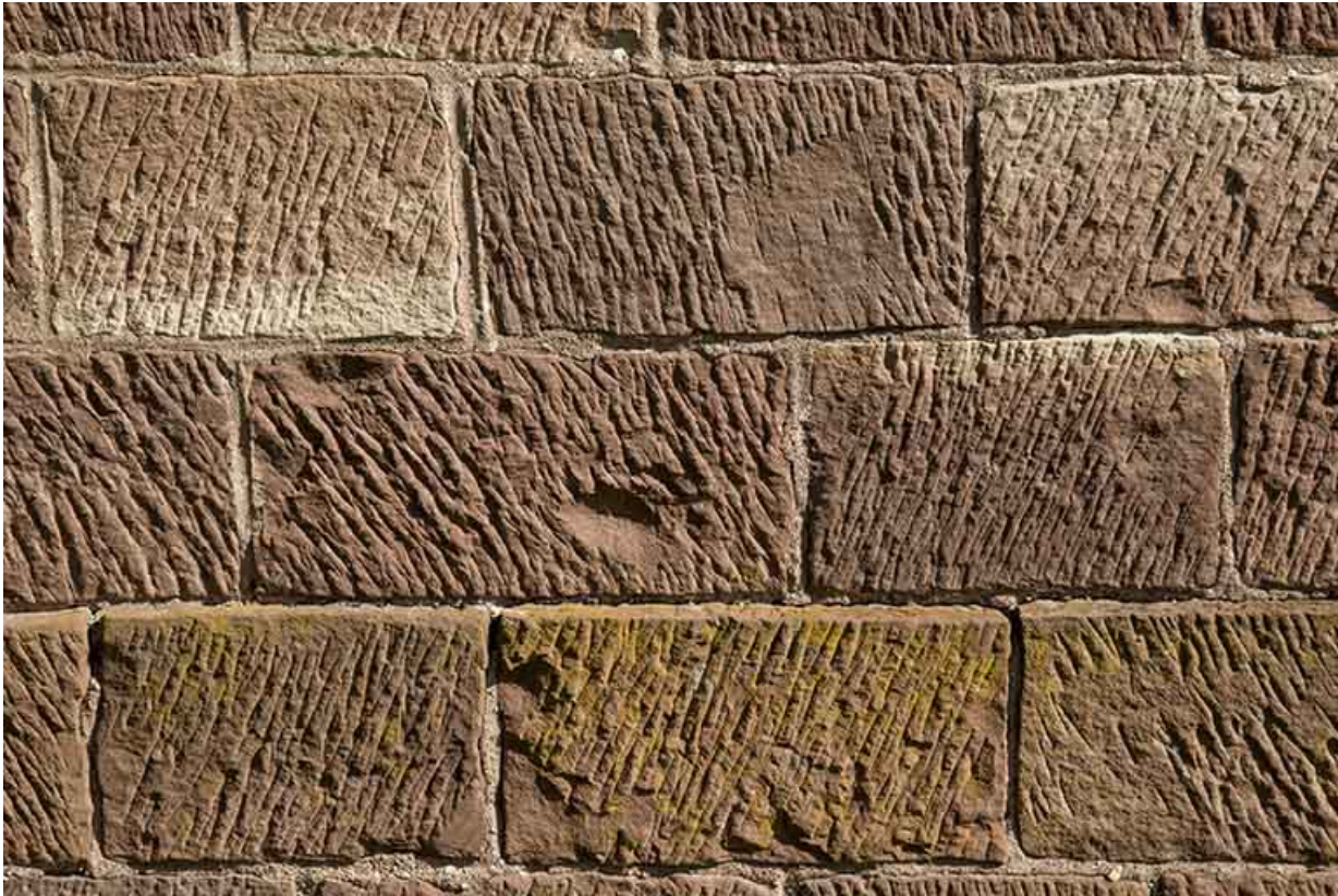
Grès des Vosges, gros oeuvre de la chapelle.

70, Ambiévillers route départementale 434