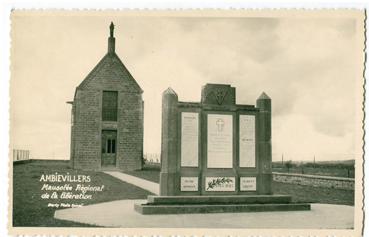
Le mausolée régional de la Libération, carte postale.

70, Ambiéwillers route départementale 434