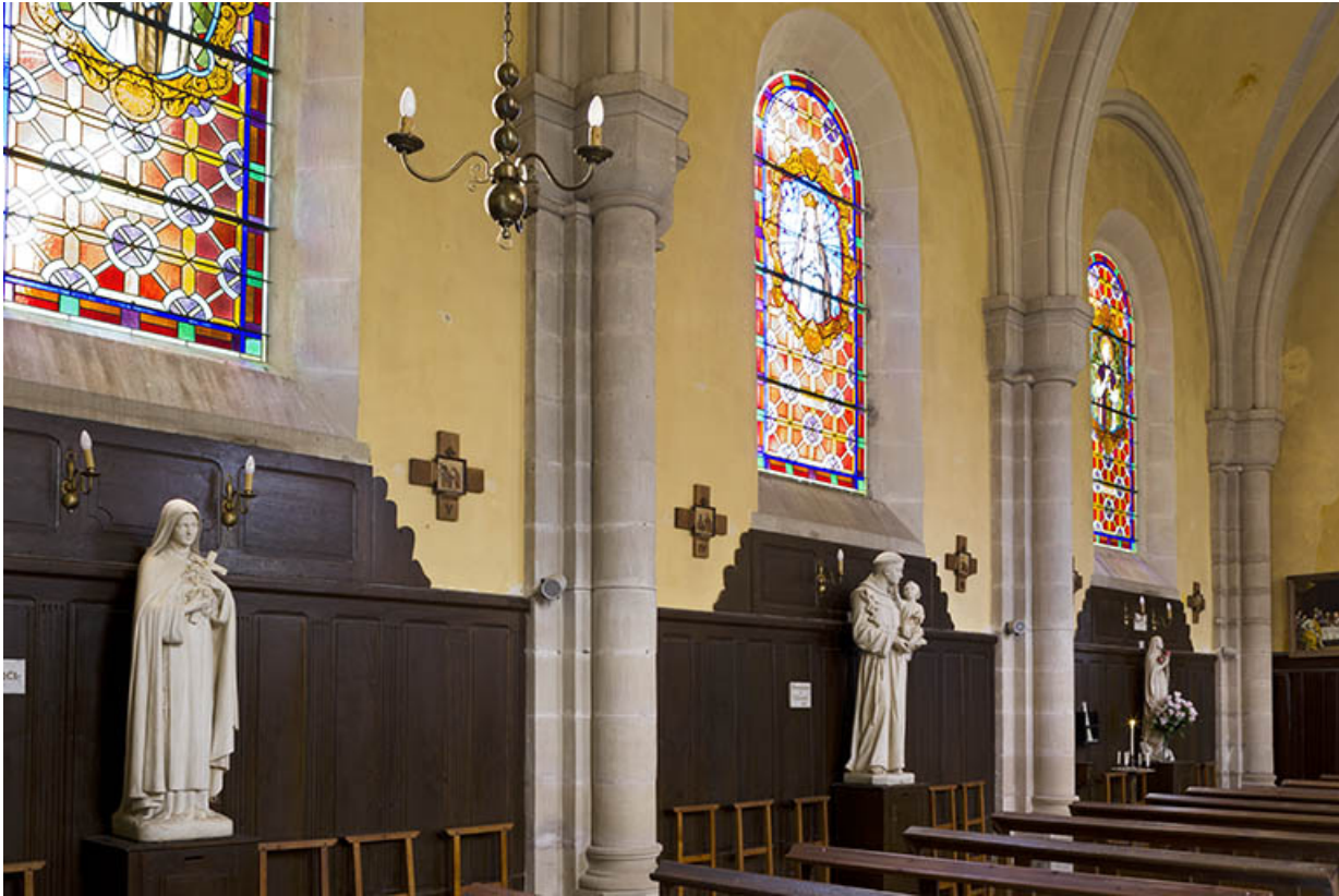
Statues et boiseries du mur latéral nord.