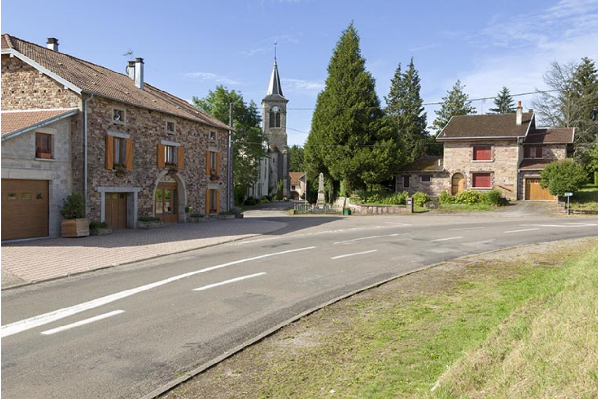
Vue depuis la Grande Rue.