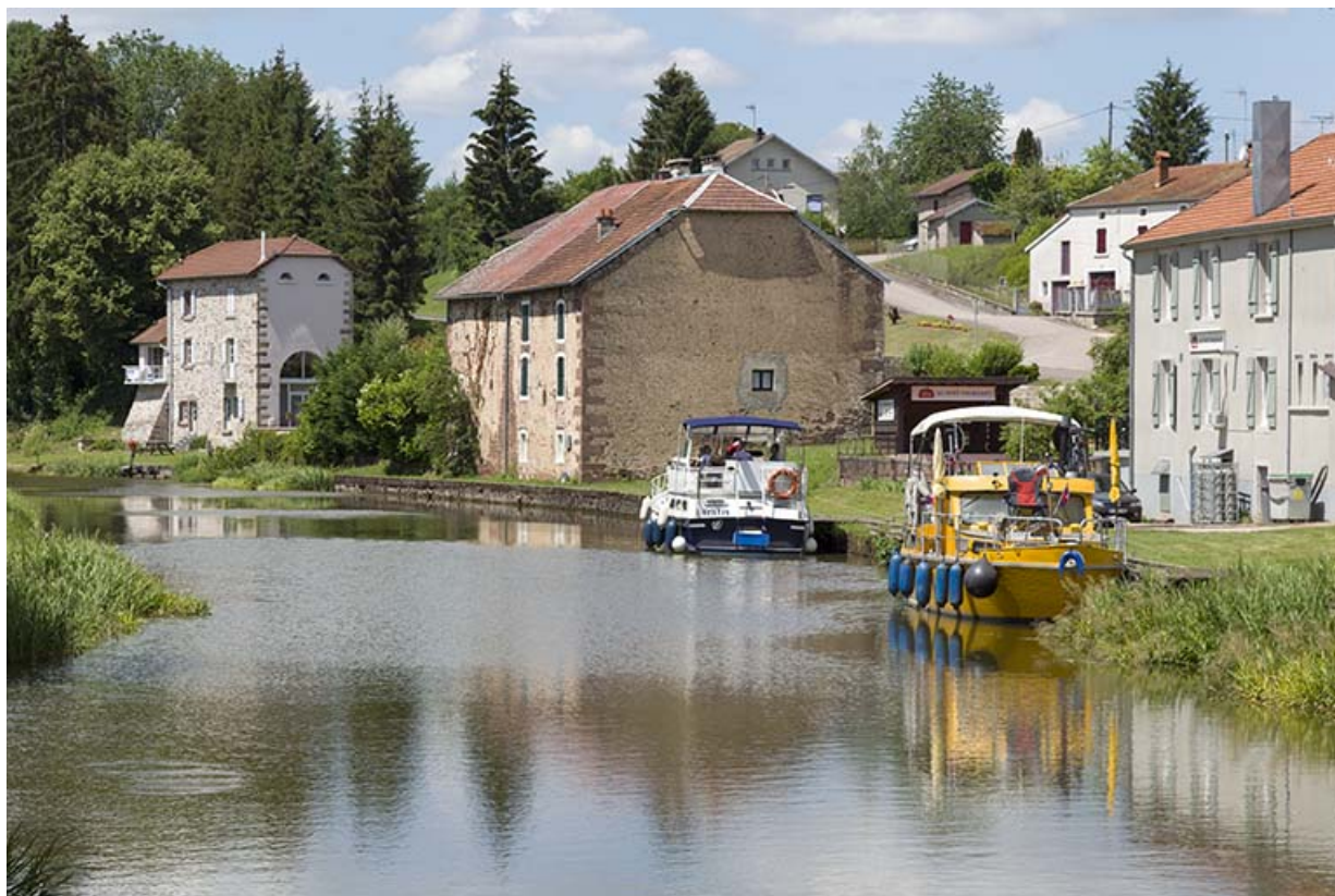
Maisons le long du canal.