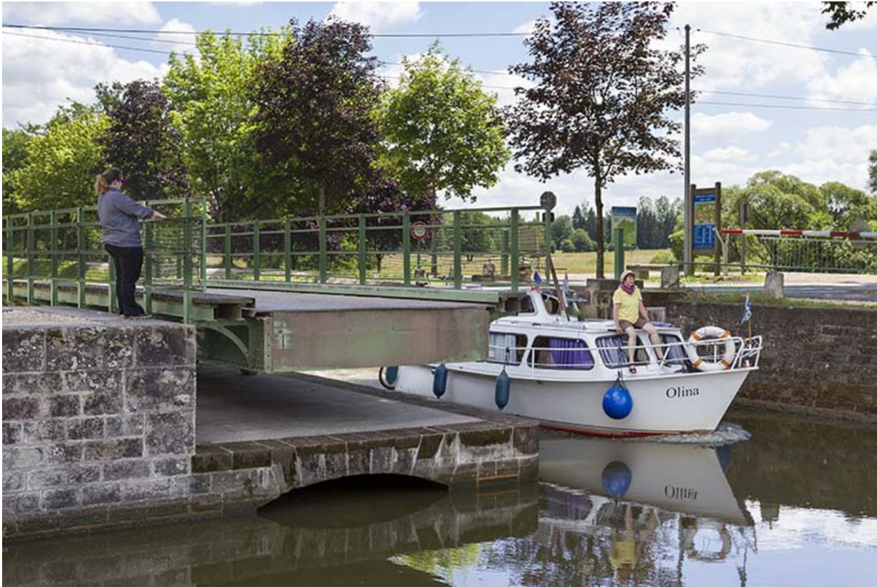
Passage d'un bateau de plaisance et maintien du tablier ouvert.