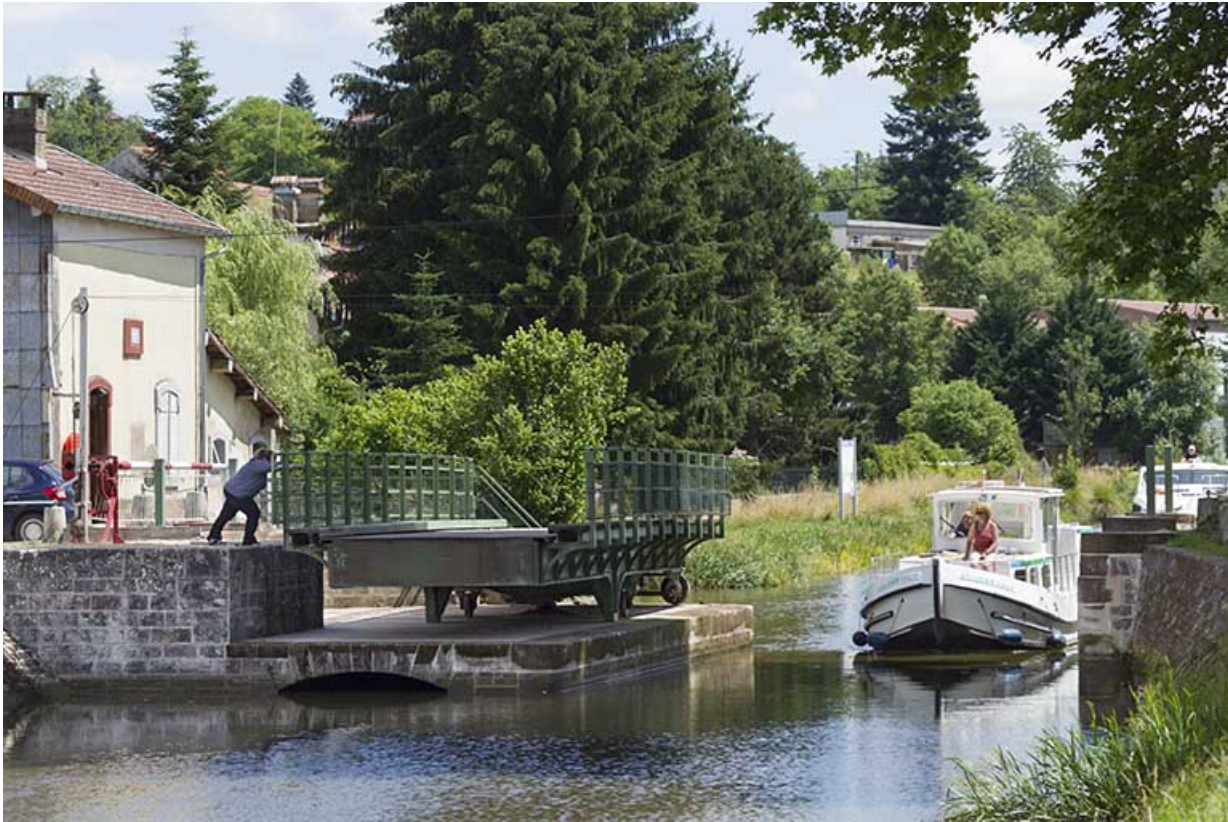
Passage d'un bateau de plaisance.