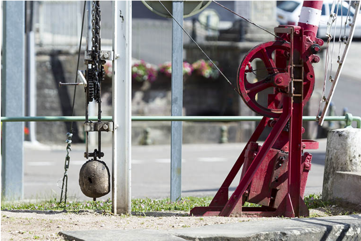
Détail du mécanisme de la barrière.