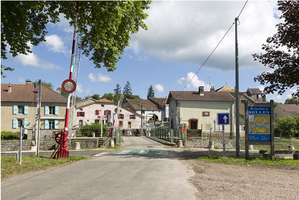
Entrée du village après le pont.