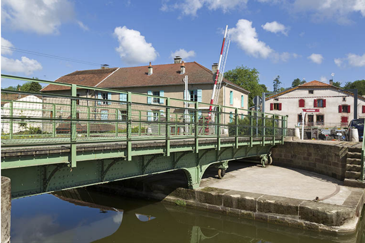
Le tablier métallique et sa plateforme.