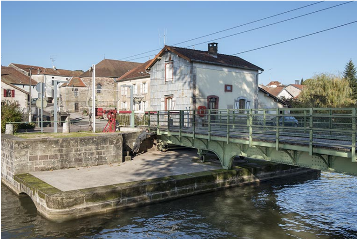
Remise en place du tablier métallique.