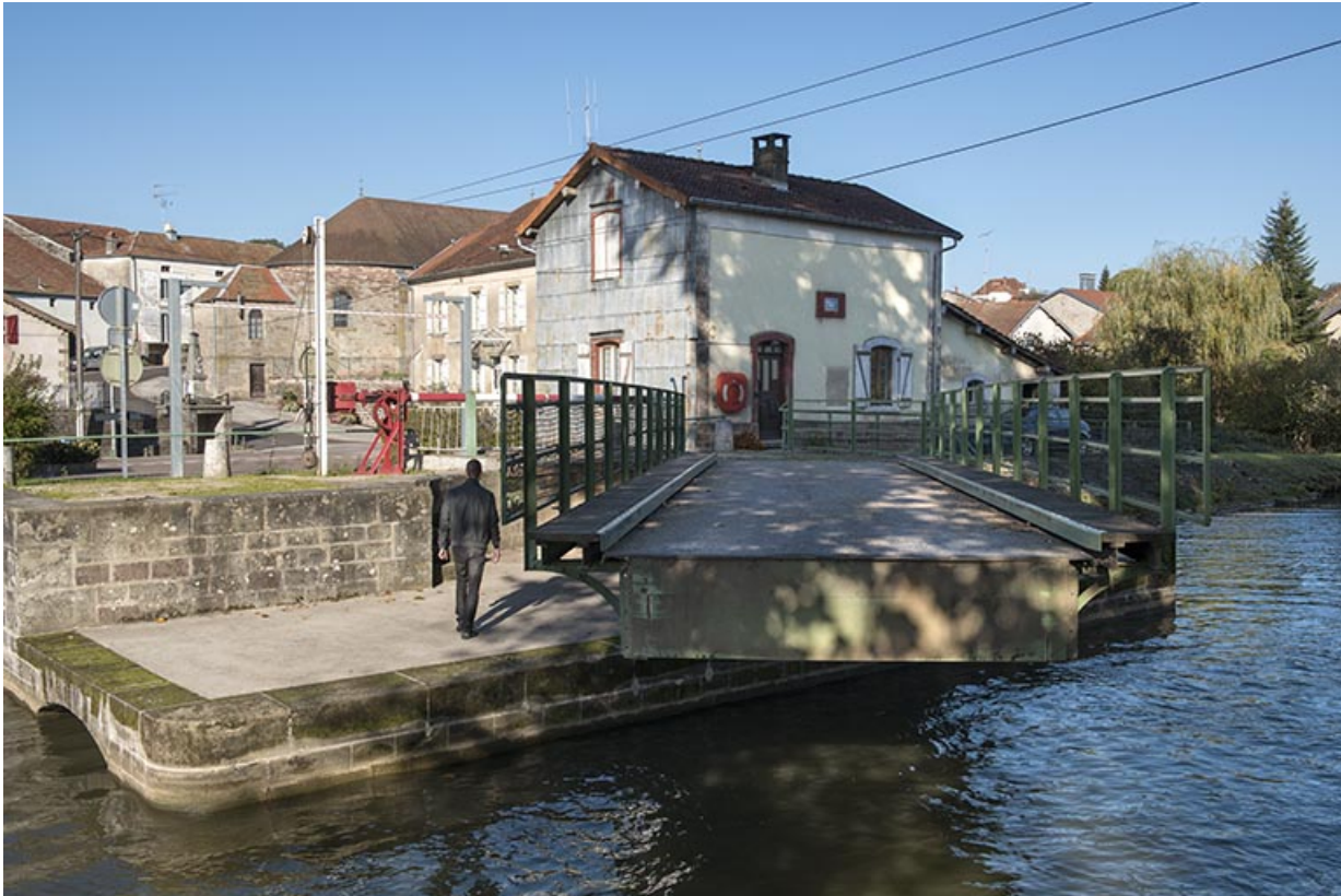
Le pont tournant à Selles (70).