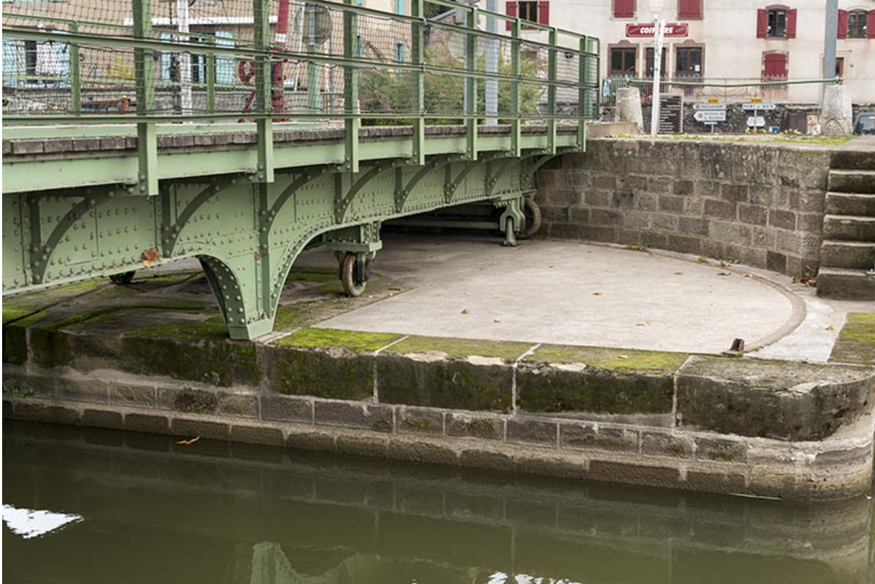
Détail de la plateforme maçonnée.