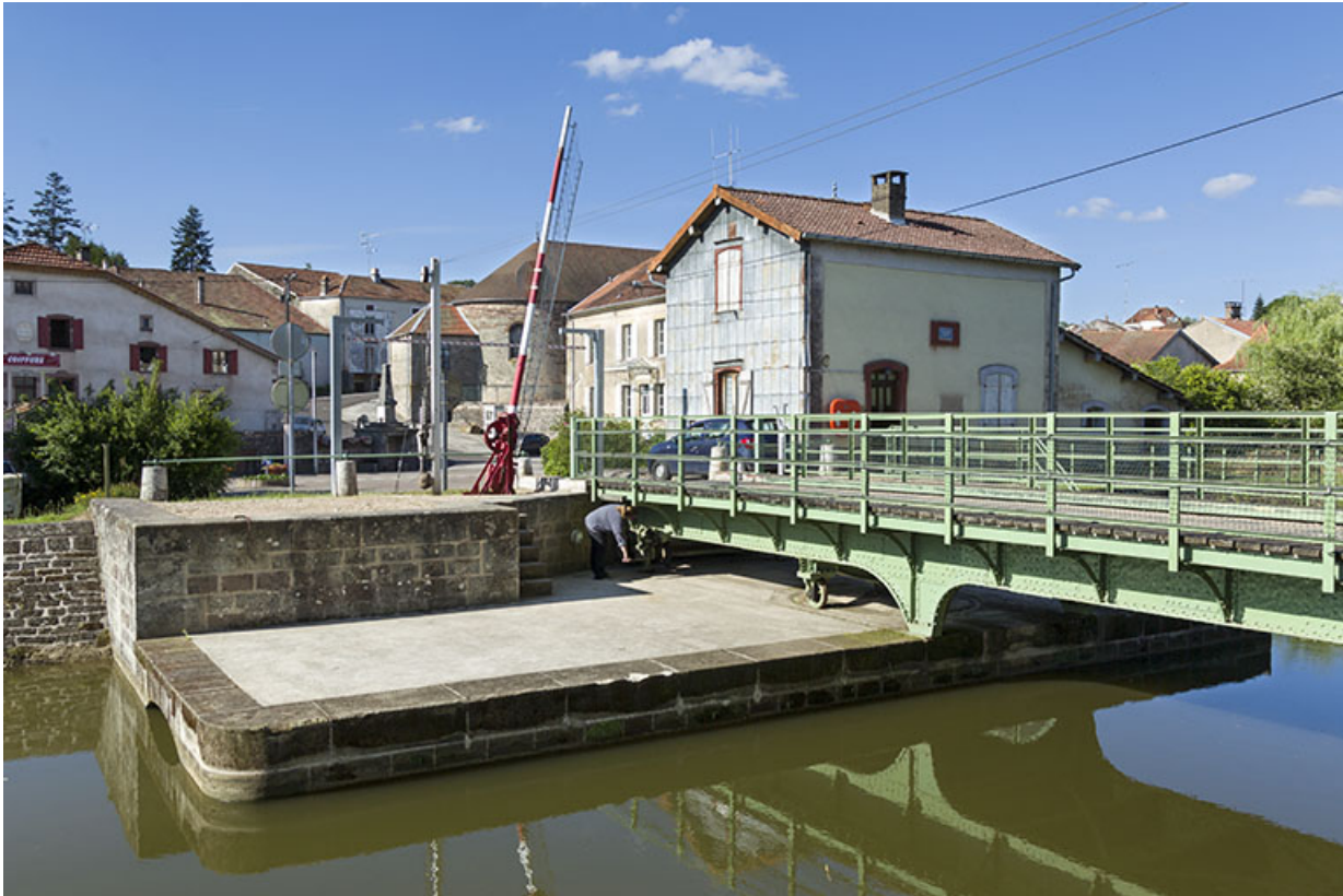
Le tablier métallique et sa plateforme depuis l'aval.