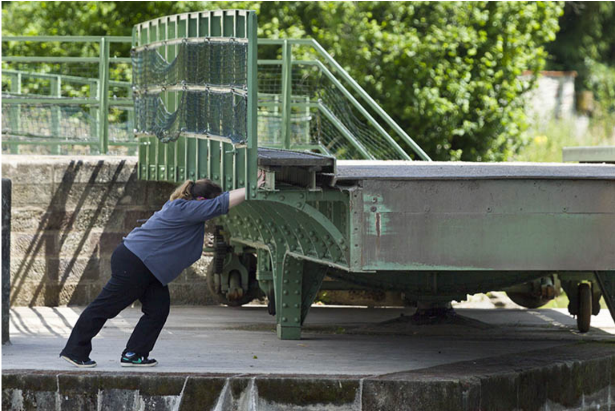
Rotation du pont par poussée manuelle.