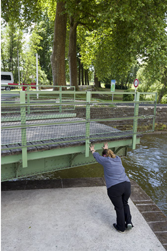
Rotation du pont par poussée manuelle.