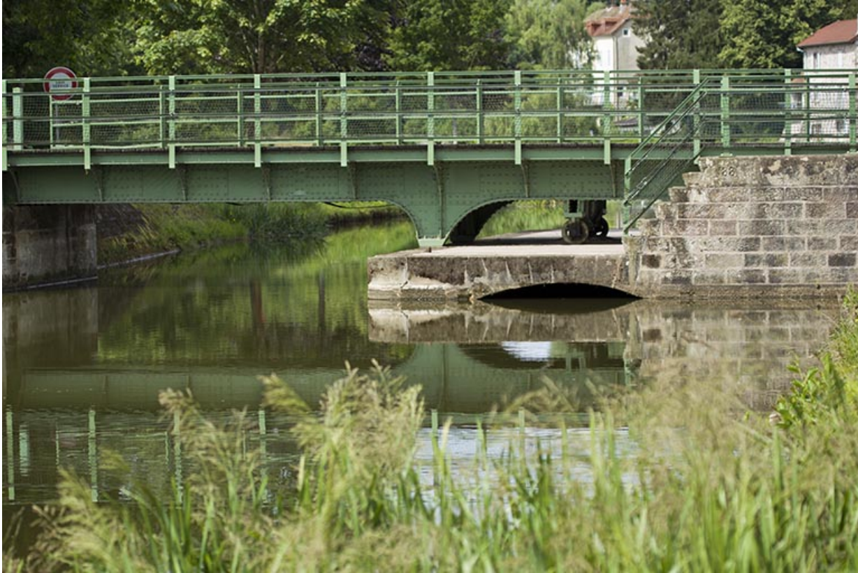
Vue sur la plateforme maçonnée (côté date portée).