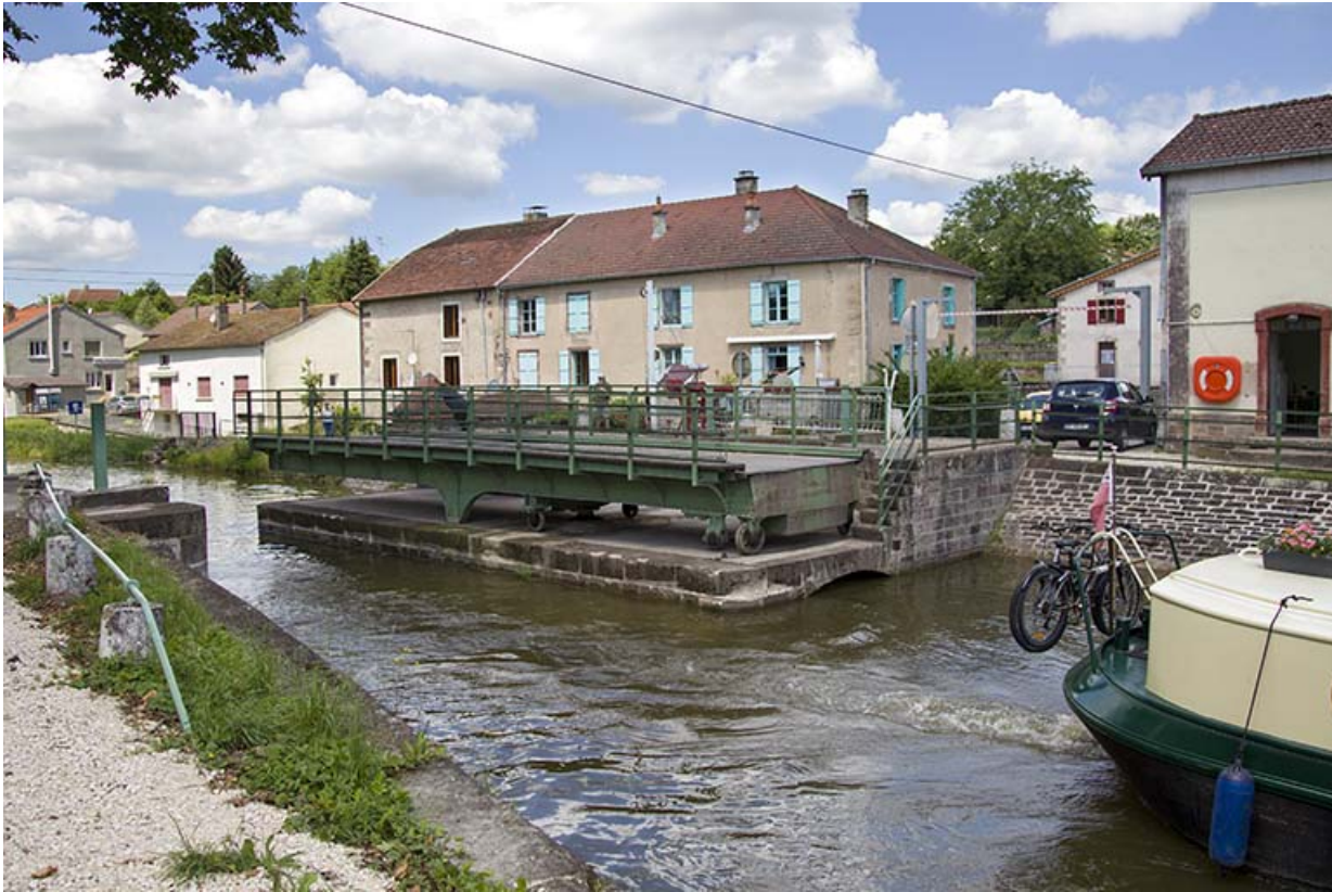
Passage d'un bateau de plaisance.