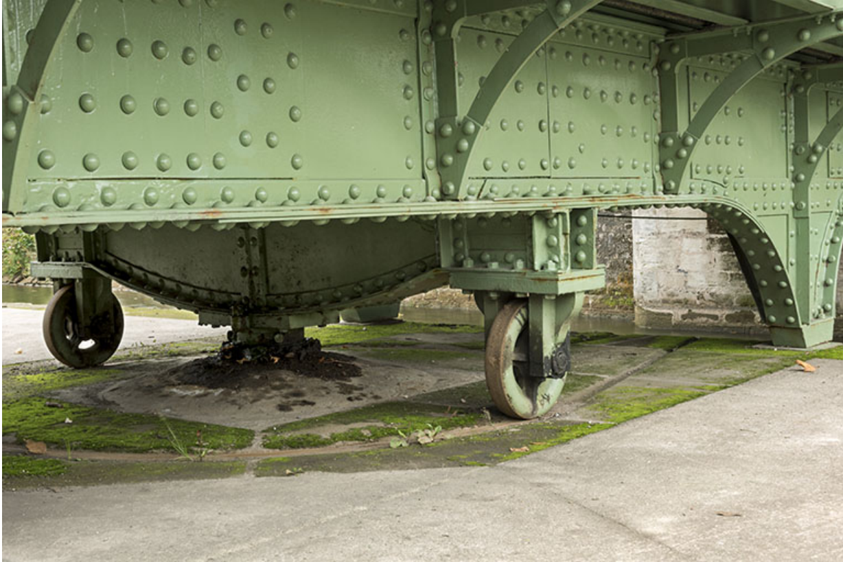
Roues, pivot et chevêtre.