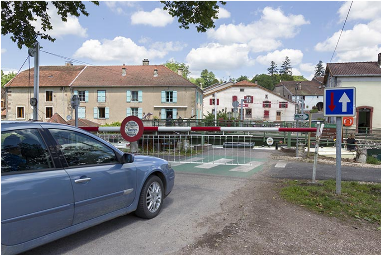
Fermeture du pont à la circulation routière.