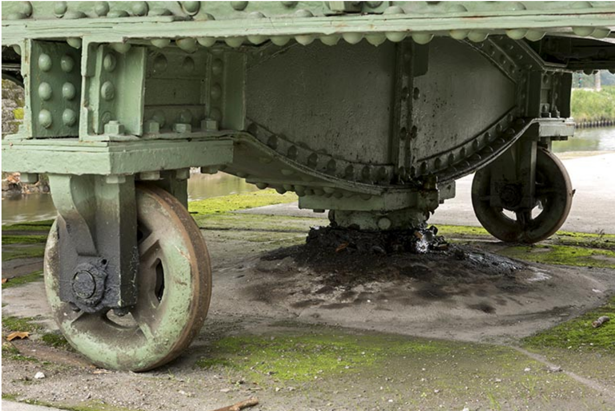
Détail du pivot sous le chevêtre.