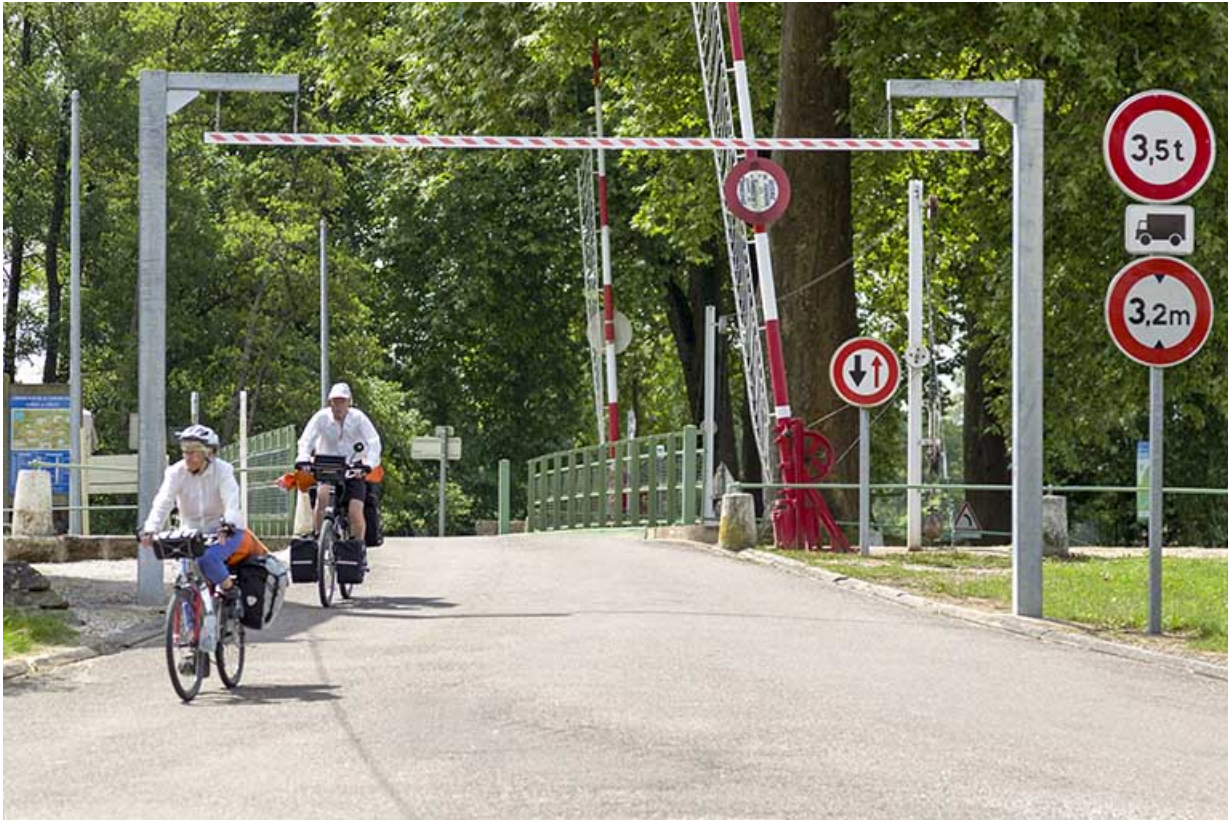
Cyclistes franchissant le pont.