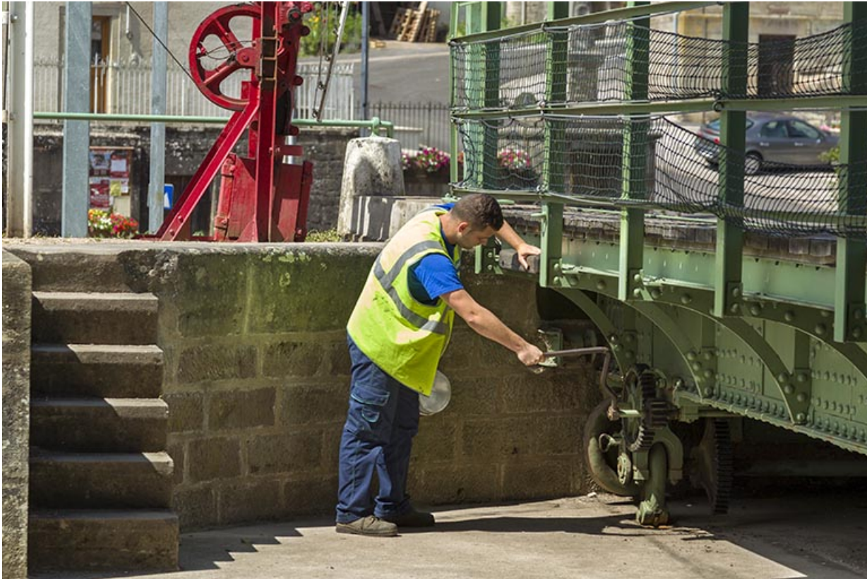
Manutention du calage à l'aide d'une manivelle.