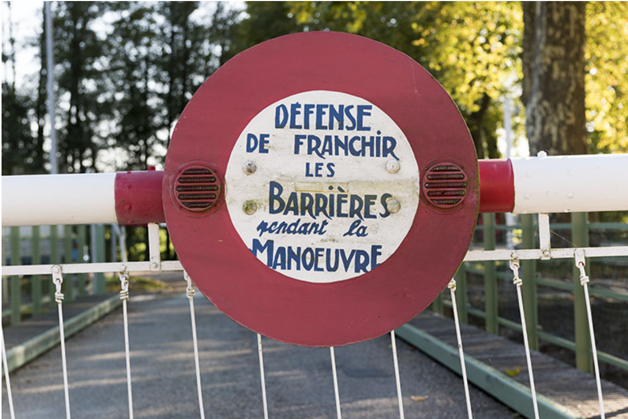
Panneau de signalisation de la barrière.