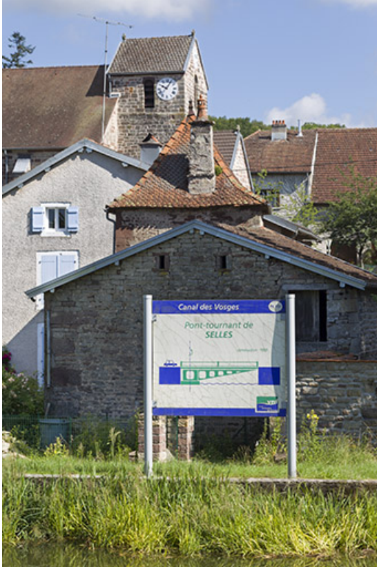
Plaque d'information indiquant la présence du pont tournant et l'église en arrière plan. 70, Selles rue de la Forge