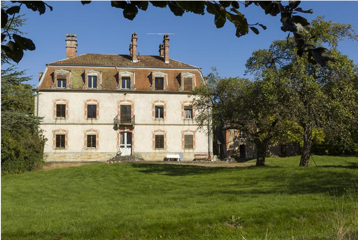
La demeure, vue depuis le parc.

70, Passavant-la-Rochère, lieudit : la Rochère