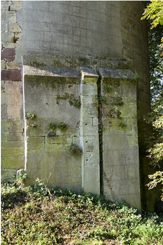
Emplacement probable d'une ancienne porte.

70, Passavant-la-Rochère, 1 rue du Château