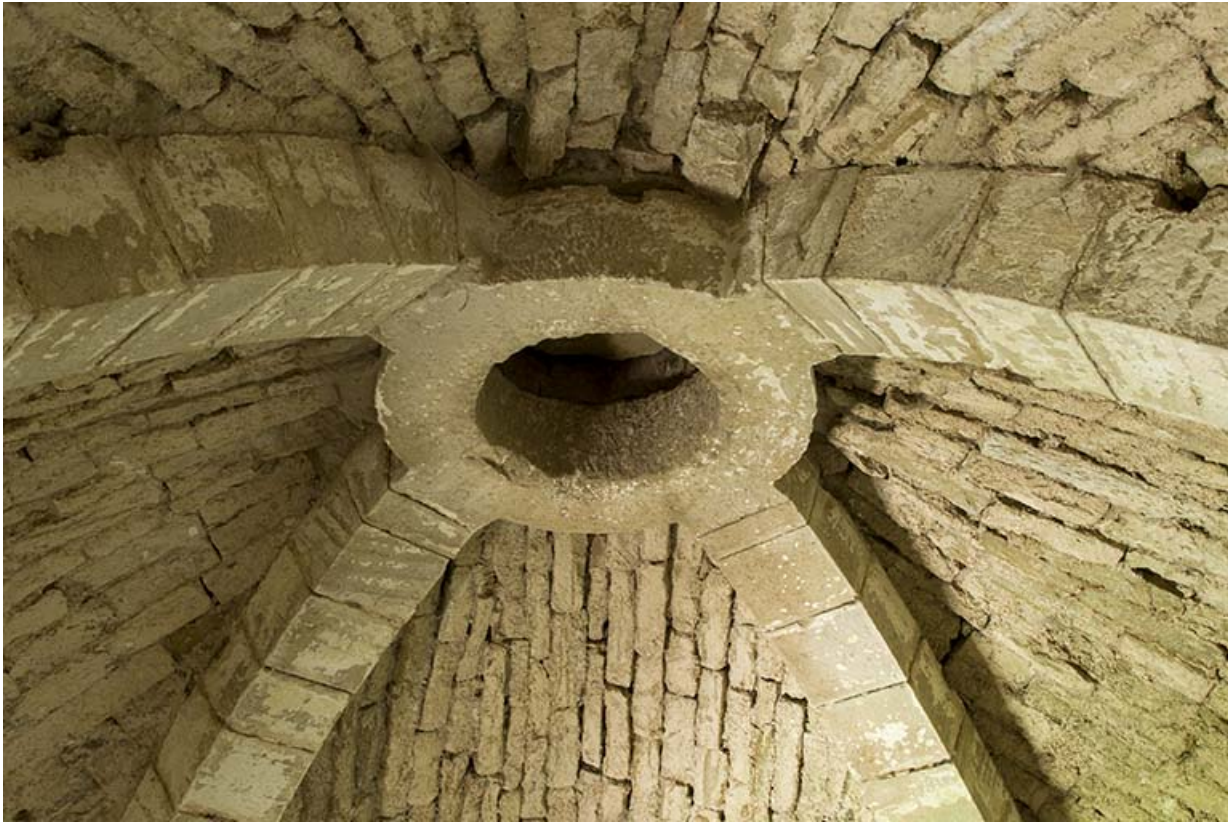
Détail de la clé de voûte.

70, Passavant-la-Rochère, 1 rue du Château