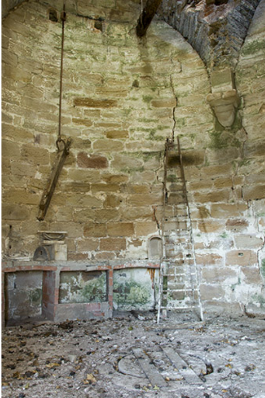
Mur circulaire du donjon.

70, Passavant-la-Rochère, 1 rue du Château