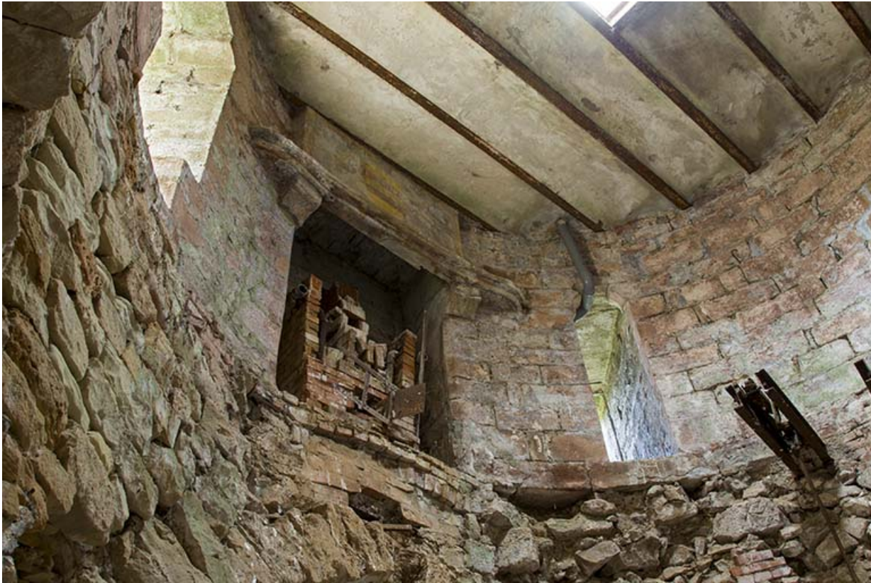
Vue sur la cheminée encore en place au second étage.

70, Passavant-la-Rochère, 1 rue du Château