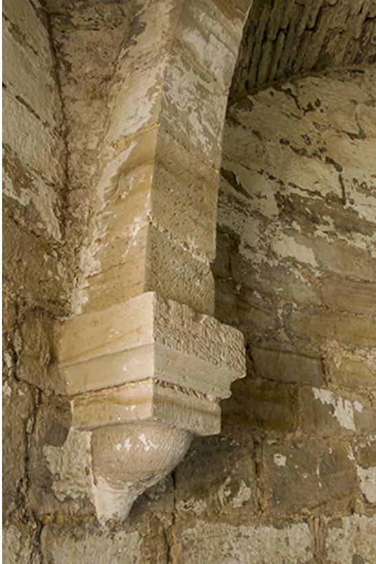
Détail d'un culot.

70, Passavant-la-Rochère, 1 rue du Château