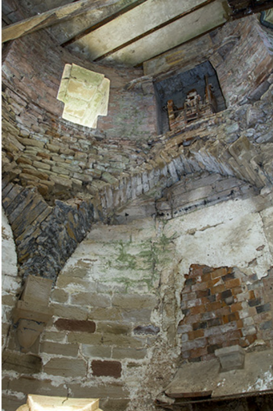
Intérieur du donjon.

70, Passavant-la-Rochère, 1 rue du Château