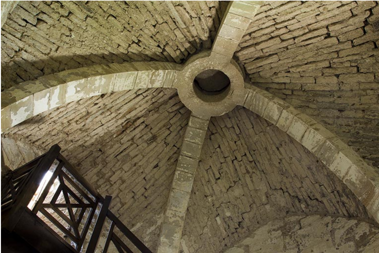
Le plafond voûté du rez-de-chaussée du donjon.

70, Passavant-la-Rochère, 1 rue du Château