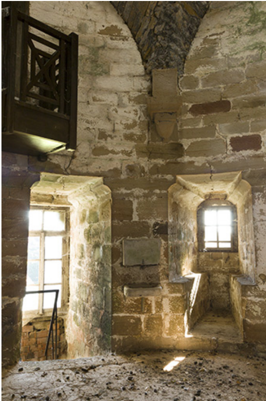
Détail d'une baie du premier étage du donjon.

70, Passavant-la-Rochère, 1 rue du Château