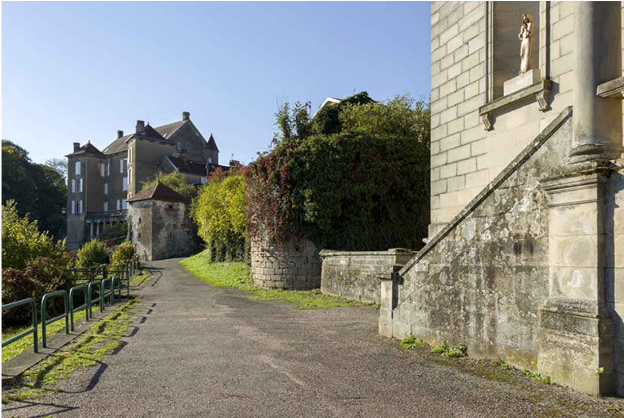
Ruines d'une tour près de l'église.