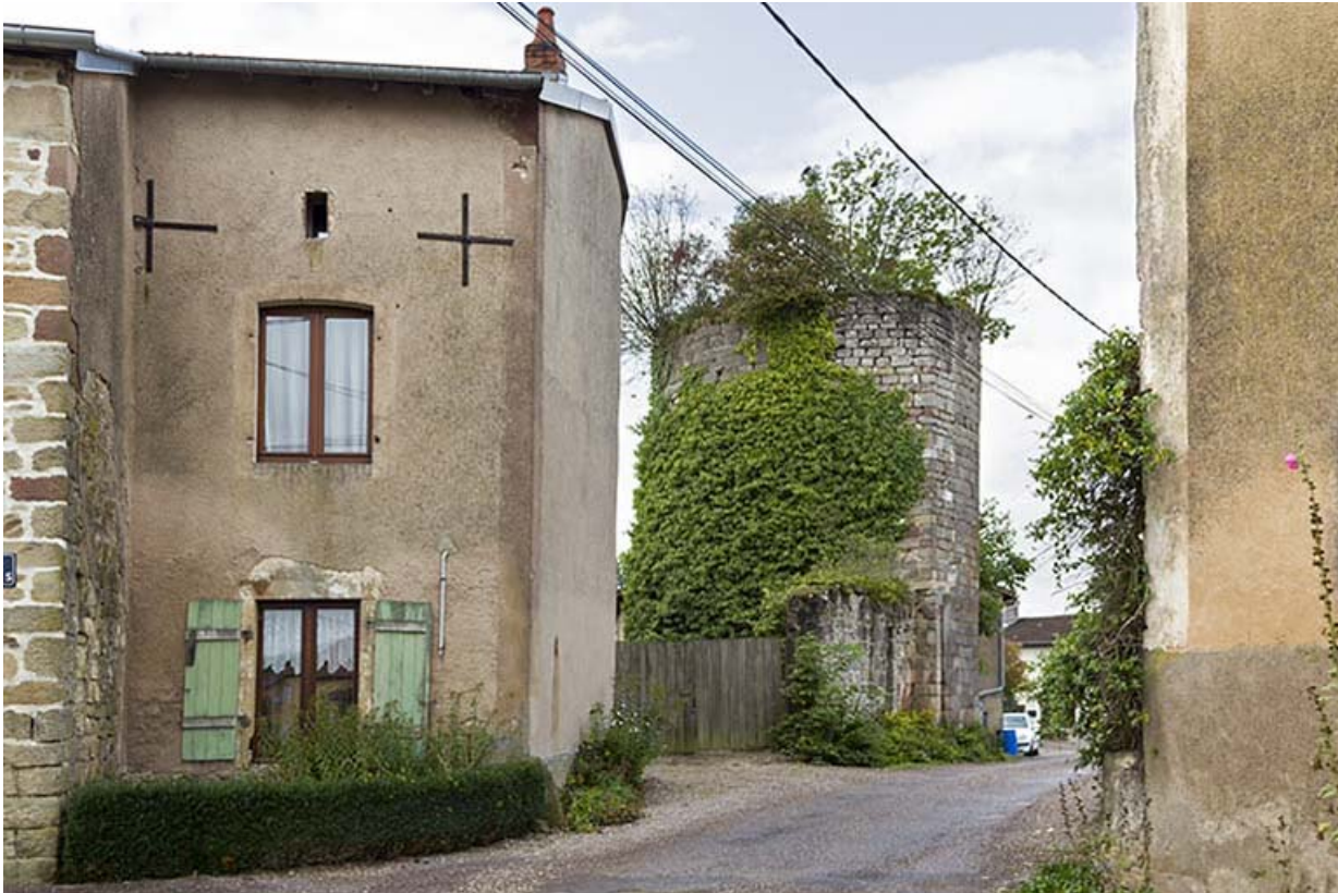
La tour dite Mathey, rue du Bourg.