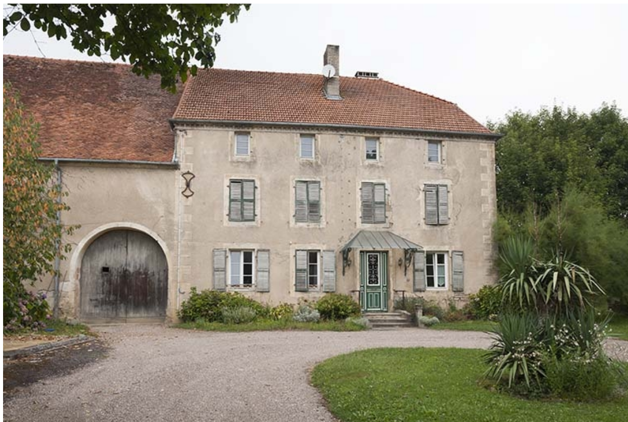
Vue générale de trois quarts de la maison.