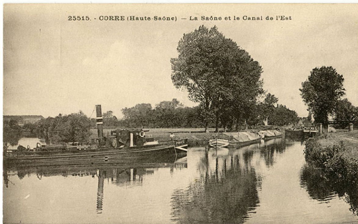
Corre. (Haute-Saône) La Saône et le canal de l'est. Carte postale n°25515. 70, Corre

Corre. (Haute-Saône) La Saône et le canal de l'est. Carte postale n°25515. [s.n., s.d.] Cette vue présente un bateau nommé Pirate.