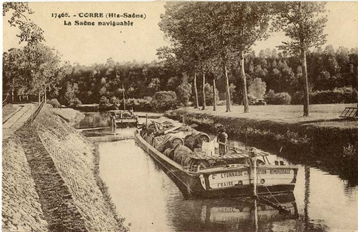
Corre. La Saône navigable. Carte postale n° 17466 70, Corre

Corre (Haute-Saône) La Saône navigable. Carte postale n°17468. [s. n. , s. d. ]. Donne à voir un bateau nommé Fraise de la Compagnie lyonnaise de navigation et remorquage.