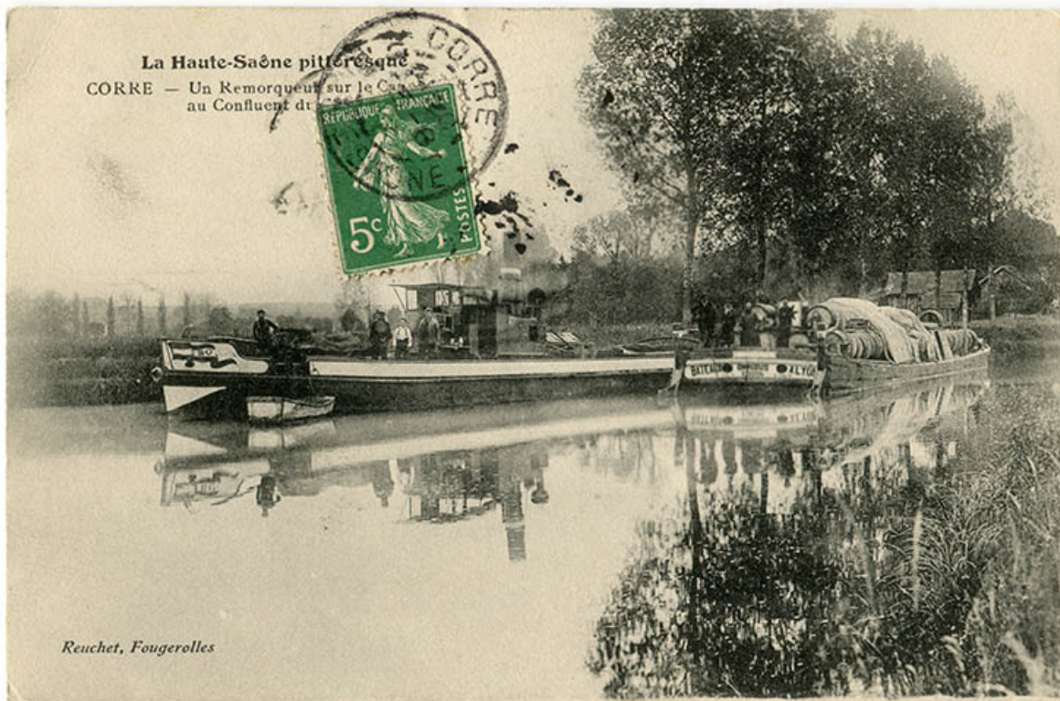
La Haute-Saône pittoresque. Un remorqueur sur le canal au confluent du Coney et de la Saône. Carte postale. 70, Corre

La Haute-Saône pittoresque. Un remorqueur sur le canal au confluent du Coney et de la Saône. Carte postale, Edition Reuchet, Fougerolles. Carte affranchie le 26/08/1913.