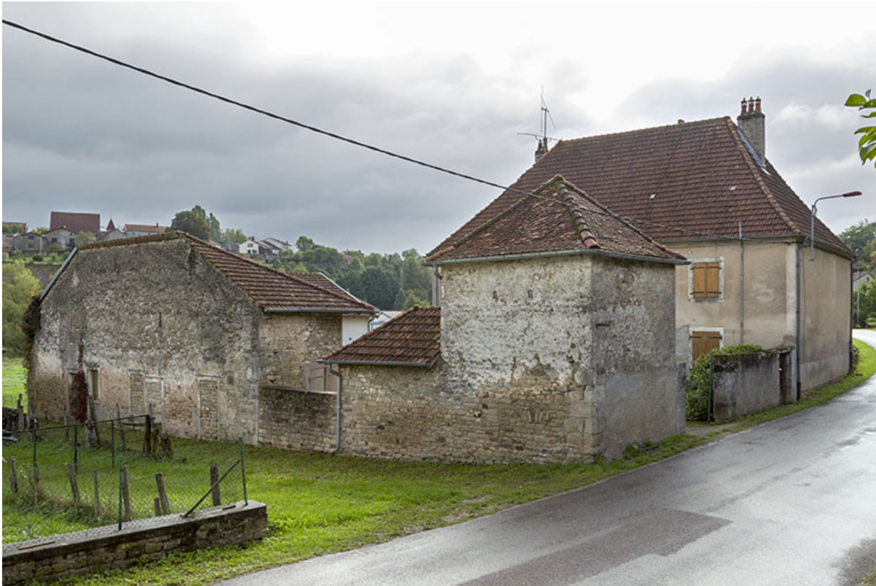
Vue d'ensemble depuis la rue du Presbytère.