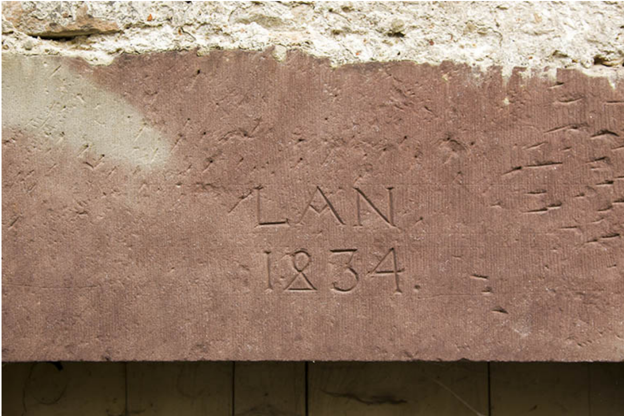
Détail d'une date portée.