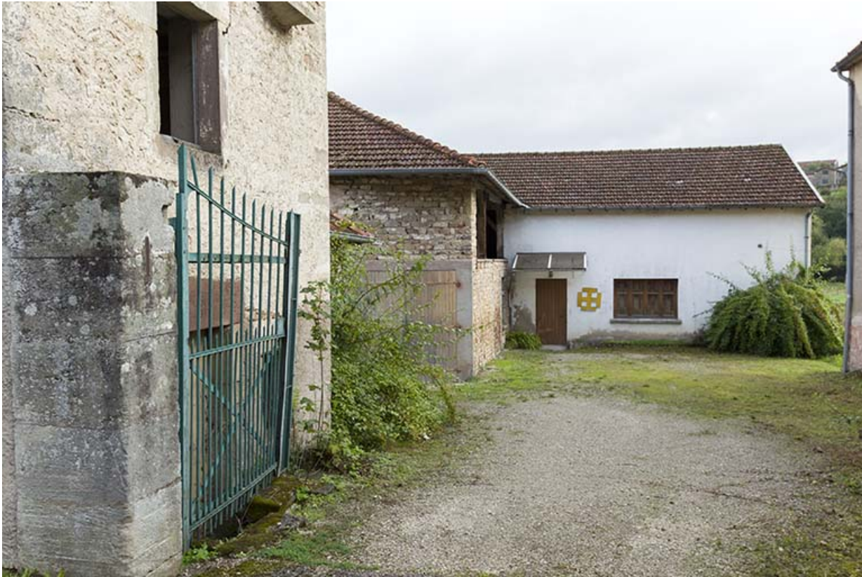
Vue sur la cour intérieure depuis la voie publique.