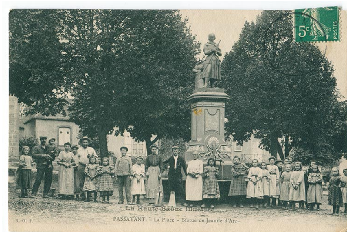
La place publique, carte postale.