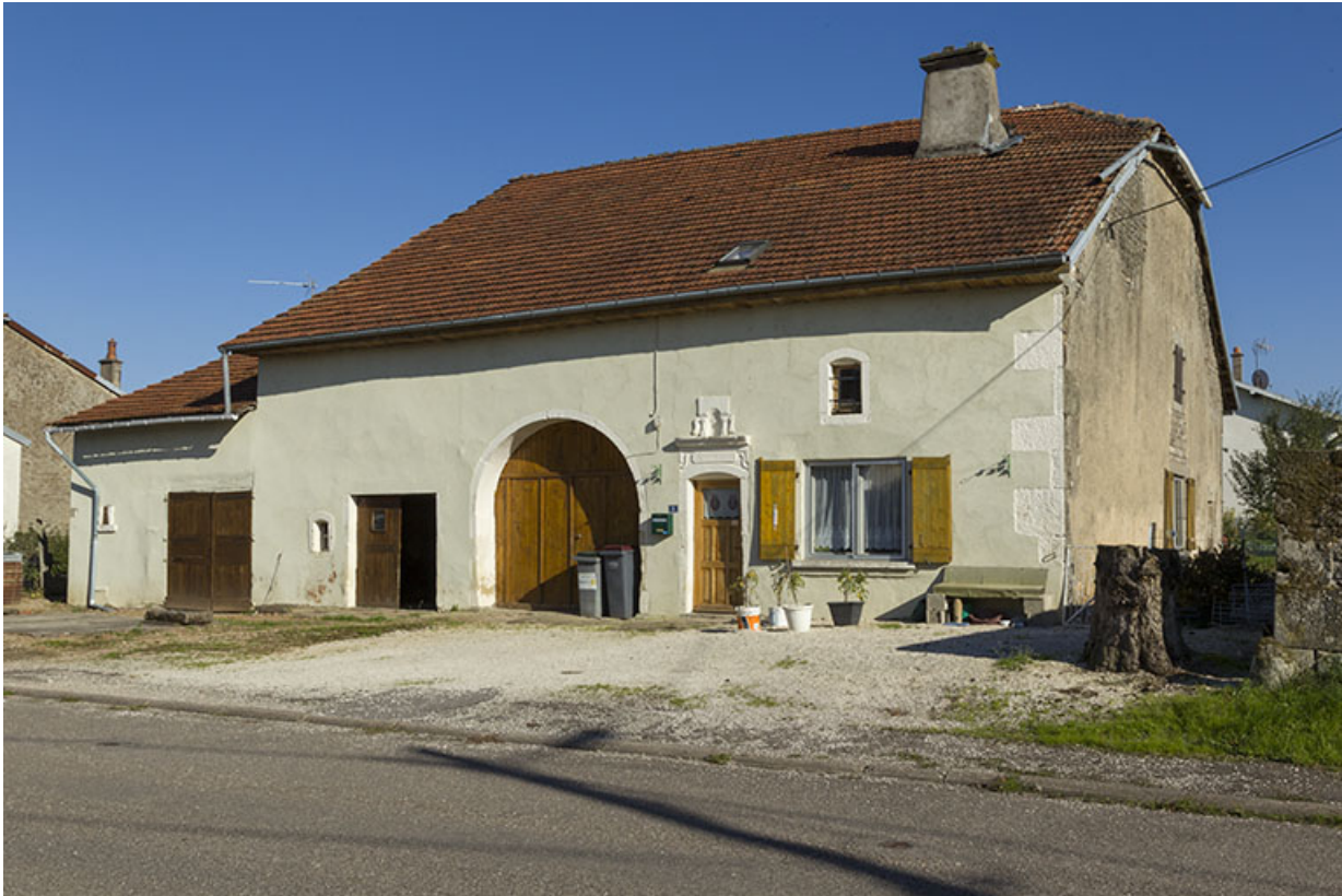
Ferme, rue Royale.