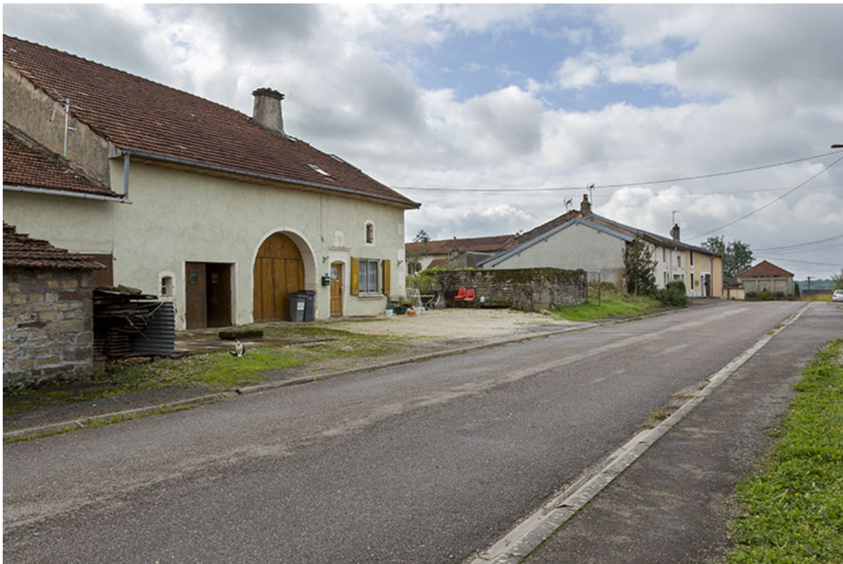
La rue Royale avec le lavoir rue Saint-Antoine en arrière plan - la Côte. 70, Passavant-la-Rochère