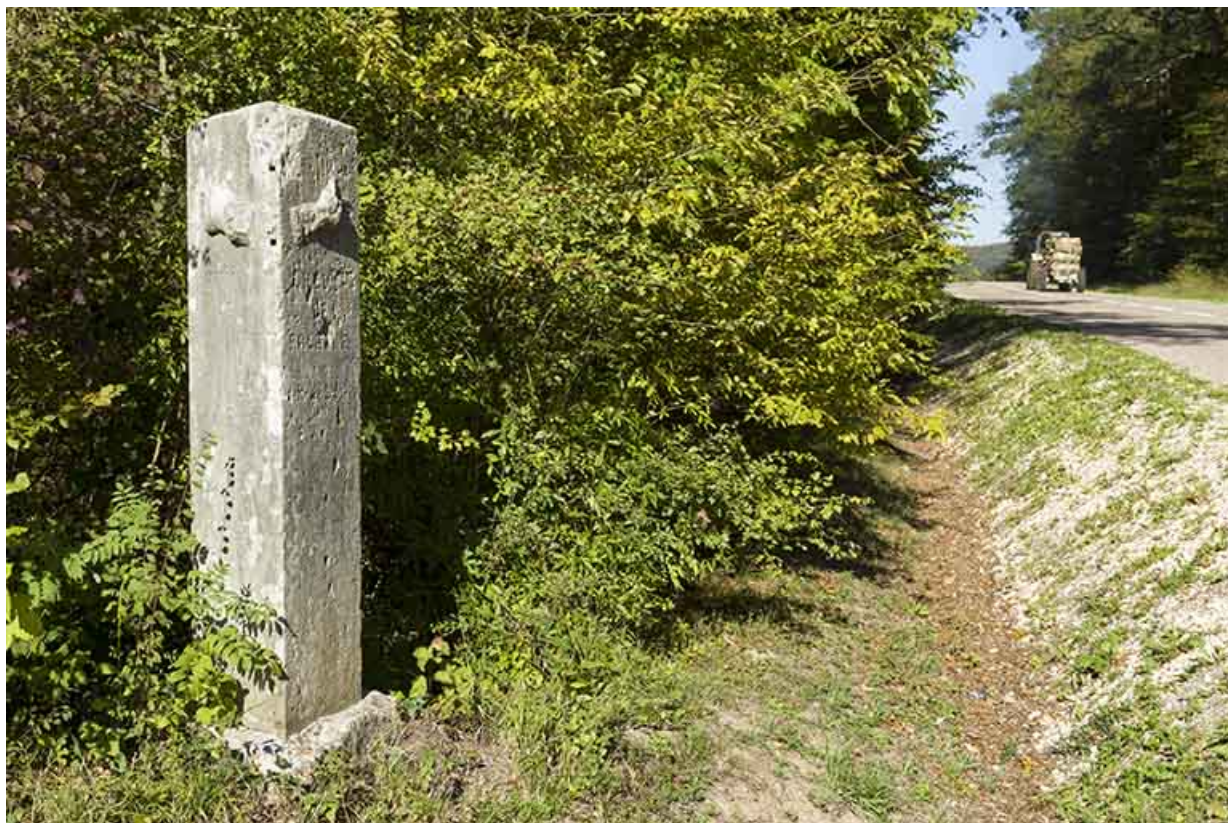
Ancienne borne de direction située entre Passavant et la Rochère.