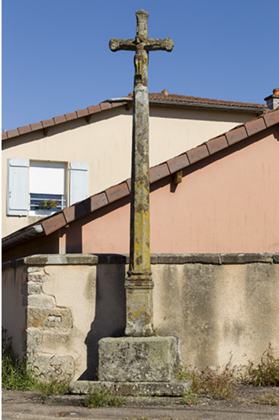
Croix à l'angle de la rue Royale et de la rue Saint-Antoine avec en arrière plan l'ancienne école enfantine de la Côte. 70, Passavant-la-Rochère