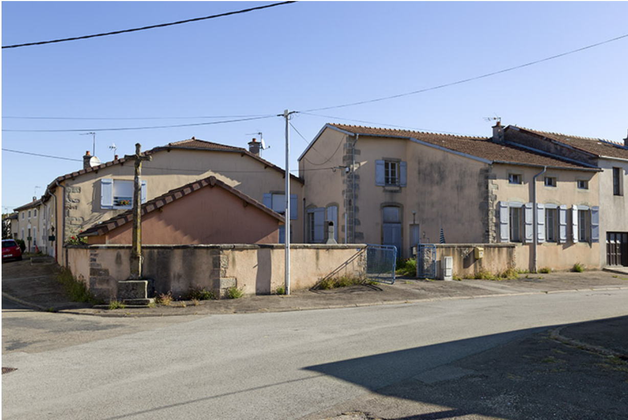
Ancienne école enfantine de la Côte.