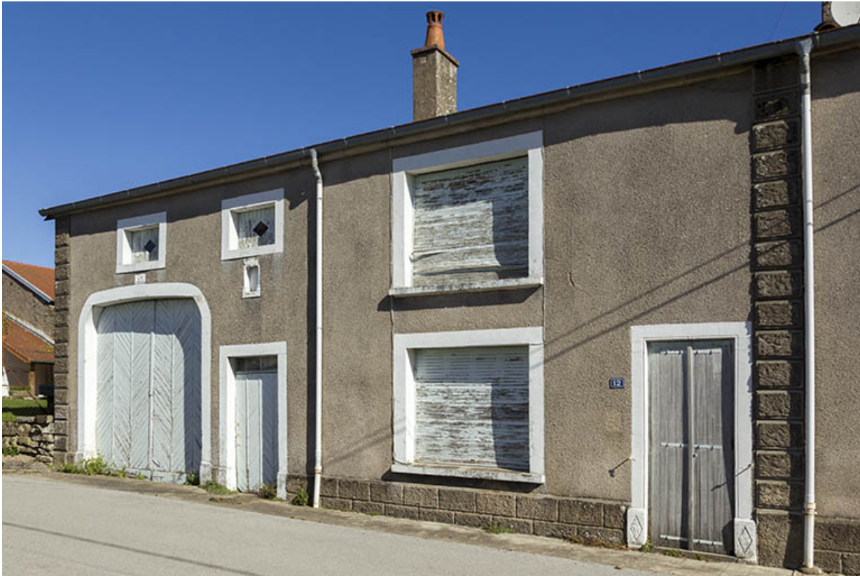
Ferme, rue Saint-Antoine.