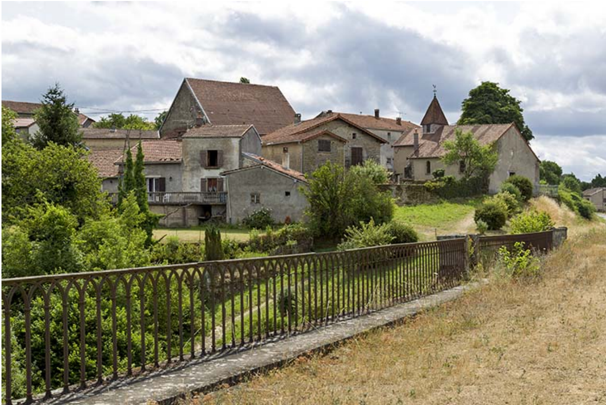
Vue sur la chapelle Saint-Antoine depuis le viaduc.