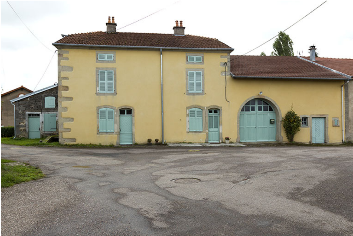
Ferme, rue de la Pompe. 70, Passavant-la-Rochère