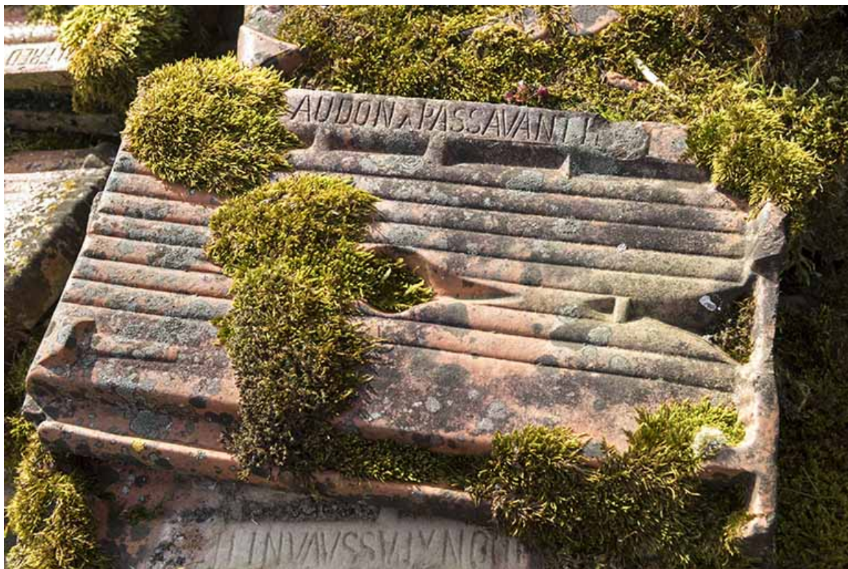
Tuile mécanique de la tuilerie Audon.