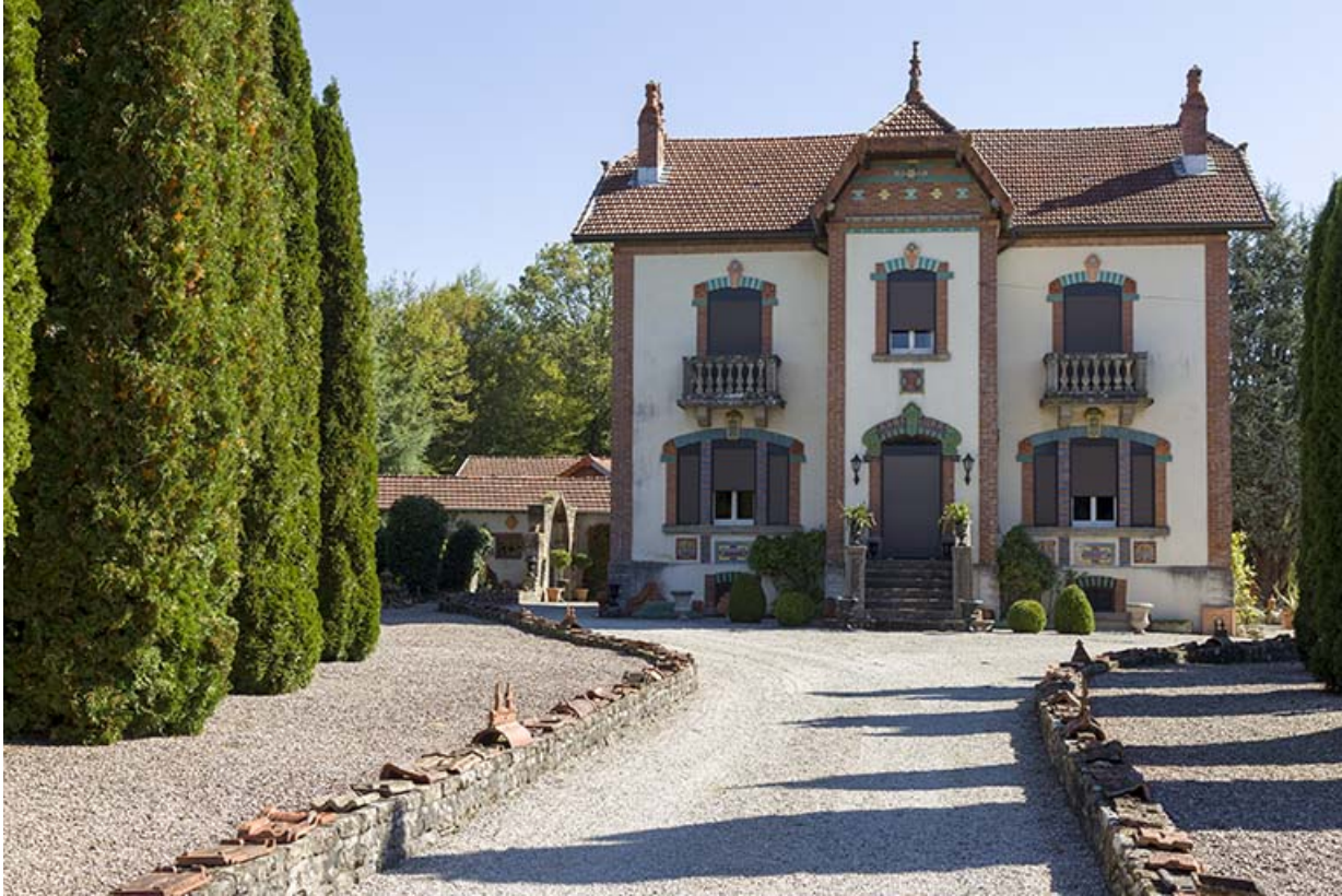
Ancien logement patronal.