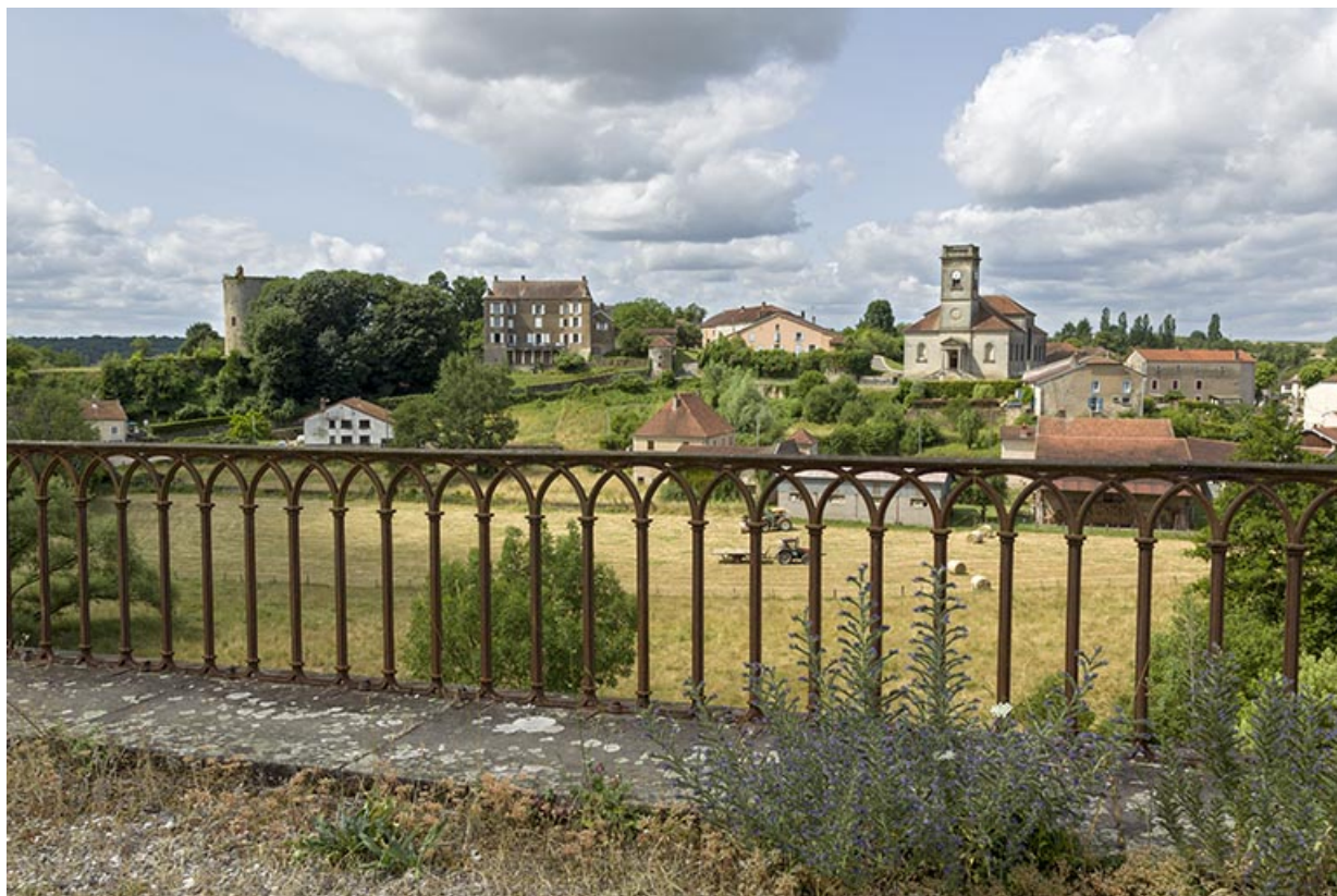
Vue sur le village de Passavant depuis le viaduc.