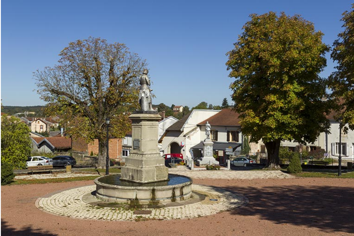
La fontaine Jeanne d'Arc sur la place publique.