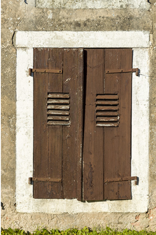
Détail d'une baie avec ses volets.