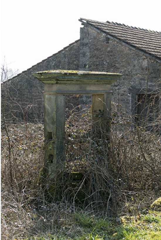
Ancien puits du bourg fortifié.