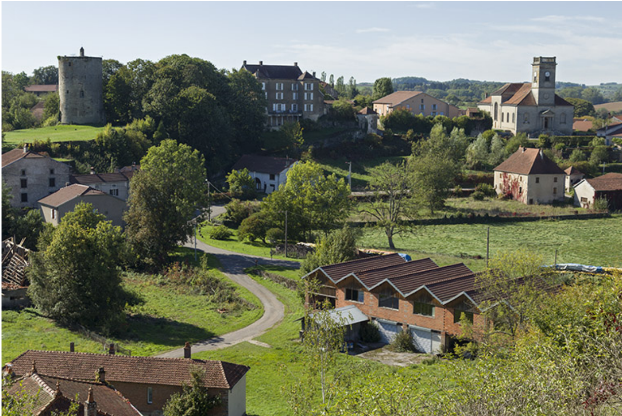
Vue sur la tuilerie Calvie et Cie depuis la "Côte". 70, Passavant-la-Rochère