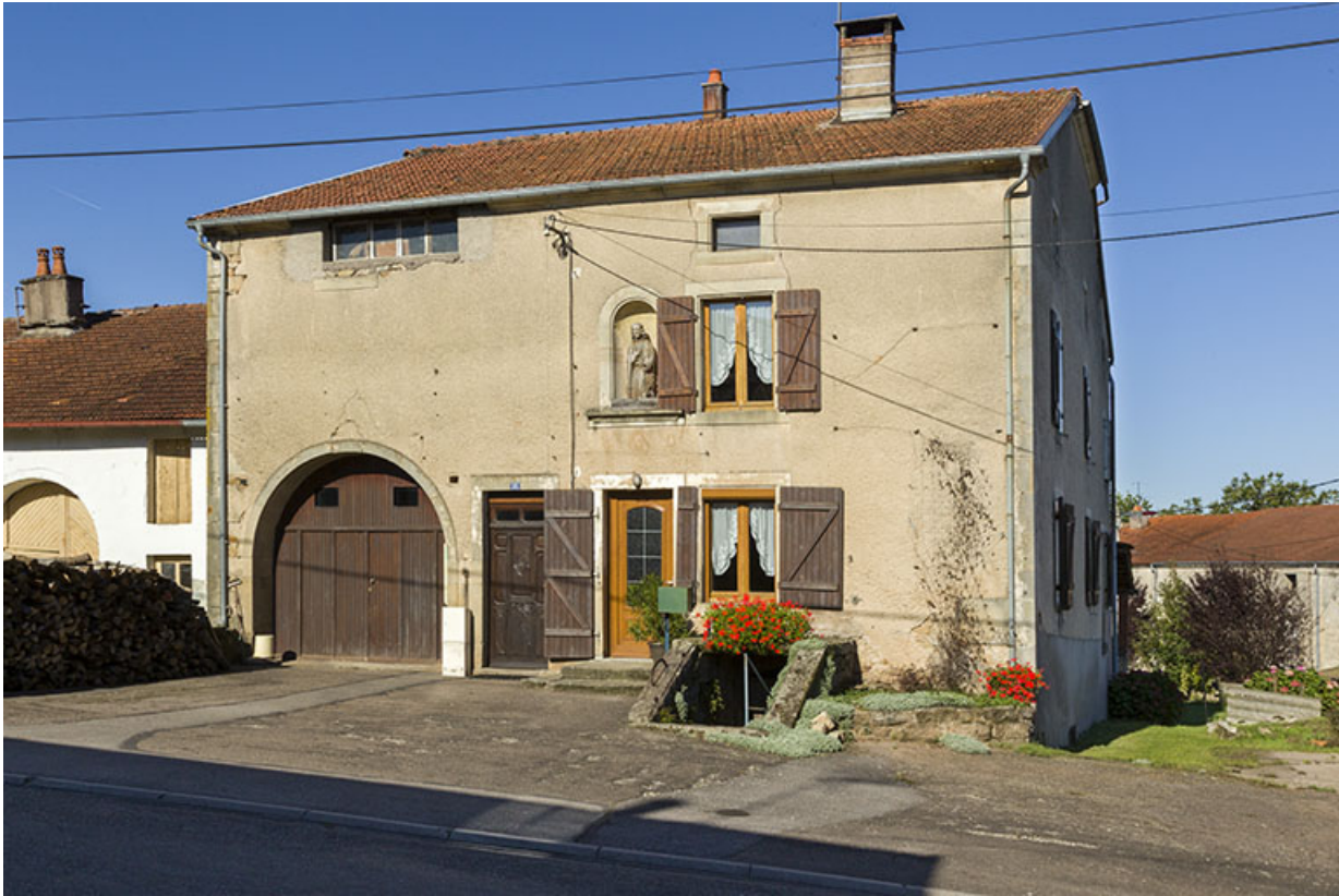
Ferme, rue Royale.