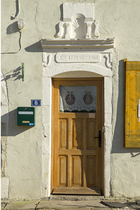
Détail d'une porte, rue Royale.