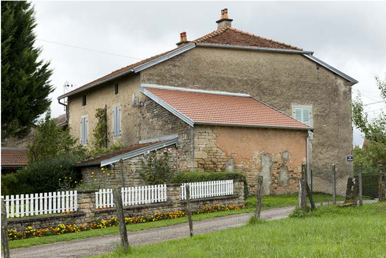
Ferme transformée en maison.