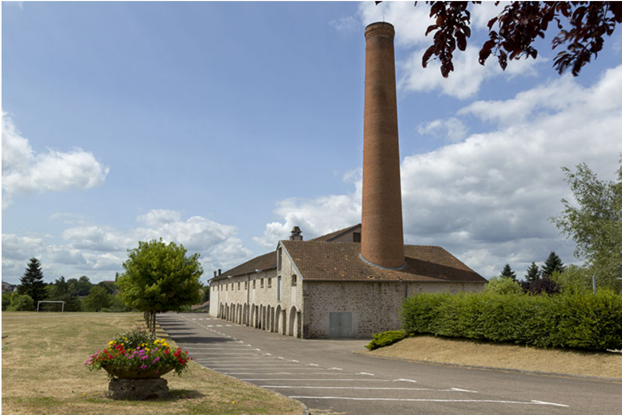
La tuilerie Bourgogne, actuelle salle des fêtes.