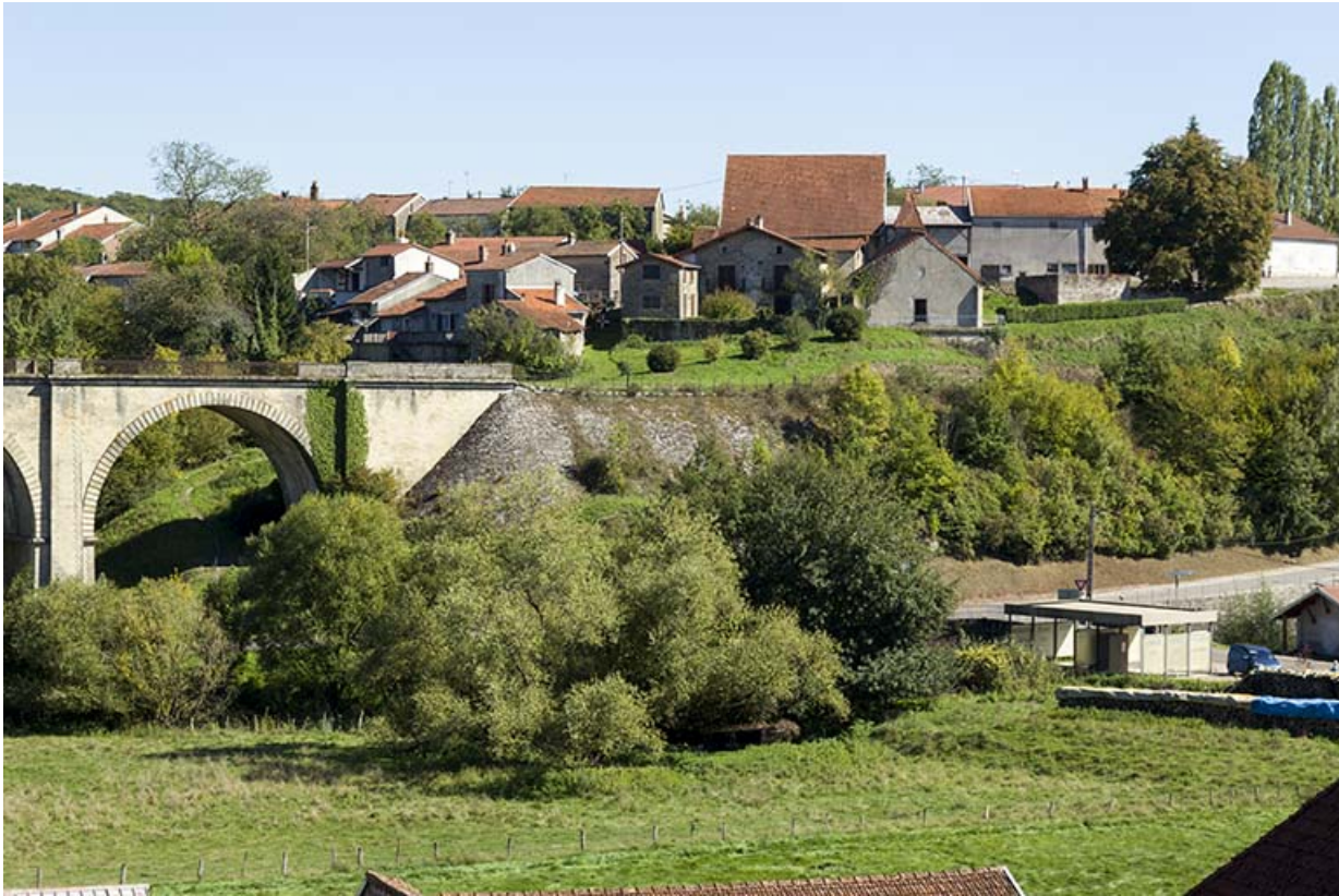
Vue sur la "côte".