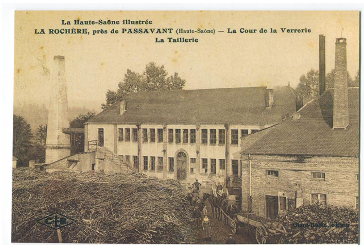
La verrerie de la Rochère, carte postale. 70, Passavant-la-Rochère

Passavant-la-Rochère : La cour de la verrerie - la taillerie. Carte postale, éd : Musée des techniques et cultures comtoises, Nancray, fin 19e siècle.