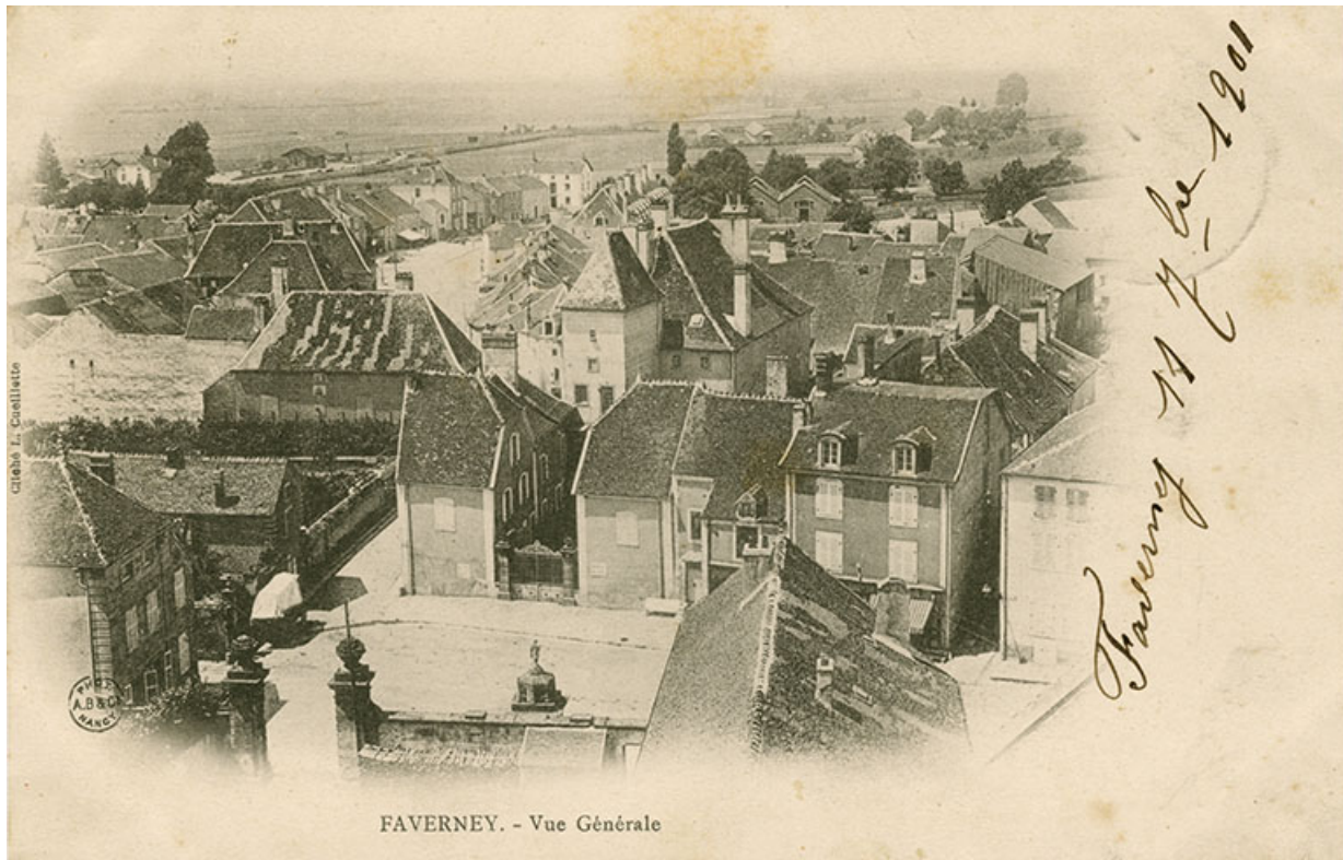
Demeure dite hôtel de Citey, puis château de Poinctes, carte postale, cliché L. Cueillette/ Photo A.B et Cie/Nancy, date manuscrite 11 septembre 1901

70, Faverney, 6, 8 place de la République