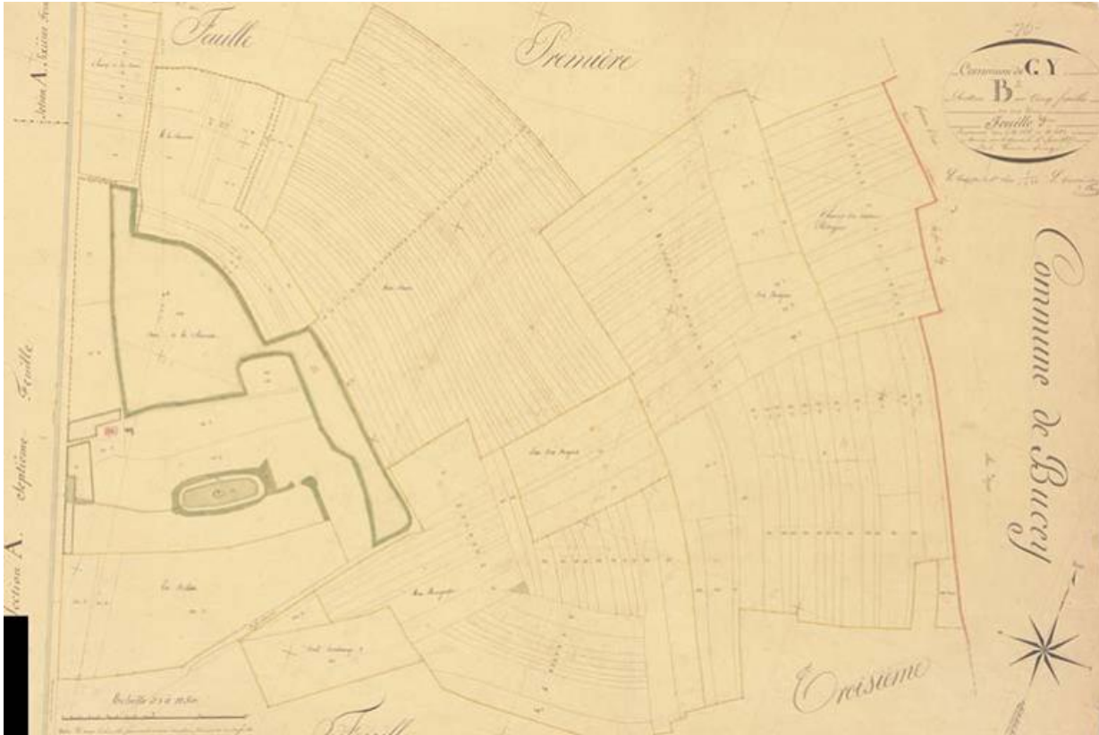
La Charmotte sur le cadastre de 1837 (feuille de section B2) 70, Gy, lieudit : la Charmotte