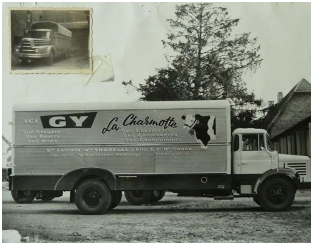
La Charmotte, photographie ancienne