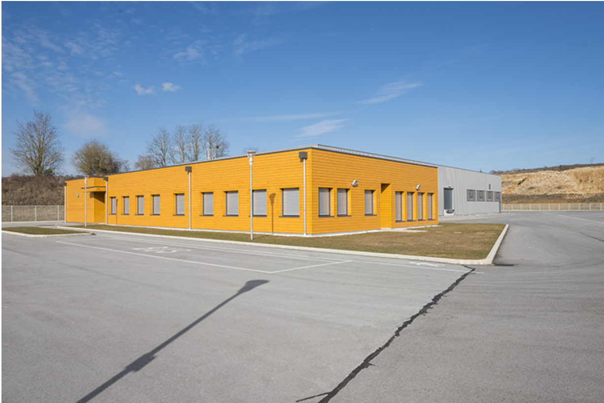
Angle sud-ouest et façade d'entrée ouest du bâtiment d'enseignement, façade sud de l'atelier. 70, Arc-lès-Gray Jean-Jaures avenue