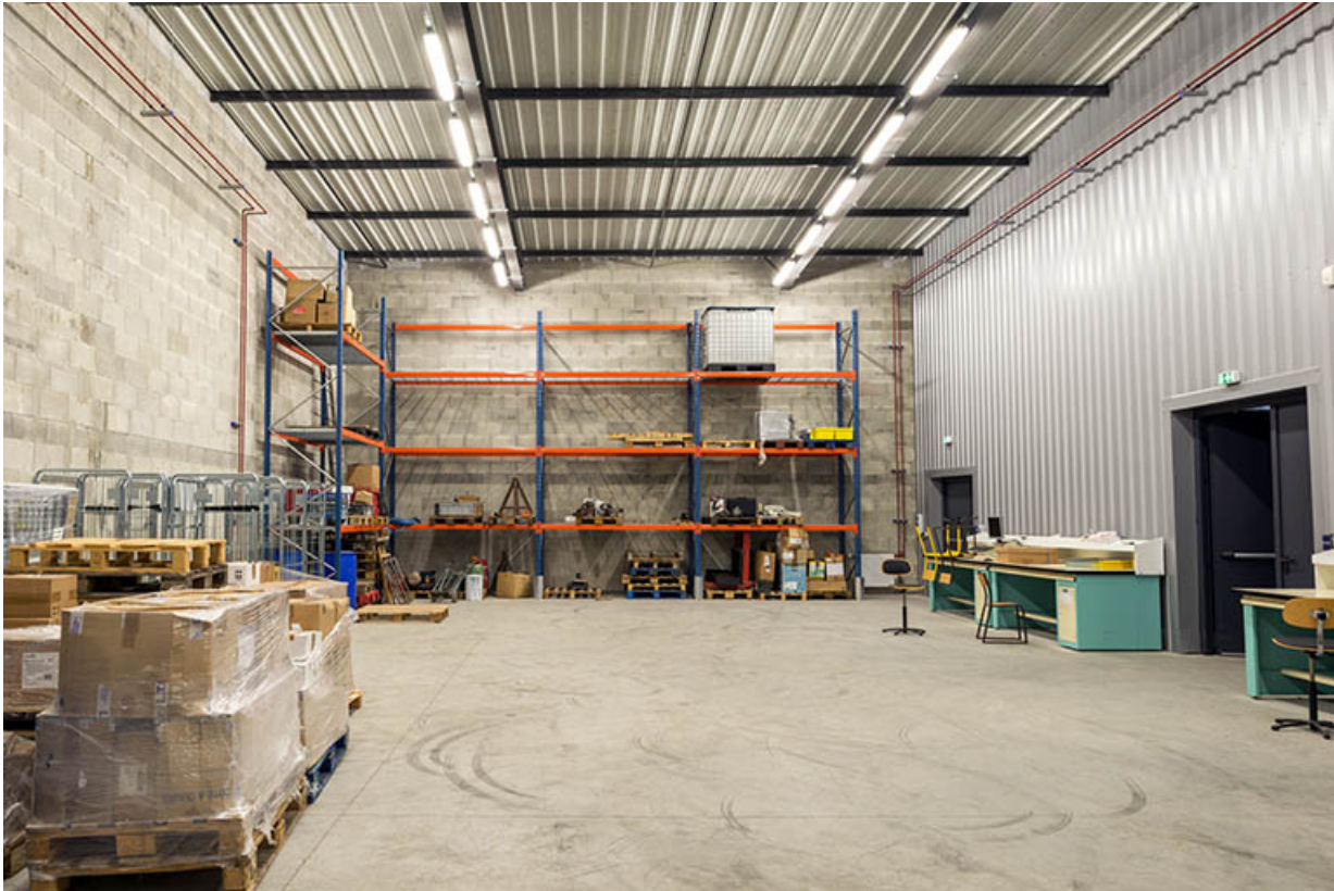
Vue intérieure des ateliers.