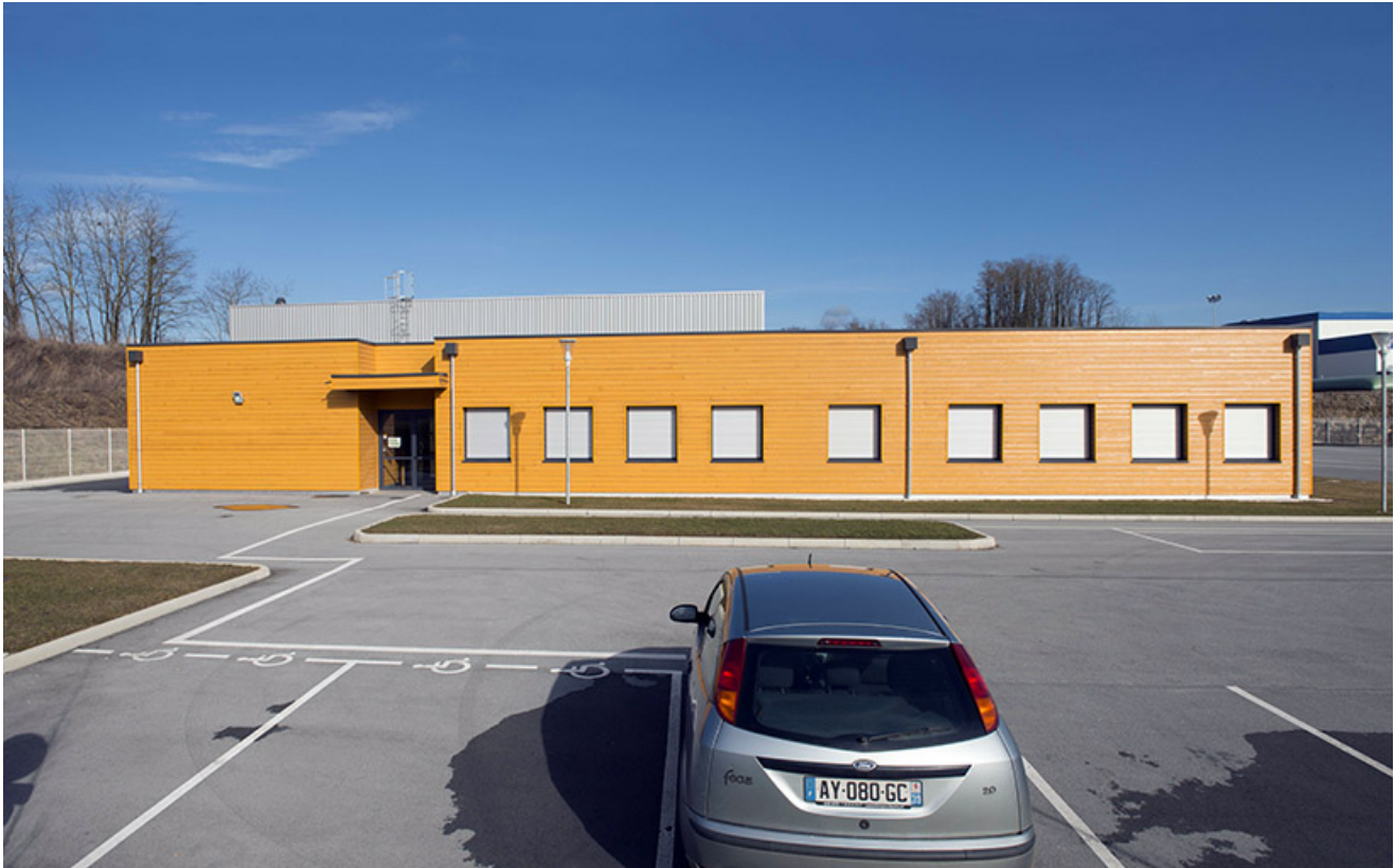
Façade antérieure ouest, entrée des salles de cours.