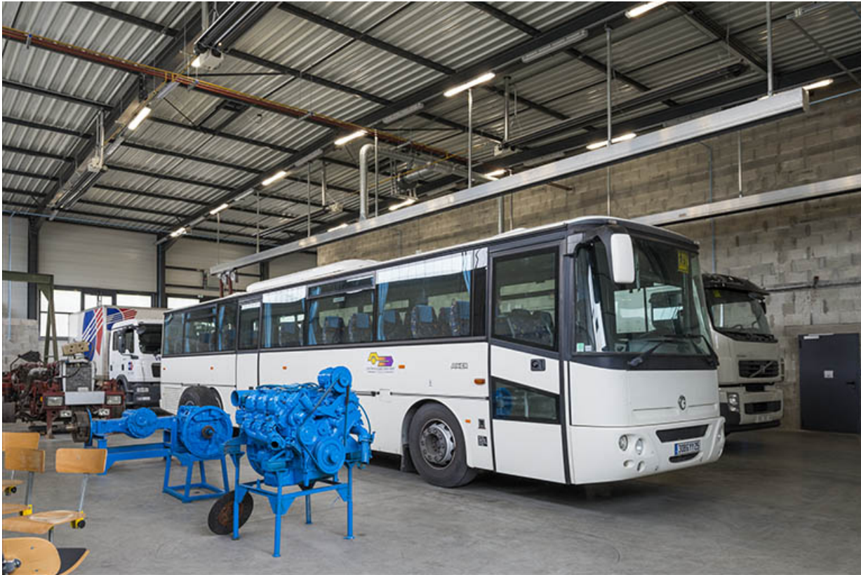
Vue intérieure des ateliers.