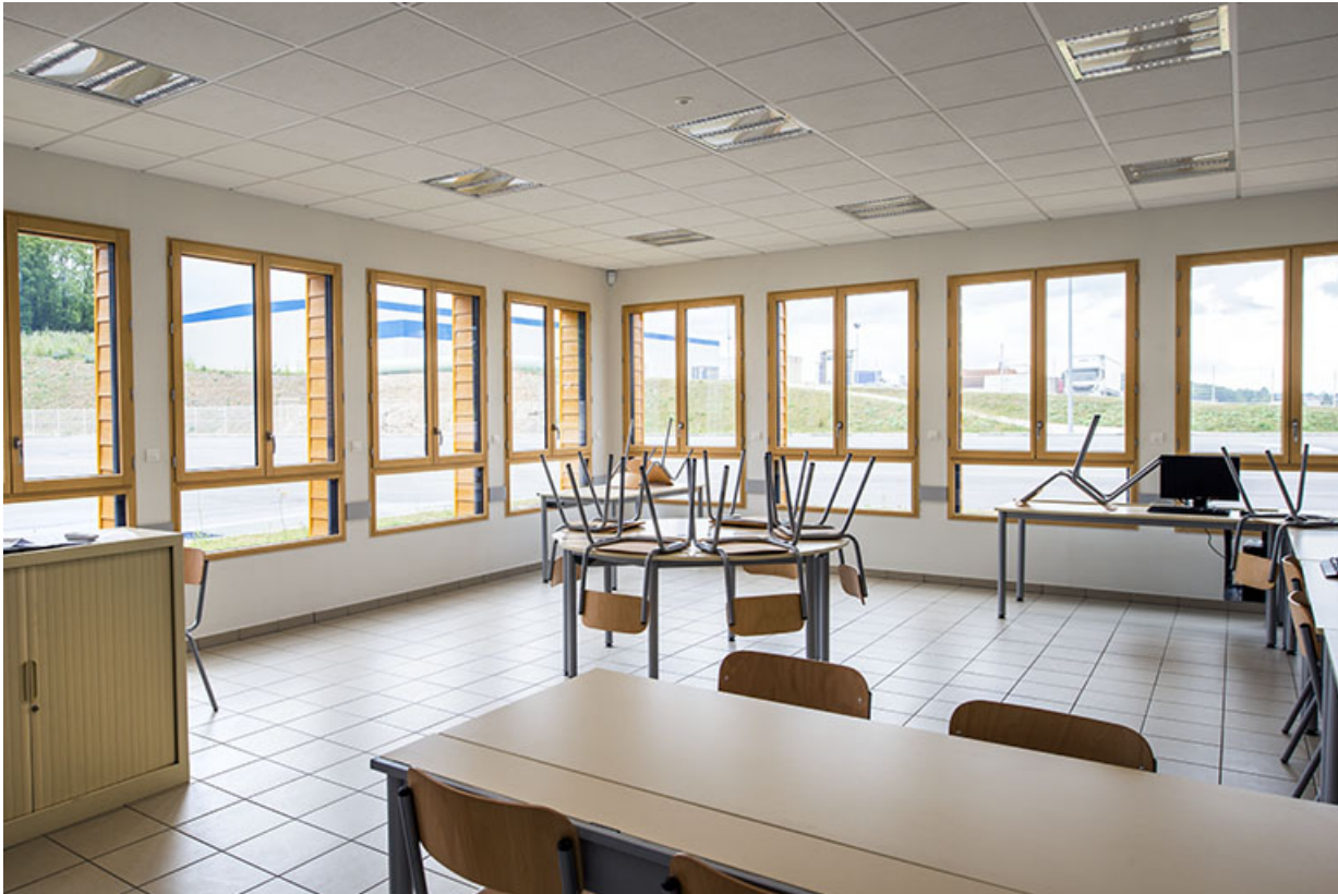
Salle de pistes dans le bâtiment d'enseignement.