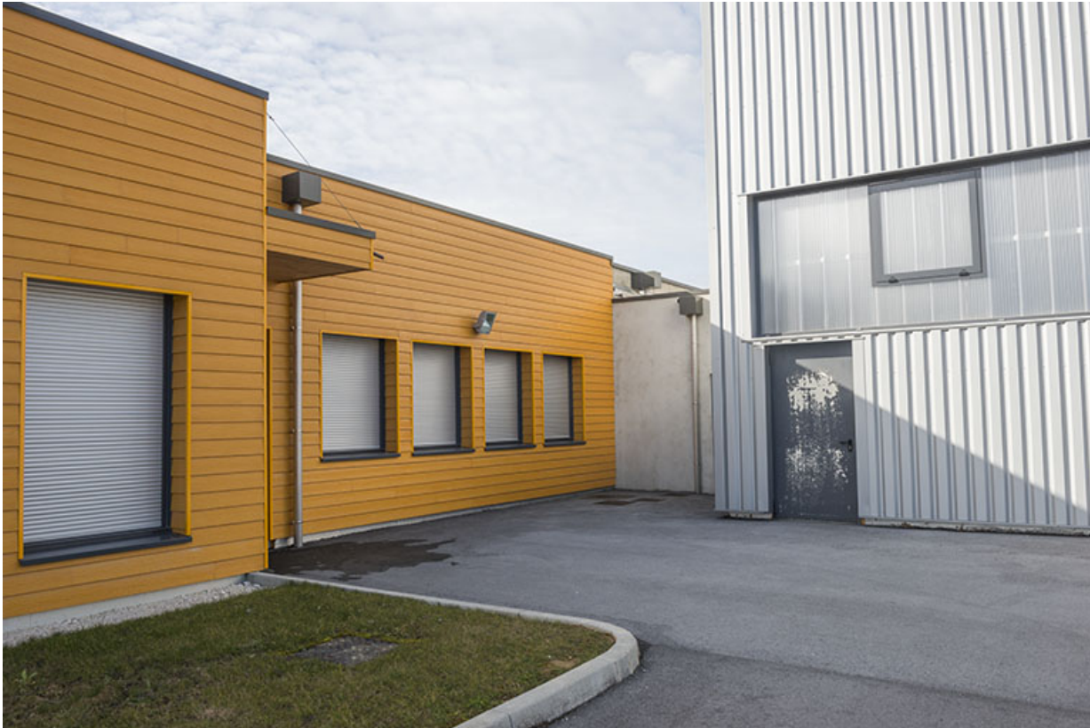
Facade et entrée est des salles de cours, jouxtant la chaufferie et les ateliers. 70, Arc-lès-Gray Jean-Jaures avenue