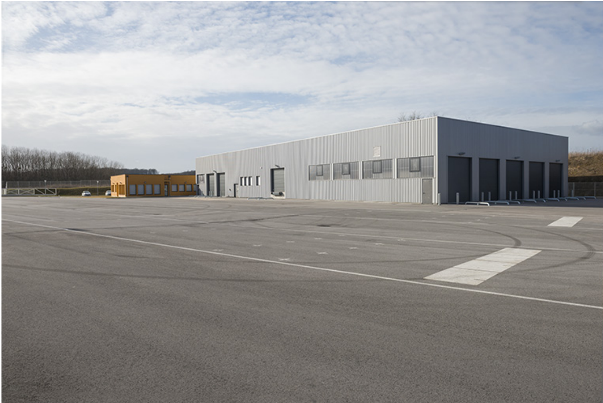
Vue d'ensemble des pistes, des ateliers et salles de cours depuis le sud-est.