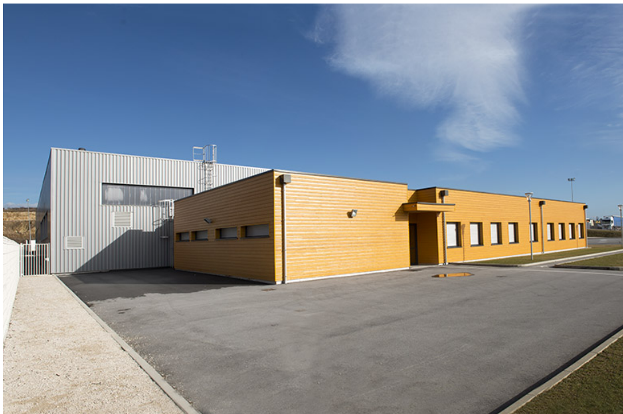
Angle nord-ouest, façade d'entrée ouest du bâtiment d'enseignement et angle nord-ouest de l'atelier. 70, Arc-lès-Gray Jean-Jaures avenue