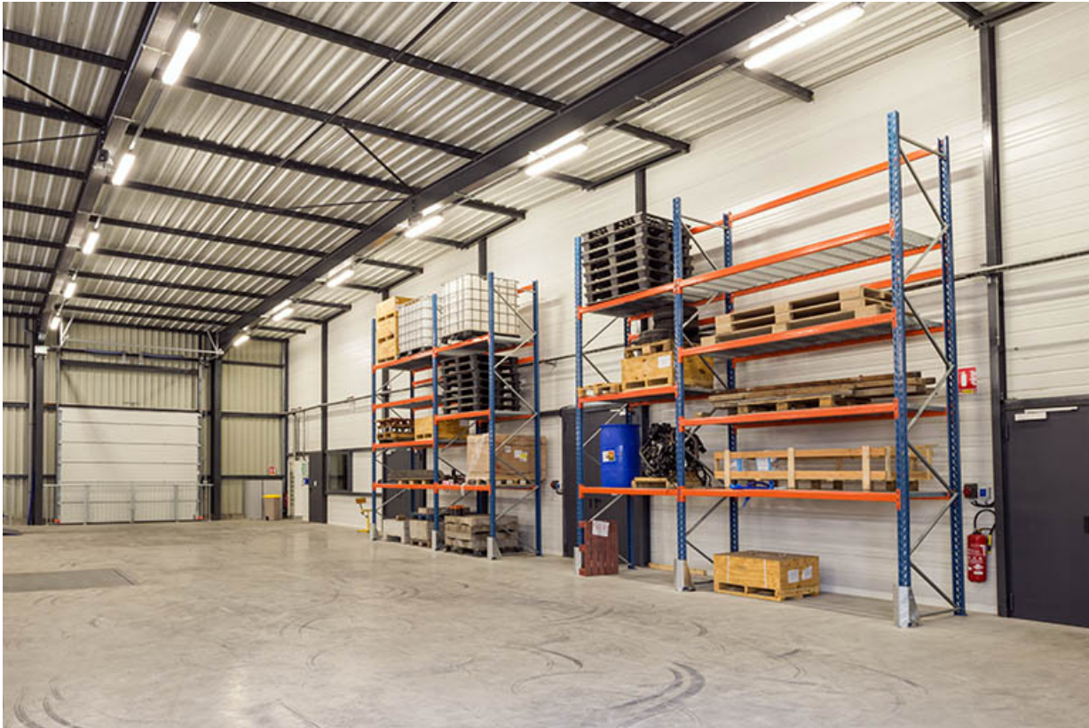
Vue intérieure des stockages dans l'atelier.