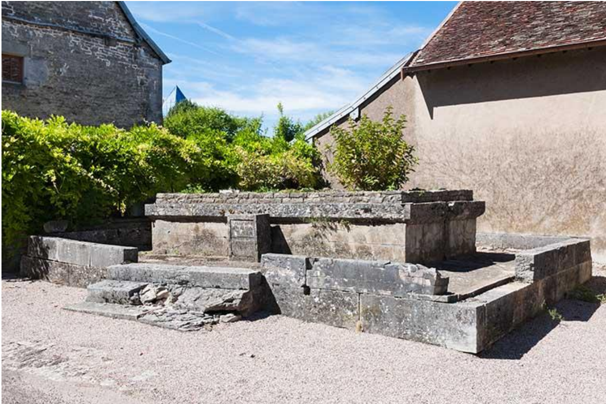
Emplacement de l'ancien lavoir de la ville haute 70, Gy