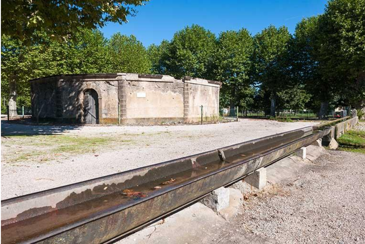
Vue générale du lavoir et de l'abreuvoir 70, Gy