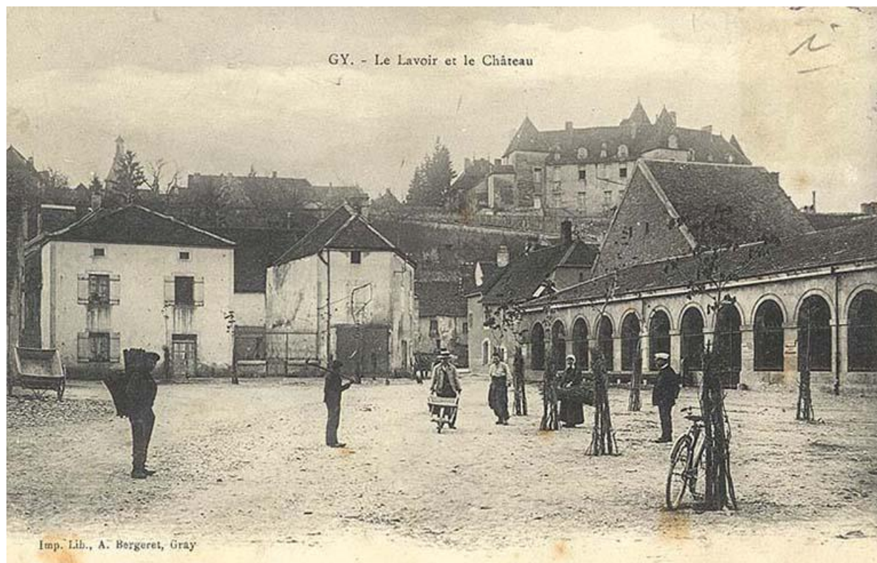
Le lavoir sur une carte postale ancienne