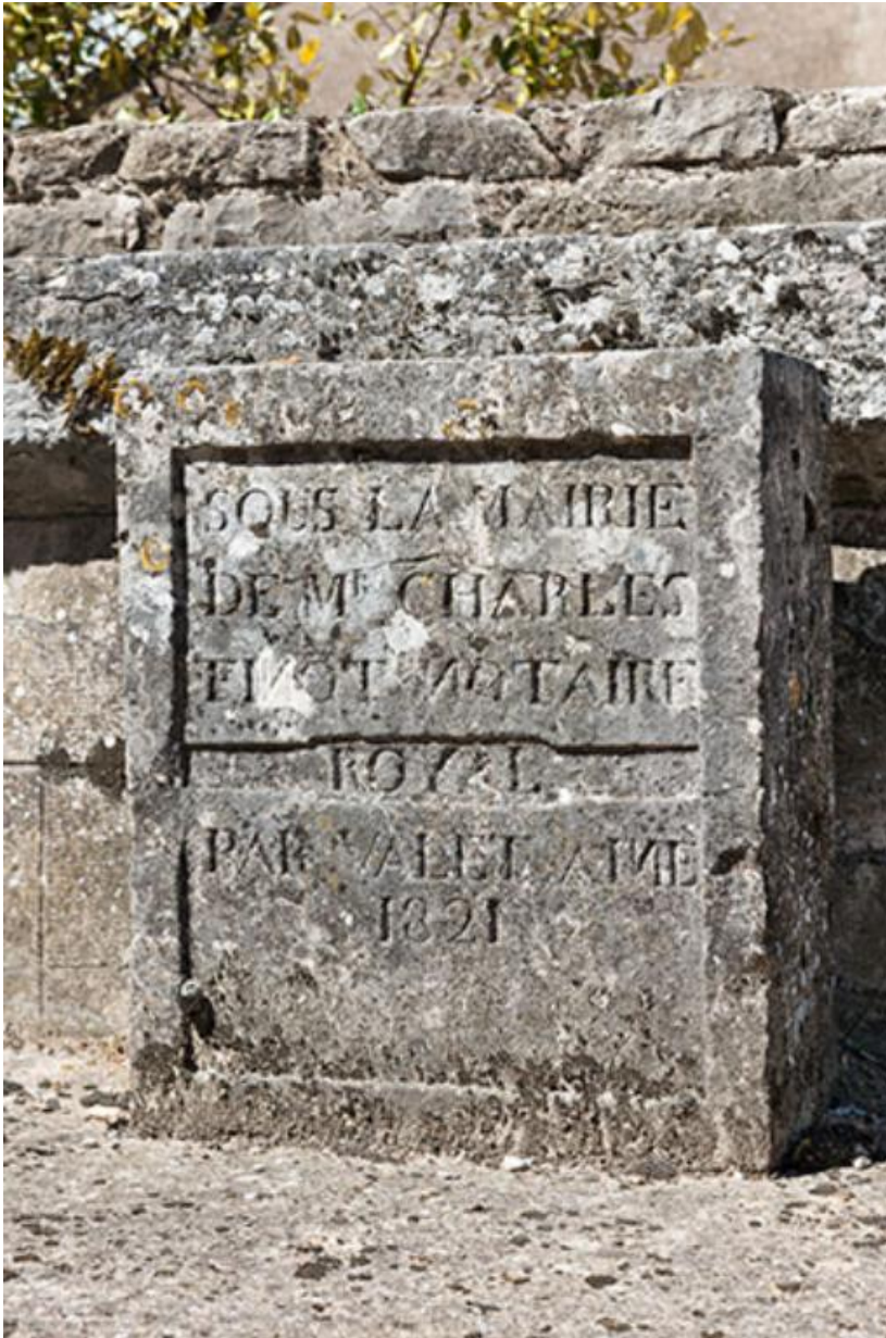
Détail de la stèle