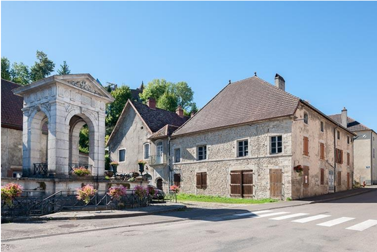
Vue d'ensemble nord-est 70, Gy