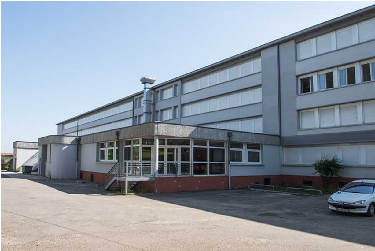
Façade ouest postérieure du bâtiment d'externat et de restauration.

70, Vesoul, 18 rue Edouard Belin, lieudit : Grand Mont Marin