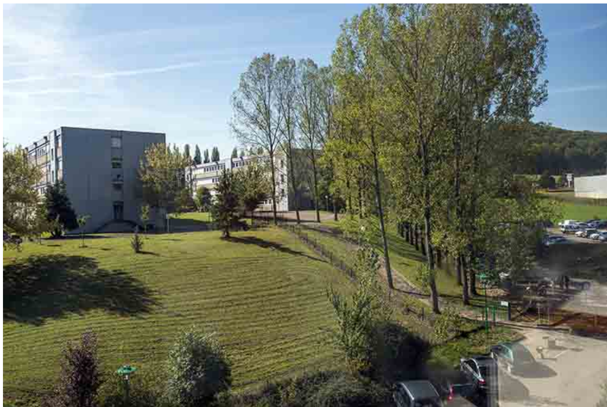
Au second plan, angle nord-est de l'internat du lycée Belin affecté au lycée Munier. 70, Vesoul, 16 rue Edouard Belin, lieudit : Grand Mont Marin