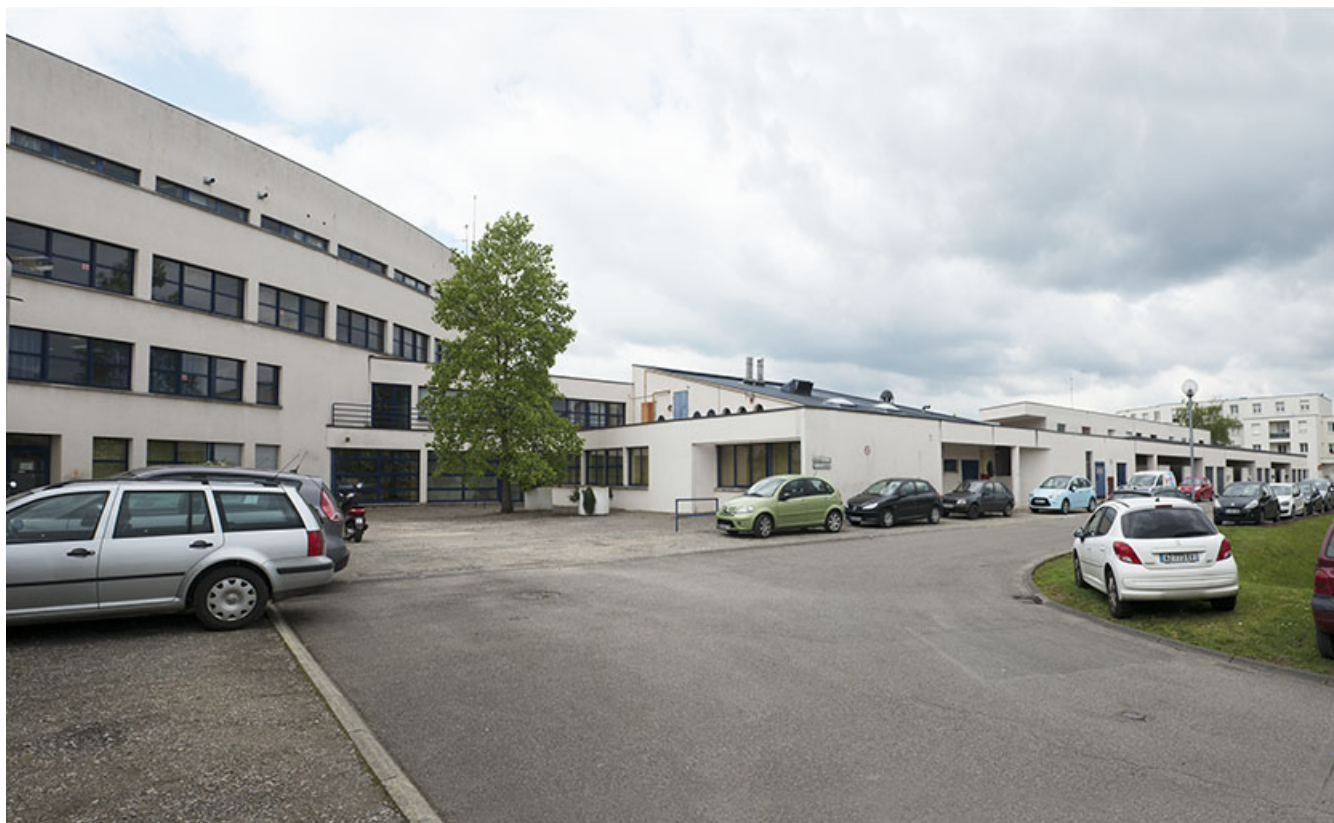
Cour postérieure nord, dite cour d'honneur, au nord de l'externat semi-circulaire, angle nord-est des cuisine et façade nord, garages rue Mendès France.