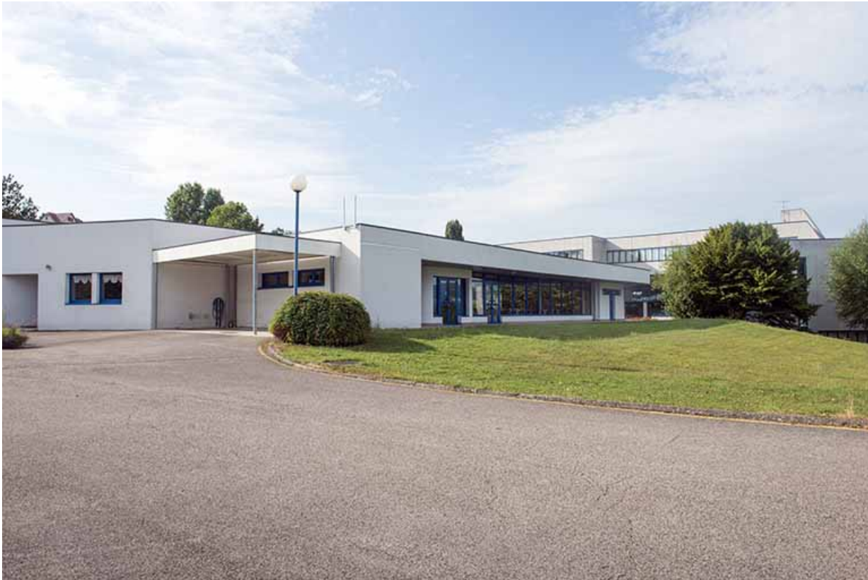
Angle nord-ouest et façade ouest de la restauration.

70, Vesoul, 1 rue Jean Georges Girard, lieudit : le grand Miselot