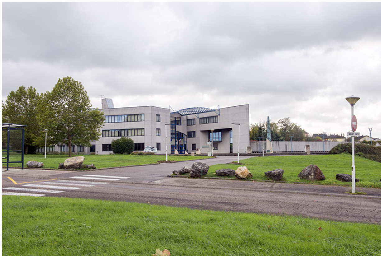
Vue d'ensemble de l'entrée et de quelques éléments de sculpture depuis le nord-ouest.

70, Vesoul, 1 rue Jean Georges Girard, lieudit : le grand Miselot