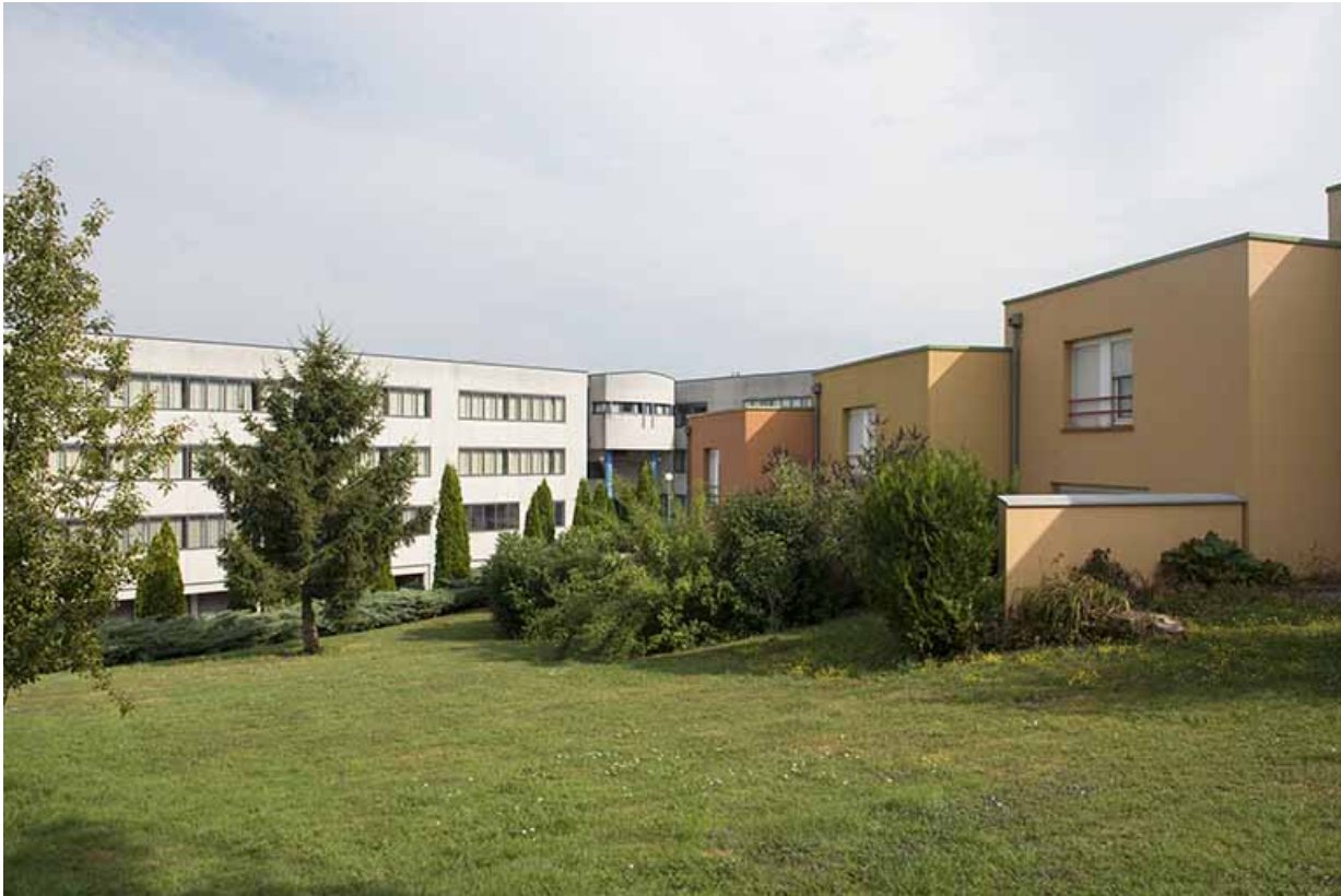
Façades postérieures ouest des logements et façade postérieure sud-est du lycée.

70, Vesoul, 1 rue Jean Georges Girard, lieudit : le grand Miselot