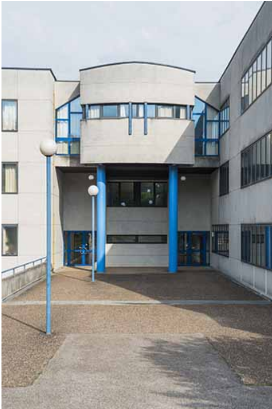
Détail de la façade sud-est, entrée postérieure.

70, Vesoul, 1 rue Jean Georges Girard, lieudit : le grand Miselot