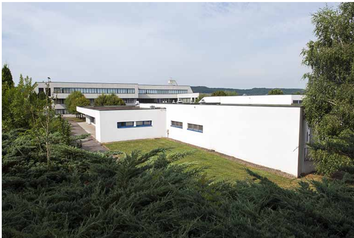
Angle nord-est, façade est de la restauration, façade nord de l'externat.

70, Vesoul, 1 rue Jean Georges Girard, lieudit : le grand Miselot