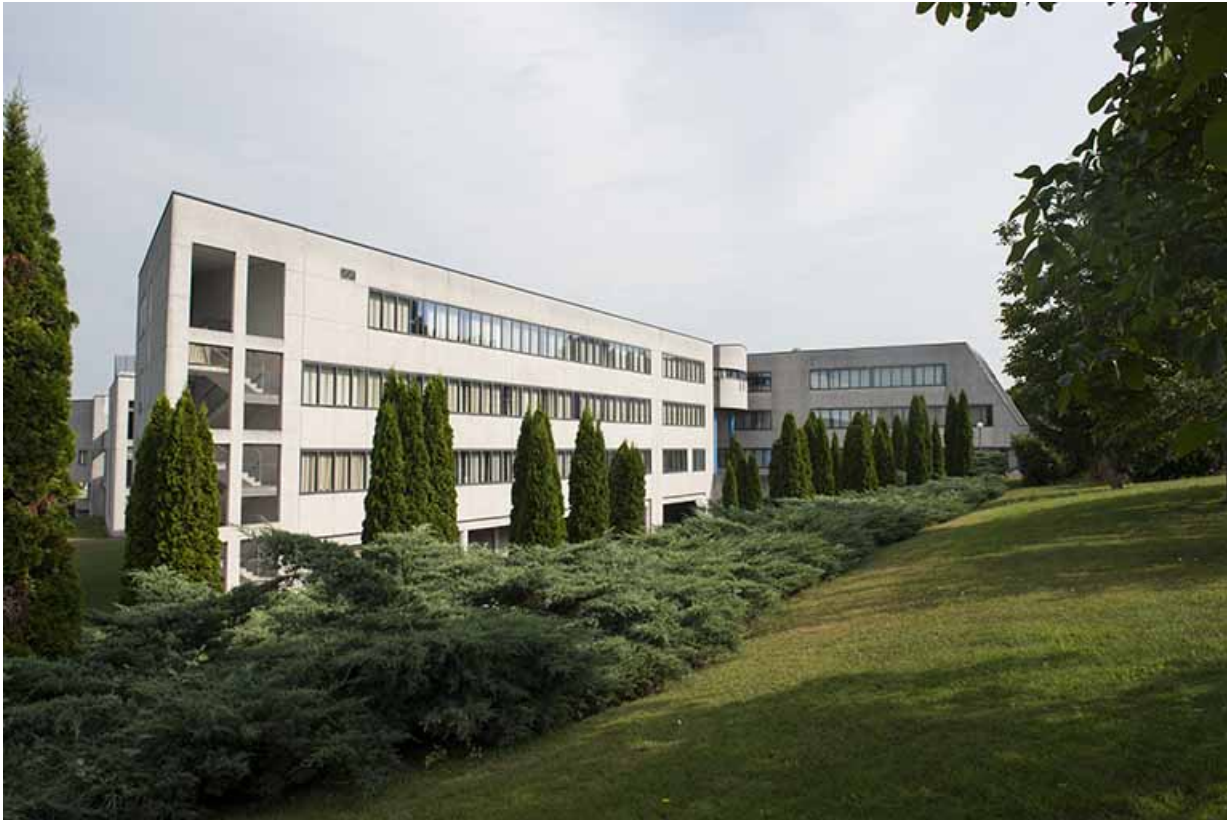
Angle sud, façade est, entrée postérieure.

70, Vesoul, 1 rue Jean Georges Girard, lieudit : le grand Miselot