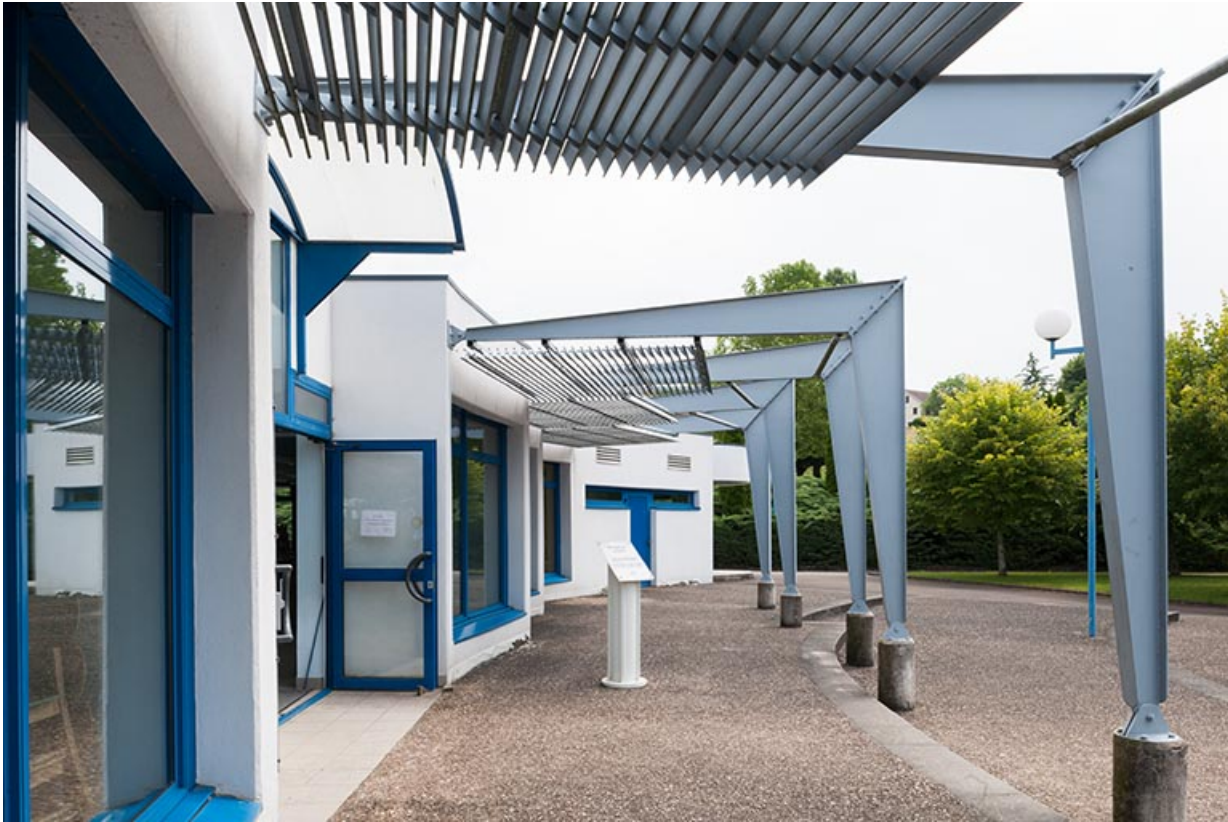
Détail de la façade d'entrée de la restauration.

70, Vesoul, 1 rue Jean Georges Girard, lieudit : le grand Miselot