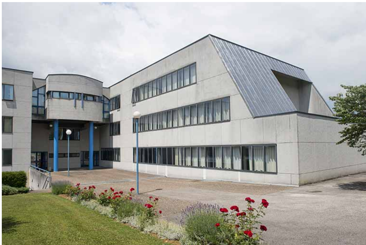
Entrée postérieure et angle sud de l'aile nord-est de l'externat.

70, Vesoul, 1 rue Jean Georges Girard, lieudit : le grand Miselot