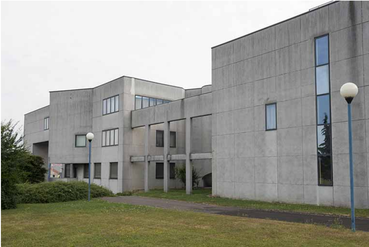
Détail au nord de la façade sud-ouest.

70, Vesoul, 1 rue Jean Georges Girard, lieudit : le grand Miselot