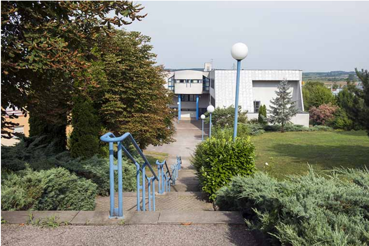
Escalier desservant les façades sud-est du lycée et les façades antérieures est des logements.

70, Vesoul, 1 rue Jean Georges Girard, lieudit : le grand Miselot