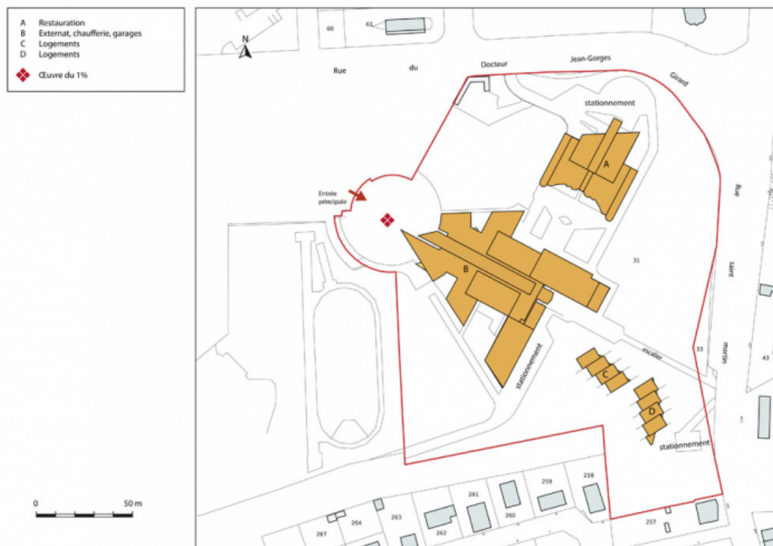
Plan-masse et de situation. Extrait du plan cadastral numérisé, section BX, échelle 1:1000.

70, Vesoul, 1 rue Jean Georges Girard, lieudit : le grand Miselot