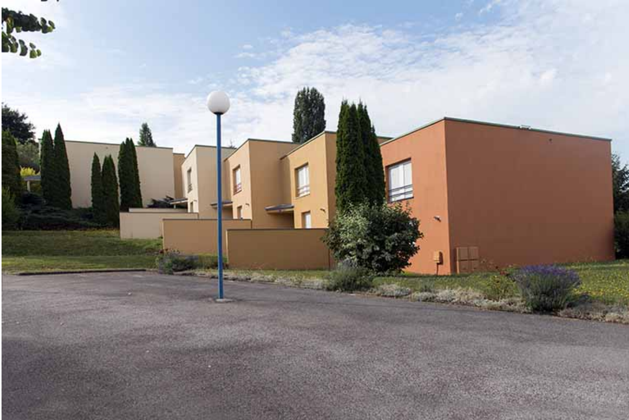
Façade antérieure nord-est des logements.

70, Vesoul, 1 rue Jean Georges Girard, lieudit : le grand Miselot