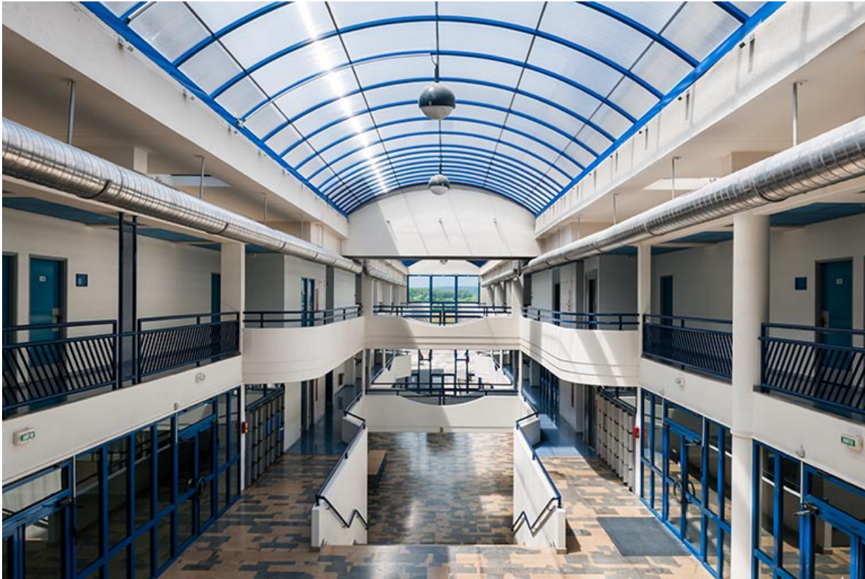
Vue intérieure vers le nord-ouest.

70, Vesoul, 1 rue Jean Georges Girard, lieudit : le grand Miselot