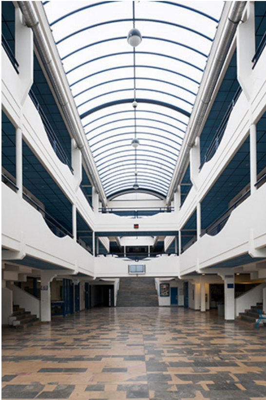
Vue intérieure vers le sud-est.

70, Vesoul, 1 rue Jean Georges Girard, lieudit : le grand Miselot