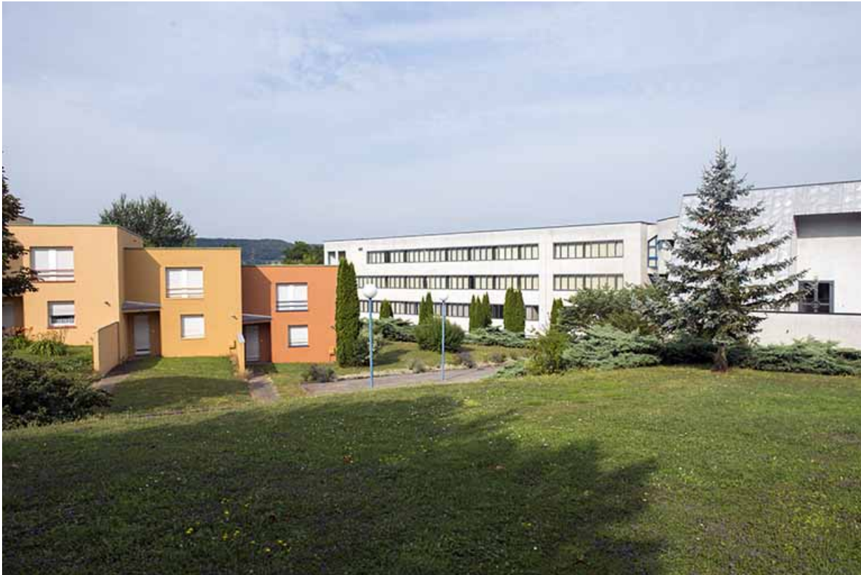
Façades antérieures est des logements et façade postérieure sud-est du lycée.

70, Vesoul, 1 rue Jean Georges Girard, lieudit : le grand Miselot