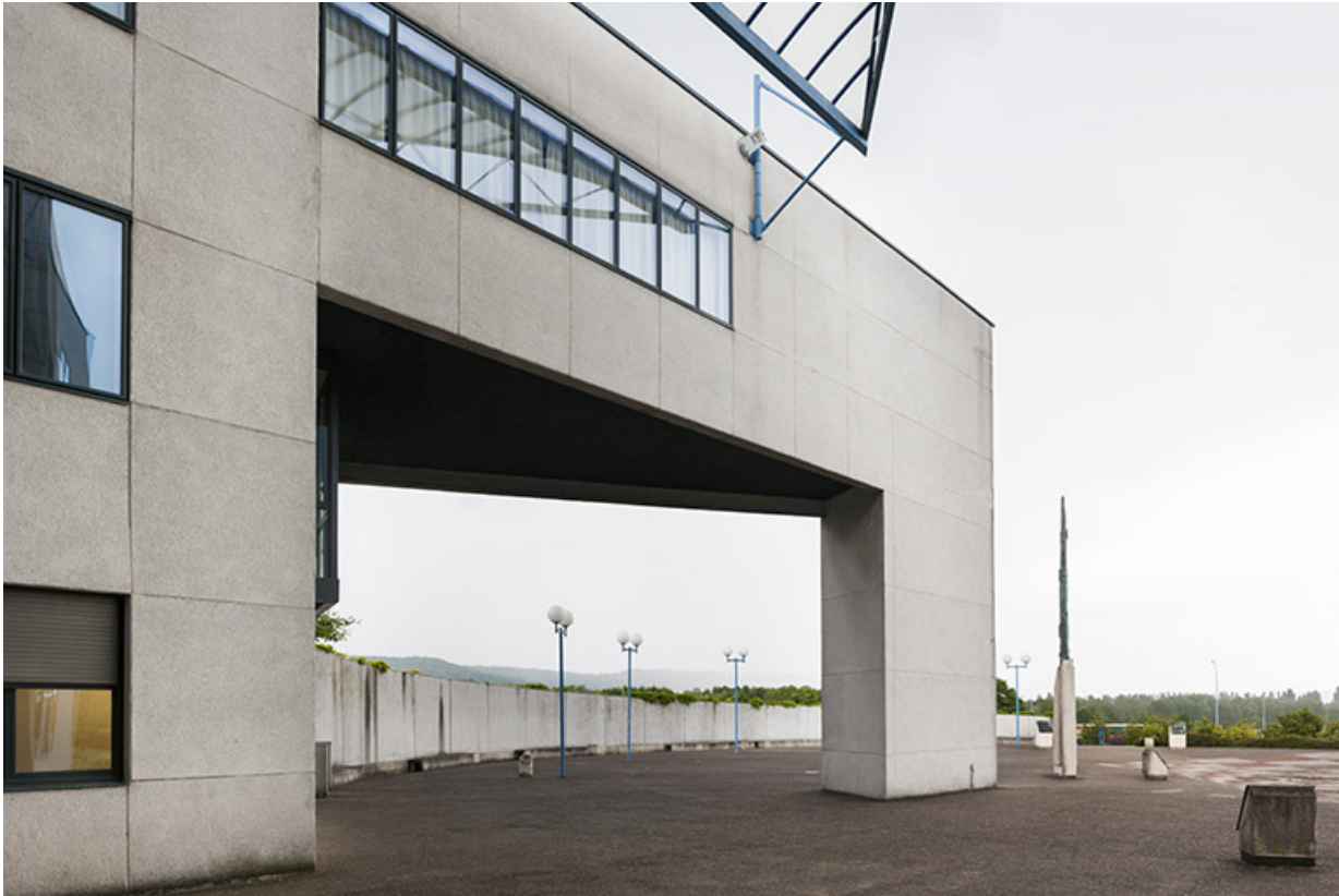
Vue sur la place parvis et son horloge solaire depuis l'entrée.

70, Vesoul, 1 rue Jean Georges Girard, lieudit : le grand Miselot