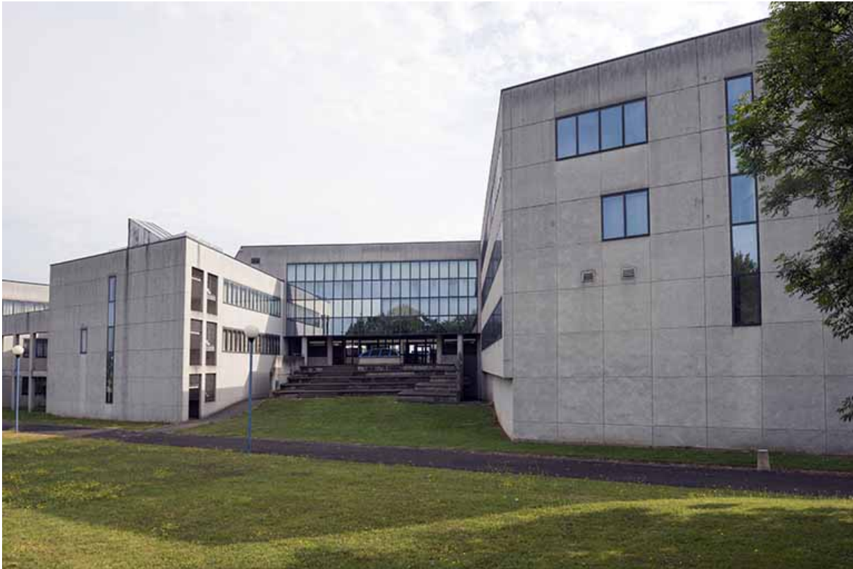
Détail d'un préau de la façade sud.

70, Vesoul, 1 rue Jean Georges Girard, lieudit : le grand Miselot