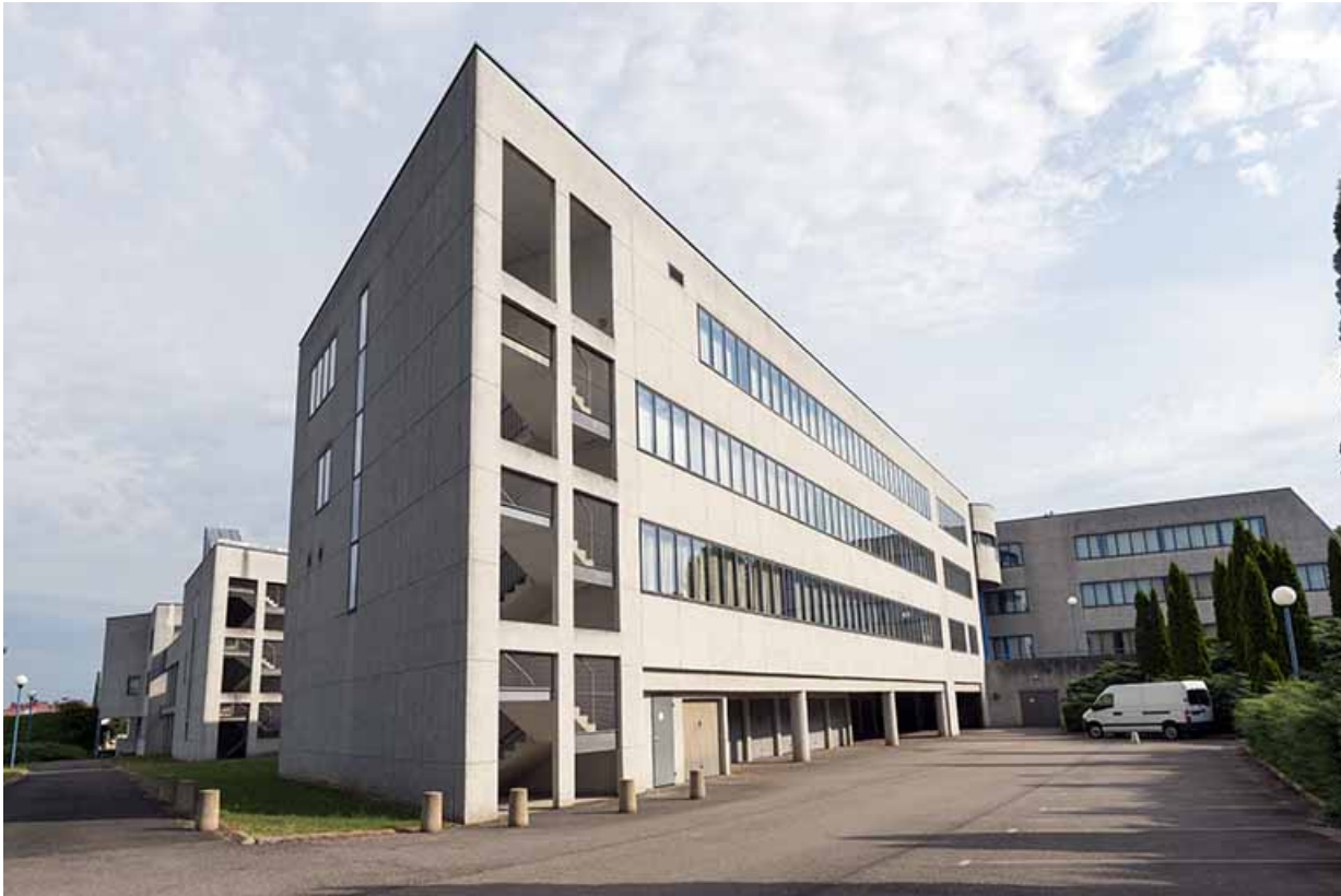
Angle sud, façades sud-est et sud-ouest

70, Vesoul, 1 rue Jean Georges Girard, lieudit : le grand Miselot