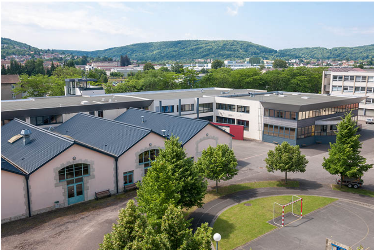
Sud-ouest de la cour et façades nord intérieure des ateliers.