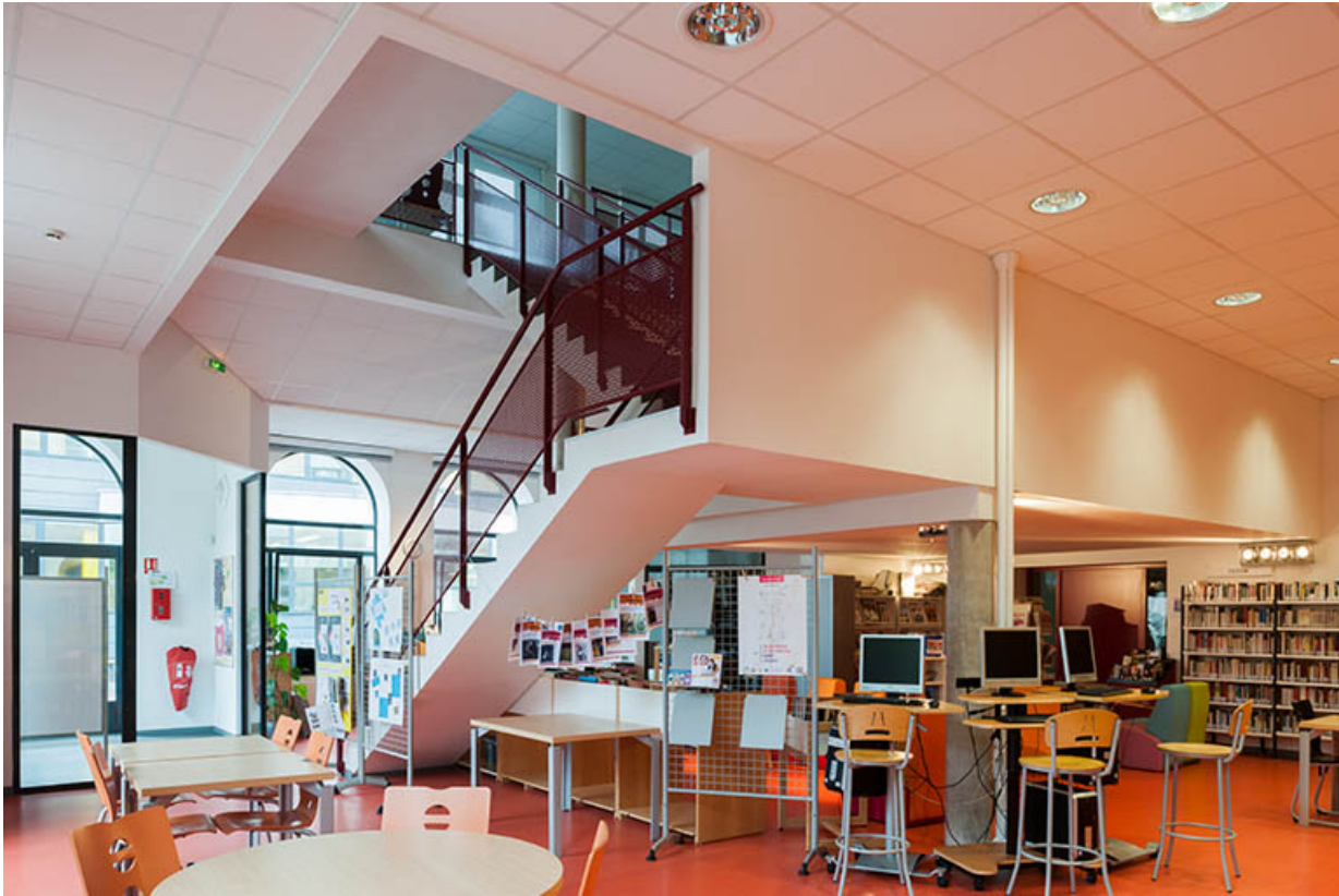
Dans le centre de documentation et d'information.