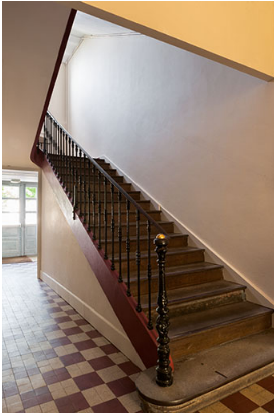
Escalier de l'administration-internat.