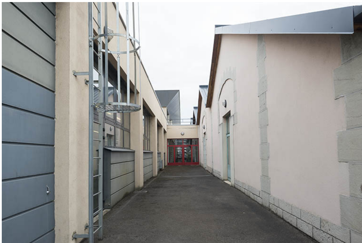
Entre l'atelier structure métallique et plasturgie.