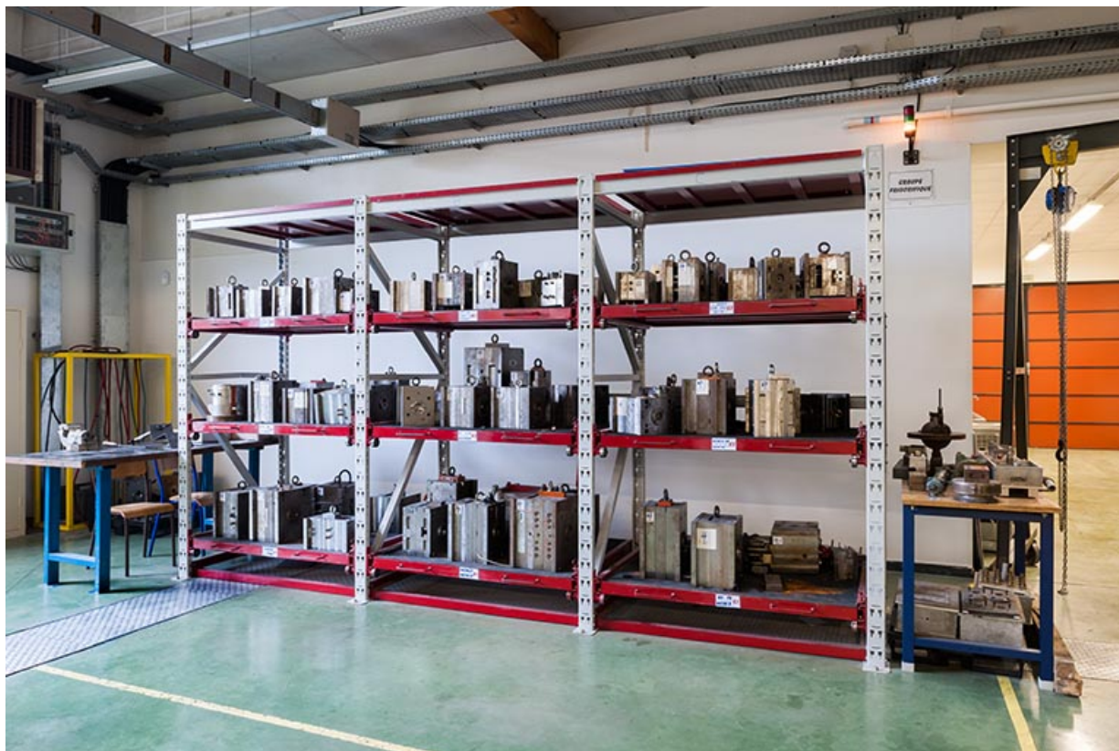
Moules dans l'atelier d'injection plastique.