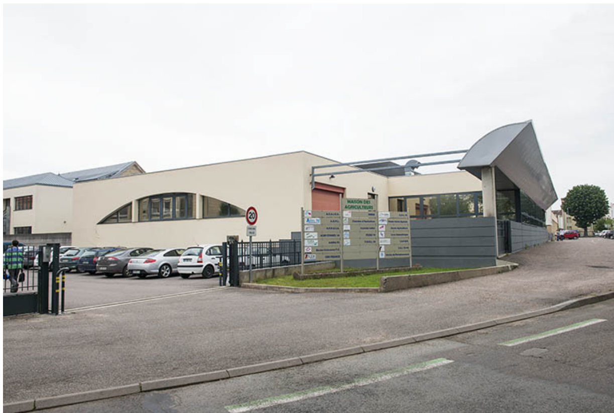
Angle sud-ouest, façade d'entrée sur le quai Barbier.