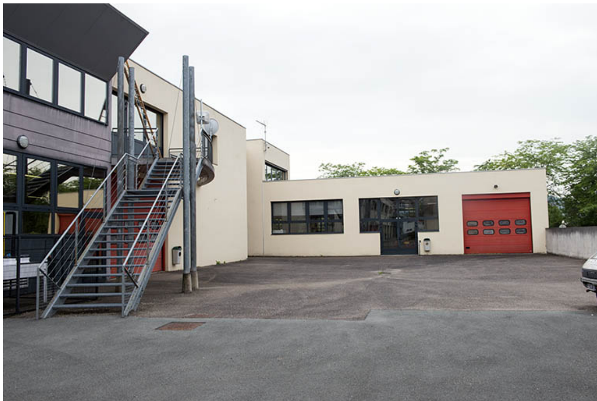
Façade intérieure de l'aile ouest de l'atelier froid et climatisation domotique.