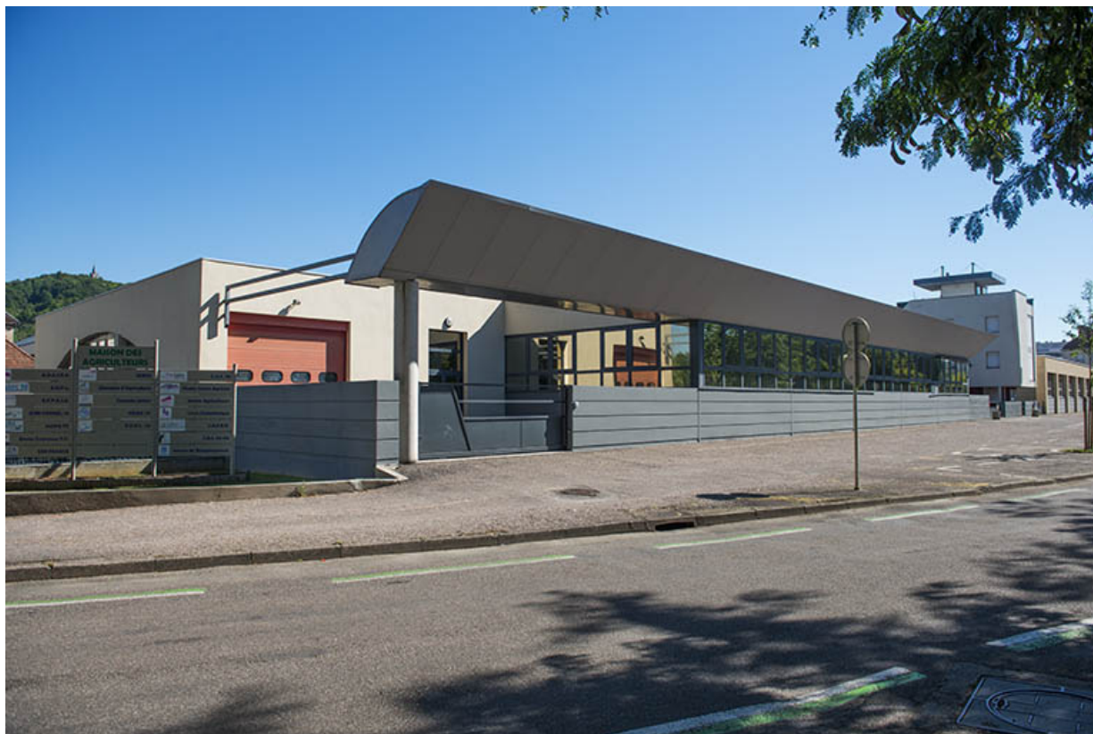
Angle sud-ouest, façade d'entrée sur le quai Barbier.