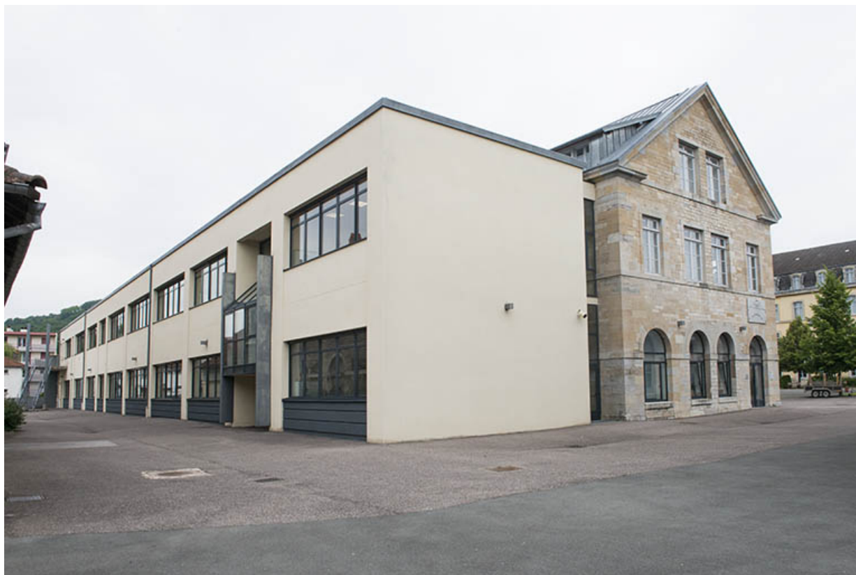
Pignons sud des deux parties de l'externat.