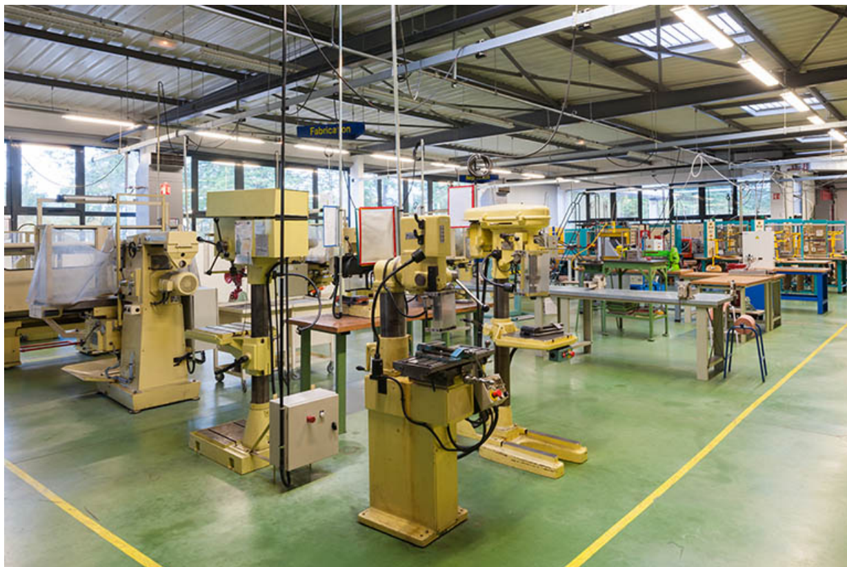
Dans l'atelier de fabrication et réparation.