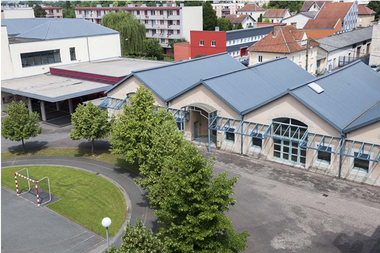
Nord-ouest de la cour et façade sud intérieure de la cantine.