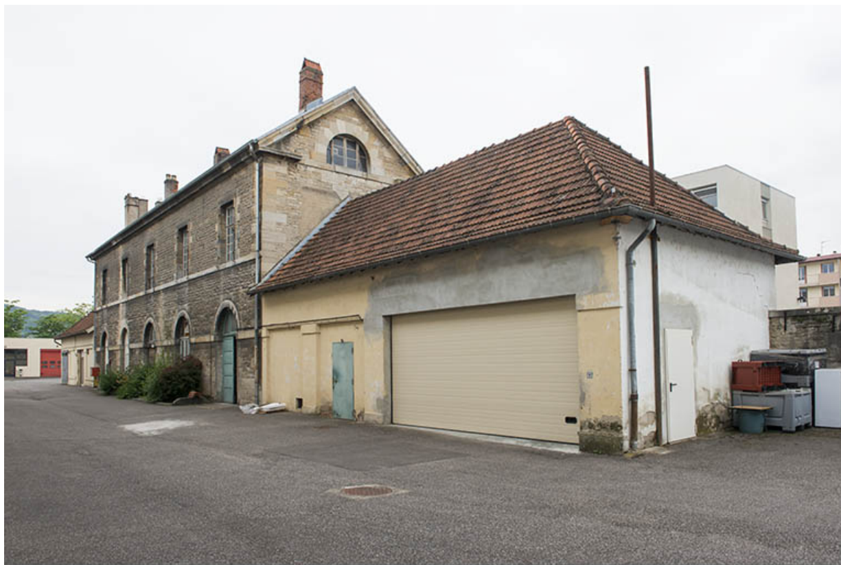
Angle nord-est de l'atelier des agents.