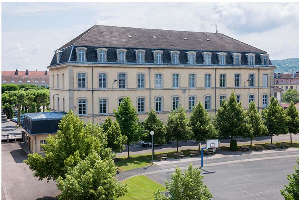
Façade ouest sur cour de l'administration-internat.