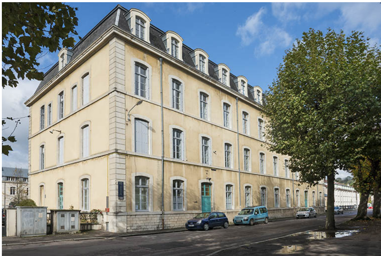
Angle sud-est de l'administration-internat donnant sur la place du 11ème chasseur.