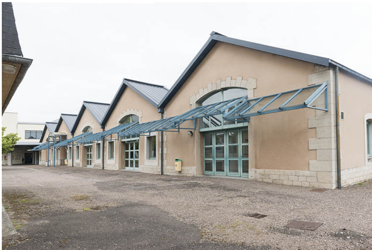
Façade sur cour de la cantine.