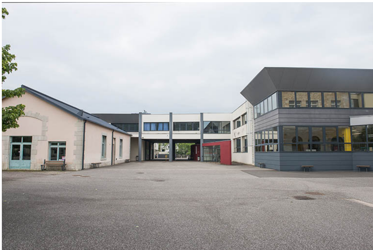
Façade postérieure de l'entrée, ateliers.