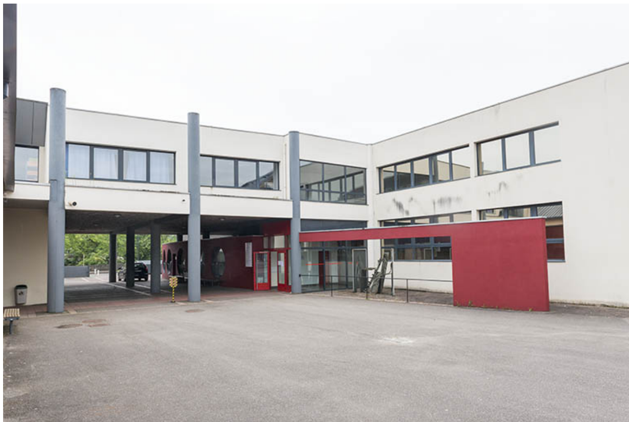
Détail de la façade postérieure de l'entrée, ateliers.