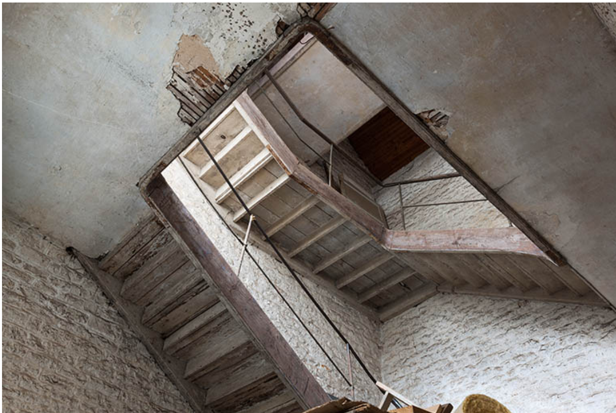
Escalier dans l'atelier des agents.