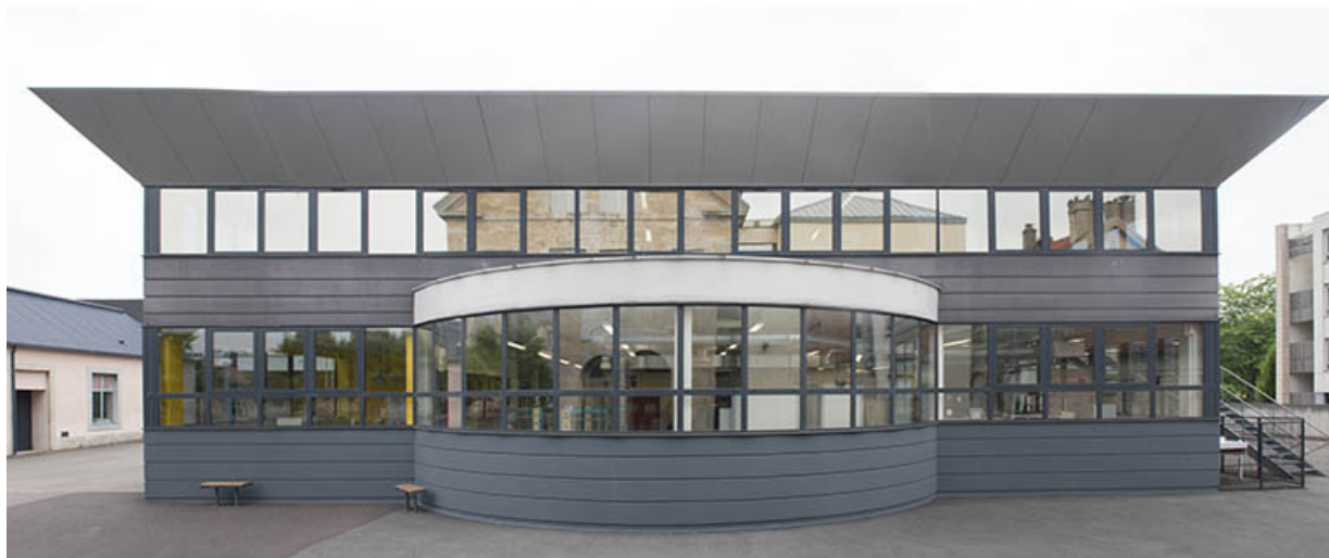
Façade sur cour de l'atelier froid et climatisation domotique.