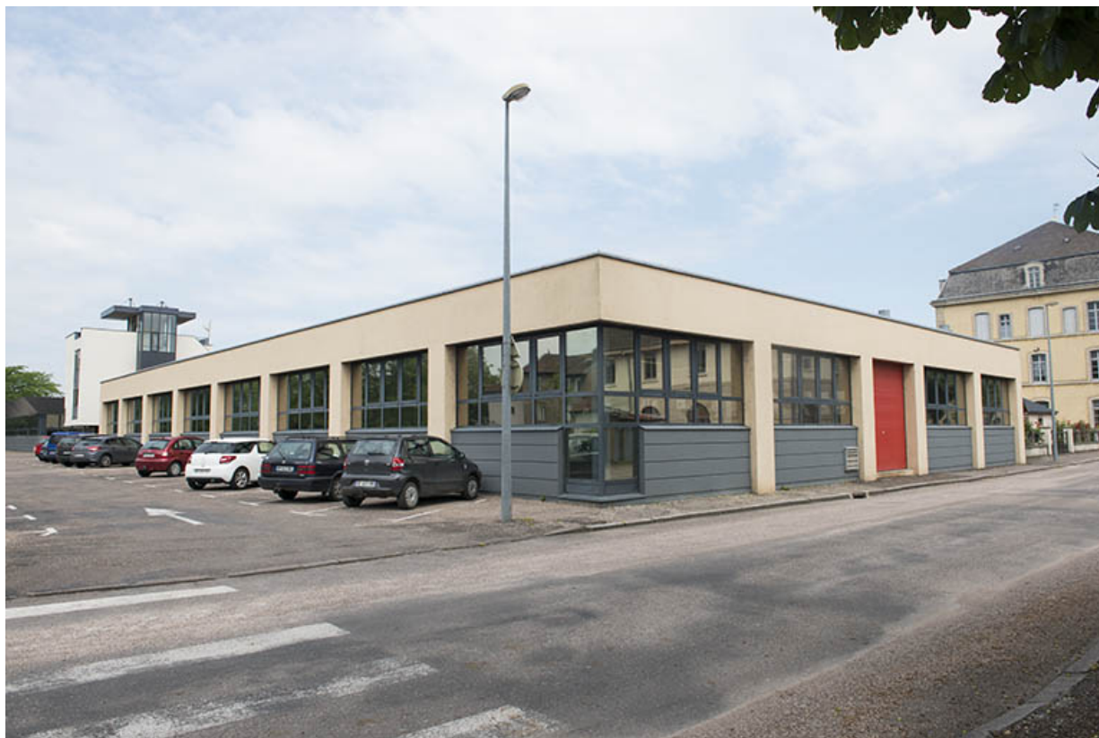
Angle sud-est sur rue des ateliers de structure métallique.