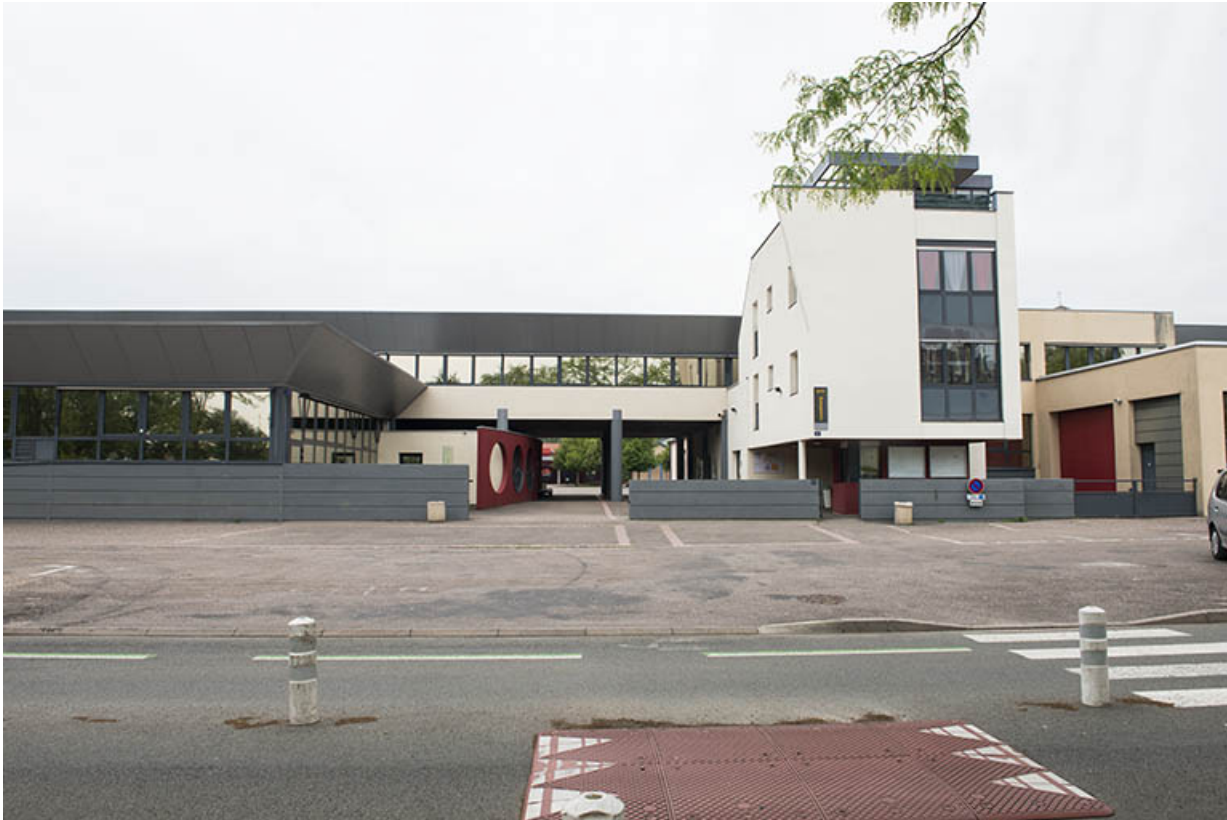
Façade sud, entrée sur le quai Barbier.