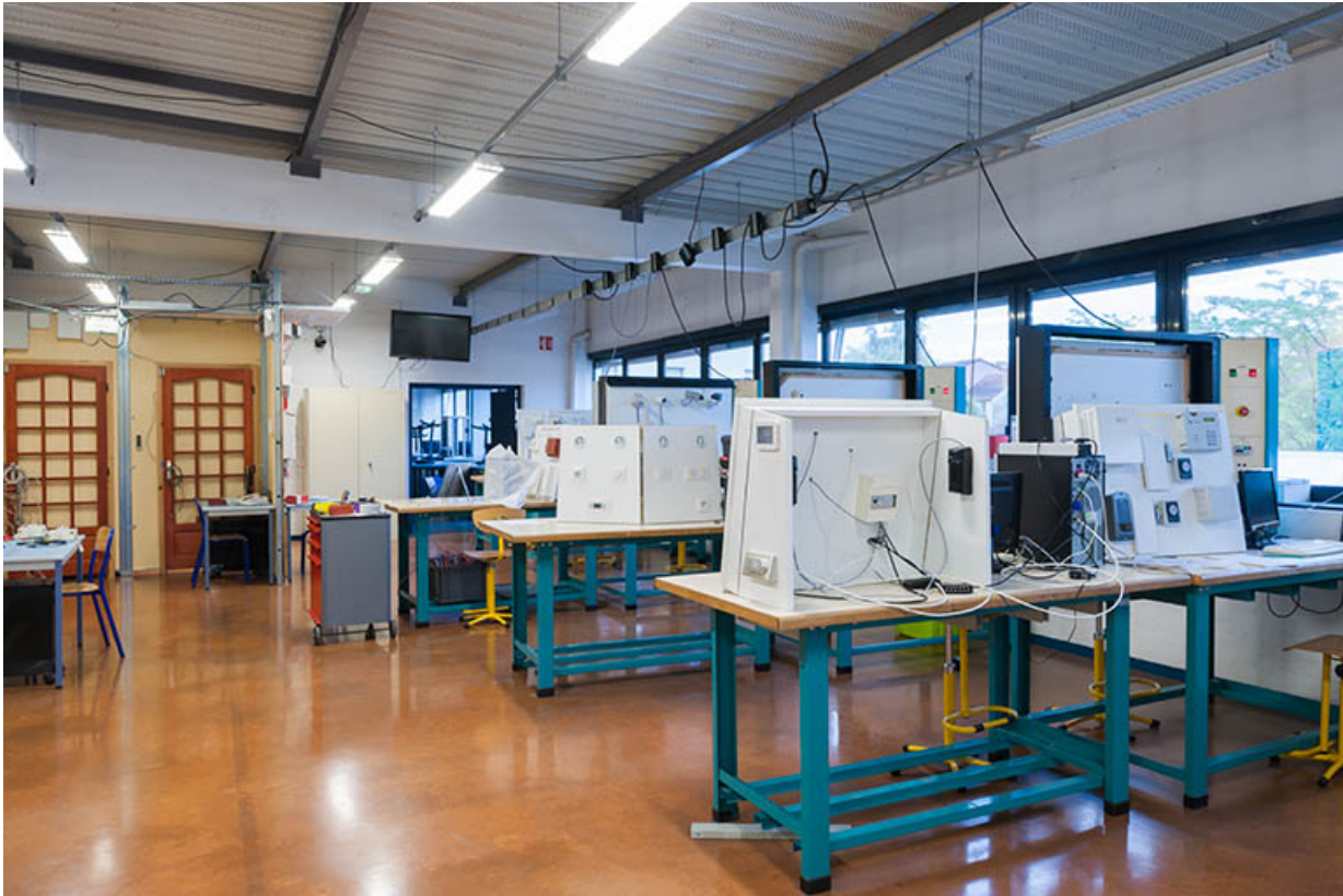
Dans l'atelier froid, climatisation et domotique.