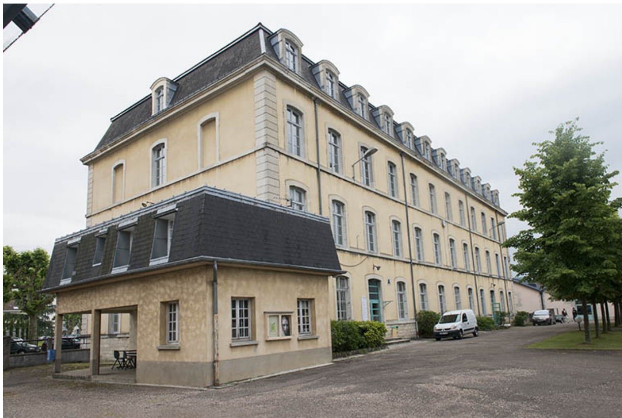
Pignon nord-ouest de l'administration-internat.