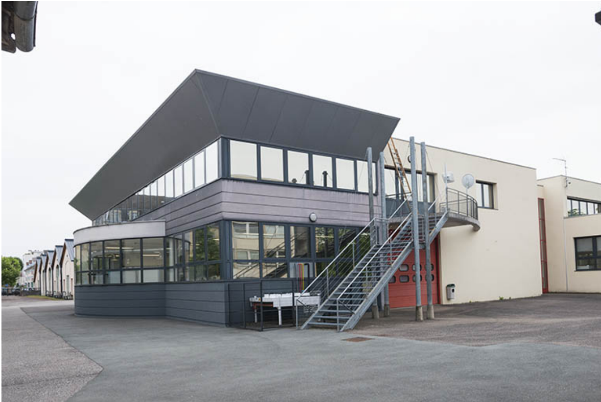
Façade intérieure ouest de l'atelier froid et climatisation domotique.