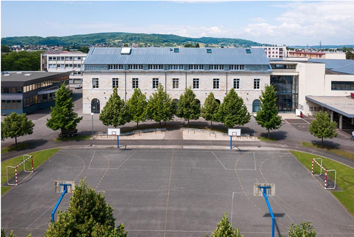
Cour, stade et façade est de l'externat.