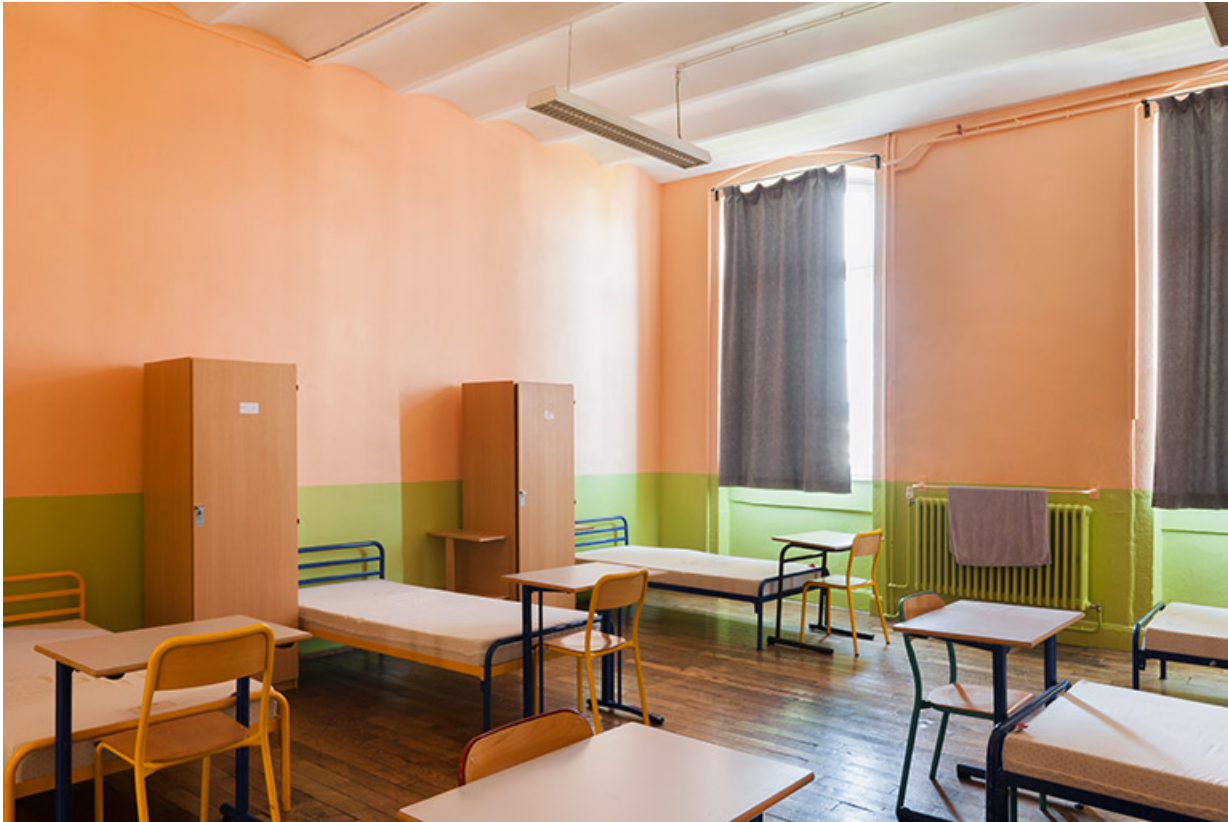
Chambre de l'internat.