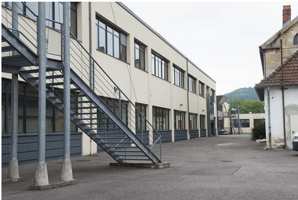
Façade ouest de l'externat.