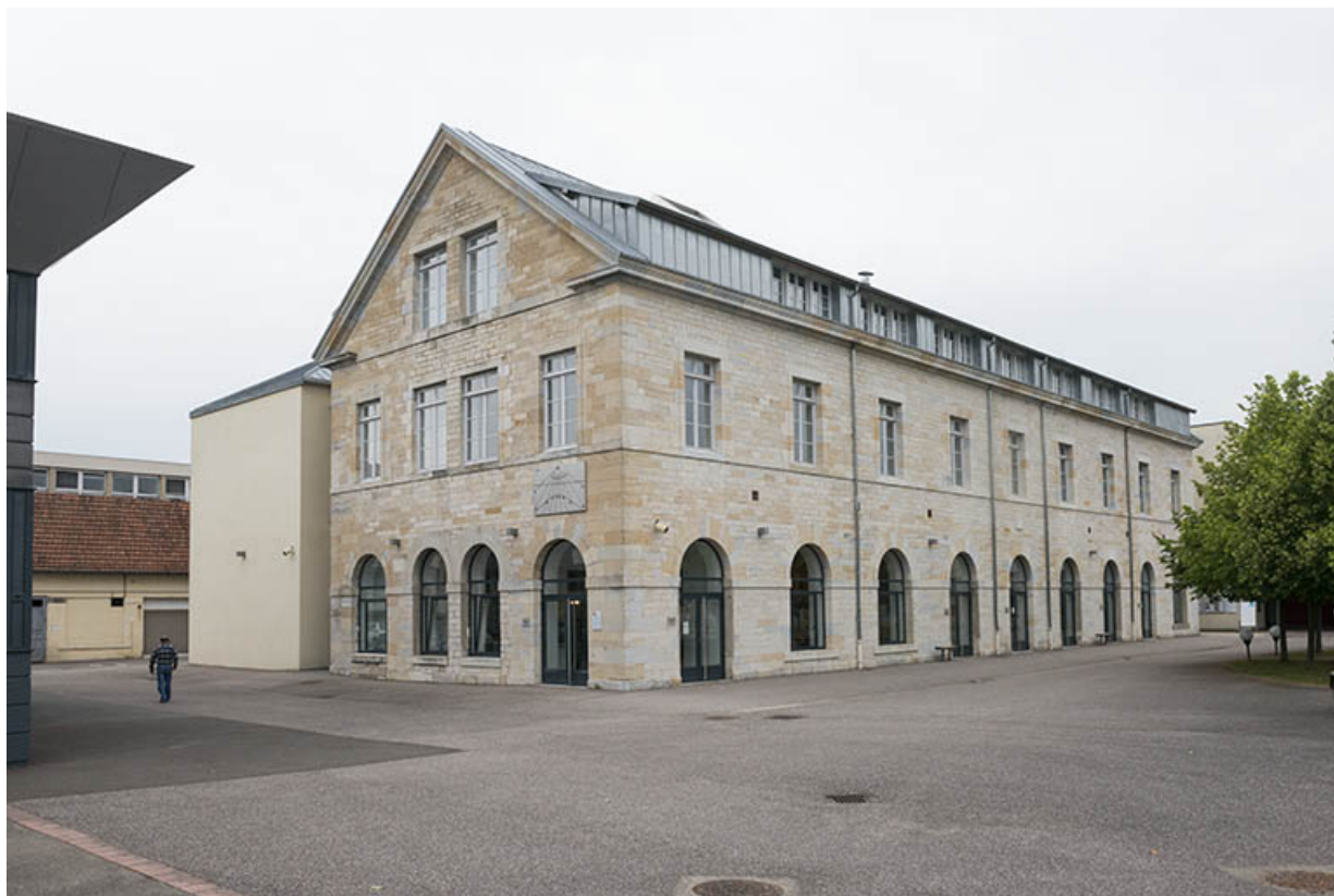
Angle sud-est de l'externat.