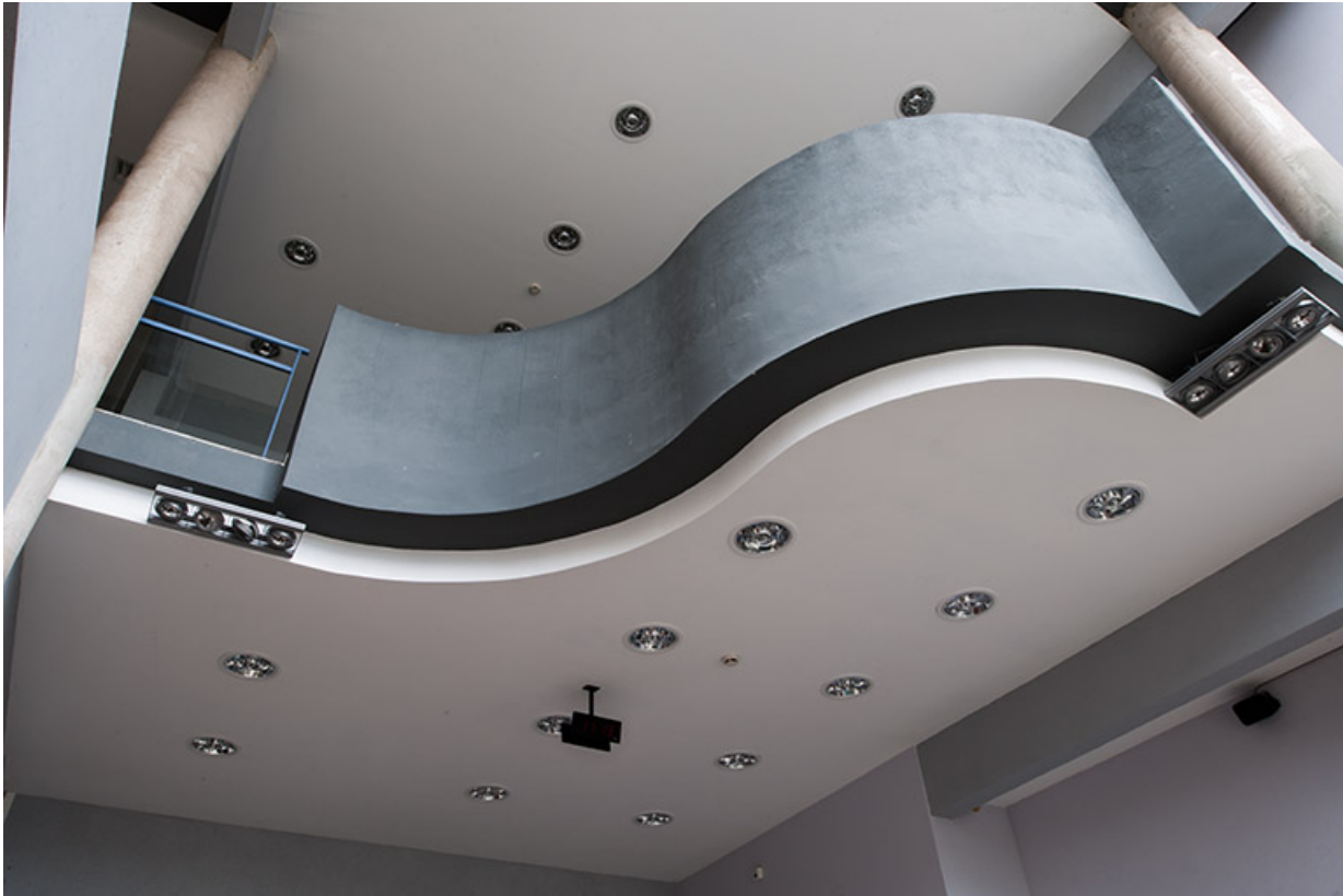
Vue intérieure de l'escalier de l'externat.