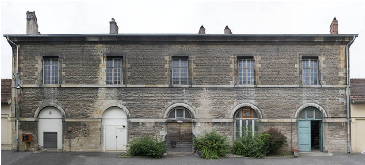
Façade antérieure de l'atelier des agents.