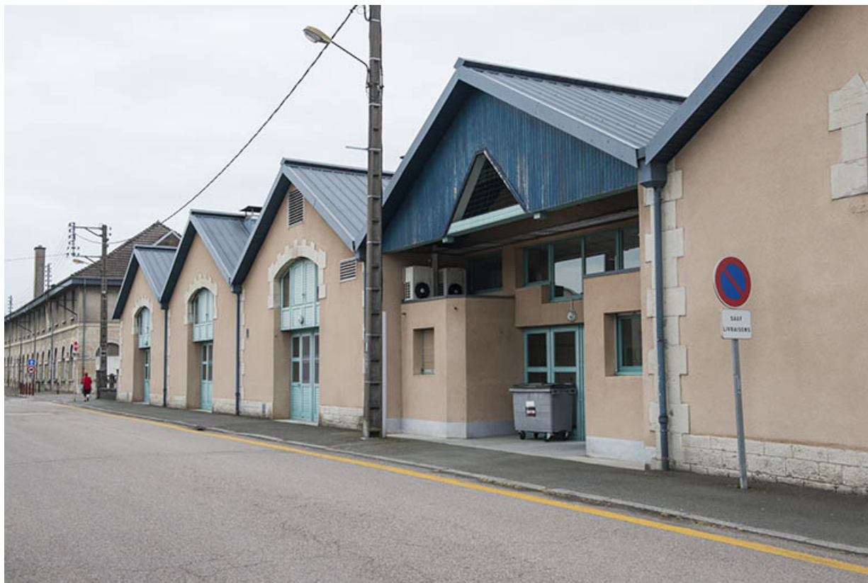
Façade nord de la cantine.