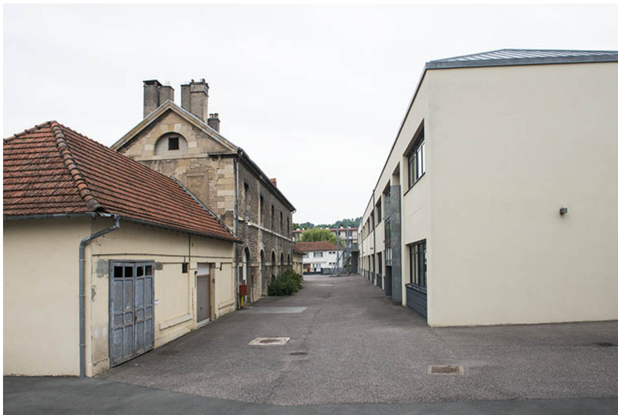
Pignons sud de l'atelier des agents, à l'ouest et de l'externat, à l'est.