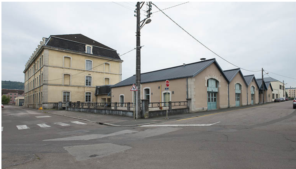
Angle nord-est sur rue, pignon est de l'administration-internat.