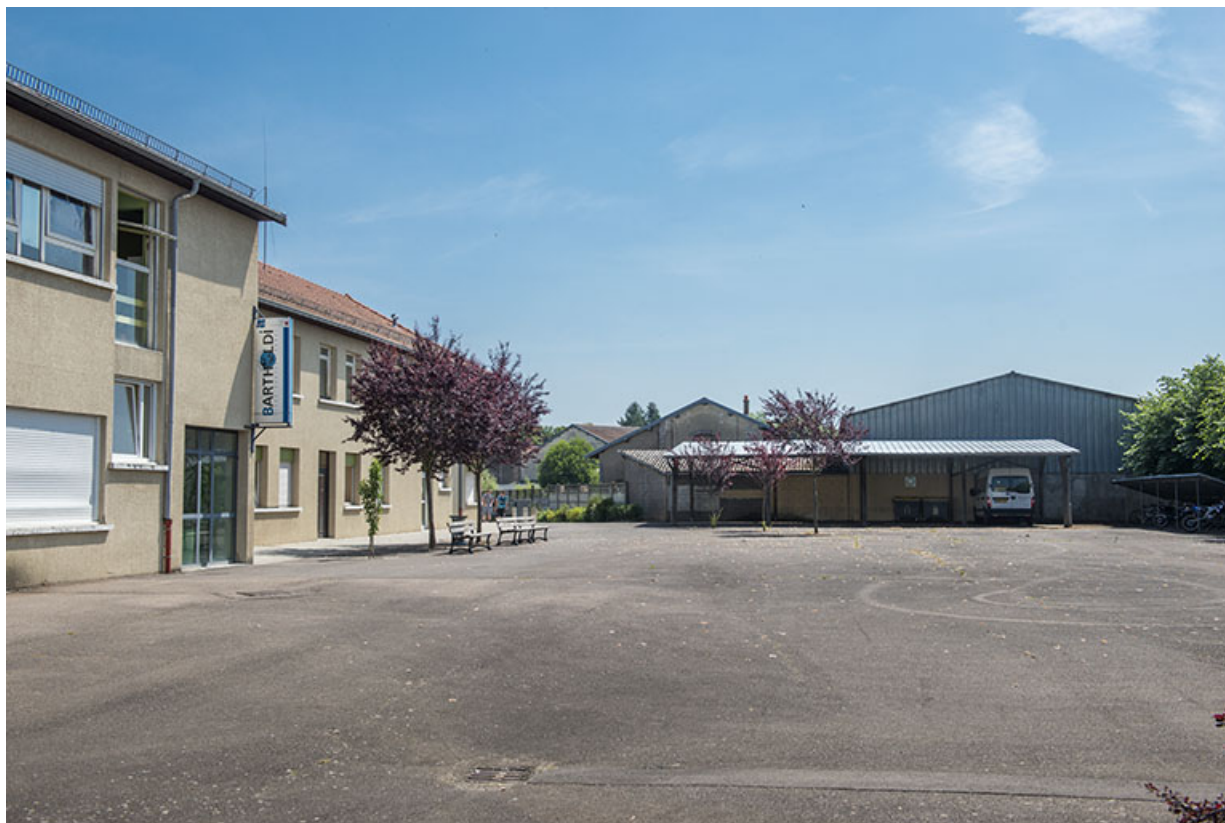
Partie est de la cour.