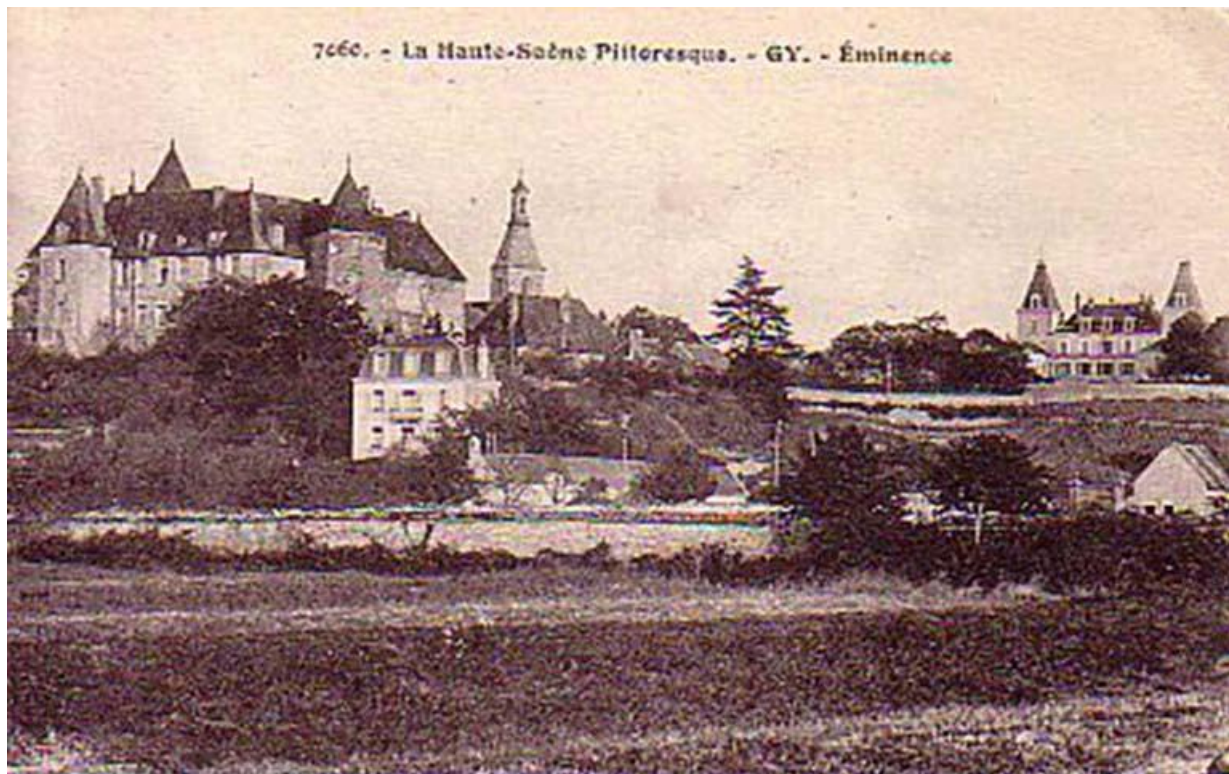
Vue générale du château sur une carte postale ancienne 70, Gy