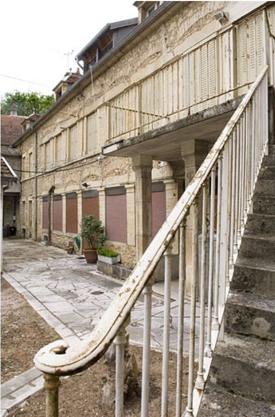
Façade antérieure du logement (atelier de fabrication primitif ?).