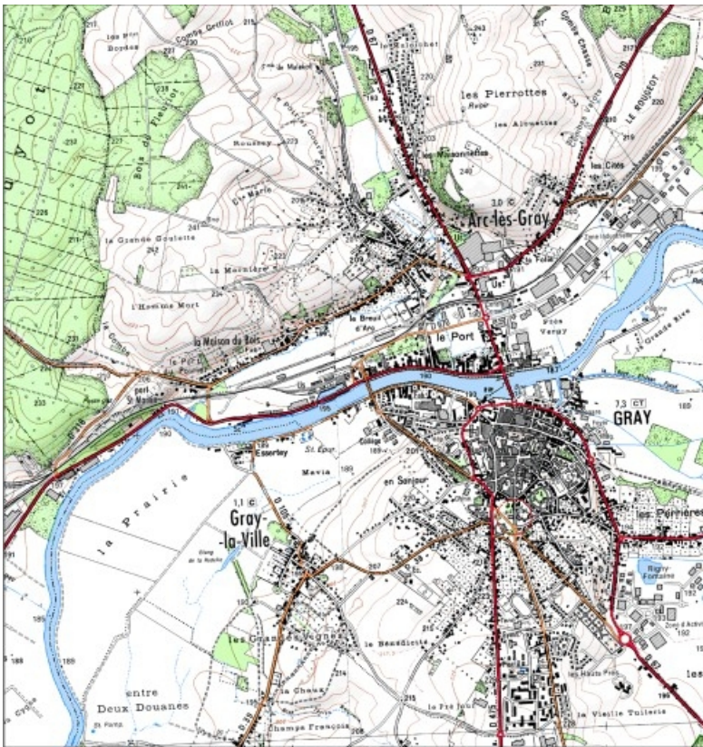
Carte de localisation. Carte topographique au 1:25000, I.G.N., Gray, 3222 E. SCAN 25 70, Gray, 28 rue Victor Hugo