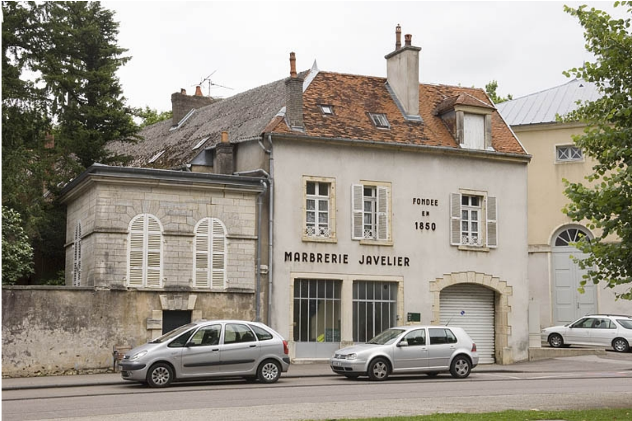
Vue d'ensemble depuis la rue Revon.