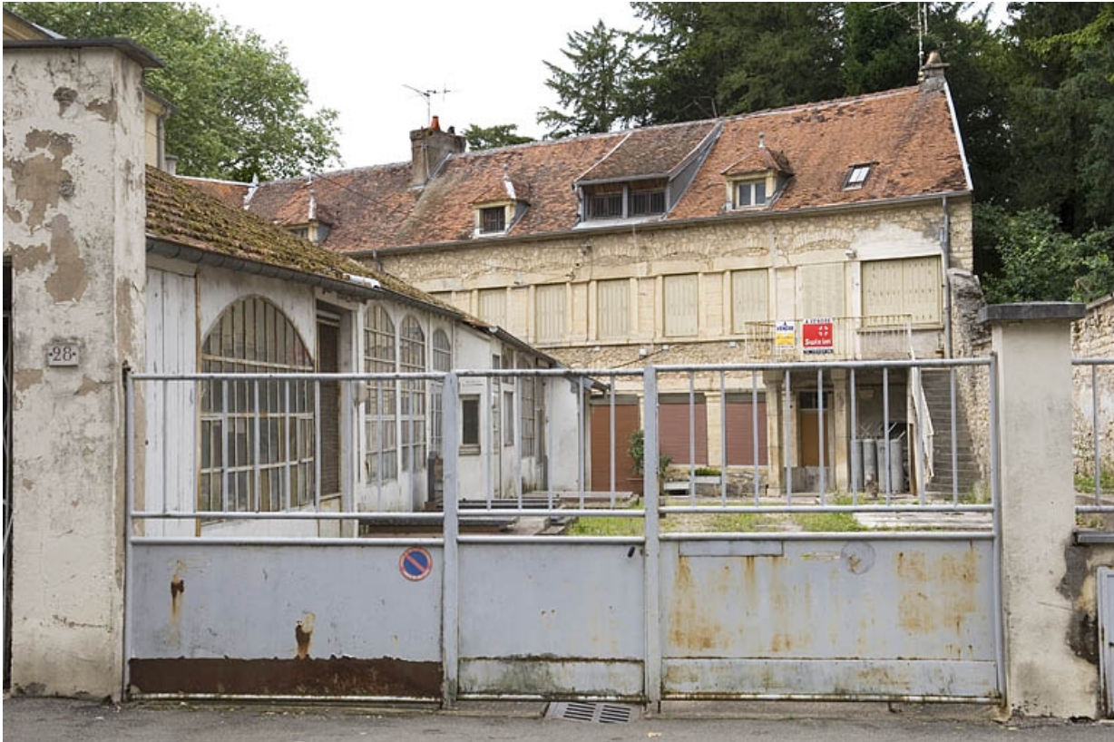
Vue d'ensemble depuis la rue Victor Hugo.