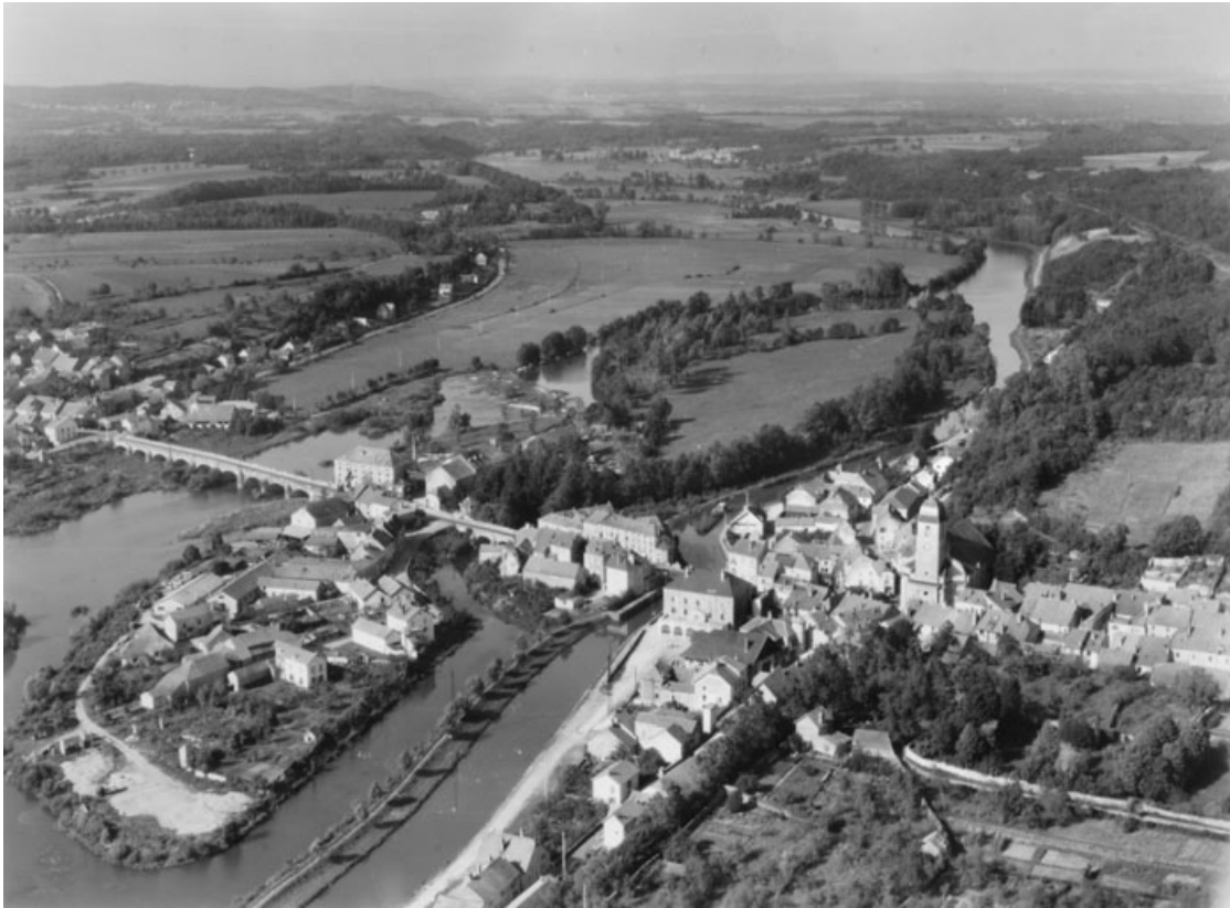
Vue aérienne depuis le sud-est.

70, Port-sur-Saône, 33, 35 rue de la Rezelle